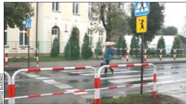
GDDKiA zareagowała błyskawicznie i już w najbardziej niebezpiecznych miejscach przy przejściach dla pieszych pojawiły się specjalne „plotki”. To dobrze rokuje na przyszłość

Czyniąc to, myśli jeszcze o pasach wibracyjnych malowanych przed niebezpiecznymi przejściami dla pieszych. Ich zadaniem jest informowanie kierowców o tym,