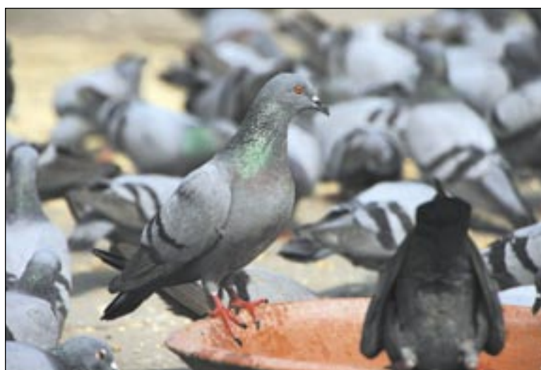
U jednych wzbudzają uśmiech i sympatię, dla innych są koszmarem.