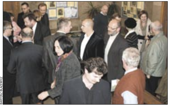
Po prezentacji były tradycyjne dyskusje przy lampce wina.