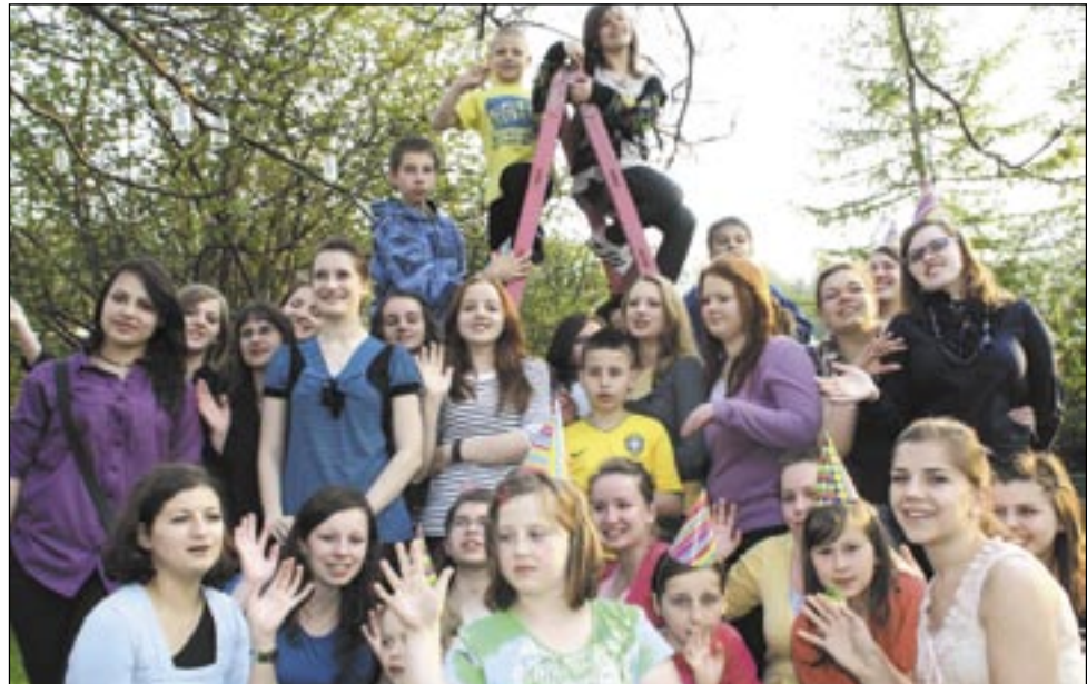
Absolwenci sanockiej AKADEMII PRZYSZŁOŚCI na zakończeniu ubiegłego roku

Z roku na rok AKADEMIA PRZYSZŁOŚCI potrzebuje coraz więcej wolontariuszy do pracy z dziećmi mającymi problemy w szkole i przez to nie wierzącymi w siebie. – Dzieci, które źle się uczą,