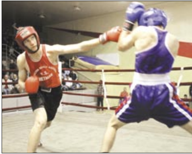
Kibice boksu obejrzeni sporo ciekawych i emocjonujących walk.

BOKS. III Turniej o Puchar Sanoka. Młoda impreza, a już można napisać, że „tradycyjnie” wzbudziła wielkie zainteresowanie, trybuny były pełne. Pięściarze Ringu MOSiR zrewanżowali się kibicom, wygrywając niemal wszystkie walki.