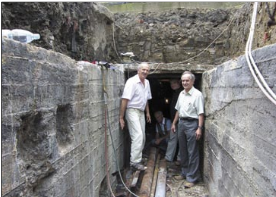
Spółdzielcom z Posady niestraszne nawet „górnice roboty” pod ziemią. Na zdjęciu – przebudowa magistrali pod torami.

Spółdzielnia z Posady, jako jedna z nielicznych w regionie, posiada własną sieć przesyłową ciepła, odziedziczoną po Autosanie. Dzięki temu ma wpływ na efektywność przetwarzania ciepła (przejście z wysokich parametrów producenta na niskie, dopuszczalne w mieszkaniach) oraz ograniczenie strat na przesyśle, poprzez dbałość o odpowiednią izolację rur i urządzeń. To z kolei przekłada na niższe koszty. – Kiedy trzy lata temu „Stomil” podniósł cenę ciepła o 40 procent, mieszkańcy naszych osiedli zapłacili tylko o 26 procent więcej – tłumaczy prezes