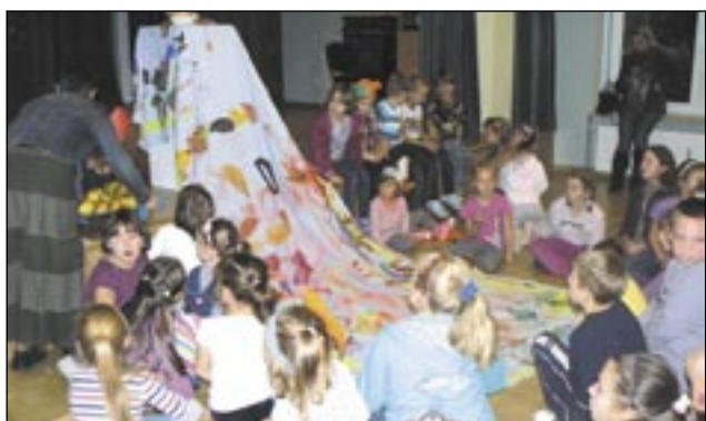
Suknia Pani Jesieni udała się nad podziw.

Wyjątkowo gwarno i radośnie było w ODK „Puchatek” w ubiegłą środę. Przyczynkiem ku temu stała się impreza dla dzieci „jesienne inspiracje”, w której wzięli udział podopieczni z wszystkich kół zainteresowań oraz mieszkańcy osiedla.