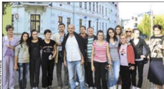
Najpierw było międzynarodowe spotkanie młodzieży w Medzilaborcach, po czym Serbowie i Słowacy przyjechali z odwiedzinami do Sanoka. Nie obyło się bez pamiątkowego zdjęcia na sanockim Rynku.

Na zakończenie wizyty gospodarze otrzymali zaproszenie do odwiedzenia Serbii. Wizyta miała by charakter głównie sportowy, a impreza zaplanowana została na koniec maja 2012 roku. Zaproszenie zostało przyjęte. emes