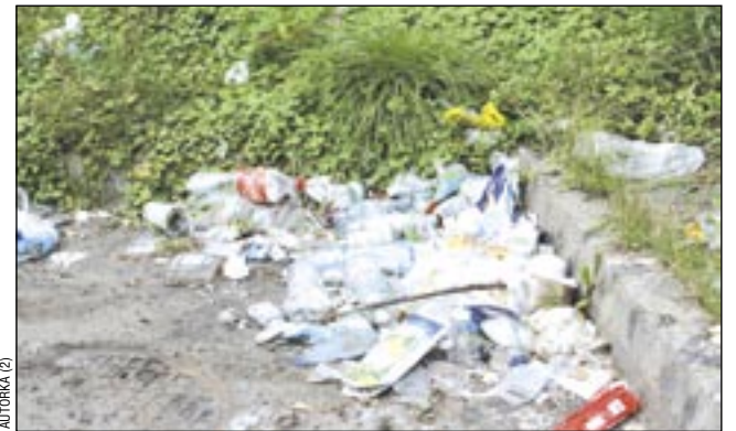
Latem stosów śmieci na Okęciu nie była w stanie zakryć nawet bujna zieleń.