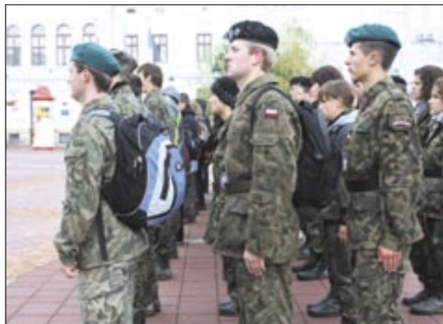
Ich rodziców uczono, że Żubryd był bandytą...

drzejem Romaniakiem z Muzeum Historycznego, który przypomniał okoliczności egzekucji wykonanej przez sanockich komunistów w maju 1946 roku na kilku członkach Samodzielnego Batalionu Operacyjnego Narodowych Sił Zbrojnych „Zuch”. Uczestnicy rajdu zapalili znicze na mogiłach ofiar, zwiedzili też miasto, po którym oprowadzili ich rodzimi strzelcy. /jot/