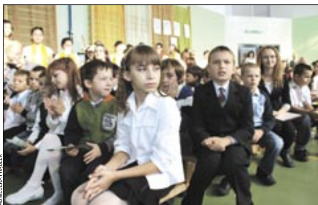
Rodzice tych dzieci nie mieli tak pięknej szkoły i musieli „tułać się po mieście”.