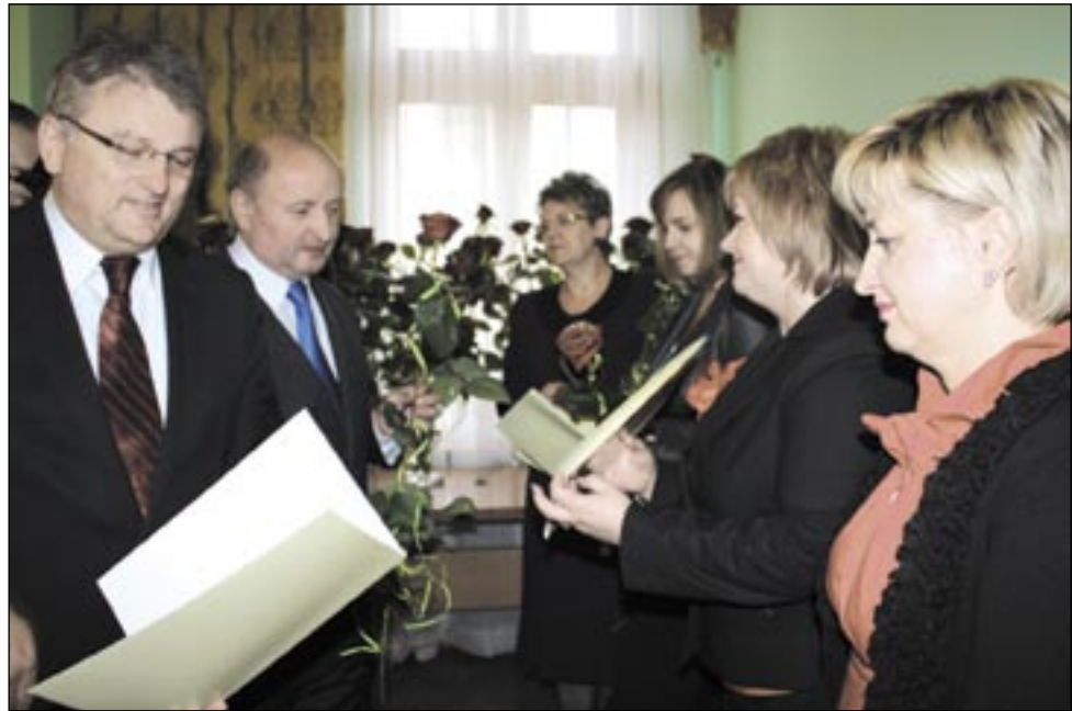
Sanoccy władze nigdy sami odbierali nauczycielskie nagrody, dziś wręczają je innym.

Przypadający na 14 października Dzień Edukacji Narodowej to święto wszystkich pracowników oświaty. Szkolną działalność cieszy z racji akademii i skróconych lekcji, dla nauczycieli jest okazją do przyjęcia wyrazów uznania, kwiatów, podziękowań i nagród. Tymi ostatnimi wyróżniono w tym roku wyjątkowo liczne grono pedagogów.