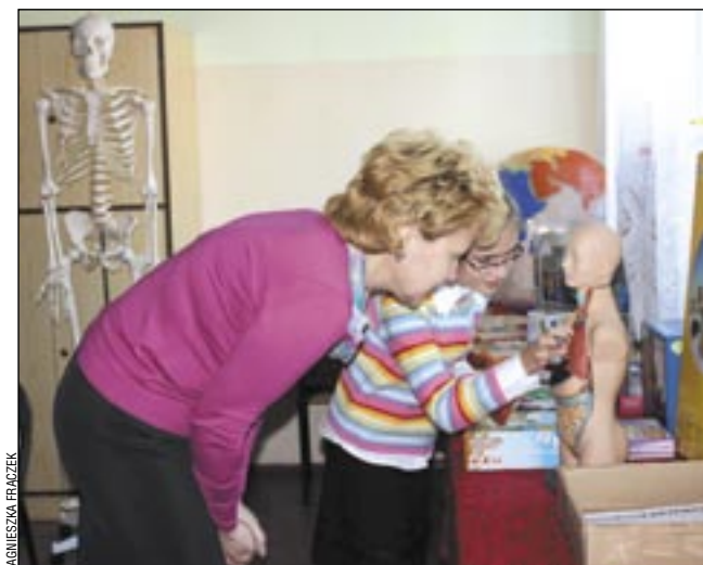
Ciekawe pomoce i metody na pewno staną się inspiracją dla nauczycieli i uczniów.

Przedsięwzięcie jest w pełni finansowane ze funduszy Programu Operacyjnego Kapitał Ludzki. Na jego realizację Wydział Edukacji i Kultury Fizycznej Urzędu Miasta pozyskał 490.300 zł. (z)