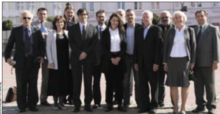
Rodzinne zdjęcie zespołu realizującego ambitny projekt „Alpy Karpatom”. Wykonano go 10 października 2011 r. w Sanoku w dniu podpisania umowy między Fundacją Karpacką – Polska, a Władzą Wdrażającą Programy Europejskie.

do mikro i małych przedsiębiorstw pragnących wdrożyć w gospodarce regionu dobre praktyki szwajcarskie. Na dofinansowanie mogą liczyć także organizacje pozarządowe. – Ustalono, że maksymal-