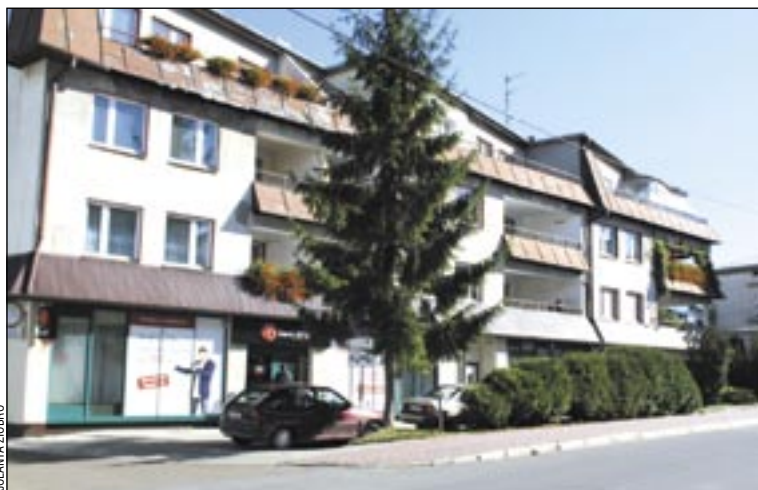
Władze Spółdzielni „Nasz Dom” liczą, że znajdą się chętni na nowe mieszkania przy ulicy Zamkowej.