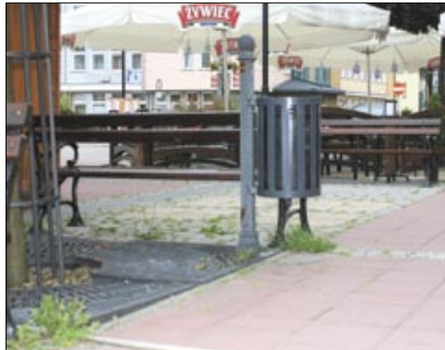
Zielisko rośnie nawet w tak reprezentacyjnych miejscach, jak Rynek.