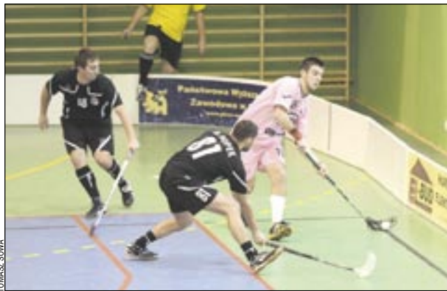
W fazie zasadniczej Unihok Team zdobył najwięcej punktów ze wszystkich drużyn I ligi.

Porażka z poprzedniego dnia wprowadziła niepokój – gdyby rewanż krakowianie wygrali odpowiednio wysoko, mogliby zepchnąć nas z 1. miejsca, do czego nie wolno było dopuścić. Dlatego też nasi zawodnicy podwójnie zmobilizowani przystąpili do meczu. Grę ustawili sobie już po pierwszej ter-