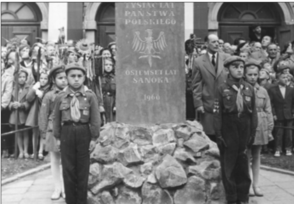
Odświeżenie Kamienia Tysiąclecia przy ulicy Grzegorza w kwietniu 1960 roku.

W zamyśle pomysłodawcy cykl prezentować ma archiwalne zdjęcia z muzealnych zbiorów, gromadzonych od czasu powstania Muzeum Ziemi Sanockiej w 1934 roku. – Jak wiadomo, fotografia jest jednym z ważniejszych źródeł historycznych, które dokumentuje w sposób „niepodważalny” rzeczywistość i zwiększa atrakcyjność przekazu słownego – zauważa Andrzej Romaniak.