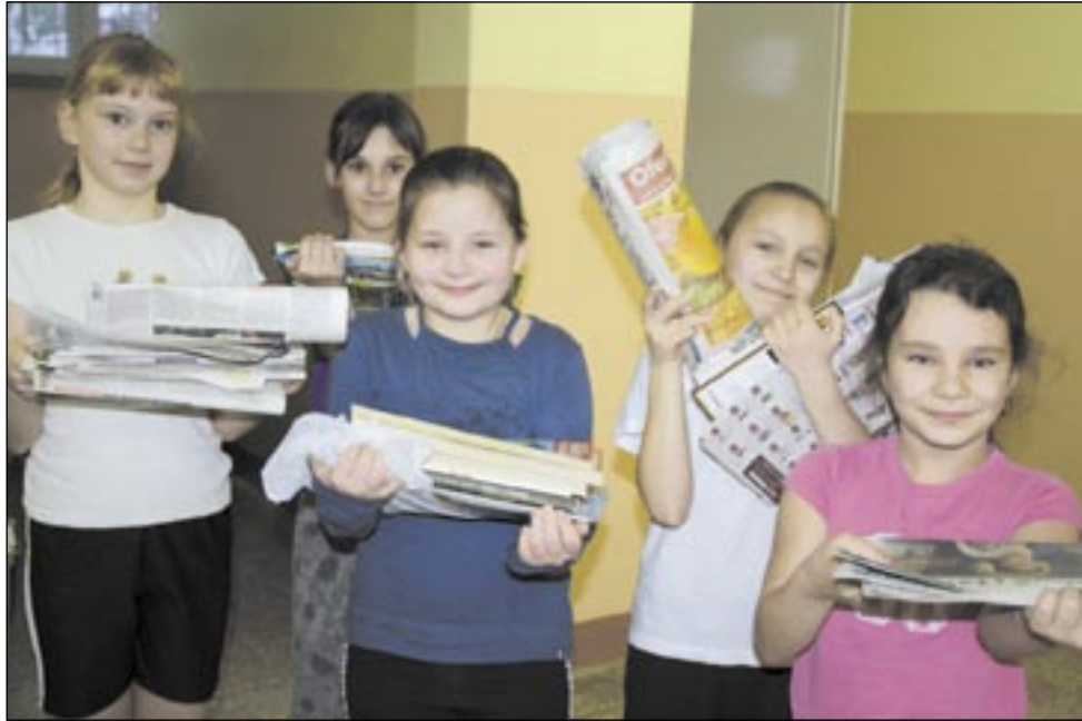
Dzieci z SP 3 z entuzjazmem włączyły się do akcji „Makulatura na misje”, której celem jest budowa studni głębinowych w Południowym Sudanie.

Dorośli z Posady oraz dzieci ze Szkoły Podstawowej nr 3 i Gimnazjum nr 2 pomagają w budowie studni w Południowym Sudanie (wschodnia Afryka). Robią to w bardzo prosty sposób: zbierając makulaturę.