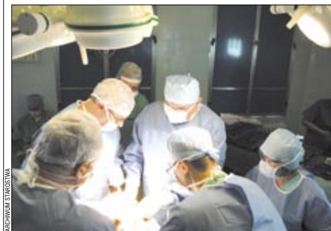
Nie jeden szpital powiatowy może nam zazdrościć...