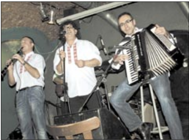
CICKO BAND, czyli folklor po macedońsku.

w szwach, ale każdy potrafił docenić „swojski” klimat. Połączenie brzmień fletu i akordeonu, ale też bardziej „lokalnych” instrumentów, wprawiało w ruch nogi – zarówno tych stojących, jak i skupionych przy stolikach. Koncert trwał ponad 1,5 godziny. (kd)