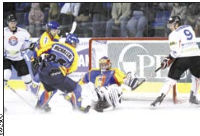
Mecz z Podhalem rozstrzygnął się w ostatnich sekundach.