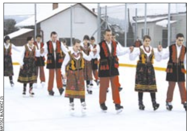
Podczas otwarcia „Białego Orlika” był nawet polonez na lodzie.

dokupić m.in. bramki do hokeja i maszynę do czyszczenia lodu. Być może wkrótce uda nam się wybudować kolejne lodowisko na terenie naszej gminy, jednak nie byłoby to drugi „Biały Orlik”,