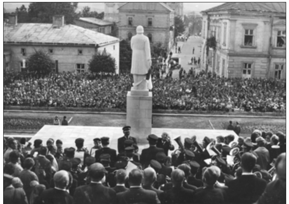
We wrześniu 1962 roku Tadeusz Kościuszko „wrócił” do Sanoka. Nowy pomnik postawiono jednak nie na placu św. Jana, ale na pod parkiem, przy głównej ulicy.