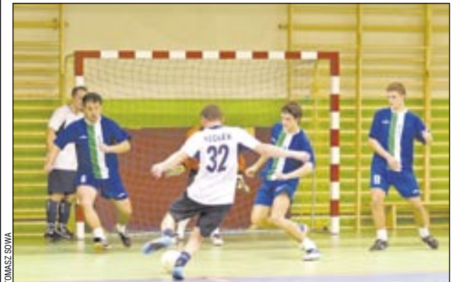
Piłkarze Geo-Eko (ciemne stroje) musieli uznać wyższość HTP.

W zagórkim Gimnazjum nr 2 rozegrano ćwierćfinały Pucharu Sanockiej Halowej Ligi Piłki Nożnej „Ekoball”. Dwie niespodzianki – Trans-Gaz pokonał Multi Okna, HTP lepsze od Geo-Eko. Do półfinałów awansowali też Harnasie i Kingsi.