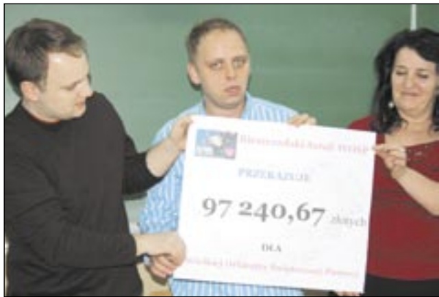
Bieszczadzki Sztab WOŚP z dumą prezentował symboliczny czek, który przekazany trafią do Warszawy.

Finiszuje Bieszczadzki Sztab Wielkiej Orkiestry Świątecznej Pomocy. Ponad 97 tys. zł zostało przesłane do Warszawy, ale wciąż jest szansa na poprawienie wyniku sprzed roku. W planie jeszcze kwesta podczas Ice Racingu oraz licytacja na Allegro.