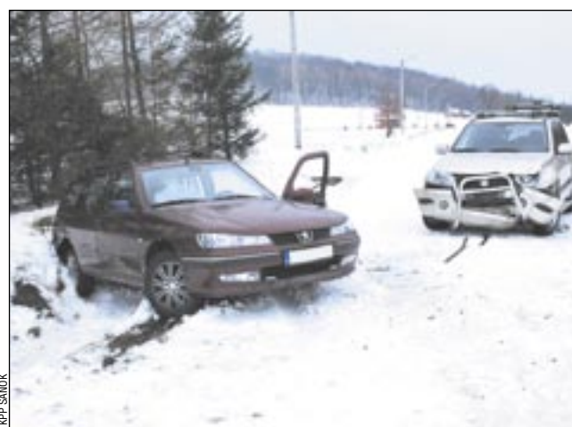
Pomysł pokonania zasy i rozpędu okazał się niezbyt szczęśliwy

Ze wstępnych ustaleń policji wynika, że jadący drogą podporządkowaną kierowca peugeota, 22-letni mieszkaniec powiatu sanockiego, chciał włączyć się do ruchu. Dojeżdżając do skrzyżowania, zauważył niewielką zaspę śnieżną, którą postanowił pokonać zwiększając prędkość. Rozpędził samochód, pokonał zaspę, jednak wyjechał na drogę główną, którą jechało suzuki. Kierujący nim 62-letni mieszkaniec powiatu jarosławskiego z uwagi na śliską nawierzchnię nie był w stanie zatrzymać swojego auta