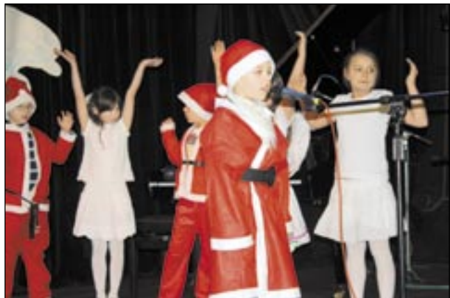
Klasa Ia ze Szkoły Podstawowej nr 2 zajęła pierwsze miejsce.

Blisko setka młodych artystów wzięła udział w IV Przeglądzie Kolęd i Pastoralek, który Młodzieżowy Dom Kultury zorganizował w klubie „Naftowca”. Nagrodę główną, czyli „Złotego Anioła” zdobył „Cisowski Band” z Brzozowa.