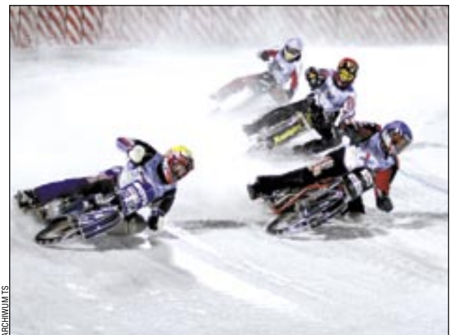
Lód, kolce i ryk motorów – kibice to kochają.

To już w najbliższy weekend. Sztandarowa impreza sanockiego sportu, porównywalna tylko z kluczowymi meczami hokeistów Ciarko PBS Bank. Jutro rozpoczyna się wielkie ściganie na torze lodowym „Błonie”, czyli dwa dni z ice speedwayem.