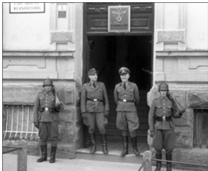
Funkcjonariusze gestapo w drzwiach dawnego starostwa, dziś Urzędu Miasta. Zdjęcie wykonano w kwietniu 1944 roku.

przy ulicy Żwirki i Wigury. Na zdjęciach autorstwa Stanisława Potockiego widać tłumy i przystrojone stoły, na których stoi trzynaście karabinów.