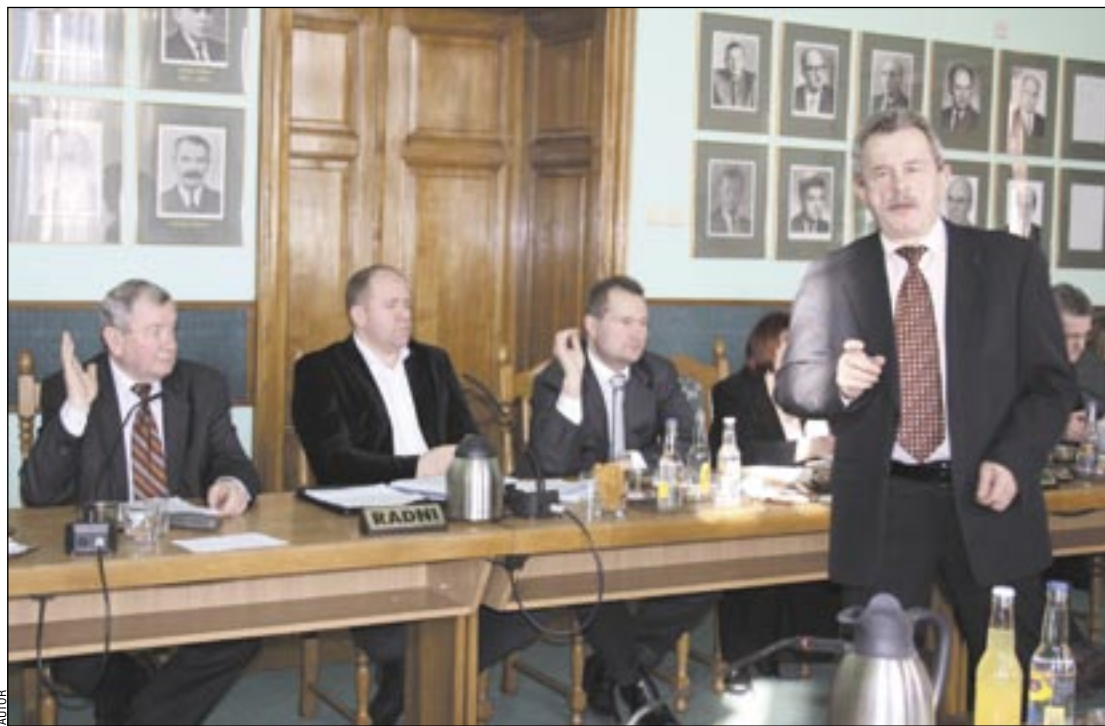
Sesja budżetowa roku 2012 przejdzie do historii sanockiej samorządności jako ta, w której nikt nie był przeciw, ale jedna trzecia składu rady (7) nie wzięła udziału w głosowaniu.