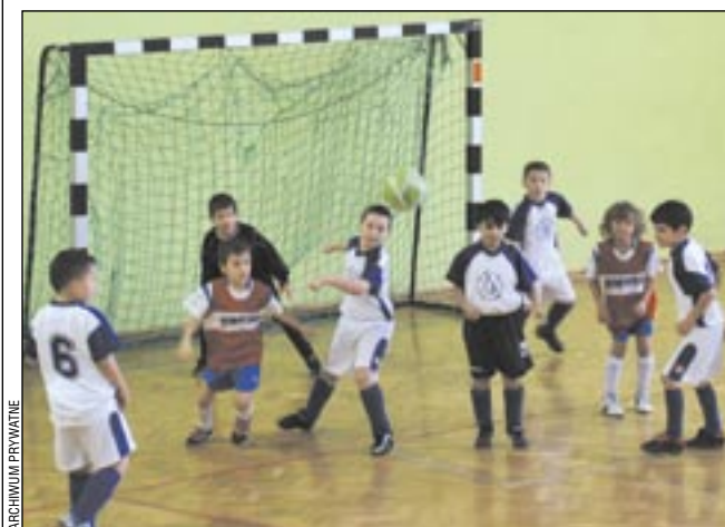
Na sali w Niebieszczanach nasze „Orzełki” odniosły podwójne zwycięstwo.