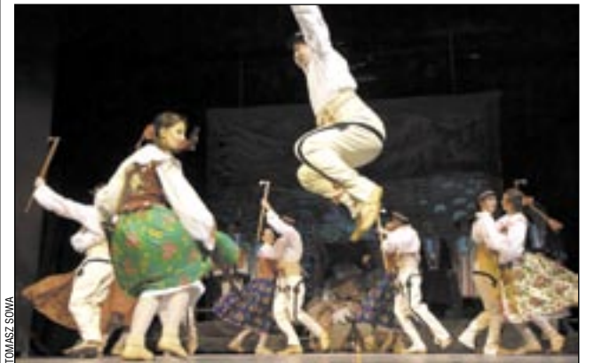
Aż rwali oczy... Ogniste tańce góralskie w wykonaniu młodzieży z ZTL Sanok.

Następnego dnia koncert został powtórzony w domu kultury w Bukowsku (bez tancerzy), gdzie został przyjęty przez publiczność równie gorąco jak w Sanoku. (z)