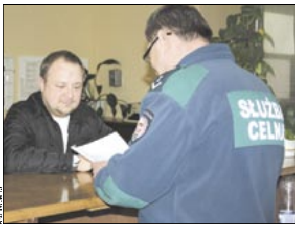
Oddział celny zostaje. Przynajmniej na razie...

– Na razie odetchnęliśmy z ulgą, choć temat nie jest jeszcze zamknięty. Podobno cały czas trwają „konsultacje społeczne”, mające dać odpowiedź, czy funkcjonowa-