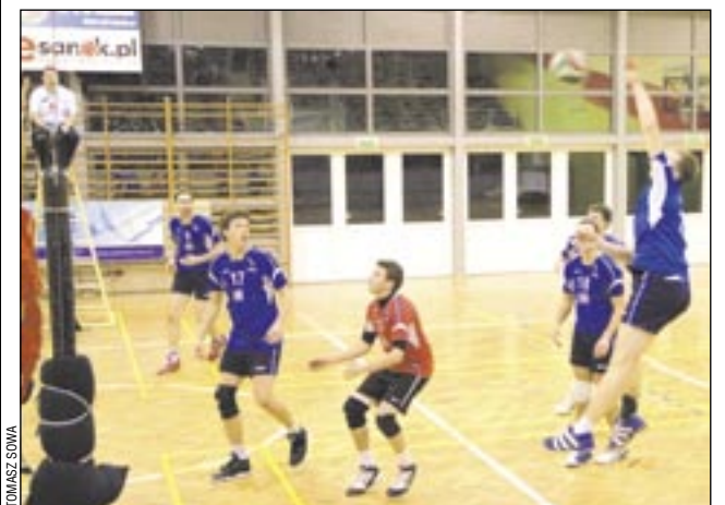
W meczu z Jasłem siatkarzom TSV wychodziło niemal wszystko.

latynie mało było psutych zagrywek, z czym ostatnio mieliśmy problemy. Myślę też, że moich zawodników odpowiednio zmotywował fakt, iż porażka mogła nas wyeliminować z dalszej walki. Dlatego zagrali na 100 procent, nie dając rywalom żadnych szans – powiedział trener Maciej Wiśniowski.