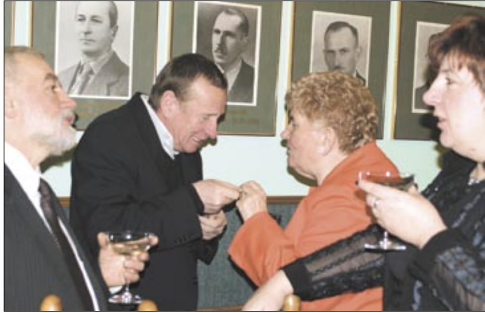
Jak na spotkanie opłatkowe przystało, wszyscy życzyli sobie dużo i dobrze.

– Do tej pory zapraszaliśmy przedsiębiorców, którzy udzielają się w Izbie. W tym roku postanowiliśmy zaprosić również prezesów firm i organizacji, które działają społecznie. Bo to one są kręgosłupem miasta, dzięki nim to miasto żyje i się rozwija. W Sanoku zarejestrowanych jest około 170 organizacji społecznych, z czego około 30 działa autentycznie. Chcieliśmy im podziękować za to, że są, że działają aktywnie na rzecz lokalnej spo-