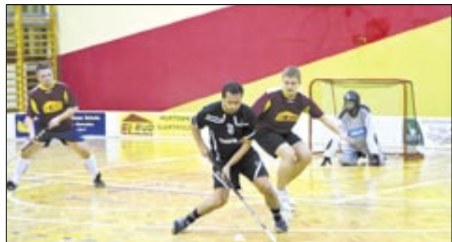
Drużyna esanok.pl nie zwalnia tempa.

Alcatraz – Automania 6-10 (4-3), InterQ – esanok.pl 3-4 (1-3), El-Bud – AZS PWSZ 5-7 (2-3), Extreme Team – WSliZ Rzeszów 3-4 (1-2).