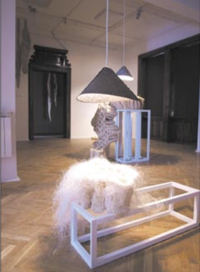
Przy oglądaniu Kokonarium skojarzenia nasuwają się same...