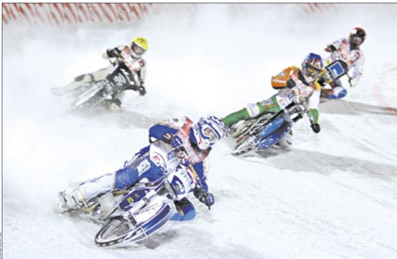
Najbardziej zacięta walka toczyła się na wirażach. W jej ferworze niektórzy zawodnicy wypadali nawet z toru, na szczęście obyło się bez poważniejszych kontuzji.