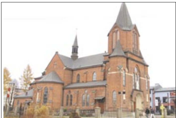
Temat budowy kościoła filialnego w Posadzie Olchowskiej zrodził się w 1907 roku. Nie było łatwo go zrealizować, gdyż mieszkańcy należeli wówczas do parafii farnej i zrodziły się obawy, że dojdzie z tego powodu do jej podziału...