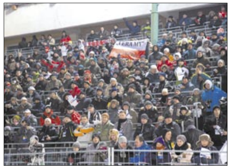
Publiczność na torze „Błonie” tworzyła barwną, wielonarodową grupę.

Niestety, zawodnik GTŻ Grudziądz nie prezentował już tak dobrej formy, jak dzień wcześniej. W drugim półfinale zajął 4. miejsce i ostatecz-