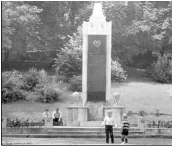
Pierwszy pomnik ku czci żołnierzy Armii Czerwonej stał już w 1945 roku i początkowo był integralną częścią cmentarza na wschodnim stoku Góry Parkowej, gdzie znajdowało się kilkadziesiąt grobów.

Do napisania tego listu zmobilizowały mnie głosy czytelników zamieszczone w 3 numerze pisma dot. artykułu „Porozmawiamy o pomniku”. Z lektury tych listów można wywnioskować, że wszyscy mieszkańcy naszego miasta, a szczególnie środowisko inteligencji sanockiej i harcerze, są za tym, aby pomnik został usunięty z placu parkowego (dlaczego się zgodzili na nazwę Plac Harcerski?). Wydaje się jednak, że bardzo duża część naszego społeczeństwa ma inne zdanie tzn. nie widzi potrzeby, aby zmieniać i zacierać historię.