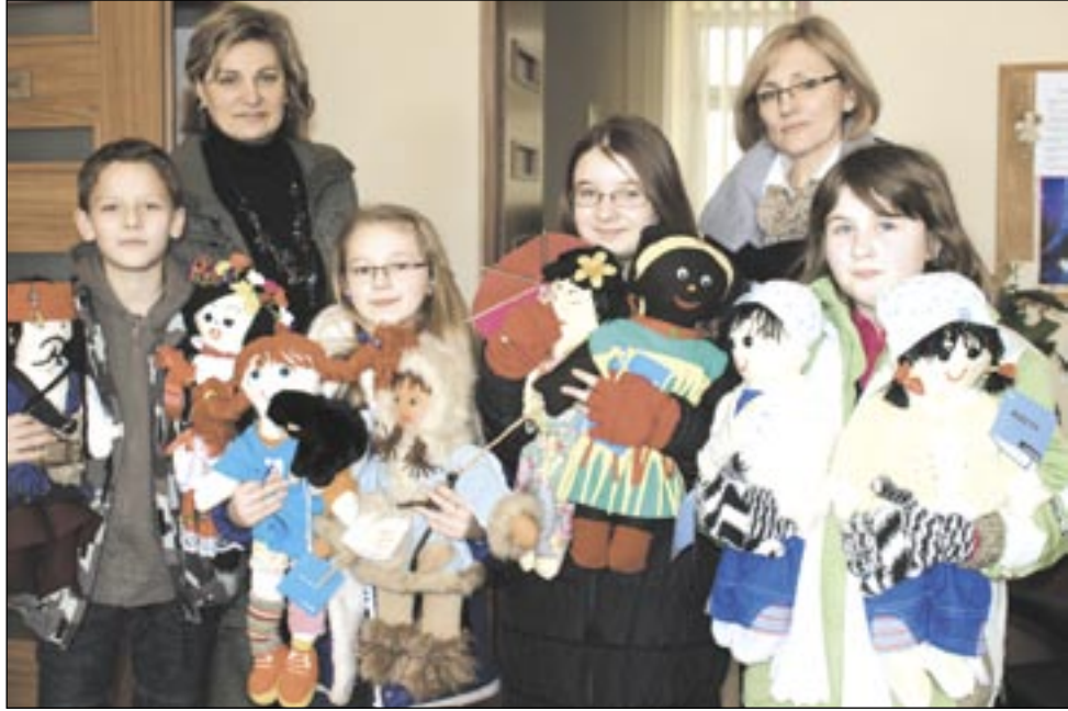
Delegacja SP3 zjawiała się w redakcji z zaproszeniem na licytację, przy okazji prezentując piękne lalki.

Akcja UNICEF „Wszystkie Kolory Świata” znalazła sprzymierzeńców i u nas. Przyłączyli się do niej szkoły podstawowe nr 1 i 3, a ich uczniowie uszyli ponad 150 lalek, które wystawione zostały na licytację. Zebrano przeszło 4000 zł na zakup szczepionek dla dzieci w Sierra Leone.