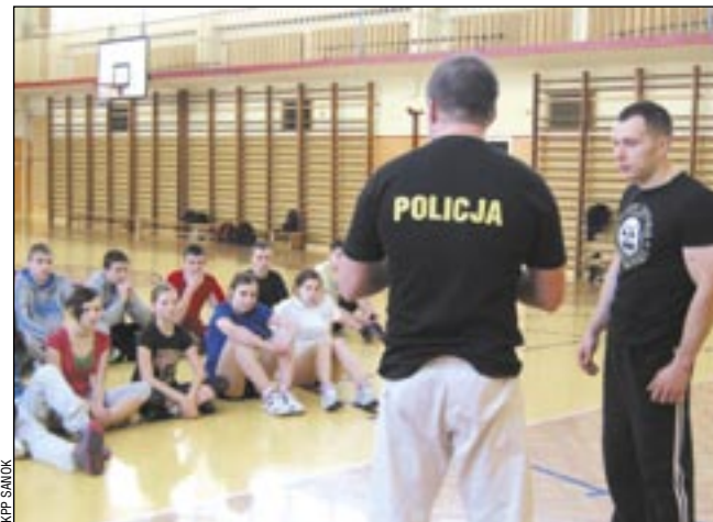
Takie zajęcia to świetny pomysł! Powinny być w każdej szkole i nie tylko na ferii.

W części teoretycznej omawiane są podstawowe zasady bezpieczeństwa. – Przekazuje uczniom informacje na temat prawidłowych reakcji na czyny zabronione, w tym przejawy agresji i przemocy, których są świadkami. Uwrażliwiam ich także na niesienie pomocy osobom pokrzywdzonym – wyjaśnia mł.