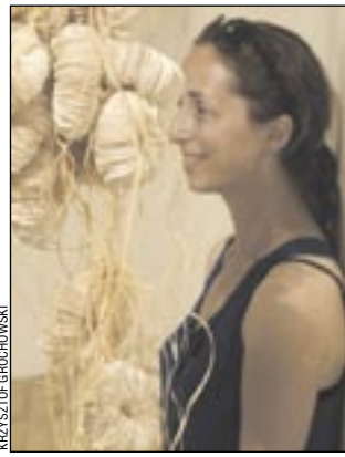
Artystka i jej Symbiozy.

Drugą instalacją, umiejscowioną w korytarzu prowadzącym do klatki schodowej Galerii, są Symbiozy. To projekt zrealizowany przez artystkę podczas rezydencji twórczej w Czechach, w czerwcu 2011 roku. Papierowe „kuleczki” inspirowane naturą odnalazły swoje odzwierciedlenie w kompozycji stworzonej przez samą naturę na ścianach opuszczonego betonowego basenu. I spodobały się komuś tak bardzo, że zniknęły... – Fakt przywłaszczenia mojej pracy zaakceptowałam bez trudu, przekładając go na wariację na temat realizowanego projektu – przyznaje autorka, która od tamtej pory dołącza do instalacji deklarację zezwalającą na zabieranie owych obiektów z galerii, prosząc o przesłanie na adres mailowy chociaż jednego zdjęcia