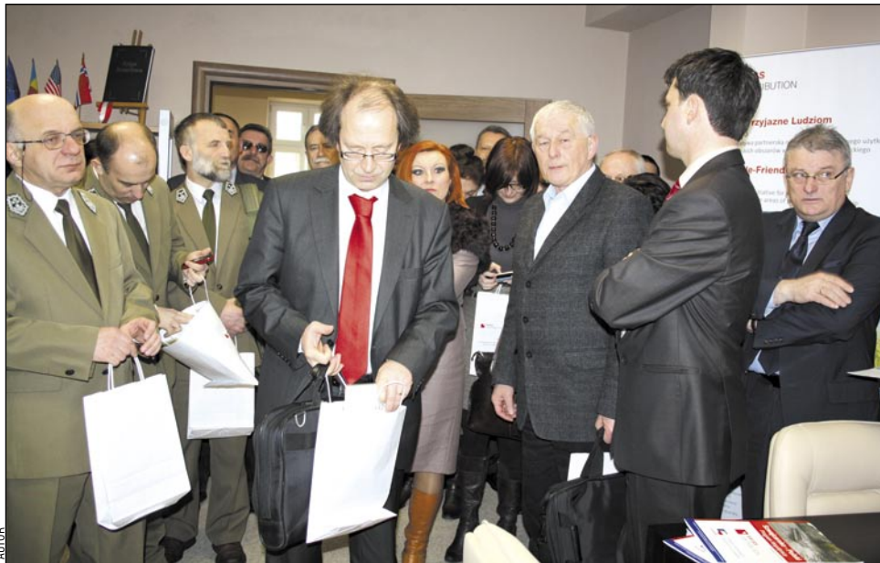
Inauguracja projektu „Karpaty przyjazne ludziom” zgromadziła w siedzibie Fundacji Karpackiej Polska w Sanoku wiele osób z kraju i zagranicy, zafascynowanych tym projektem.