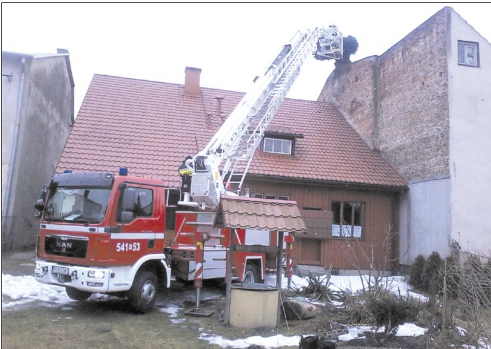
Dwa zastępy strażaków pracowały nad zabezpieczeniem bocianiego gniazda przy ulicy Lipińskiego.

We wtorek dwa zastępy strażaków uczestniczyły w akcji związanej ze zmniejszeniem powierzchni i ciężaru bocianiego gniazda, które znajduje się na budynku przy ulicy Lipińskiego, w pobliżu dawnego ratusza. Sanoczanie przyzwyczaili się do obecności bocianów w tym miejscu, dla właścicieli dwóch budynków jest to jednak ogromny kłopot.