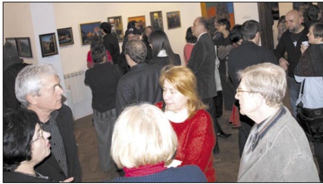
Samych wychowanków był niezły tłumek.

Wystawione w BWA prace artystki, która w hotelu „Bona” prowadzi własną pracownię i galerię, można oglądać do 23 marca. I nie tylko oglądać, ale i zakupić, bowiem większość obrazów przeznaczona jest do sprzedaży.