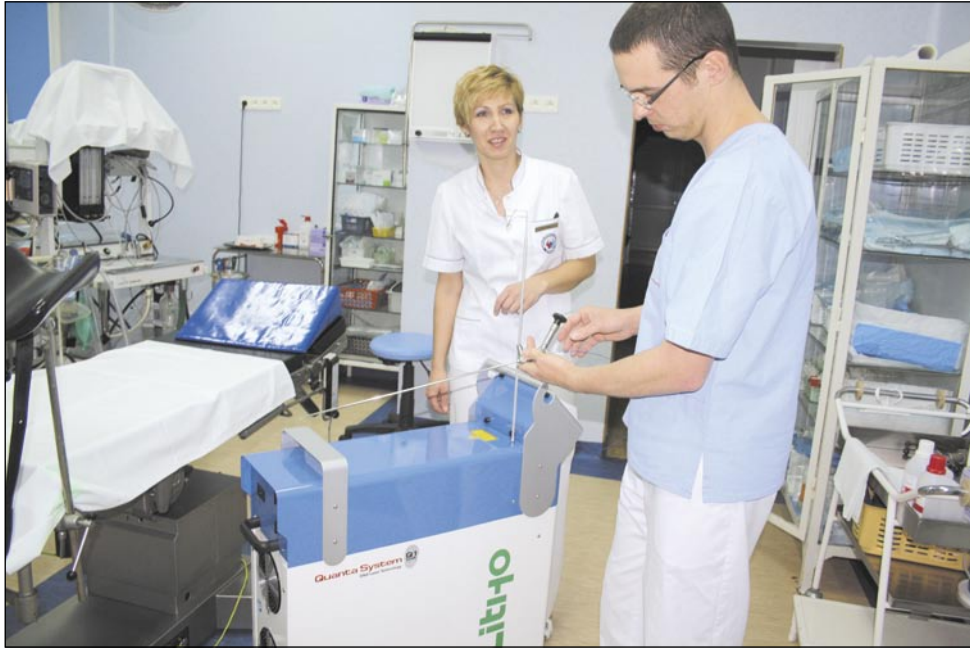
Zabieg usuwania kamieni nerkowych nową metodą ktoś porównał do strzelania do nich z działa laserowego. Łdnie brzmi, nieprawdaż? Życzymy celnych strzałów, panie doktorze!

Sanocka urologia zrobiła milowy krok w XXI wiek, wzbogacając się o zestaw do litotrypsji laserowej. Urządzenie „LITHO 30W” z osprzętem zabiegowym firmy STORZ wartości 199 tys. zł sfinansowało Starostwo Powiatowe. Zabiegi laserowego usuwania kamieni nerkowych rozpoczną się już w przyszłym tygodniu.