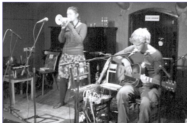
Małżeński duet DVA ponownie zagrał w „Panice”.

-białe, nieme produkcje, wciąż robią duże wrażenie. Szczególnie, kiedy doprawi się je dawką niezwyklej muzyki, a właśnie z takiej słynie DVA. Grupa udowodniła, że w przypadku wspólnych artystów czas nie jest ważny – ich praca wciąż pozostaje żywa, nawet po upływie 100 lat. (kd)