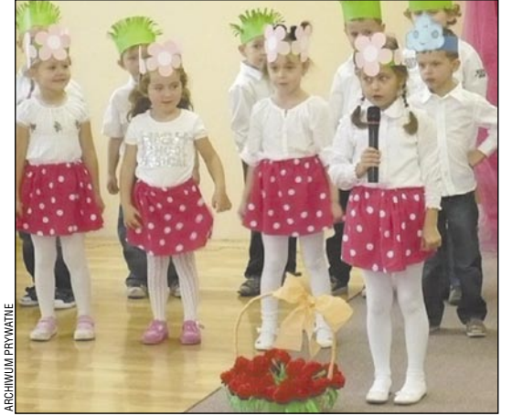
W szkole czy w przedszkolu? Zdecydować muszą rodzice.

– Przed 3 laty intencją rządu było wysłanie do szkoły 6-latków. I gdyby tak się stało, nie byłoby problemu. Ale zostało to opóźnione. Efekt jest taki, że dziś mamy w klasach zerowych dwa roczniki