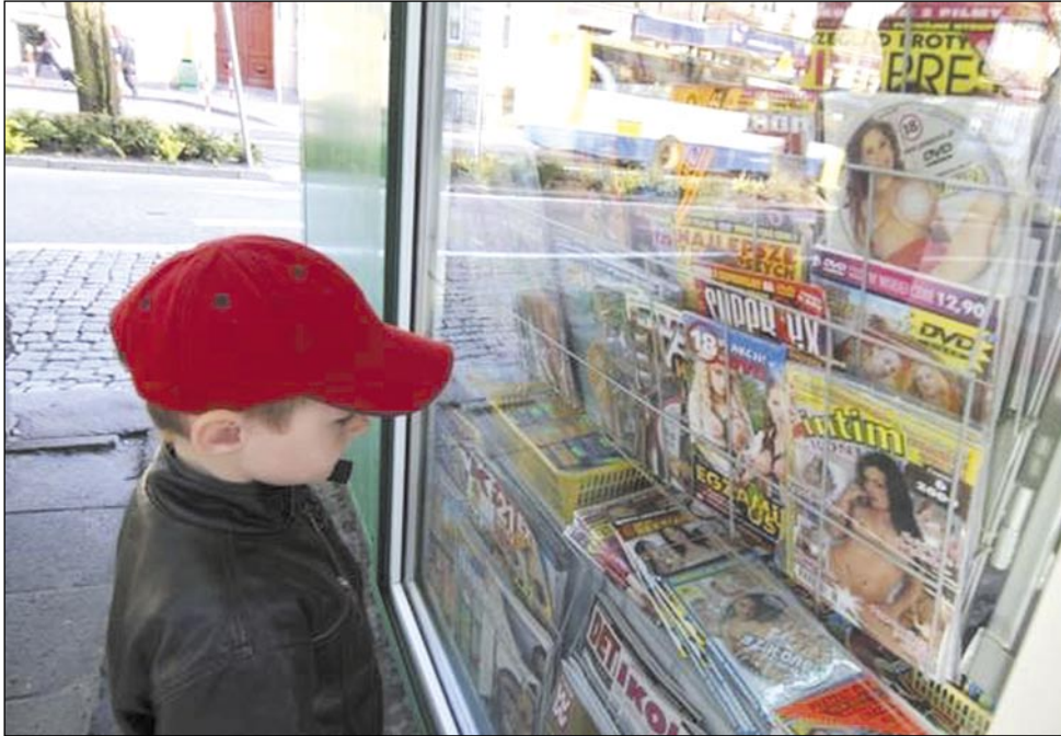
Powinniśmy chronić dzieci przed takimi „atrakcjami”...