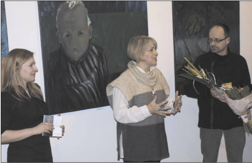
Tu też ma swoich ludzi...