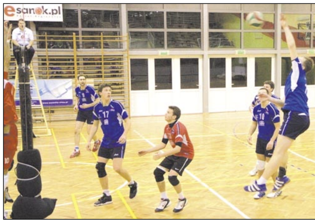
Siatkarkom TSV znów nie udało się awansować do turnieju barażowego.

Drugi turniej finałowy III ligi był dla siatkarki TSV Mansard okazją do rehabilitacji za pierwszy występ. Choć znów nie udało się wygrać meczu, to wypadli znacznie lepiej, Anilanie Rakszawa i Głogovii Głogów Młp. ulegając dopiero po tie-breakach.