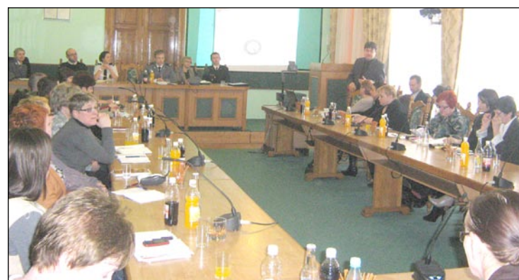
Żywa dyskusja, która się później wywiązała, potwierdziła, jak potrzebne są tego typu inicjatywy i spotkania. Poza osobami zawodowo zajmującymi się bezpieczeństwem dzieci i młodzieży warto byłoby włączyć do niej także rodziców.

Spotkanie miało na celu udoskonalenie procedur współpracy pomiędzy różnymi instytucjami, głównie w zakresie przemocy i przestępczości wirtualnej, która stanowi obecnie duże zagrożenie dla młodzieży. Młodzi ludzie coraz częściej bowiem używają Internetu i telefonu komórkowego jako głównych narzędzi służących do popełniania czynów zabronionych prawem, m.in. stosowania przemocy. Policja odnotowuje przypadki, w których nieletni zamieszczają na forach internetowych obraźliwe komentarze, wulgaryzmy, groźby, wyzwiska, złud-