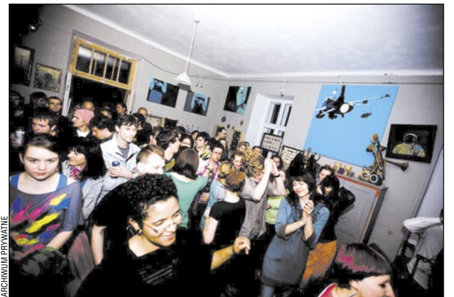
Zostaną tylko wspomnienia...