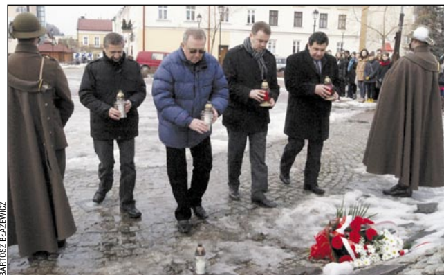
Pod pomnikiem Synów Ziemi Sanockiej złożono kwiaty i zapalono znicze.

Święto obchodzone jest 1 marca, gdyż tego dnia 1951 r. w mokotowskim więzieniu komunistów zamordowali przywódców IV Zarządu Zrzeszenia Wolność i Niezawisłość – Łukasza Cieplińskiego i jego towarzyszy walki. Tworzyli oni kierownictwo ostatniej ogólnopolskiej konspiracji kontynuującej od 1945 roku dzieło Armii Krajowej. (b)