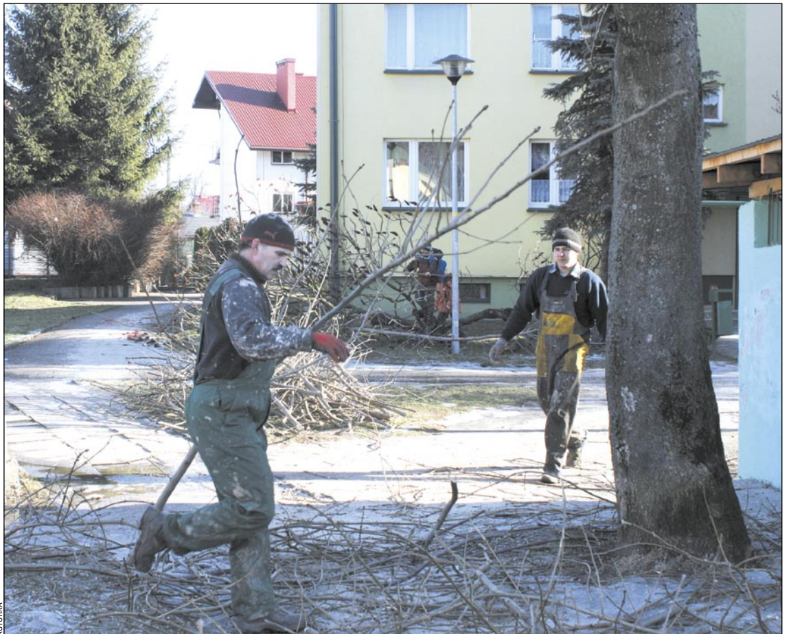
Mamy nadzieję, że epoka „rzezi drzew” już za nami i sanoccy administratorzy podejną z większym profesjonalizmem – i sercem – do tematu.

Najwięcej chyba grzechów w tej dziedzinie popełniła Sanocka Spółdzielnia Mieszkaniowa, choć i pozostali, np. SPGM, powinni mocno uderzyć się w piersi. Jak przyznał właściciel firmy ze Stró-