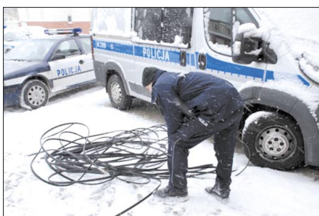
Kradzieże kabli nie są wyłącznie lokalną specjalnością...

Policjanci z posterunku w Zagórz intensywnie pracowali nad sprawą seryjnych kradzieży drutu z napowietrznej linii kolejowej, jakie miały miejsce od lipca 2011 roku. Dochodziło do nich w godzinach nocnych na odcinku Zagórz-Szczawne, głównie na terenach miejscowości Mokre, Morochów oraz Wysocznany. W wyniku podjętych działań operacyjnych funkcjonariusze natrafili na trop sprawców, których zatrzymali niemal na gorącym uczynku. Po przeszukaniu ich miejsc zamieszkania zebrali dowody pozwalające na przedsta-