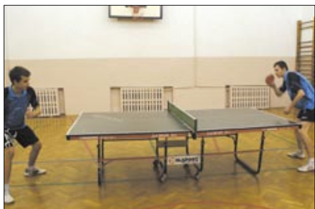
Mateusz Łącki (po lewej) i Artur Gratkowski to czołowi juniorzy okręgu krośnieńskiego. W najbliższy weekend będą mieli okazję zmierzyć się reprezentantami innych podkarpackich okręgów, bo ekipa SKT wybiera się do Dukli na Mistrzostwa Województwa.

Klasyfikacje indywidualne: łączna – 2. Gratkowski (37 wygranych), 7. Łącki (29), 8. Skiba (27), 21. Nowak (18), 30. Lorenc (12); seniorzy – 11. Nowak, 18. Lorenc; juniorzy – 1. Gratkowski, 3. Łącki, 4. Skiba. Klasyfikacje deblowe: łączna – 1. Łącki (13), 3. Gratkowski (12), 9. Skiba (9), 16. Nowak (7), 29. Lorenc (4); seniorzy – 6. Nowak, 14. Lorenc; juniorzy – 1. Łącki, 3. Gratkowski, 7. Skiba.