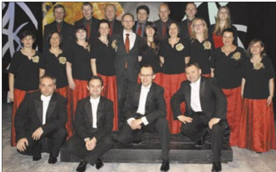
Pamiątkowe zdjęcie po jednym z koncertów na Forum. Grupa MoCarta wraz z sanockim chórem Adoramus.