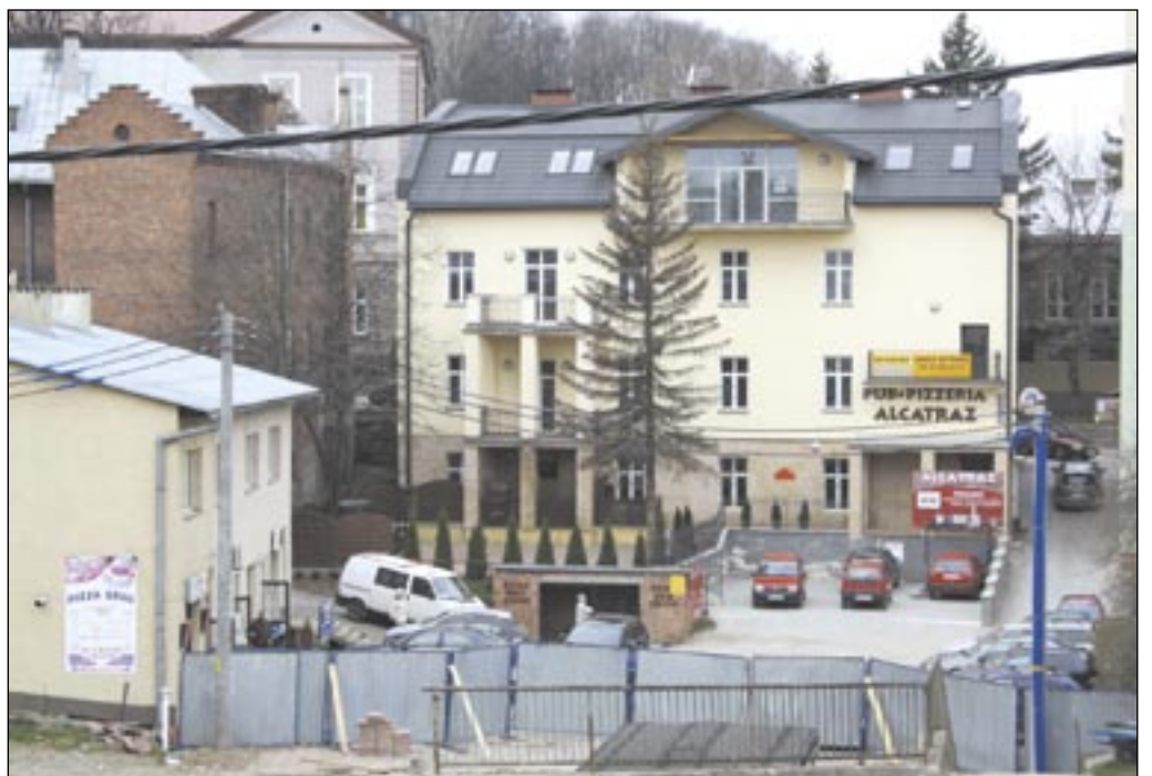
Gra toczy się o teren od kamienicy Trendotów do połowy pawilonu handlowo-usługowego. Znajdują się tam obecnie: parking, wejścia do budynku handlowo-usługowego, dojazd do ochronki, schody prowadzące na halę oraz wyjazd do ulicy Sobieskiego.

nie z nią spadkobierczynie miałyby otrzymać dwie działki (572/11 i 572/13) o powierzchni ponad 5 arów. Odmówił zaś zwrotu gruntów, na których stoi pawilon handlowo-usługowy. Decyzja ta wywołała sprzeciw już nie tylko miasta. Do akcji wkroczyli także właściciele pawil-