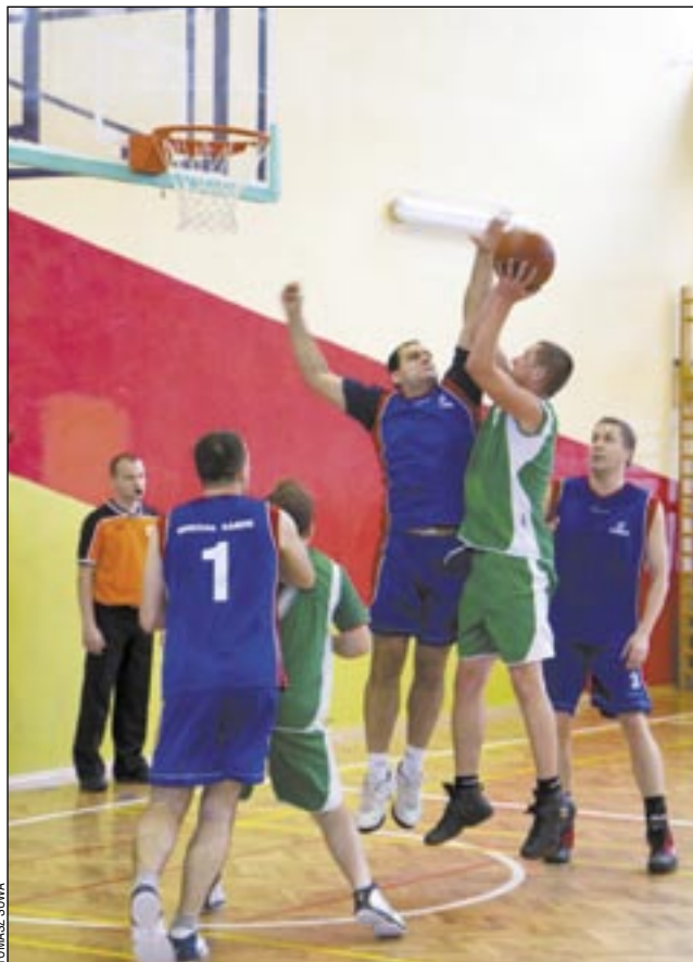
Na razie nasi koszykarze grają rekreacyjnie, ale już wkrótce mogą walczyć o ligowe punkty.