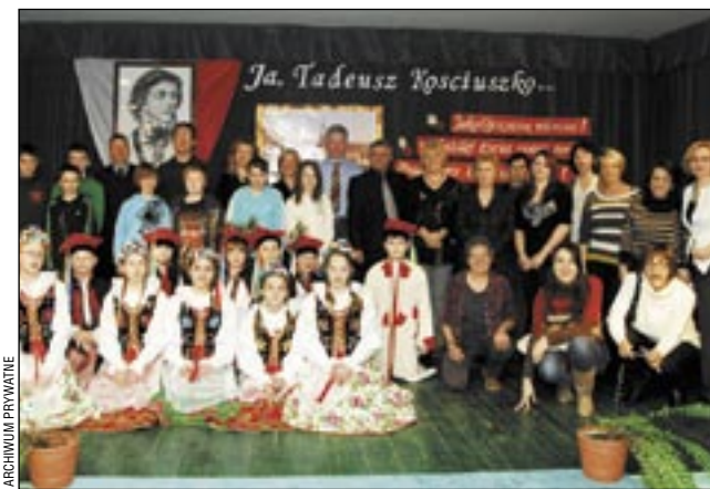
Najważniejszym punktem wizyty był Dzień Patrona Szkoły.

W przygotowania do wizyty zaangażowała się dyrekcja, wielu nauczycieli, uczniów i rodziców, którym szkoła jest bardzo wdzięczna za gościnność. Dzięki temu pobyt w Sanoku stał się dla nauczycieli i uczniów z Europy niezapomnianym wydarzeniem. (b)