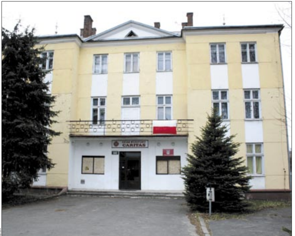
Zakładowy Dom Kultury vel Caritas. Kiedyś tętnił życiem, dziś tylko niszczy. Jeżeli postoi tak jeszcze kilka lat, nie będzie już co ratować...

Zwłaszcza, że mogłaby na sobie zarabiać, chociażby poprzez wynajem sali na wesela czy inne imprezy. Niejednemu Czerkiesowi tza się w oku kręci na wspo-