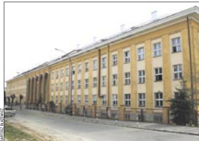
„Mechanik” – jedna z najstarszych szkół w mieście dziś imponuje wielkością, choć wyraźnie widać na niej ząb czasu. Ale już niedługo będzie piękna, z czego wszyscy powinniśmy się cieszyć.

Rada Powiatu postanowiła przyjąć dotację z Narodowego Funduszu Ochrony Środowiska i Gospodarki Wodnej w wysokości 1 miliona złotych (bez 36 zł) i zaciągnąć długoterminową pożyczkę z tegoż Funduszu w kwocie 2 mln zł (bez 72 zł) na realizację zadania pn. „Termomodernizacja szkół i placówek Powiatu Sanockiego.