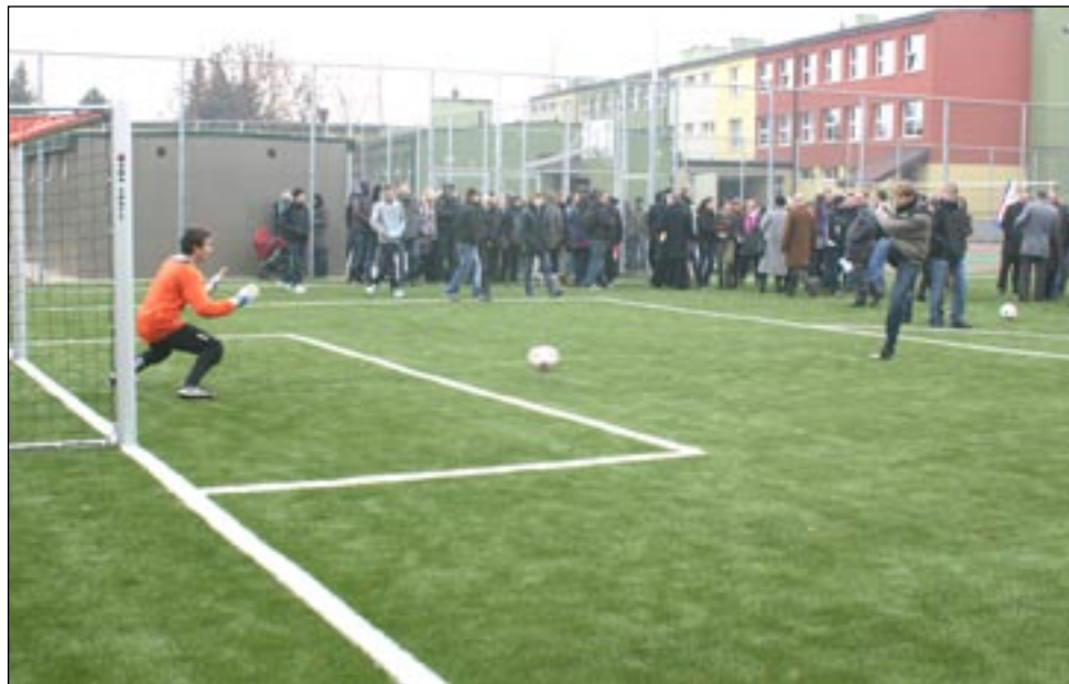
Tłusty rok I Ogólniaka. Najpierw „Orlik”, który nań sfrunął, a już decyzja o budowie hali sportowej, która otworzy swe podwoje w 2014 roku. Znamy szkoły, które pękają z zazdrości...

Trzynastego kwietnia, w piątek, Rada Powiatu zdecydowała o wprowadzeniu do budżetu zadania pn. „Budowa hali sportowej wraz z łącznikiem i zapleczem technicznym przy I Liceum Ogólnokształcącym w Sanoku”. Koszt inwestycji szacowany jest na 3,9 mln zł, z czego 960 tys. zł stanowi wkład Urzędu Marszałkowskiego. Starostwo Powiatowe zapowiada podjęcie próby pozyskania środków unijnych na realizację tego zadania.