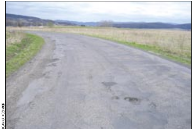
Tak wygląda jeden z najmniej zniszczonych odcinków drogi do Nowotańca.

Do ogłoszonego przez inwestora przetargu stanęło osiem firm z całej Polski. Za najkorzystniejszą uznano ofertę Przedsiębiorstwa Robót Drogowych i Mostowych z Sanoka, które zostało głównym