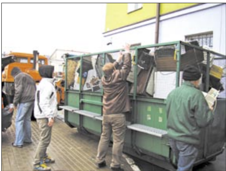
Gdyby wszyscy mieszkańcy Sanoka mieli takie podejście do odpadów i segregacji jak członkowie zespołu „Green Bomb” z „Ekonomika”, byłibyśmy najczystszy miastem w Polsce.

Wśród uczestników rozlosowano nagrody ufundowane przez: dyrekcję Sanockiego Domu Kultury,