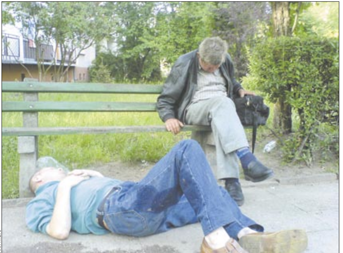
Choć to obrazek z nie całkiem sanockiego podwórka, podobne wcale nie są u nas rzadkością. Zamorzonych alkoholem pijaków kiedyś najłatwiej było namierzyć pod SDH, ale równie chętnie układali się do snu na ławkach w parku czy trawnikach.

Sytuacji nie ułatwia też społeczne przyzwolenie na pijaństwo. Dawniej dotkniętemu alkoholizmem aplikowano szybkie trzeźwienie w cebrzyku i kilka kijów na tyłek, po czym wsadzono w kibitkę