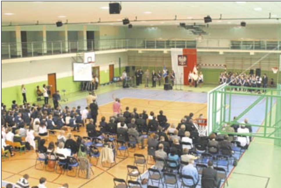
Szkoda, że planowana przy I LO hala sportowa nie będzie miała choćby takich rozmiarów jak ta na zdjęciu w Zagórzcu.

Pierwszy „Ogólniak” ma swój czas. Jeszcze nie zdążył nacieszyć się „Orlikiem”, o którego samorządowi jego zwolennicy musieli stoczyć bój z przeciwnikami, jak tu nań spłynęła kolejna fala międu, niosąc wieść, iż wkrótce szkoła doczeka się hali sportowej.