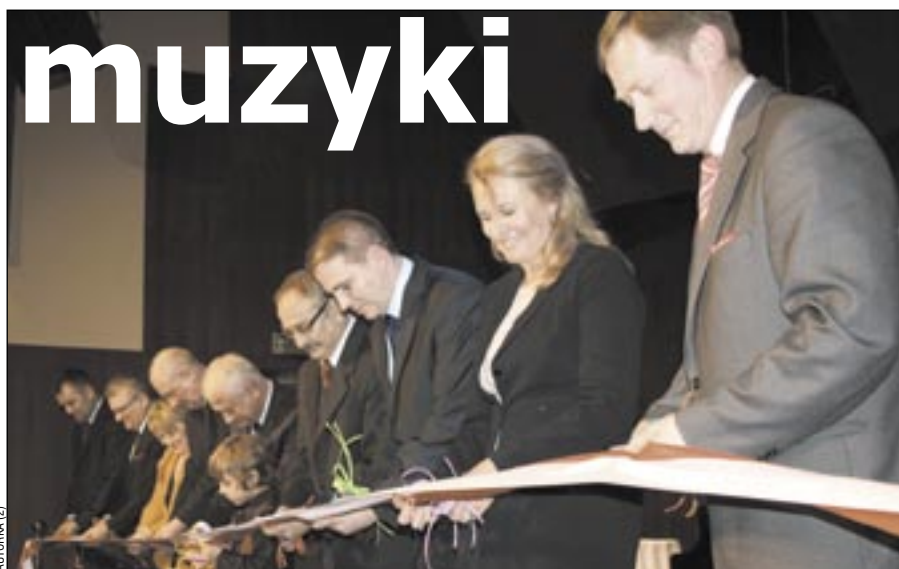
Symboliczne cięcie wstęgi, w którym poza VIP-ami uczestniczył najmłodszy uczeń szkoły, przebiegło koncertowo!