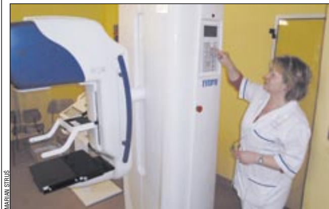
Dzięki badaniom profilaktycznym nowy mammograf będzie lepiej wykorzystany.

W najbliższym czasie ruszy cała machina programu profilaktycznego. SP ZOZ wystosuje zaproszenia dla pań na bezpłatne badania mammograficzne, będące skuteczną, taną i bezpieczną formą diagnostyki. Na pewno