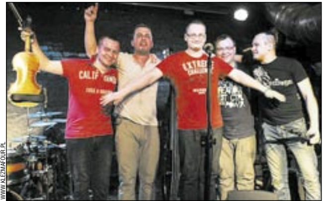
Coś w sobie ma „Pani K”, że goszczą w niej znakomite zespoły, mające za sobą występy na światowych scenach. Do takich należy niewątpliwie „Klezmafour”. Witamy w Sanoku!

Cytując organizatorów Internationales Klezmer Festival Fürth (Niemcy), gdzie bilety na koncert zespołu wyprzedano ciągu zaledwie kilku dni: „Muzyka zespołu Klezmafour jest głęboko zakorzeniona w żydowskim folklorze, jednak zawiera wiele