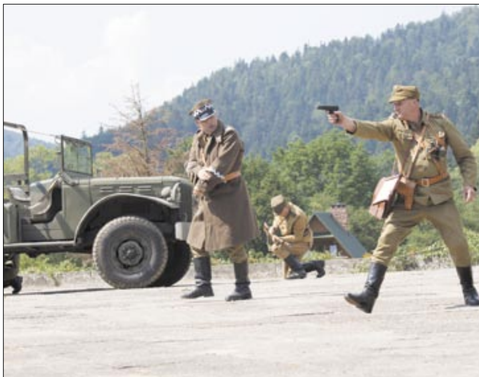
Rekonstruktorzy postarali się, aby jak najwierniej przedstawić wydarzenia z 1947 roku.

W 1962 roku w Jabłonkach powstał pomnik gen. Świerczewskiego, który stał się oczkiem w głowie komunistycznych władz i miejscem różnych uroczystości państwowych.