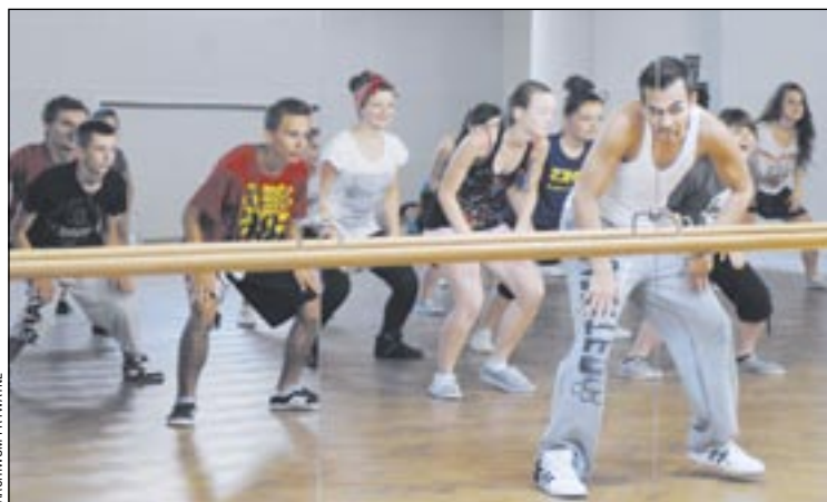
Sanok kocha taniec. Udowodnił to podczas warsztatów tanecznych w SDK, które przyciągnęły do sali tańca liczne grono miłośników hip-hopu i tańca współczesnego.

Świetnym pomysłem okazały się tygodniowe warsztaty taneczne zorganizowane w Sanockim Domu Kultury. Idealnie sprawdziła się do tego nowa sala tańca, która zauroczyła zarówno instruktorów, jak też 50-osobową grupę uczestników. Na wielkim parkiecie, w klimatyzowanej sali, aż chciało się tańczyć!