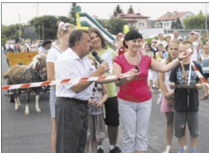
Było nietypowo, ale sympatycznie – włodarze tylko asystowali, w roli głównej wystąpiły dzieci ze świetlicy socjoterapeutycznej oraz córka i wnuk patrona ulicy. W tym przypadku tytuł programu „Lepsze jutro”, w ramach którego zorganizowano piknik, nabrał szczególnego znaczenia.