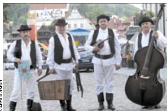
„Kamraty” – doceniane przez publiczność i znawców.

Muzycy mają w swoim repertuarze ponad sto utworów! – Znamy je od „podszełki”, gdyż większość jest grana przez zespół od początku. Mamy w naszym gronie star-