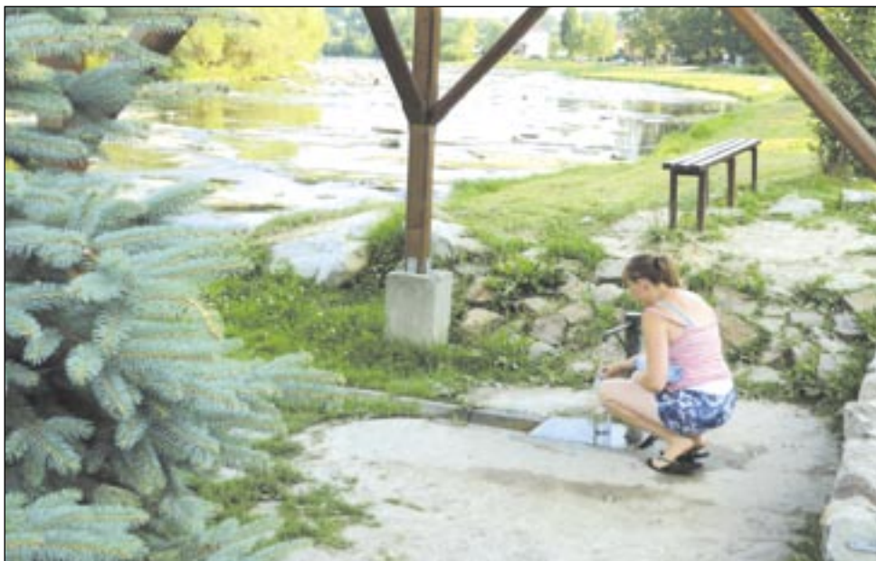
Mieszkańcy Zagórze chętnie korzystają ze studzienki nad Osławą, zwłaszcza, gdy pojawiają się problemy ze studniami. Woda jest podobno znakomita i – co najważniejsze – badania przez sanepid.

Dla mieszkańców wielu mniejszych miejscowości w Polsce dostęp do wody z sieci to wciąż jeszcze luksus. Gospodarze gmin od ponad dwudziestu lat starają się – z większym i mniejszym powodzeniem – nadrobić zaległości. Zagórze jest przykładem gminy, gdzie zapóźnienie jest ogromne. – W najlepszej sytuacji była północna część miasta, która w latach dziewięćdziesiątych ubiegłego wieku była „zwodociągowana” w 60 procentach. Możliwość podłączenia do sieci mieli mieszkańcy Leskiej Góry, Żabnika, Zastawia, Nowego Zagórze, Osiedla Domów Jednorodzinnych, Doliny, a póź-