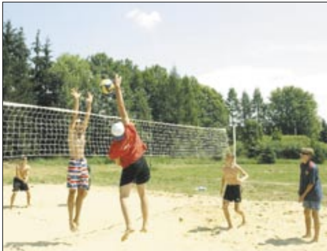
W telewizji Kochamy Siatkówkę w hali, zwłaszcza gdy grają biało-czerwoni, ale na wakacjach, w słoneczku, nie ma to jak plażówka.

W sobotę, 14 bm. rozegrany zostanie II turniej w ramach „Pucharu Zagórzca” w siatkówce plażowej. Chętnych do spróbowania swoich sił zapraszamy do ośrod-