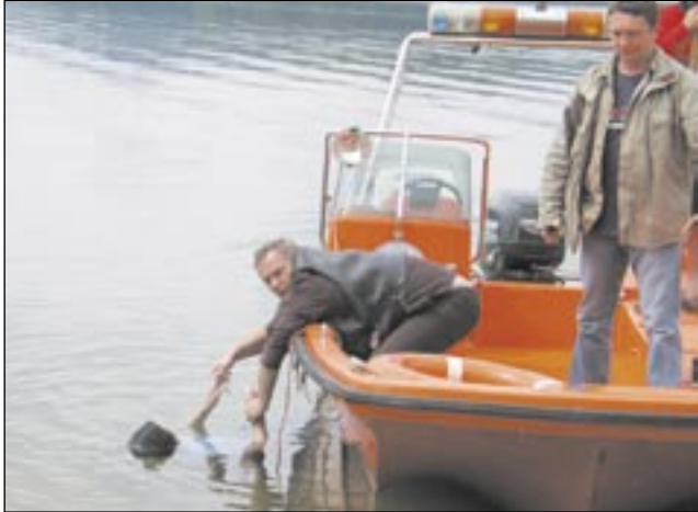
Zalew Soliński jest naprawdę niebezpieczny. Na zdjęciu – akcja z 2006 roku. Niestety, ratownicy wydobyli z wody zwłoki.