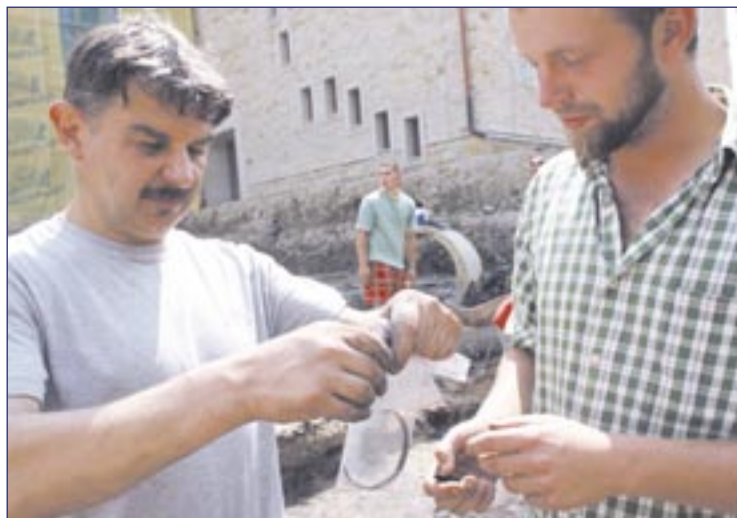
Odkrycie złoczonej bransoletki to nie lada gratka dla badaczy.

Niestety, trójcolorowi koncertowo nie zgrali. Myślę, że to wszystko przez niejakiego Nasri. No, z takim nazwiskiem to on pasowałby jak ulał do jeszcze kilku innych składów. Ale nie powiem jakich.