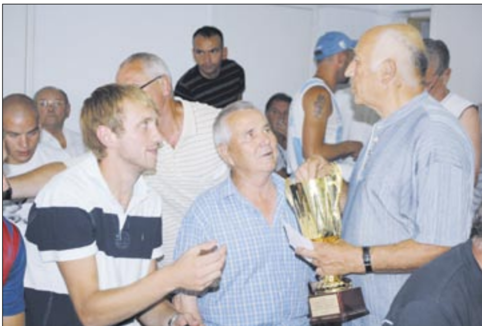
Piłkarze wiedzieli co robią zdobywając liczne puchary. Gdyby nie one, nie dałoby się wyborów przeprowadzić. Znakomicie bowiem zastępują urnę wyborczą.

stawę niektórych uczestników zebrania. Oczywiście, do zdumienia powtarzały się zarzuty o nierównym traktowaniu hokeja na lodzie i piłki nożnej, o ogromnych milionach wydawanych na hokej i kompletnym braku zainteresowania się piłką. – My nie chcemy słuchać o pańskich planach, bo już kilka lat temu mało wał pan wizję nowego stadionu. Niech pan lepiej powie, jak pan chce pomóc Stali! – domagał się jeden z młodych gniewnych. – Mówi pan tylko o promocji miasta poprzez hokej. A przecież piłka, wygrywając z Le-