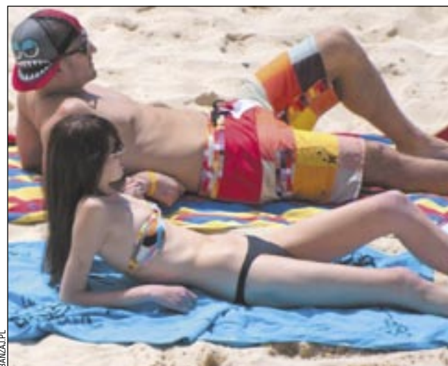
Korzystajmy ze słońca, ale z umiarem i rozsądkiem.

W ostatnim czasie na oddział zgłosił się m.in. trzynastoletni chłopak z wysoką temperaturą, bólem głowy i mocno zaczerwienioną skórą. – Okazało się, że spędził na basenie kil-