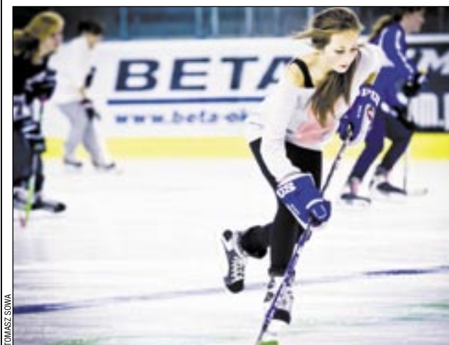
I niech nikt nie mówi, że hokej w takim wydaniu jest brzydki!

Drogi hokeistki! Nie przejmujcie się tymi uwagami. Róbcie swoje, pracujcie ostro, z zapałem, tak jak rozpoczęłyście swą przygodę z hokejem na lodzie. A jeśli wam sił i czasu starczy, dbajcie o swój wygląd i zawsze starajcie się być nie tylko dobre w grze, ale też atrakcyjne. I ciescie się, jeśli gra w hokeja sprawia wam przyjemność. Uwierzyć też, że macie w sobie coś z gwiazd. Bo jeszcze nic nie osiągnęłyście, a już wzbudzenie zainteresowanie. Coś mi się wydaje, że za chwilę będziemy proszeni, aby w stałej rybyce podawać dni i godziny waszych treningów... emes