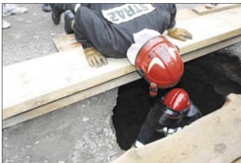
Dziura na parkingu okazała się całkiem sporą piwniczką. Po kilku dniach została zasypana i zabezpieczona, a parking znów otwarty.

Akcja zakończyła się sukcesem. Kiedy koło znalazło się na poziomie gruntu, kierowca odpalił pojazd, przejeżdżając