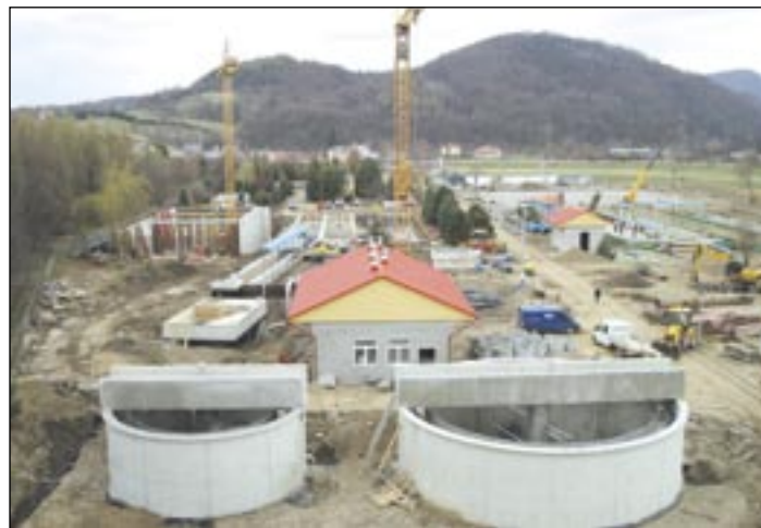
Oczyszczalnia ścieków po modernizacji tylko w niewielkim stopniu będzie przypominać tę starą z lat osiemdziesiątych. Wtedy szokowała swym ogromem, rozwiązaniami technicznymi, dziś jest staruszką, którą koniecznie trzeba było odmłodzić.

– Do wielkiej przebudowy systemu wodociągów i kanalizacji zmusiły nas przepisy i normy unijne, którym miasto musi sprostać. Niespełnienie ich skutkowało by w przyszłości płaceniem drastycznych kar. Nowa infrastruktura będzie służyć nam przez wiele lat, poprawi zaopatrzenie mieszkańców w wodę, ulepszy odbiór ście-