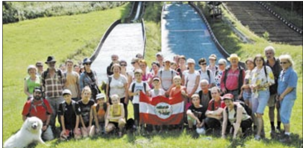
Finał w Zakuciu – wszyscy zadowoleni, uśmiechnięci. Standard na wycieczkach PTTK!

Uczestnikom wakacyjnych wypraw PTTK „W niedzielę za miasto z przewodnikiem PTTK” niestraszne żadne warunki. W niedzielę 15 lipca, pomimo ulewnego deszczu, który padał w nocy i nad ranem, na miejscu zbiórki stawiła się grupa 46 osób.