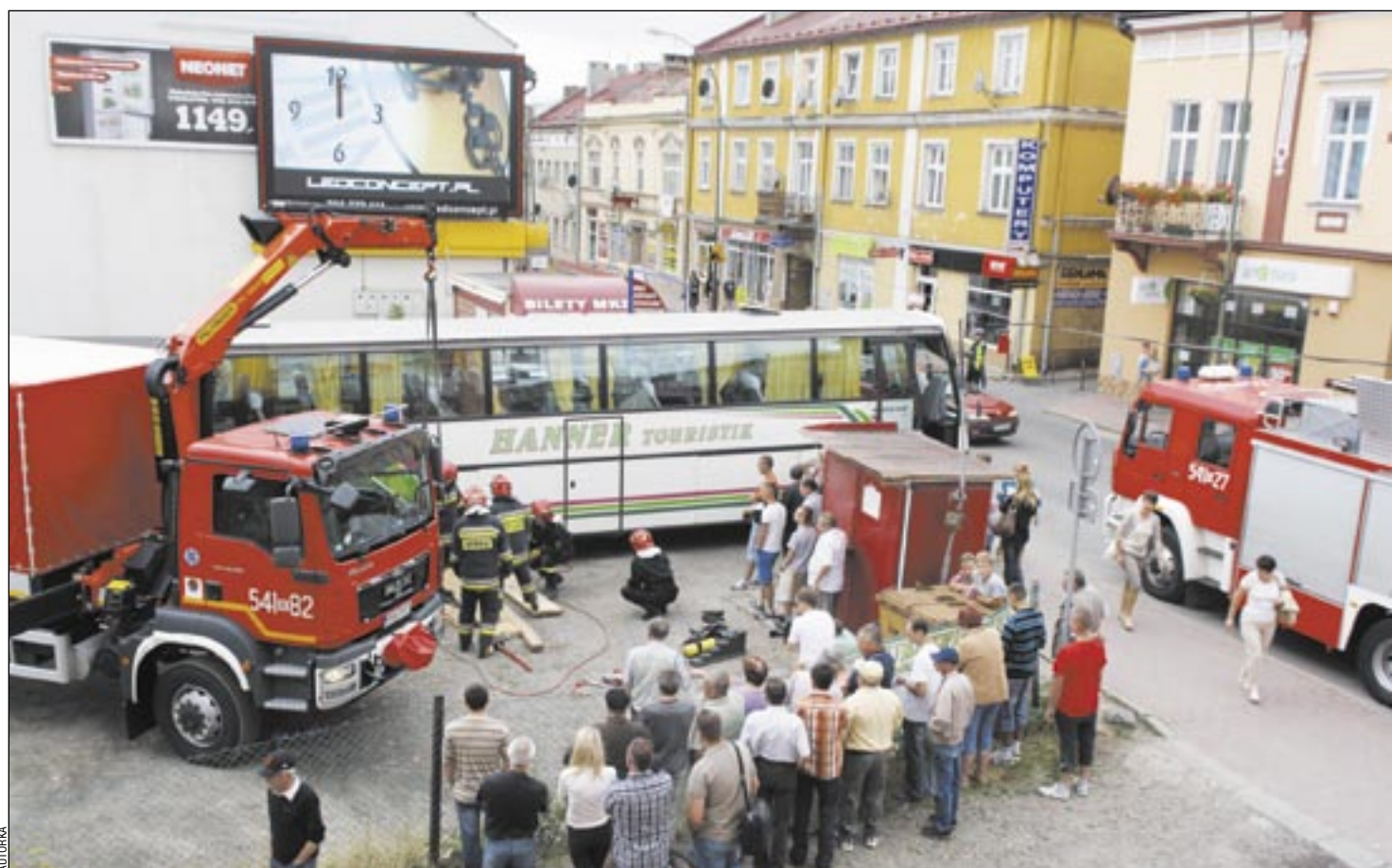
Sanoccy strażacy spisali się na sto dwa, wyciągając autobus z pułapki bez większego uszczerbku.

We wtorek, na parkingu przy ulicy Jagiellońskiej, pod kołami wyjeżdżającego autobusu zapadła się ziemia. Pojazd wpadł do dziury tylnym kołem, aż po oś. Ważące 16 ton auto strażacy wyciągali z pułapki prawie cztery godziny, obawiając się, że w każdej chwili grunt może tępnąć na jeszcze większej powierzchni. Okazało się, że pod spodem jest piwniczka po wyburzonym budynku. Po zakończeniu akcji strażacy ją spenetrowali. Miała wymiary trzy na pięć metrów. Wina ani skarbów nie znaleźli. Może odkopie je nowy właściciel, bo następnego dnia działka... poszła pod młotek!