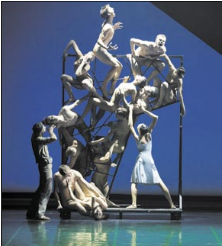
Miłośników Festiwalu im. Adama Didura bardzo ucieszy wiadomość, że po rocznej przerwie znów gościem festiwalu będzie Teatr Baletu z Sankt-Petersburga. Do Sanoka przyjedzie prosto po premierze „Rodina” w Teatrze Wielkim w Warszawie.