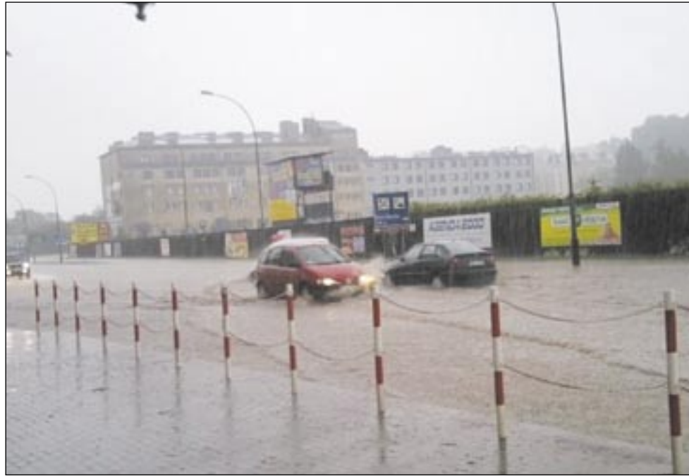
Przed radnymi nic się nie ukryje. Nawet „jeziorko” tworzące się na obwodnicy podczas większych opadów deszczu.

Po miejskich radnych zupełnie nie widać zmęczenia. Na ostatniej przedwakacyjnej sesji gotowi byli przeryć i przewrócić całe miasto. Mnóstwo pytań, jeszcze więcej uwag, innymi słowy: czujność rewolucyjna i aktywność ogromna.