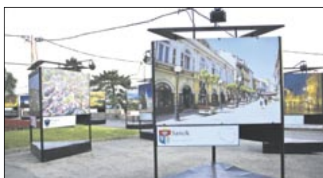
To nie przypadek, że odwiedza nas coraz więcej zagranicznych gości. Nawet w Belgradzie mogą dowiedzieć się o Sanoku.