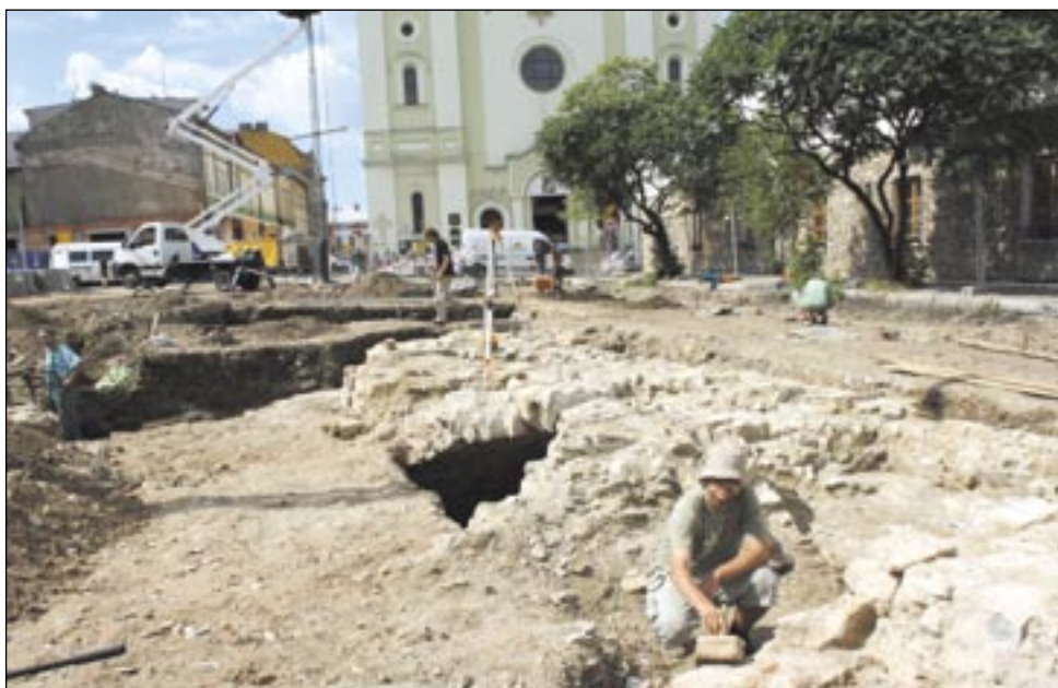
Coraz więcej osób mówi, że szkoda zasypywać odkopane relikty murów gotyckiego kościoła św. Michała. Może uda się wyeksponować przynajmniej jakiś niewielki fragment?