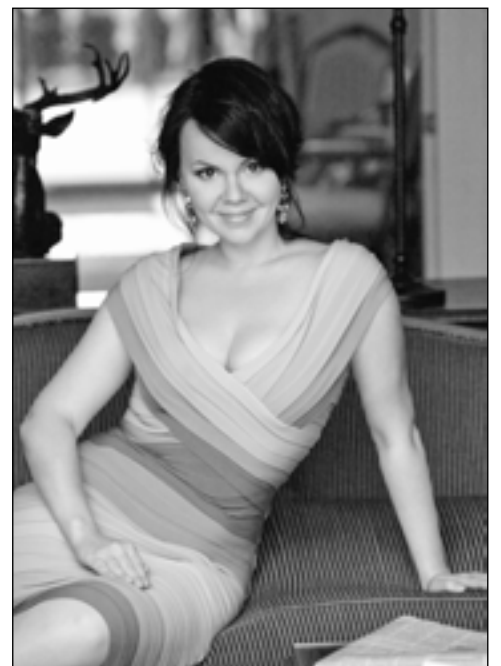
Aleksandra Kurzak – ma dopiero 35 lat, a już jest wielką gwiazdą światowych scen operowych.

I jeszcze jeden hit 22. edycji Festiwalu im. Adama Didura, będący niezwykle odważnym połączeniem opery z muzyką