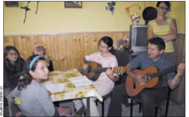
Gitara (a nawet dwie), śpiew, a nawet wydane własnym sumptem śpiewniki. Organizatorzy naprawdę dbają o swoich podopiecznych.

Miłym zwyczajem na rozpoczęcie każdego turnusu są spo-