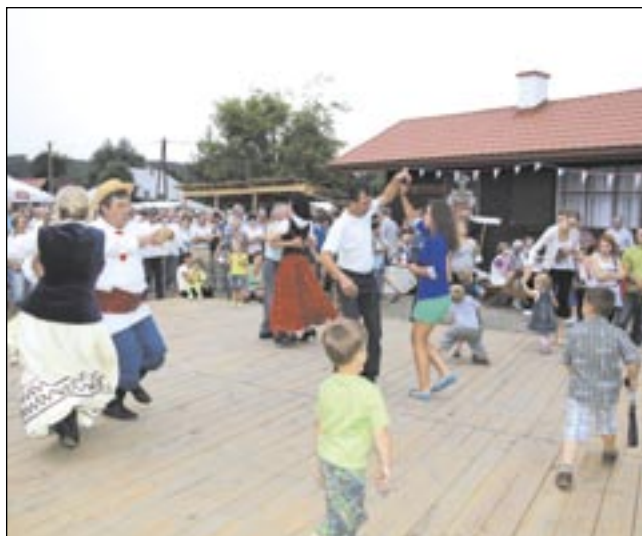
Świetna, udana impreza. Słuchacze liczą na powtórkę za rok!

Na scenie zaprezentowało się siedem kapel ludowych z południowej części Podkarpacia oraz góralska z Lipnicy Wielkiej na Orawie, grające utwory do „tańca i różańca” – skoczne, humorystyczne, czasem refleksyjne, pełne tęsknoty i zadumy. Niektórym trudno było wysiedzieć na miejscu – nogi same podrywały się do tańca! W finale wystąpili wszyscy muzycy, którym