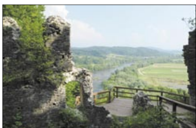
Sobień to naprawdę piękne miejsce. Szkoda, aby zamienić się w dziedziczy zakątek z kupą kamieni.

W regionie mamy zaledwie trzy średniowieczne zamki: w Odrykoniu koło Krosna, sanocki i właśnie Sobień. Zabytki związane z dziejami tego ostatniego znajdują się w naszym Muzeum Historycznym. Nie wiadomo, kiedy zamek powstał. Ze źródeł historycznych wiadomo, że w XIV wieku przeszedł w ręce potężnego rodu Kmitów, pochodzących z Wiśnicza. Dostali go z nadania królewskiego wraz z dobrami leskimi, obejmującymi ogromną część Bieszczadów. Piotr Kmita, przyjaciel Władysława Jagiełły, był jednym z najbogatszych i najbardziej wpływowych ludzi w ówczesnej Polsce. Na pewno gościł u siebie króla i jego małżonkę Elżbietę