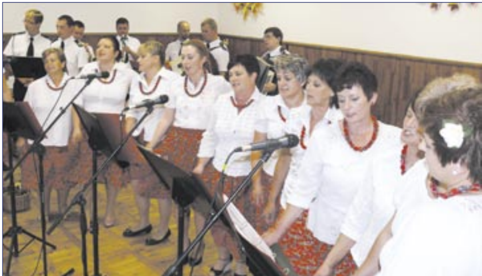
Pracowite, wiecznie młode, tryskające pomysłami – takie jest KGW w Pakoszwóce.

Jakiś niezwykły potencjał musi tkwić w mieszkankach Pakoszwóki, skoro od 1922 roku chcą razem pracować na rzecz swojej wsi i środowiska, w ramach Koła Gospodyń Wiejskich. Panie i panowie, czapki z głów. Koło niedawno obchodziło 90-lecie istnienia! To najstarsze KGW na terenie powiatu sanockiego.