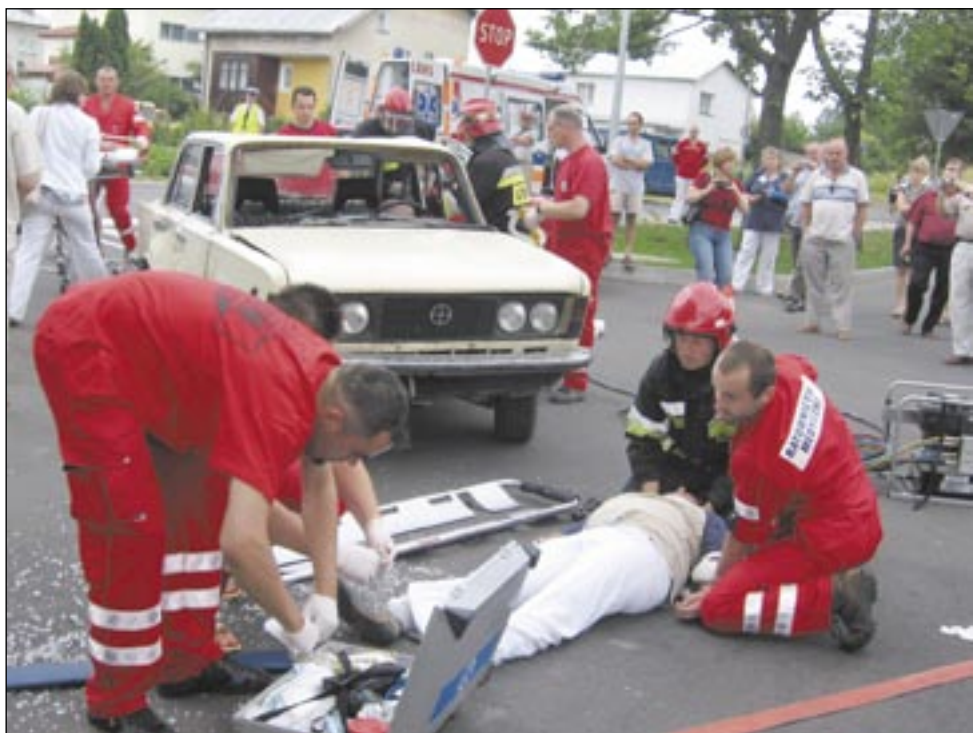
Są na każde wezwanie, śpieszą do każdego wypadku w którym są osoby wymagające pomocy. Zawsze szybko, profesjonalnie, odpowiedzialnie. Można na nich liczyć.

Obydwoje kochają swoją pracę. Nie czują się wypaleni czy zmęczeni ciągłym stresem, nie myślą o błogiej emeryturze. Chcieliby nadal pracować i służyć innym. Bo ich praca ma właśnie wiele ze służby. I za tę długoletnią, rzetelną pracę, za niesienie pomocy drugiemu, Prezydent RP odznaczył ich dwójkę Złotymi Medalami. Docenił ich, a wraz z nimi także i innych, którzy w dzień i w nocy gotowi są śpieszyć na ratunek. I czynią to.