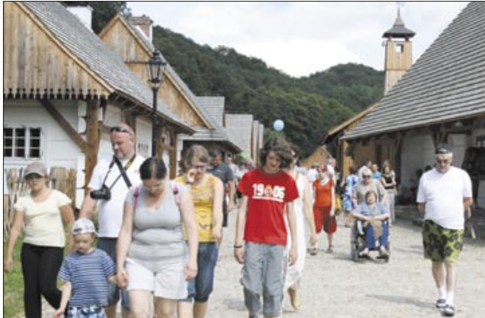
Zwiedzanie Galicyjskiego Rynku zajmuje tak dużo czasu, że wielu turystów zmuszonych jest do zrezygnowania z dalszego zwiedzania skansenu. Czynnąc to zwykle postanawiają: musimy tu jeszcze wrócić!

– W ubiegłym roku frekwencja przekroczyła 100 tys. osób. Marzyliśmy, żeby utrzymać ten poziom. Tymczasem nie tylko utrzymaliśmy go, ale podwyższyliśmy do 150 tys.! To świetny wynik lokujący nas w czołówce wszystkich skansenów. Jesteśmy bardzo zadowoleni, bo generalnie muzea odnotowują spadek zwiedzających. A nasze tylko w sierpniu odwiedziło ponad 30 tys. ludzi – niektóre placówki marzą o takiej