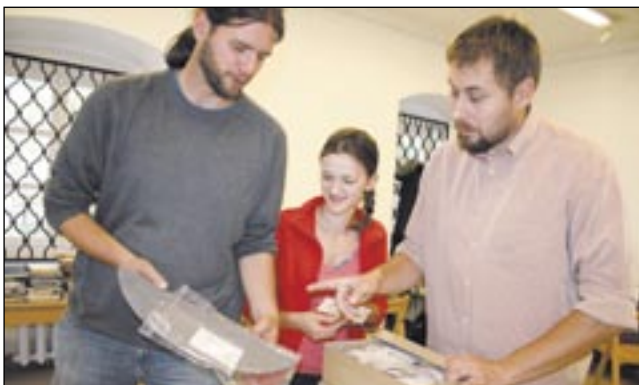
Pracowite lato, pracowita jesień sanockich archeologów. Na zdjęciu – pakowanie eksponatów przeznaczonych do konserwacji.

Najcenniejsze zabytki, znalezione podczas tegorocznych wykopisk archeologicznych na placu św. Michała i Wzgórzu Zamkowym, badacze przekazali już do profesjonalnej firmy konserwatorskiej w Warszawie. W styczniu przyszłego roku wrócą „jak nowe”. Będzie można podziwiać je na wystawie podsumowującej wykopaliska.