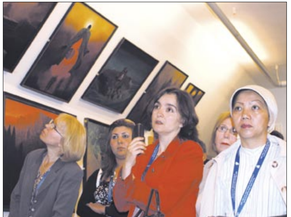
Już niedługo turyści opuszczający Muzeum Historyczne, będą przechodzić przez piękny dziedzińiec. Dziś jest to jeszcze plac budowy.

Przedstawiciele CIT wskazują też na inne ważne dla turystów kwestie – brak informacji w języku obcym oraz niski poziom obsługi. – W sklepach, wypożyczalniach, ale także hotelach i restauracjach informacje często są podawane jedynie w języku polskim. To samo dotyczy dworców i przystanków. Co obcokrajowiec zrozumie z polskiego menu albo pełnego cyfr i liter rozkładu jazdy? Nic. Podobnie jak nie pojmie, że w barze zabrakło lodu, bo poprzedniego dnia było wesoło – a tak właśnie tłumaczył się barman jednego z najlepszych sanockich hoteli... Warto, żeby gestorzy bazy turystycznej zaczęli zwracać na to uwagę i zadbali o odpowiedni poziom kadry. I aby podawali ceny usług na następny sezon