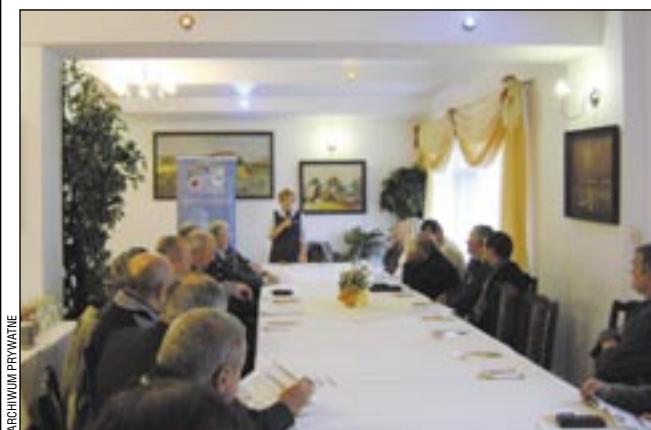
Utworzenie i funkcjonowanie Klubu Pacjenta jest pionierskim projektem „Carintu”, który dowodzi, że lekarze wolą współpracować z pacjentem wyedukowanym.

Kolejne, czwarte spotkanie klubowiczów, zgodnie z harmo-