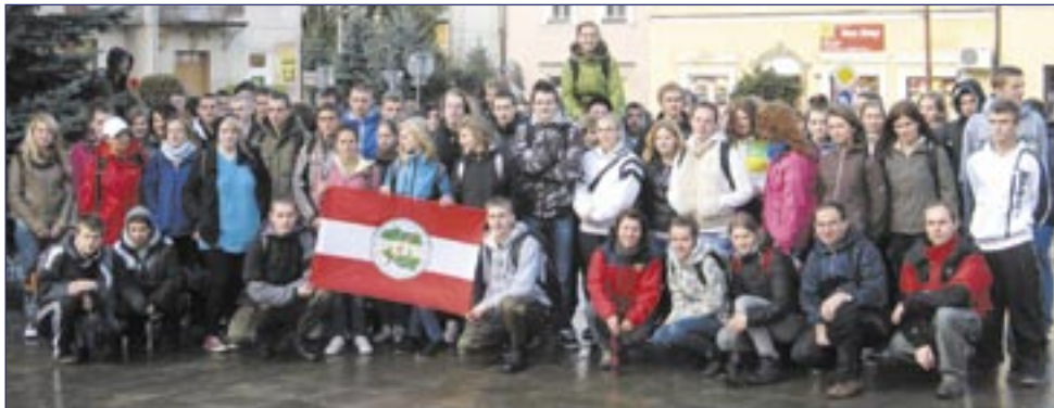
Bez pamiątkowej fotki z flagą PTTK nie może obejść się żadna impreza!

PTTK to jednak niesamowita organizacja. Niedawno przewodnicy zaprosili młodych ludzi na jubileuszowy „Młodzieżowy Rajd po Ziemi Sanockiej”. Jest to – uwaga – najstarsza cykliczna impreza organizowana nieprzerwanie od 50 lat przez Oddział PTTK „Ziemia Sanocka”!