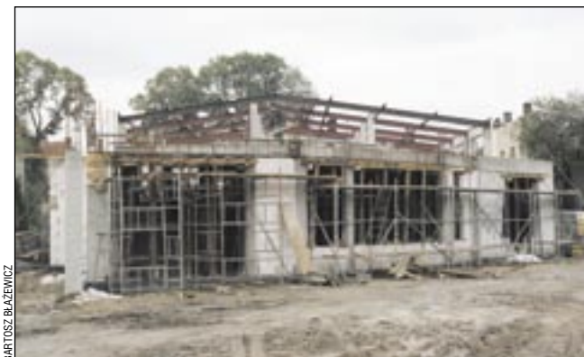
Nowy obiekt rośnie w błyskawicznym tempie.

Niedawno przy ul. Lwowskiej powstał nowy obiekt handlowo-usługowy (sklep SPAR i Strefa Ruchu), a tymczasem w pobliżu – przy skrzyżowaniu z Dworcową – rośnie kolejny.