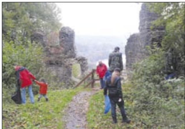
Wolontariusze zebrali w okolicy zamku kilkadziesiąt worków śmieci.

Wolontariuszom udało się posprzątać dziedziniec zamkowy, miejsce poniżej tarasu widokowego, ścieżki i rowy wzdłuż drogi. – Najwięcej śmieci było w bunkrach radzieckich z czasów drugiej wojny światowej, gdzie po ziemi pewnie będziemy musieli akcją powtórzyć, gdyż zabrakło worków! Wypełniłmy czterdzieści, nie licząc opon samochodowych i złomu. Było pół ciężarówki śmieci, za wywóz których zapłaci Nadleśnictwo Lesko