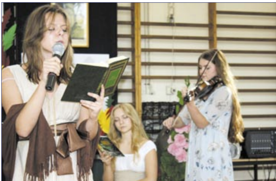
„Pana Tadeusza” czytała młodzież ze wszystkich szkół ponadgimnazjalnych: ZS 1,2,3,4 i 5 oraz I i II LO. Na zdjęciu – fantastyczna ekipa z „jedynki”.

Za sprawą popularnego „Ekonomika” Sanok dołączył do grona miast, w których odbyła się akcja „Narodowe czytanie Pana Tadeusza”, zainicjowana przez prezydenta. Choć nie czytali u nas Jerzy Treła czy Krystyna Janda, impreza wypadła znakomicie, a niektórzy młodzi lektorzy momentami wbijali słuchaczy w krzesła. Nie mówiąc o smaku i aromacie potraw znanych z mickiewiczowskiego arcydzieła, które przygotowała i zaserwowała ekonomikowa kuchnia.