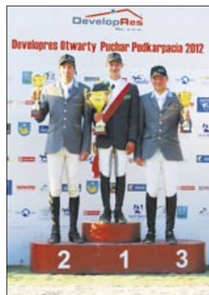
Podium OPP kategoria złota.

KJ LALIN został najlepszym klubem obu imprez, zdobywając 5 medali. A to jeszcze nie koniec... Więcej informacji na stronie oppskoki.pl