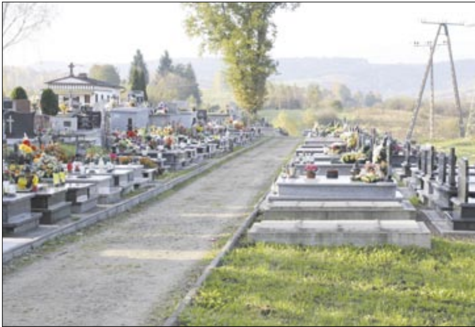
W starej części cmentarza (po lewej) trudno wcisnąć przysłowiową szpilkę. Na zagospodarowanie czeka nowa część (po prawej, w dół). Na pierwszym planie – aleja, która powstała w 2008 roku.

Dojazd na cmentarz Południowy jest uciążliwy, szczególnie dla osób, które nie mają samochodu. Dla starszych to wyprawa na pół dnia (jeździ tam z Wójtostwa autobus nr 2), zimą praktycznie niemożliwa. Tamtejsza nekropolia jest ponadto pozbawiona infrastruktury i wyjątkowo „nieprzystępna”. – Znam przypadki mieszkańców Posady, którzy kazali pochować się w Olchowcach i Zagórzcu, byleby tylko nie „wywożono” ich pod Płowce – zauważa radny.