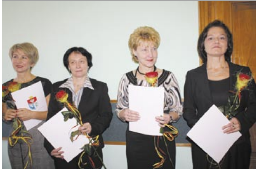
Bycie dziś dobrym nauczycielem to ogromne wyzwanie. Dzień Edukacji Narodowej to świetna okazja, by podziękować im za codzienny trud.

Tradycyjne spotkanie w Sali Herbowej Urzędu Miasta z okazji Dnia Edukacji Narodowej stało się okazją do podziękowania nauczycielom za ich pracę. Wręczono też nagrody burmistrza dla najlepiej pracujących i mających największe osiągnięcia.