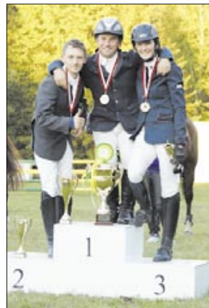
Podium MO seniorzy.