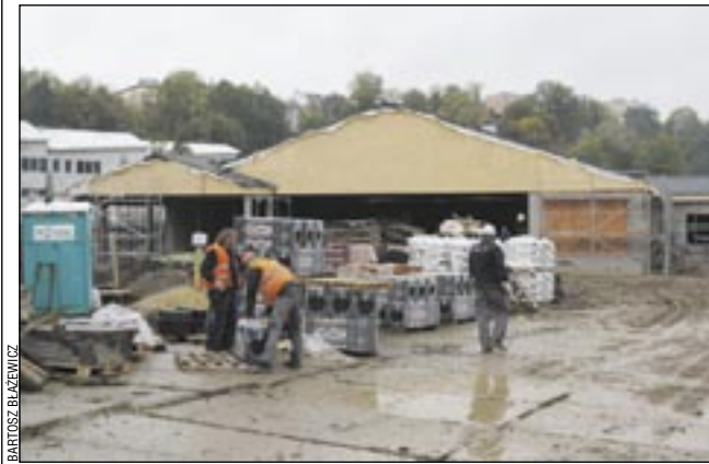
Prace przy budowie Lidla idą pełną parą.

Przed tygodniem pisaliśmy, że w pobliżu dworca szybko rośnie nowy pawilon handlowy, ale chyba jeszcze lepsze tempo prac ma Lidl, powstający na Błoniach. Market powinien być gotowy przed świętami Bożego Narodzenia.