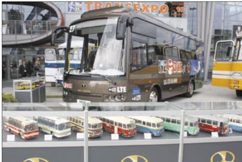
Zestawienie modeli autobusów produkowanych w Sanoku kilkadziesiąt lat temu z aktualną ofertą handlową jest najlepszym dowodem jak ten świat na kółkach się zmienia. Oj, zmienia!

Zegnani przez autosanowców, opuszczamy kieleckie centrum wystawiennicze. Jeszcze raz przechodzimy obok historycznej ekspozycji Autosanu – 180-latk. I jeszcze raz z satysfakcją stwierdzamy, że to przy Sanach, a nie Mercedesach czy Setrach jest największa frekwencja. – Te sanockie autobusy muszą być dobre, skoro ich od tylu lat produkują... – stwierdza ktoś z grupy gości targowych. Potwierdzamy, że chyba tak jest!