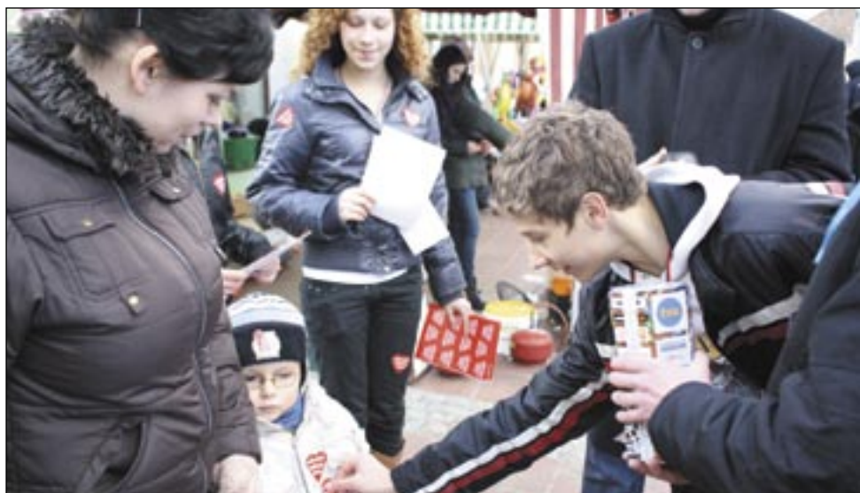
Muzykom Owsiakowej Orkiestry marzy się, aby serduszką WOŚP widoczne były nie tylko na płaszczykach, czapkach i buziach sanoczan podczas wielkiego finału, ale także w sanockim szpitalu na urządzeniach diagnozujących serduszką bieszczadzkich dzieci. Czy to tak dużo?

Kiedy przed rokiem sanoccy sztabowcy WOŚP stroili instrumenty, postanowili być do bólu szczerzy. Powiedzieli w Warszawie: „zagramy, ale mamy prośbę. Oddział dziecięcy sanockiego szpitala pilnie potrzebuje urządzenia do badania serc u dzieci – specjalnego echokardiografu. Najbliższy takowy znajduje się w Rzeszowie. Nie mają go całe Bieszczady, nie ma Sanok, Brzozów, Krosno, Jasło. Bardzo jest nam potrzebny, a nie mamy ok. 150 tys. złotych, aby go sobie kupić”.