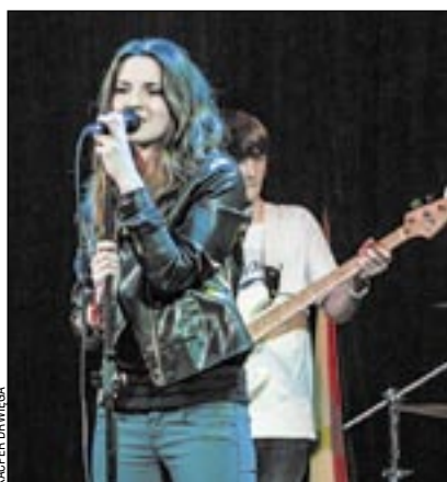
Grupa THE HANDRAILS na scenie.

Rozumiejąc charakter imprezy, wszystkie grupy bez wahania zgodziły się wystąpić za darmo. Na scenie „Górnika” zagrały kolejno: THE HANDRAILS, RAINING BLUNTS, THE REASON i THE CHILLOUD. Zabawa była przednia, a publiczność nie szczędziła grosza podczas zbiórki. Warto dodać, że w akcję zaangażowali się także członkowie Klubu Motocyklowego „Pirates of Roads”.