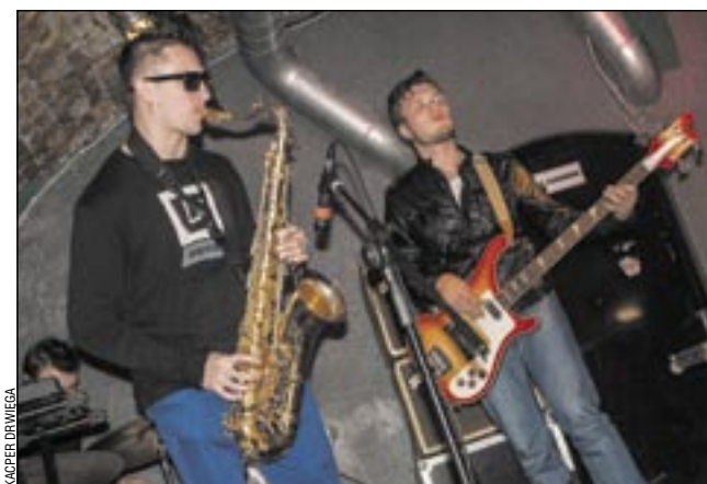
Koncertu grupy NIECHĘĆ publiczność słuchała... chętnie.

Brzmienie jak przepis na egzotyczne danie, a to tylko i aż muzyka! Aż, bo już pierwsze takt przyciągnęły uwagę przybyłej na koncert publiczności. Co prawda nie było ich wielu, za to na pewno nie mieli czego żałować. Performance grupy trwał ponad godzinę, a po każdym utworze zespół otrzymywał jak najbardziej zasłużony aplauz. (kd)