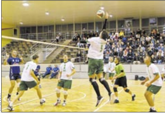
Na inaugurację siatkarze TSV gładko ograli AZS UR Rzeszów.

Pierwszy pojedynek na wyjeździe, ale gra dużo lepsza niż dwa dni wcześniej u siebie z Rzeszowem. TSV imponował zagrywką, świetnie funkcjono-