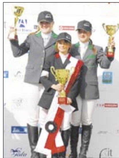
Podium OPP kategoria brązowa.

Jak na mistrzostwa przystąpiło do rywalizacji przystąpiło medalistów Mistrzostw Polski, Halowego Pucharu Polski, zwycięzczy wielu prestiżowych zawodów ogólnopolskich