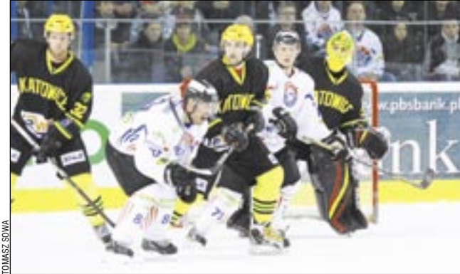
HC GKS Katowice zaczął mocno, pokonując samego mistrza Polski, potem było już tylko gorzej. O miejscu w czołowej czwórce chyba może już tylko marzyć.

1-0 Komorski – Bychawski (4), 1-1 Vitek – Bartoš-Vozdecky (11), 1-2 Kolusz-Milan-Biały (30), 1-3 Malasiński-Kolusz-Zapała (34, 5/4), 2-3 Wiecki-Komorski (40, 5/4).