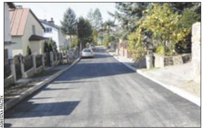
Gdyby tak wszystkie ulice i uliczki Sanoka wyglądały jak ta o nazwie Bojko (na Olchowcach). Ale byłoby pięknie i wygodnie!

Mieszkańcy Sanoka cieszą się z postępujących prac na miejskich drogach. Stan dróg ciągle uważany jest jako priorytet w inwestycjach.