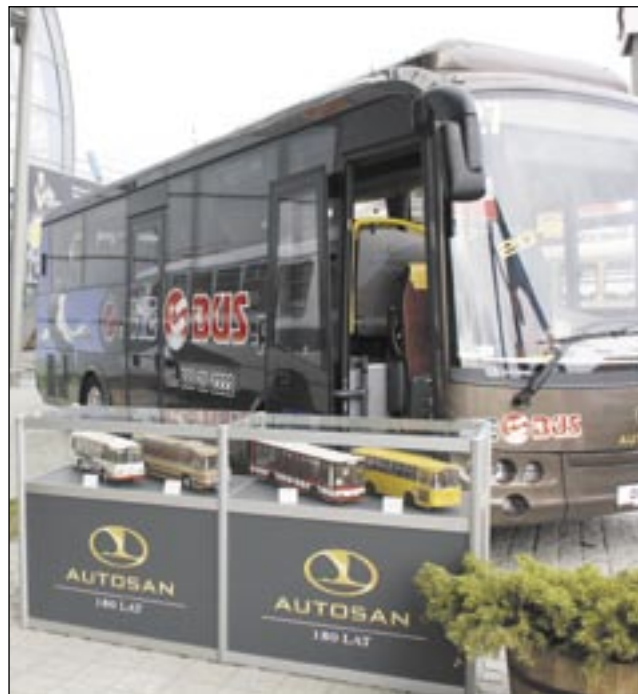
Tradycja i nowoczesność.