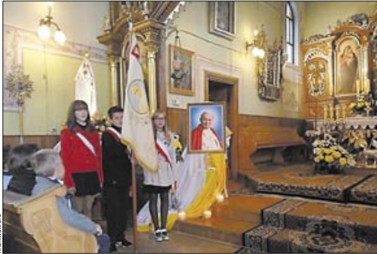
Dzień Patrona Szkoły Podstawowej Nr 6 stał się prawdziwym świętem całego środowiska. Do jego przygotowania włącza się nie tylko społeczność szkoły, ale także rodzice uczniów.