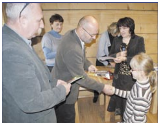
Konkurs pn. „Spacerkiem po Rynku Galicyjskim” – świetny pomysł i równie dobre wykonanie. Dzieci były naprawdę uradowane i szczęśliwe.

szkół podstawowych nr 1, 6 i 7, gimnazjum nr 1 i 3, Specjalnego Ośrodka Szkolno-Wychowawczego, Warsztatów Terapii Zajęciowej w Sanoku oraz Środowiskowego Domu Samopomocy w Zagórzcu.