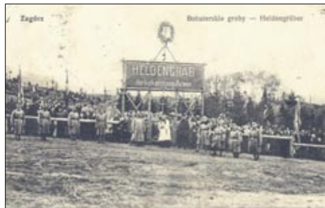
Otwarcie cmentarza w 1917 roku na archiwalnej pocztówce.

Mało kto wie, że cmentarz parafialny w Zagórzcu powstał na grobach austriackich żołnierzy z I Wojny Światowej. Grupa zapaleńców chce zachować ich pamięć przez postawienie pomnika. Pomysł podchwycił austriacki Czarny Krzyż, czyli organizacja kombatantów wojennych.