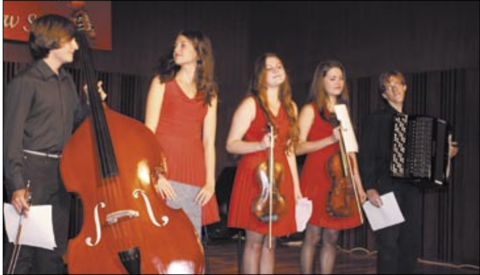
„Creative Quintet” jest odkryciem jubileuszu 40-lecia Państwowej Szkoły Muzycznej w Sanoku. Wystarczył debiut, a już posypały się zaproszenia do występów.

Relację z obchodów jubileuszu 40-lecia Państwowej Szkoły Muzycznej I i II st. im. Wandy Kossakowej w Sanoku zakończyliśmy w poprzednim numerze w momencie, kiedy rozpoczynała się wielka gala. Koncert galowy w tej szkole to musiał być majstersztyk. I był!