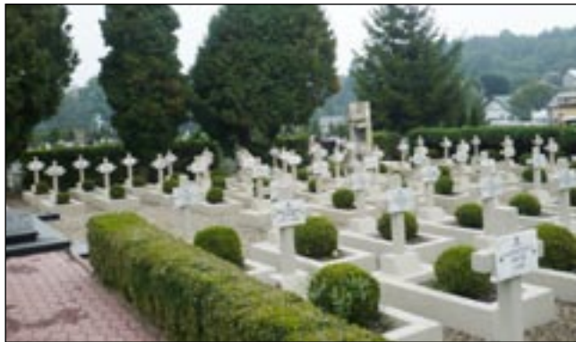
Kwaterna żołnierzy Wojska Polskiego na Cmentarzu Centralnym jest po remoncie godna tego miejsca.

Urząd Miasta w Sanoku zakończył prace na cmentarzach przed Wszystkimi Świętymi. W ich ramach uporządkowano wszystkie sanockie cmentarze komunalne, wysprzątno alejki, uprzątnięto opadłe liście.