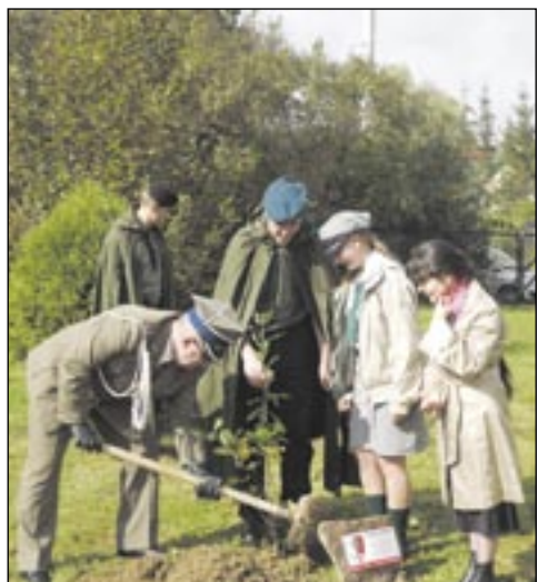
W Katyńskiej Alei Dębów przybyły dwa nowe drzewka.