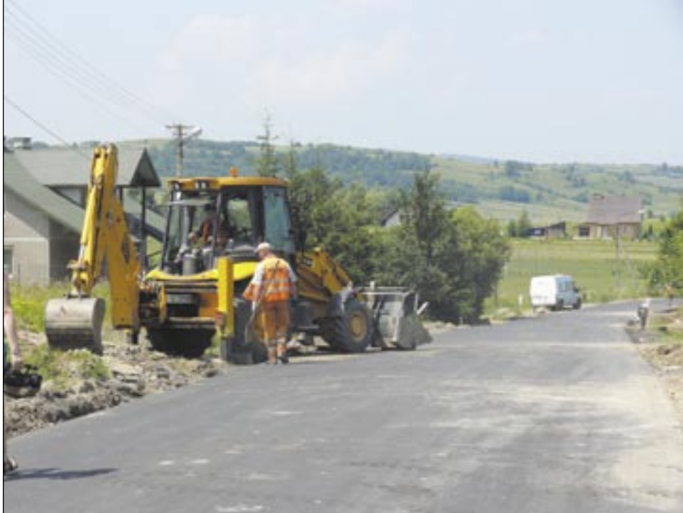
Obyśmy w powiecie i mieście mieli więcej takich „autostrad”! Na zdjęciu przebudowa drogi Prusiek-Wysoczany.

Z kolei Słowacy przebudowali trzy odcinki o długości 13,6 km między miejscowościami Medzilaborce, Humenne, Snina.