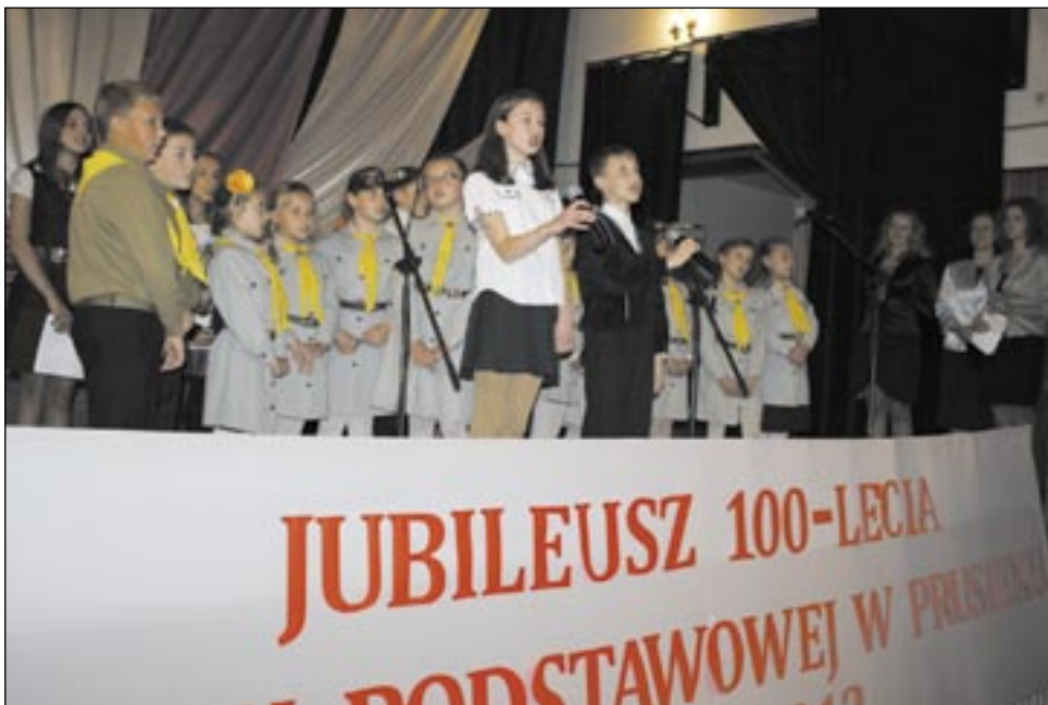
Uczniowie zaprezentowali piękny program artystyczny, dotyczący historii szkoły w Prusieku.