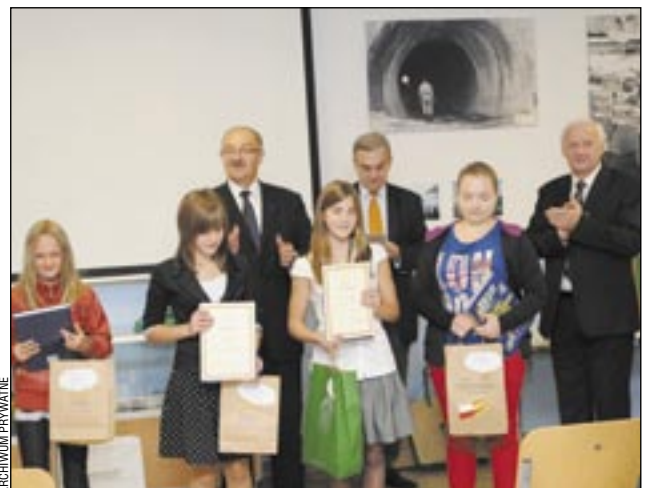
Miło jest wziąć udział w konkursie, ale jeszcze milej znaleźć się w gronie laureatów.