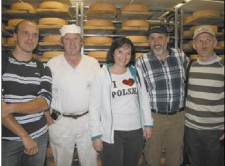
Wizyta u jednego z lokalnych producentów serów szwajcarskich. Młody gospodarz świadczy, że chętnie podzieli się swymi doświadczeniami z polskimi przedsiębiorcami.

Postępuje realizacja projektu „Alpy Karpatom – program na rzecz społeczno-ekonomicznego otwarcia górskich regionów Podkarpacia poprzez transfer praktyk szwajcarskich”. Dwunastoosobowy zespół składający się z przedstawicieli instytucji realizującej oraz partnerów projektu uczestniczył w wizycie studyjnej do kantonów Berno i Valais, gdzie spotkał się z ośmioma szwajcarskimi firmami i instytucjami, których doświadczenia będą wykorzystane podczas szkoleń, oceny wniosków i przyznawania dotacji. Wyjazd został zorganizowany przez Fundację Karpacką – Polska.