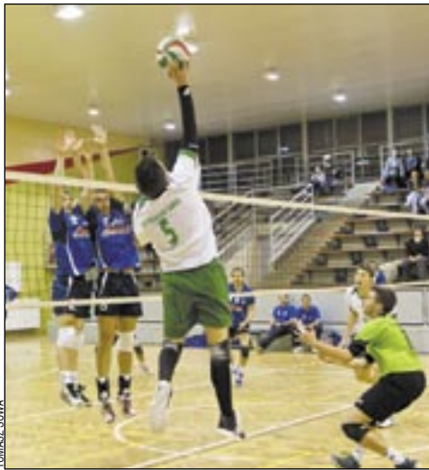
Na początku sezonu siatkarsze TSV Mansard grają bardzo skutecznie.