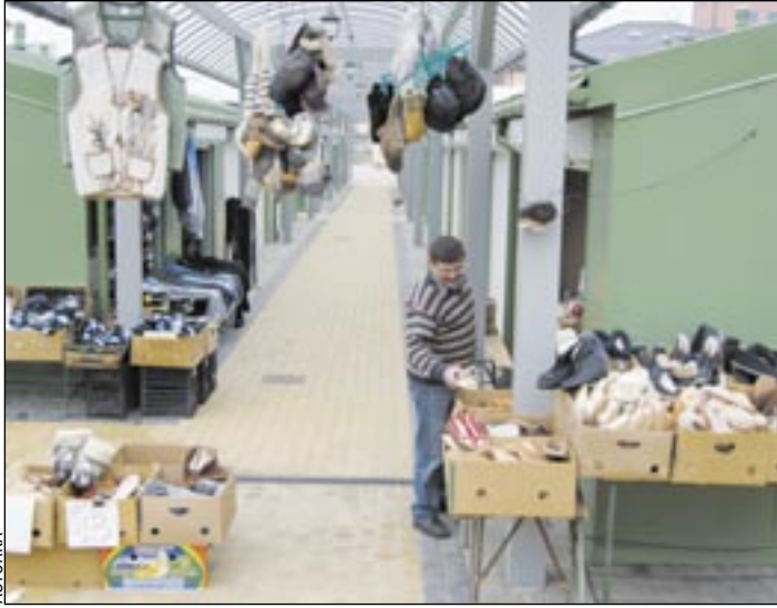
Przy Lipińskiego jest jeszcze do zagospodarowania kilkadziesiąt boksów. Ci, którzy wrócili tu po kilkunastu miesiącach, wierzą, że rynek znów się „rozkręci”.