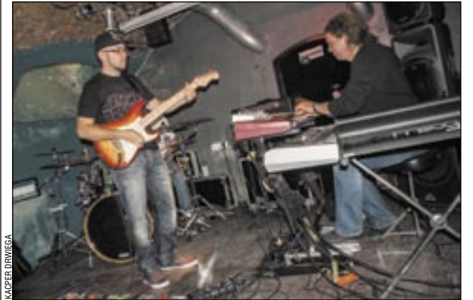
Grupa FUNKY FLOW udowodniła, że nawet przy skromnym instrumentarium można stworzyć odpowiedni muzyczny klimat.