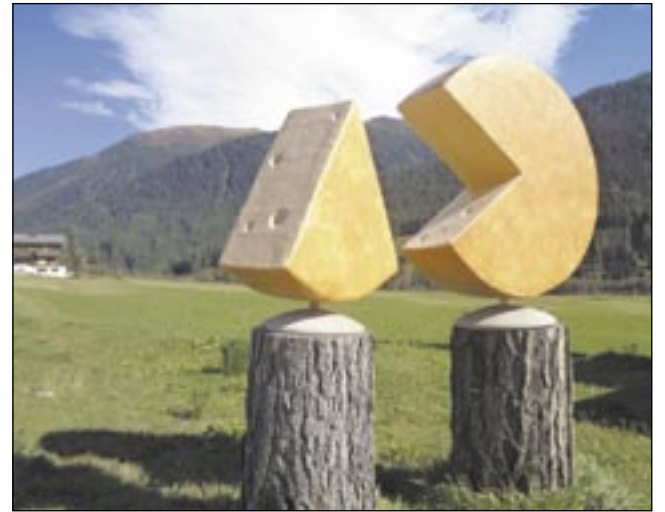
Szwajcarią serami słynąca. I pomyśleć, że nawet z sera można zrobić znakomity produkt promocyjny.

To tylko jedna wizyta studyjna w kraju, który jest niekwestionowanym liderem w zakresie rozwoju produktu lokalnego i turystyki. Model szwajcarski od wieków stanowi nieustającą inspirację dla innych. Niechby stał się także dostarczycielem dobrych praktyk dla mikro i małych firm w naszych górskich regionach. Gra jest warta świeczki, gdyż nie tylko jest szansą większej gry o jutro, ale także okazją do sięgnięcia po dofinansowanie na realizację różnego rodzaju pomysłów. To wielka zasługa Fundacji Karpackiej – Polska, która wymyśliła genialny projekt „Alpy Karpatom”. Dzięki niemu z dofinansowania będą mogli skorzystać wszyscy ci, którzy skorzystają z praktyk szwajcarskich. Mogą także liczyć na organizację, które będą chciały wdrożyć te pomysły w życie. Tak więc jest to mechanizm, który ma prawo zafunkcjonować. I to dobrze. Jak w szwajcarskim zegarku!