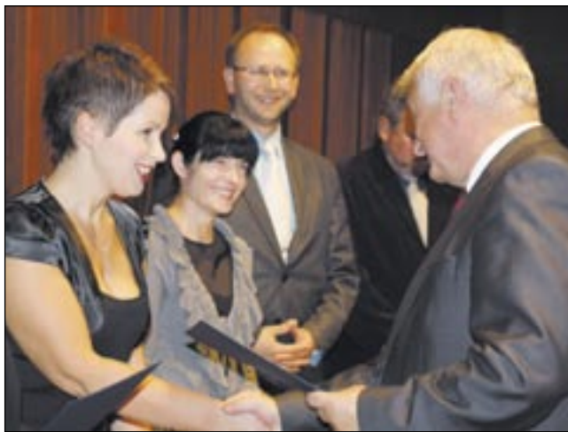
Medale medalami, ale nagrody dyrektora Centrum Edukacji Artystycznej Ministerstwa Kultury i Dziedzictwa Narodowego też potrafią ucieszyć, co widać po minach osób nagradzanych.