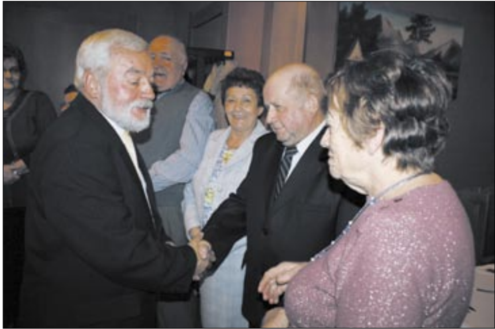
Najpierw medale, dyplomy, ale równie ważny jest uścisk dłoni prezesa.

Nigdy nie cierpią z powodu złej frekwencji. Na wszystkie spotkania, pielgrzymki, wycieczki czy ogniska meldują się zwykle w pięćdziesięcioosobowym składzie. Mowa o sanockim kole Polskiego Stowarzyszenia Diabetyków, tudzież o oddziale rejonowym PSD. W sobotę spotkali się tradycyjnie, jak co roku, z okazji Światowego Dnia Walki z Cukrzycą. W tym roku przebiegał on pod hasłem: „Cukrzyca. Chrońmy naszą przyszłość!”