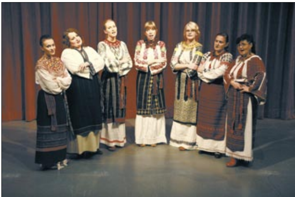
Muzyka Karpat w wykonaniu artystek z zespołu „Widymo” podobała się niemieckiej publiczności.