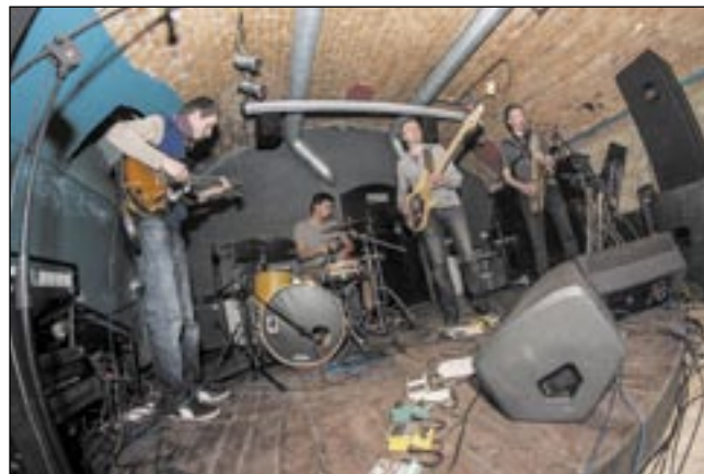
Grupa 10000 SZELEK znów zagrała w „Panice”.

Przedostatnią odsłoną „Jesiennych spotkań z muzyką alternatywną” w Klubie Pani K. był koncert grupy 10000 SZELEK. Mieszanka Indie, jazzu i szczypty innych stylów dała bardzo ciekawy efekt.