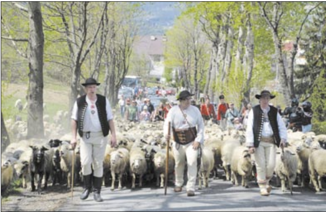
Czy owce powrócą na bieszczadzkie poloniny? Organizatorzy przyszłorocznego Redyku Karpackiego mają nadzieję, że będzie on przedsięwzięciem, które na nowo wypromuje pasterstwo.

W ramach redyku 300 owiec będzie prowadzonych z Rumunii przez Ukrainę do Polski i Czech, w sumie 1400 km, z zachowaniem pełnej obrzędowości. Redyk ma upamiętniać tradycje wołoskich pasterzy. Owce, w zdecydowanej większości rumuńskie,