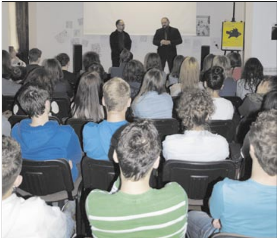
Na każdym seansie dla szkół sala BWA była wypełniona po brzegi.