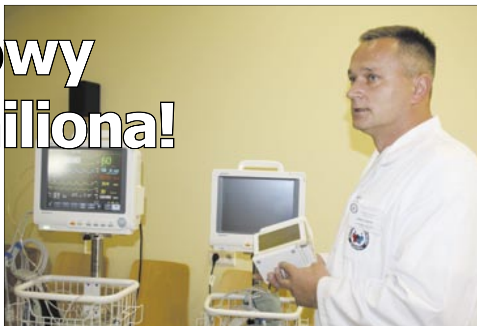
Kardiomonitor to urządzenia nieocenione przy monitoringu funkcji życiowych pacjenta.

Zakupiono 18 urządzeń należących do 7 różnych grup. Wszystkie niezbędne, aby ratować pacjentów trafiających na oddział ratunkowy. Wśród nich całkowite novum: urządzenie (2 szt.) do mechanicznego masażu serca. Obowiązujące wytyczne nakładają szczególny nacisk na rolę precyzyjnego, nieprzerwanego masażu. To urządzenie ten