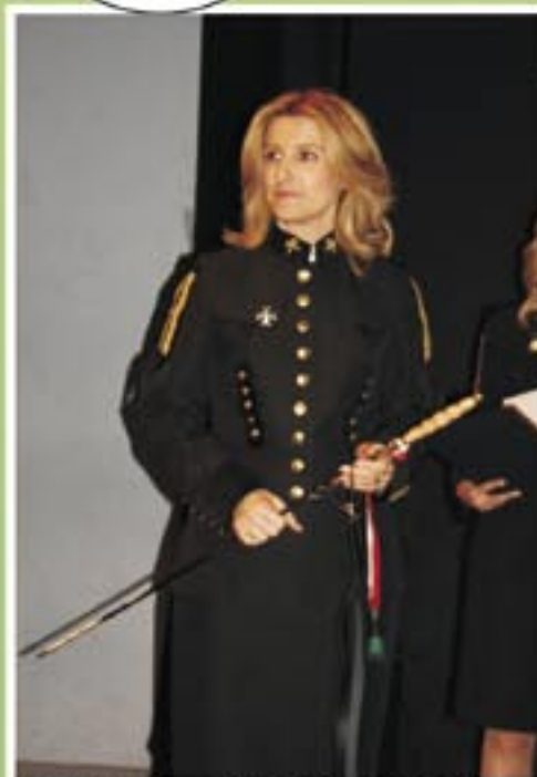
Szabla w ręku nowej Pani Prezes PGNiG okazała się niezmiernie niebezpieczną bronią. Wycięła prawie całą dyrekcję sanockiego oddziału i rozwaliła – w ramach restrukturyzacji – całkiem niezłe funkcjonujący organizm.