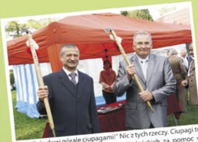
„Pobili się dwaj górale ciupagami!” Nic z tych rzeczy. Ciupagi to nagroda od Brygady Strzelców Podhalańskich za pomoc w organizacji uroczystości wręczenia sztandaru Batalionowi Logistycznemu Brygady.