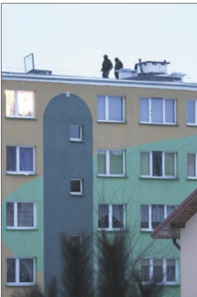
Pierwsza klatka, 3 piętro. Antyterrorysty sprawdzają możliwość szturmu z dachu.