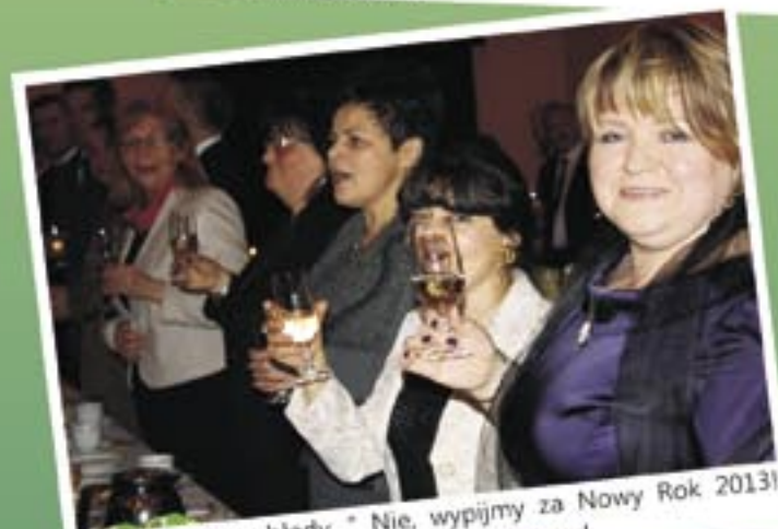
- „Wypijmy za błędy...” Nie, wypijmy za Nowy Rok 2013! Iniech nikt nas nie straszy, że będzie okropny!