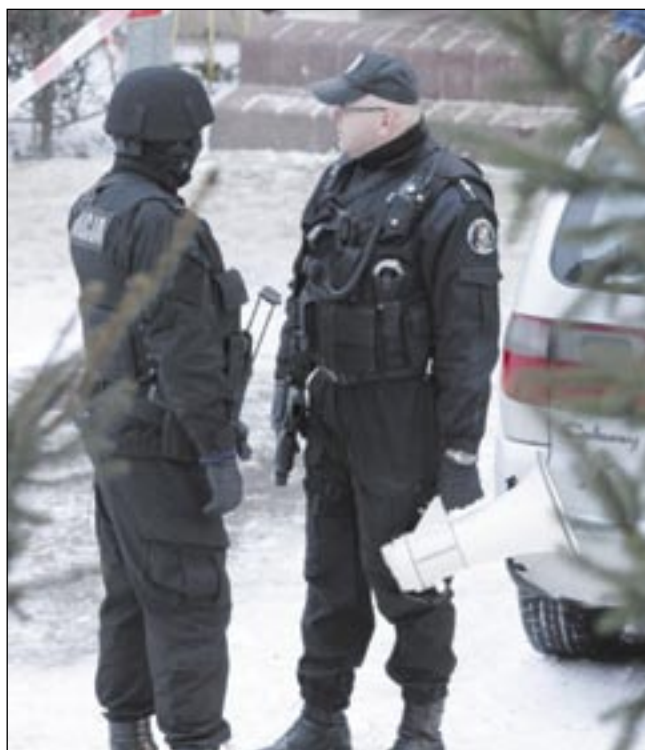
Takie obrazki mieszkańcy osiedla oglądali dotąd wyłącznie w filmach.