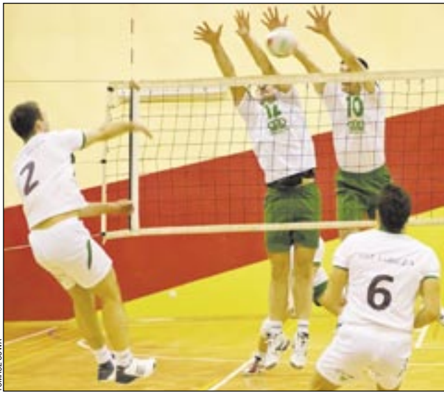
Szczelny blok TSV był dla rywali nie do sforsowania.

– Dotąd naszym najlepszym meczem w sezonie był wyjazdowy pojedynek z Lubczą, ale dzisiejszy rewanż przed własną publicznością zagraliśmy na jeszcze wyższym poziomie. Fakt, rywal popełnił sporo błędów, ale to też trzeba umieć wykorzystać. Oczywiście wciąż w naszej grze są małe mankamenty, które trzeba poprawić. Pierwszy raz w roli przyjmującego wystąpił młody Przemek Chudziak, który po wy-