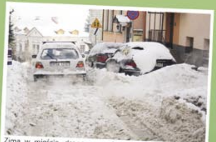
Zima w mieście, drogowcy zaskoczeni! Kiedyś się z tego tłumaczyli, dziś mówią: to jest po prostu zima, a z naturą jeszcze nikt nie wygrał!