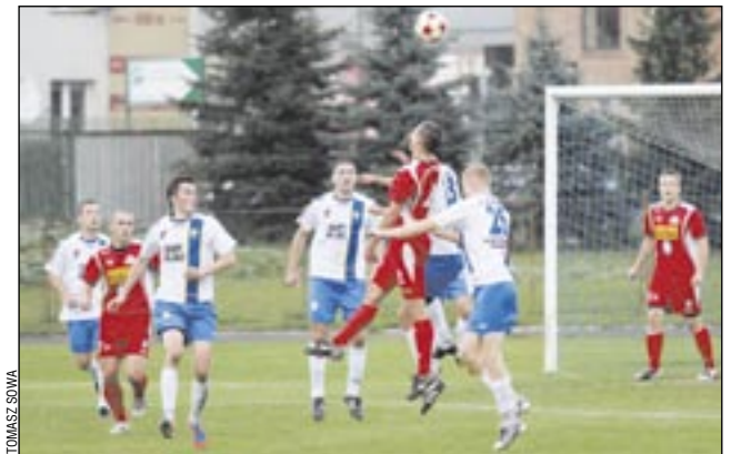
Kibice liczą na to, że wiosną Stal będzie grała równie dobrze, jak w rundzie jesiennej.