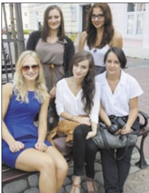
Gdyby punktowano nie tylko wiedzę, ale i urodę, sanockie licea byłyby w czołówce...

Wśród 500 ujętych w ranking szkół ogólnokształcących najlepsze okazało się XIV LO Polonii Belgijskiej we Wrocławiu, a na Podkarpaciu – Liceum Jana Pawła II Sióstr Prezentek z Rzeszowa (10 w kraju!), za którym uplasowały się dwa „Koperniki” – z Krosna i Mielca. Z sanockich liceów najwyżej – na 161. miejscu – sklasyfiko-