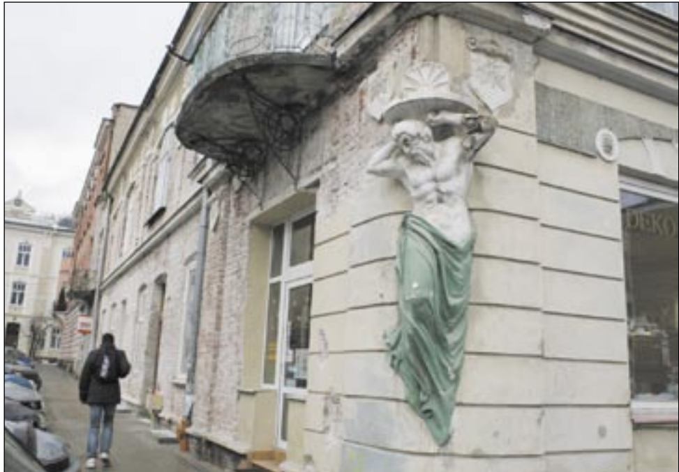
Kamienica przy ulicy Kazimierza Wielkiego po remoncie będzie prawdziwą ozdobą śródmieścia.

Jesienią ubiegłego roku ruszył remont kamienicy przy ulicy Kazimierza Wielkiego 6, znanej jako Dom „Pod Atlasem”. Budynek – według niektórych jeden z najpiękniejszych nie tylko w Sanoku ale i na Podkarpaciu – odzyska blask latem tego roku.