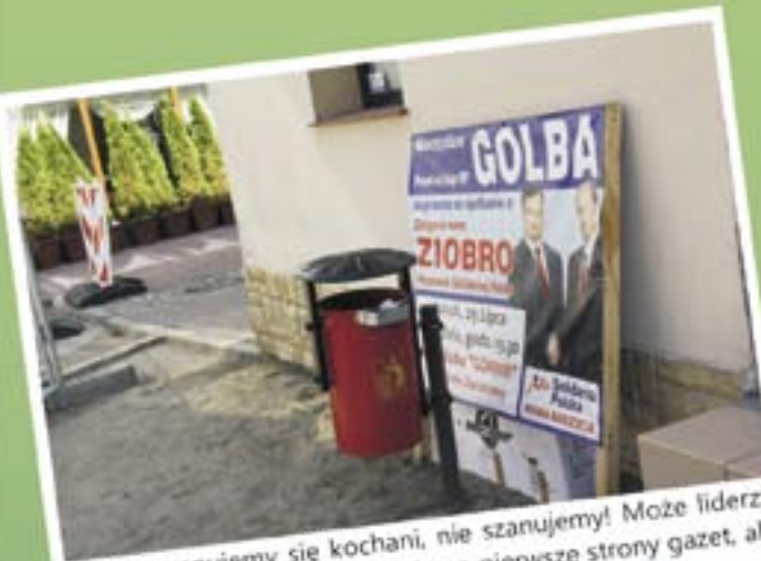
Oj, nie szanujemy się kochani, nie szanujemy! Może liderzy Solidarnej Polski rzadko trafiają na pierwsze strony gazet, ale żeby od razu do kosza... Nie, to gruba przesada!