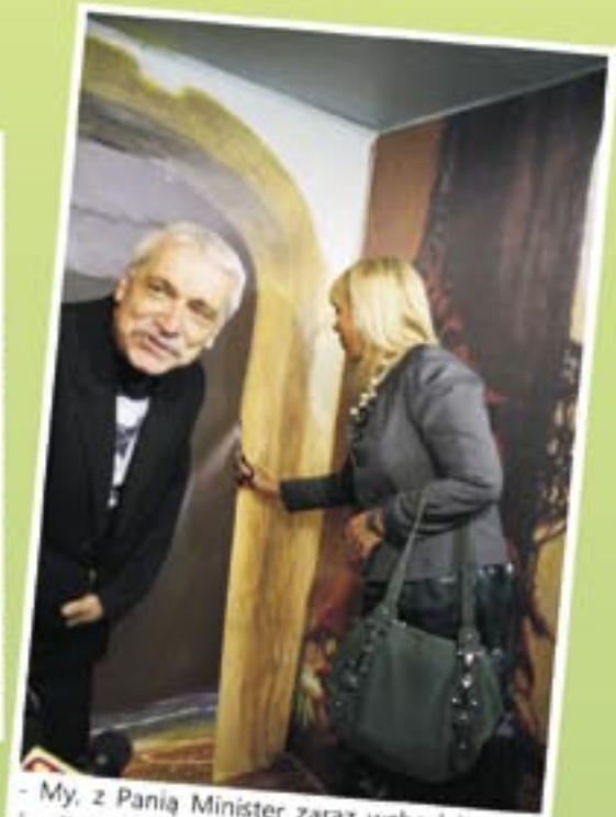
- My, z Panią Minister zaraz wchodzimy do środka, a Państwo jak chcecie. Otwarcie Galerii Zdzisława Beksińskiego w nowym skrzydle sanockiego zamku.