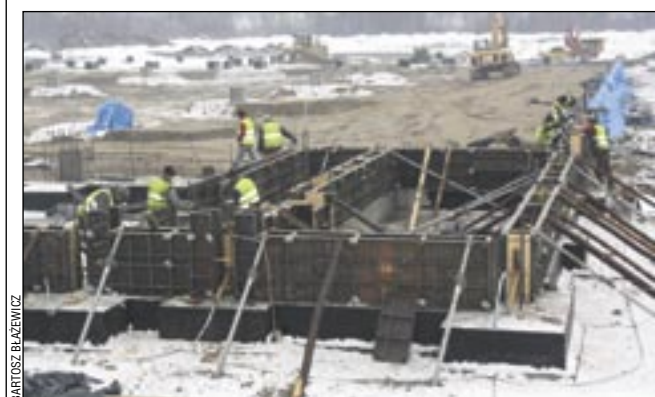
Prace przy budowie fabryki idą pełną parą.

czątkowo załoga liczyć będzie około 70 osób, a w 2014 roku ma zostać podwojona. Docelowo w zagórskim oddziale TRI Poland zatrudnienie powinno znaleźć około 250 osób. Zainteresowanie pracą jest bardzo duże, wpłynęło ponad pół tysiąca podań, głównie z naszego terenu.