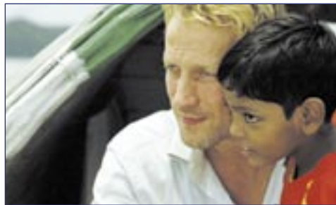
Kadr z filmu „Raju”.