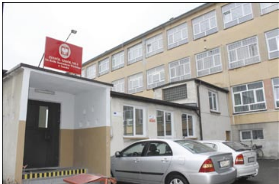
Zespół Szkół Budowlanych w innym budynku nigdy nie byłby już sobą. To groziłoby jego unicestwieniem.

W związku z pracami nad strategią oświaty w powiecie sanockim, pragniemy przedstawić argumenty, które pozwolą unocznic wszystkim, jak ważna jest dla nas szkoła i jak istotne jest pozostawienie jej w obecnej siedzibie.