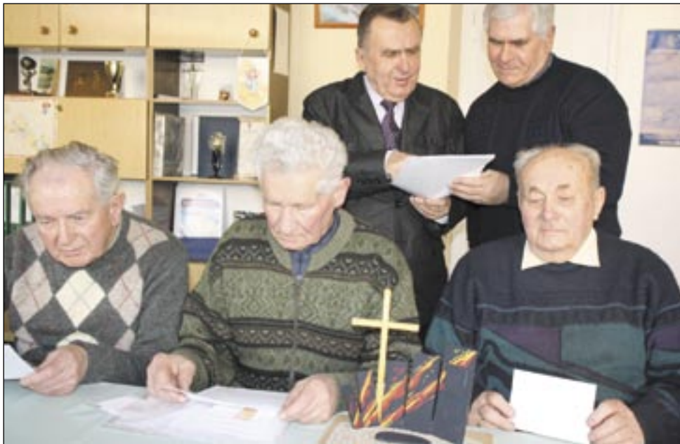
W przyszłym roku przypada 70. rocznica tragedii i przedstawiciele Posady zrobią wszystko, aby do tego czasu pomnik powstał – makieta widoczna jest na zdjęciu.

– Rekrutacja pracowników rozpoczęła się od naboru na stanowisko Lidera w Dziale Produkcji. Wyselekcjonowaliśmy kandydatów, których doświadczenie i umiejętności odpowiadały stawianym przez nas wymaganiom. Potem nastąpiła rozmowa z pracownikami Działu Personalnego oraz szereg różnych testów. Ostatni etap stanowiła rozmowa z dyrektorem ds. personalnych. Wybrani przez nas kandydaci w lutym rozpoczną pracę w Wolbromiu. Podczas kilkumiesięcznego szkolenia poznawane będą procesy produkcyjne, podejście do zarządzania jakością oraz bezpieczeństwa i higieny pracy. Ponadto na program szkoleń składają się będą treningi z zakresu umiejętności interpersonalnych, niezbędnych przy zarządzaniu zespołem pracowników.