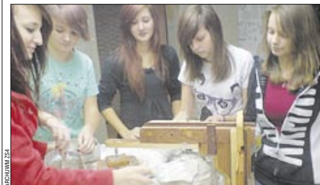
Pracownia sztukarska. Ciąglenie brył obrotowych na rdzeniu.

Od września 2012 r. w sanockiej szkole budowlanej (Zespół Szkół Nr 4) uczniowie klasy pierwszej podjęli naukę w zawodzie „technik renowacji elementów architektury”. Nowy kierunek jest kontynuacją zawodów „konserwacji i renowacji zabytków”, w jakich wcześniej kształciła Budowlanka.