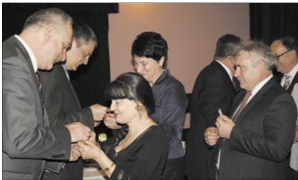
Nie ma „niedźwiedzi”, ślinienia, zarażenia grypą. Można? Pewnie, że można. I to nawet bez uchwytów w tej sprawie.