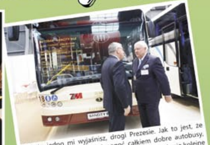
- Może jedno mi wyjaśnisz, drogi Prezesie. Jak to jest, że produkujecie takie ładne i ponoć całkiem dobre autobusy, a w Sanoku wróble ćwierkają, że w fabryce szykują się kolejne zwolnienia?