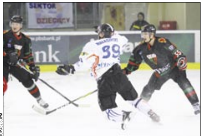
To nie prawda, że nie walczyli, że nie dali z siebie wszystkiego. W sporcie nie zawsze zwyciężają faworyci.

Hokej w Sanoku nie zginie, gdyż jest on wartością, która wiele dla tego miasta znaczy. Mało tego, dla wielu Polaków jest tym, z czego ten gród nad Sanem jest znany. Poza tym warto zauważyć, że zmienia się polski hokej. Być może za kilka lat będzie cieszył się znacznie większą popularnością, będą kochały go