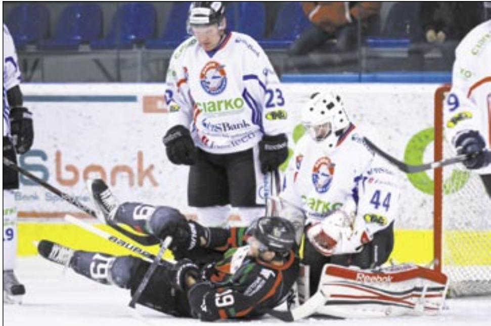
W sportowej rywalizacji, inaczej niż na zdjęciu, to Tychy były górą!