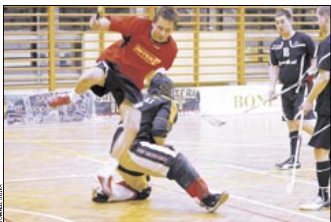
Na razie drużyna InterQ tańczy tak, jak jej zagra esanak.pl.