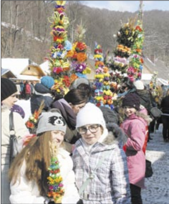
W przepięknej, niepowtarzalnej scenerii obchodzone w Sanoku Niedzielę Palmową. Więcej zdjęć na naszym Facebooku.

uplasowały się palmy: Przedszkola nr 3 w Sanoku oraz Szkoły Podstawowej w Mrzygłodzi. W tej kategorii także przyznano dwa wy-