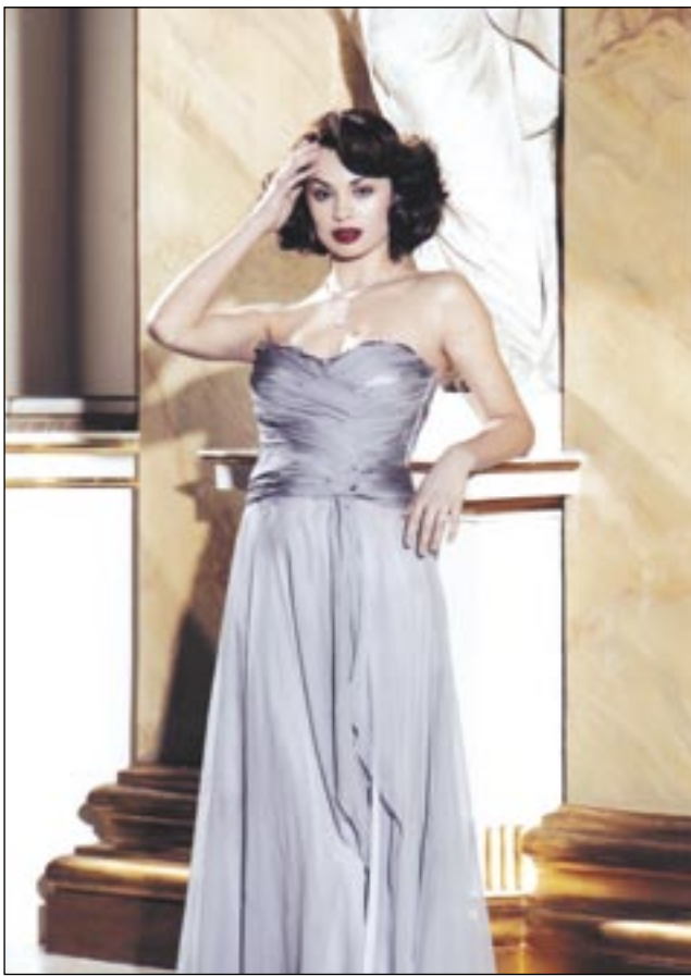
Ania w wydaniu gwiazdy filmowej.

Niespełna dziesięć lat później przyszło jej przeżyć jeszcze większy dramat. Większy, bo już miała trzynaście lat, była myślącą, rozumiejącą wiele dziewczynką. To było rozstanie z matką. Pa-