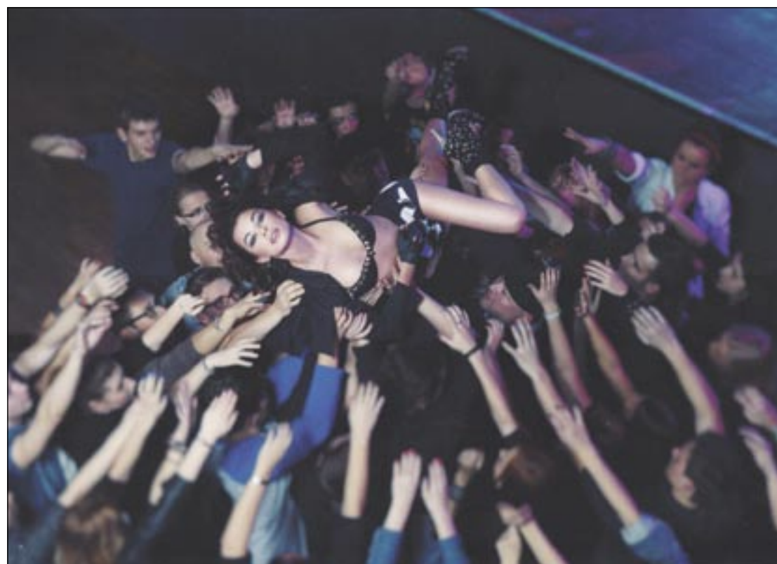
Podziwiają ją mężczyźni, kochają obiektywy aparatów fotograficznych.