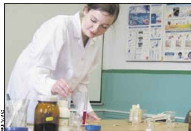
Młodzi naukowcy w akcji...

Gimnazjaliści zaprezentowali swoim młodszym koleżankom i kolegom liczne pokazy z różnych dziedzin nauki. Goście mogli zobaczyć ciekawe doświadczenia fizyczne i chemiczne, odwiedzić krainę figur geometrycznych, przenieść się w czasy panowania królowej Zofii, poczuć klimat londyńskiego Muzeum Figur Woskowych Madame Tussaud. Nie zabrakło również „Kuchni polskiej” oraz „Czerwonego Eko-Kapturka”.