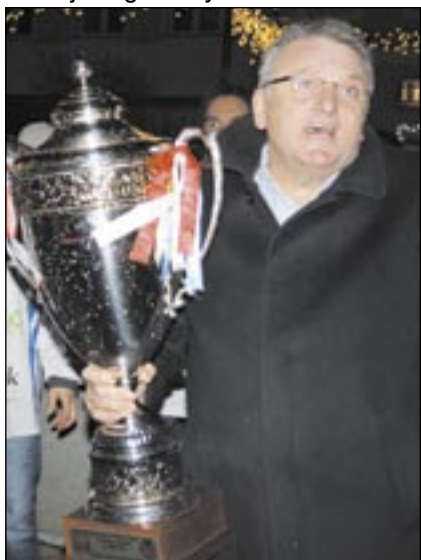
Jeszcze kiedyś będzie tak pięknie jak przed rokiem. Uwierzyć!

– Oczywiście. Już dziś mogę zapewnić, że miasto nadal będzie utrzymywać obiekt „Arenę”, że wspólnie z Radą Miasta zadamy, aby hokeiści spełniający wymagania regulaminu otrzymywali stypendia sportowe. Jako gospodarz miasta nadal będę zachęcał obecnych sponsorów do dalszego wspierania sanockiego hokeja na lodzie i namawiał do sponsoringu inne firmy. Innymi słowy, zrobię wszystko co w mojej mocy, aby na skutek nienajlepszego dla nas sezonu, hokej nie ucierpiał.