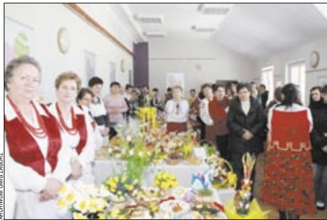
Pięknie przystrojone stoły uginały się od wielkanocnych potraw.

Każdy z konkursowiczów otrzymał dyplom i nagrodę rzeczową, drobne upominki wręczono także pozostałym uczestnikom kiermaszu. Imprezę uświetnił występ zespołu śpiewaczego POŁANCE działającego przy