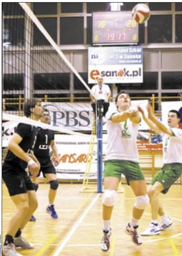
Mimo pierwszej porażki u siebie siatkarze TSV wygrali finał III ligi.