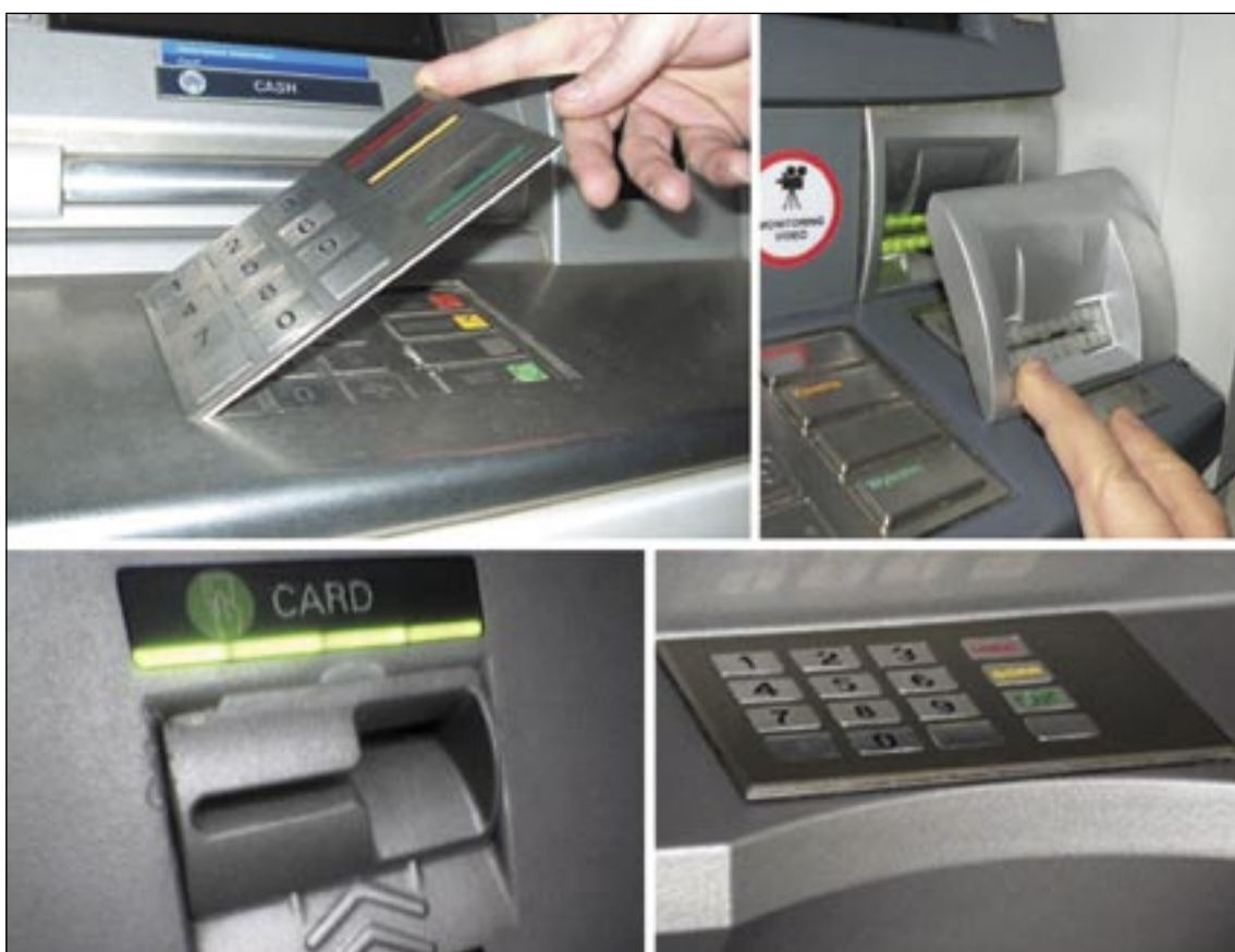
Przykłady nakładek bankomatowych stosowanych przez skimmerów. Niekiedy są tak ładnie zrobione, że bez uważnego „oglądu” nie sposób ich zauważyć.