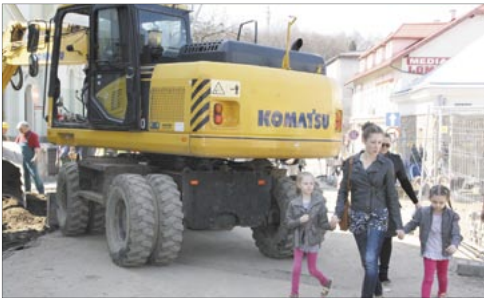
Pracujące koparki i chodzący obok ludzie to nie jest dobre zestawienie. Nikt jednak nie miał odwagi, aby zamknąć centrum na czas robót budowlanych.

Dziś jednak nie da się już nic zrobić. Wykonawca musi trzymać się projektu, a jakiegokolwiek zmia-