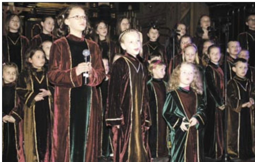
Koncert z okazji beatyfikacji Jana Pawła II, z udziałem sanockich zespołów i solistów, był wydarzeniem. Czy stanie się nim także przygotowywana przez muzyków płyta?

czym się pochwalić. W naszym mieście i okolicy działa wiele naprawdę dobrych zespołów, utalentowanych muzyków, wokalistów, instrumentalistów.