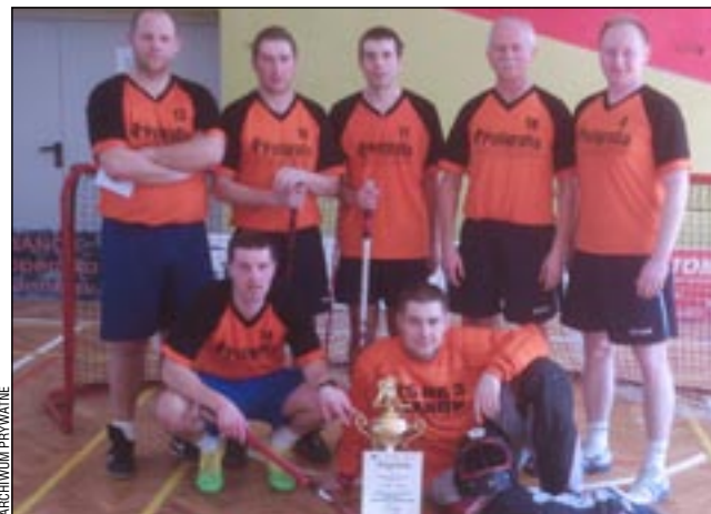
Drużyna ZS3 obroniła tytuł, w finale rewanżując się faworyzowanej ekipie SOS-W za wcześniejszą porażkę.

Mecze grupowe: ZS3 – SP1 1-2, SOS-W – G1 7-2, ZS5 – ZS3 0-4, SP1 – SOS-W 0-3, G1 – ZS3 2-3, ZS5 – SOS-W 1-5, SP1 – G1 2-0, SOS-W – ZS3 4-1, ZS5 – G1 1-7. Półfinały: ZS3 – SP1 3-2 po dogrywce, SOS-W – G1 4-3. Mecz o 3. miejsce: G1 – SP1 2-1. Finał: SOS-W – ZS3 0-1.