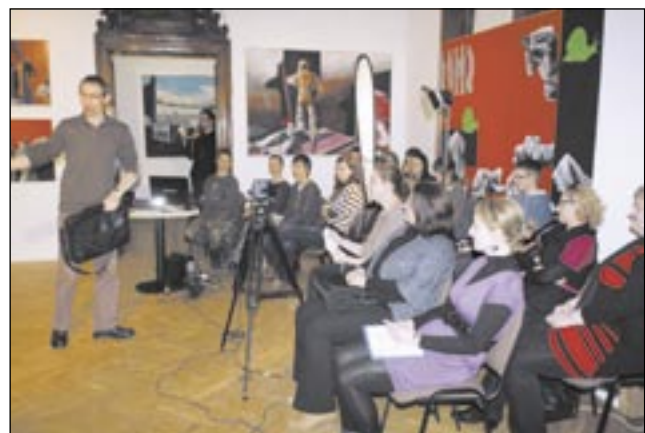
I uczestnicy, i prowadzący wysoko ocenili warsztaty.

Ponad 20 osób przez dwa popołudnia zgłębiało pilnie tajniki filmowego rzemiosła na warsztatach w Galerii Sanockiej. Adresowane głównie do nauczycieli zainteresowanych zdobyciem podstawowych umiejętności, związanych z realizacją (z uczniami podczas zajęć szkolnych) autorskich projektów filmowych, skusiły także kilkoro gimnazjalistów i studentów.