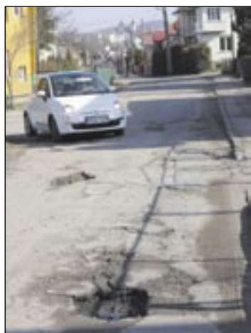
W miejscu, gdzie widać samochód, kończy się porządny asfalt i zaczyna „zadupie”.

Wśród dziurawych sanockich ulic są ulice w złym i w dramatycznym stanie. Konarskiego należy do kategorii tych drugich.