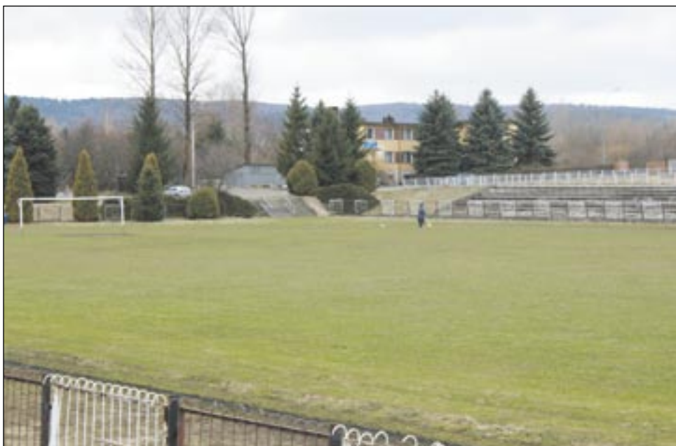
W obecnym stanie stadion przy ul. Stróżowskiej nie nadaje się do rozgrywania meczów III ligi. Ale w ciągu roku może zostać zmodernizowany na tyle, by spełniać podstawowe warunki.

Niestety, radość trwała tylko dwa miesiące, a nawet krócej, bo pierwszy był oczekiwaniem na ostateczną decyzję kontrahenta. Nie odstąpił od transakcji, więc wydawało się, że wszystko zmierza w dobrym kierunku. Tymczasem nagle na klub spadła wiadomość o decyzji rządu, który wykreślił blisko połowę zadań drogowych,