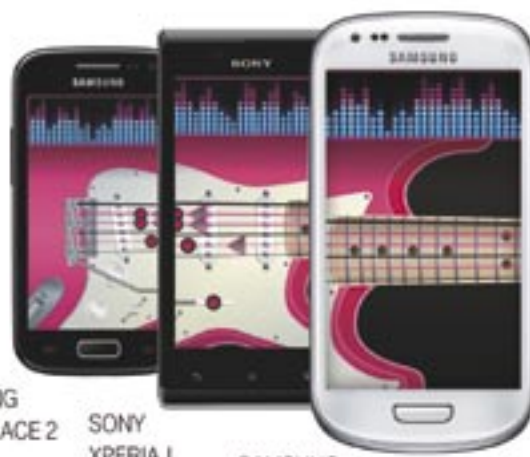
SAMSUNG GALAXY ACE 2