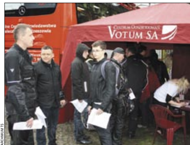
Przed rokiem większość potencjalnych krwiodawców odeszła z kwitkiem. Tym razem będzie inaczej.

Już w niedzielę do Sanoka po raz drugi zawita ogólnopolska akcja MOTOSERCE. Tym razem organizujący ją u nas Klub Motocyklowy PIRATES OF ROADS zdecydował się na zbiórkę krwi w lokalnej stacji, bo ubiegłoroczny przyjazd krwiobusu był kompletnym niewypałem.