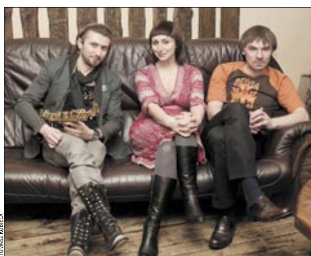
Inicjatorka pleneru i jej goście.