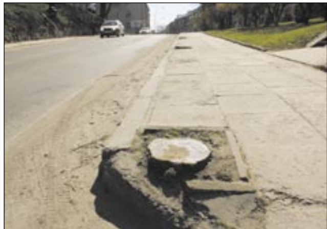
Drzewa wycięto, ale w ich miejsce posadzone zostaną nowe.