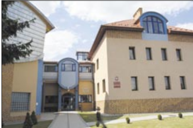
Instytut Techniczny przy ul. Reymonta imponuje wyglądem i wyposażeniem.

Bezkonkurencyjna w kategorii PWSZ – podobnie jak w kilku poprzednich latach – okazała się Państwowa Wyższa Szkoła Zawodowa z Kalisza, której prestiż, siłę naukową i bazę oceniono najwyżej (100 pkt). Dystans kolejnych w rankingu obrazują różnice punktowe zaczynające się od 30 pkt w górę. Krośnieńska uczelnia otrzymała ich 65, przemyska – 64, sanocka – 52. Najwięcej punktów zebraliśmy za warunki studiowania, powyżej średniej oceniono siłę naukową szkoły, znacznie gorzej – jej prestiż i umiędzynarodowienie oraz innowacyjność (pozyskiwanie środków z UE).