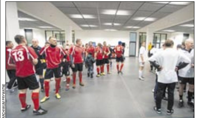
Reprezentacja PGNiG (po lewej) już przed wyjściem na murawę czuła atmosferę Stadionu Narodowego.

Ośmiu zawodników z sanockiego oddziału weszło w skład reprezentacji PGNiG, która na Stadionie Narodowym w Warszawie zmierzyła się z kadrą OGP GAZ-SYSTEM SA, pewnie zwyciężając 4-1.