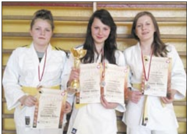
Nasze „fighterki” przywoziły komplet medali.