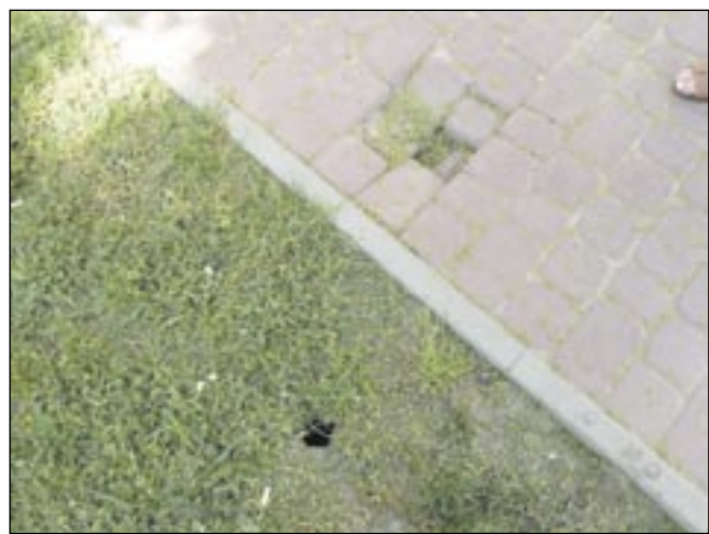
Szczury niszczą chodniki, kopiąc pod spodem tunele.

W różnych punktach miasta zapadają się chodniki. Jak się okazuje, winowajcami nie są kiepscy wykonawcy, tylko... szczury!