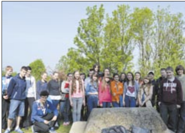
Uczniowie G2 spędzili dzień pełen wrażeń.

Uczniowie Gimnazjum nr 2 w bardzo aktywny sposób uczcili święto patronki szkoły – Królowej Zofii.