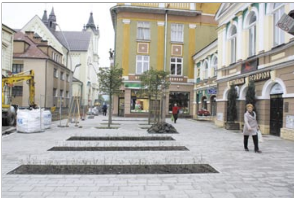
Plac przy skrzyżowaniu ulic Grzegorza i Kościuszki (na zdjęciu), Wałowa czy część ulicy Sobieskiego będzie nosiła imię ks. prałata Adama Sudoła?

Entuzjazmu nie wykazują też sanoccy historycy. Jak się dowiedzieliśmy, temat był omawiany na jednym ze spotkań sanockiego oddziału Polskiego Towarzystwa Historycznego. Jego członkowie podnoszą jeden zasadniczy argument: nazwa „Wałowa” ma głębokie uzasadnienie historyczne i wzięta się stąd, że przebiegał tamtędy średniowieczny mur, opasujący miasto. – Nazwa ta, podobnie jak Rynek czy ulica Cerkiewna, świadczy o przeszłości Sanoka. Przeglądając księgi miejskie z XVII i XVIII wieku