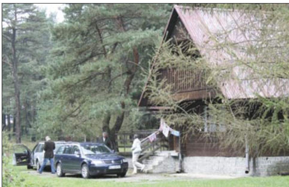
Jeszcze w ubiegłym roku „Sosenki” przyjmowały ostatnich gości. Na zdjęciu – tzw. domek rzepecki. Sprzedając „Sosenki” miasto powinno zadbać, aby powstał tam również bardzo potrzebny w Sanoku autocamping i pole namiotowe.

Z drugiej strony, jaki jest sens, aby ośrodek stał przez kolejne lata niewykorzystany, całkowicie podupadając? Miasto nie ma możliwości i pieniędzy, aby weń inwestować – samorząd nie jest od prowadzenia działalności gospodarczej. Na razie „Sosenki”