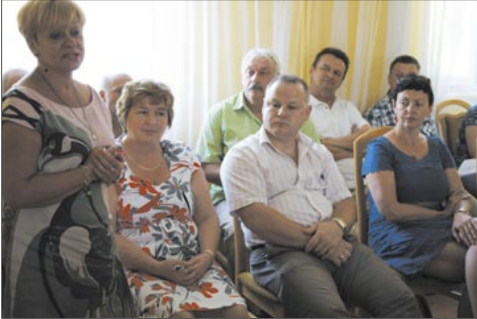
Mieszkańcom Zagórza, do niedawna nazywanego „kolejarskim miastem”, nie jest obojętny los kolei. Toteż licznie przybyli na spotkanie poświęcone temu tematowi.