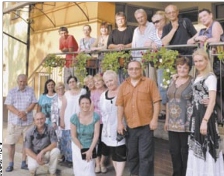
Uczestnicy pleneru na pamiątkowej fotce. Wspaniale, że komuś chce się organizować takie spotkania, że ludzie poznają się, wzajemnie ubogacają.