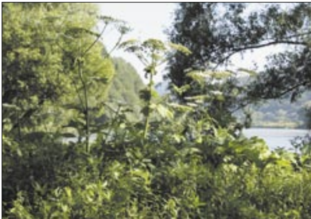
Barszcz rosnący za Carrefourem sięga już prawie 3 metrów.

Swego czasu gmina Zagórz czyściła brzegi Ostawy z barszczu Sosnowskiego, teraz podobna akcja przydałaby się nad Sanem. Jeżeli nie zrobi się jej szybko, paskudna roślina zapyli i za rok będzie jej sto razy więcej. Nie można do tego dopuścić.