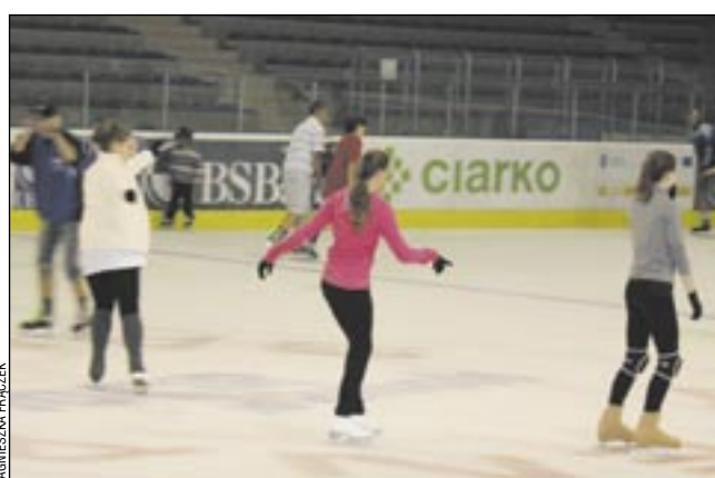
Jedni mówią: ten Sanok jest boski, skoro w upale można ślizgać się na lodzie. Inni odpowiadają: w lecie wolelibyśmy się kąpać w słońcu i pluskać w wodzie. Najlepiej w aquaparku.

Ślizgawki będą się odbywać w dni weekendowe, bowiem na co dzień na sanockim lodowisku trenują sportowcy. MOSiR, wzorem roku ubiegłego, planuje odrębne organizowanie tzw. „ślizgawek junior”. Ich celem jest zapewnienie większego bezpie-