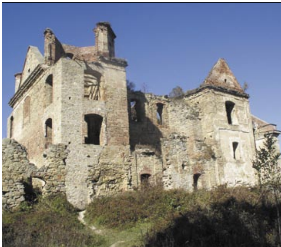
ARCHIWUM UMIEJĘTNOŚCI ZAGÓRZA