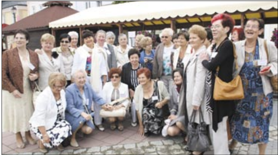
„Klasztor” sprzed pięćdziesięciu lat, czyli Jubilatki LO 41 podczas zjazdu. Oczywiście wyłącznie w żeńskim składzie.

To była szkolna namiastka przyszłorocznego Światowego Zjazdu Sanoczan. Ale jakże ważna. Wszak nieczęsto dochodzi do spotkań po pięćdziesięciu latach od jakiegoś ważnego wydarzenia. 29 czerwca 2013 roku w Sanoku odbył się Jubileuszowy Zjazd Absolwentów Liceów „MATURA 1963”. Jego rangę podnosi fakt, iż był to pierwszy w grodzie Grzegorza złoty jubileusz obchodzony wspólnie przez absolwentów Żeńskiego i Męskiego Liceum Ogólnokształcącego.