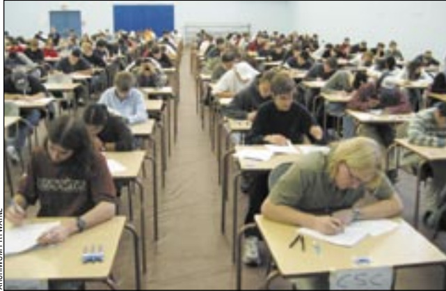
Rodzice coraz uważniej śledzą rankingi. Szkoły muszą coraz bardziej się starać, aby uczniowie dobrze wypadli podczas egzaminów podsumowujących kolejne etapy nauki.

Nas, oczywiście, interesują szkoły sanockie, które działają