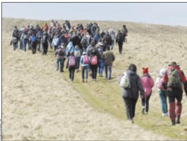
W najbliższą niedzielę turyści znów ruszą na wycieczki z PTTK.

Organizatorem akcji już tradycyjnie jest Oddział PTTK „Ziemia Sanocka” oraz działające przy nim Koło Przewodników Beskidzkich, Terenowych i Pilotów Wycieczek. Wszystkie wyprawy prowadzone będą atrakcyjnymi trasami przez doświadczonych przewodników. W bogatej ofercie znajdują się wy-