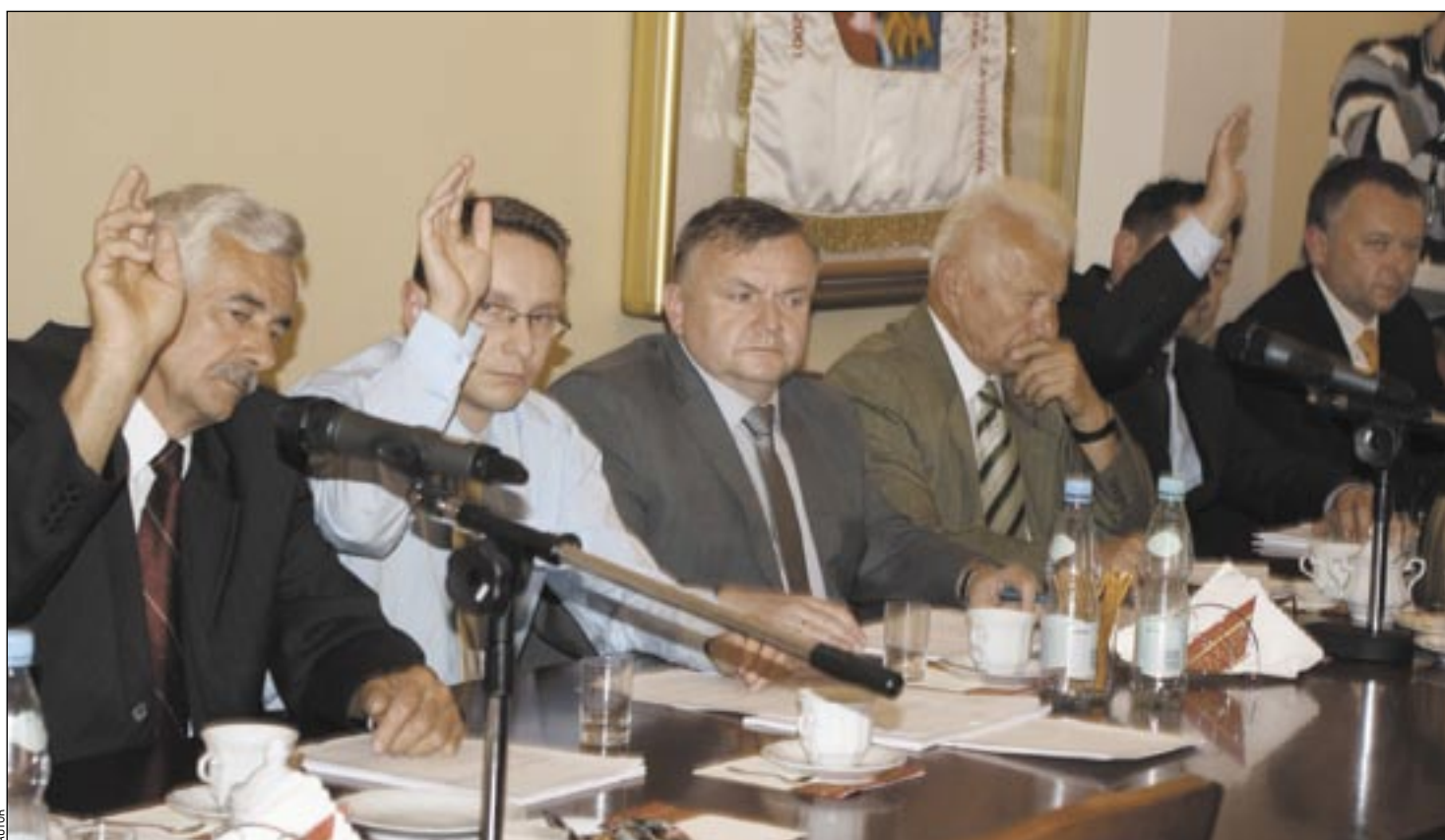
Straszyli, zapowiadali przewrót, a gdy doszło do rozgrywki, tylko część z nich zdecydowała się podnieść rękę, gdy głosowano za nieudzieleniem absolutorium Zarządowi Powiatu.

Chcę również zauważyć, że w tym czasie zrealizowane zostały na znacznie mniejszą