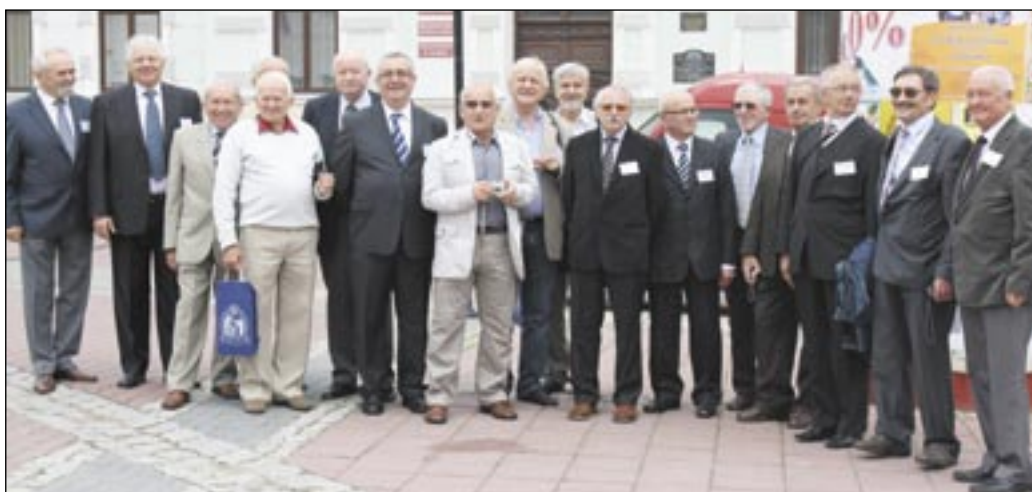
A to absolwenci zjazdu „Matura 63” reprezentujący LO 40 w licznym 25-osobowym składzie. Czysto męskim, a jakże!

Miejska Biblioteka Publiczna ul. Lenartowicza 2, tel. 13-464-57-50 (sekretariat), 13-464-57-51 (czytelnia), 13-464-57-52 (wypożyczalnia). www.biblioteka.sanok.pl Czynna: pon.-pt. 9-17, sob. 9.30-14.