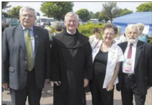
Wspólne zdjęcia z pielgrzymki będą miłą pamiątką dla jej uczestników.