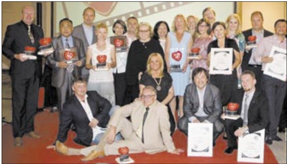
Na pierwszym planie w gronie laureatów.