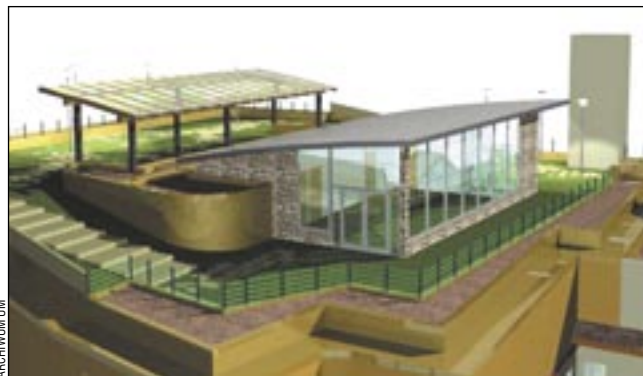
Dach garażu wielopoziomowego przy Łaziennej i od razu pomysł: jak go urządzić. Oto jeden z nich: kawiarenka w dwóch wydaniach: zimowym (ta oszklona) i letnim.