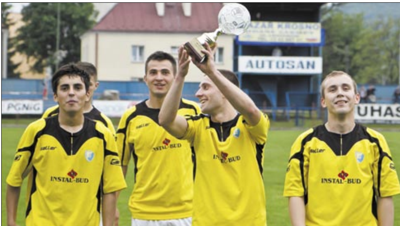
Gdyby sanocka Stal, przy kłopotach jakie przeżywa, potrafiła wysadzić z Pucharu Polski I-ligową Puszcę Niepołomicze, byłby to jeden z cudów świata. Ale w końcu cuda się zdarzają... Piłkarskiej młodzieży życzymy kolejnych takich zdjęć ze zwycięskim pucharem w ręku.