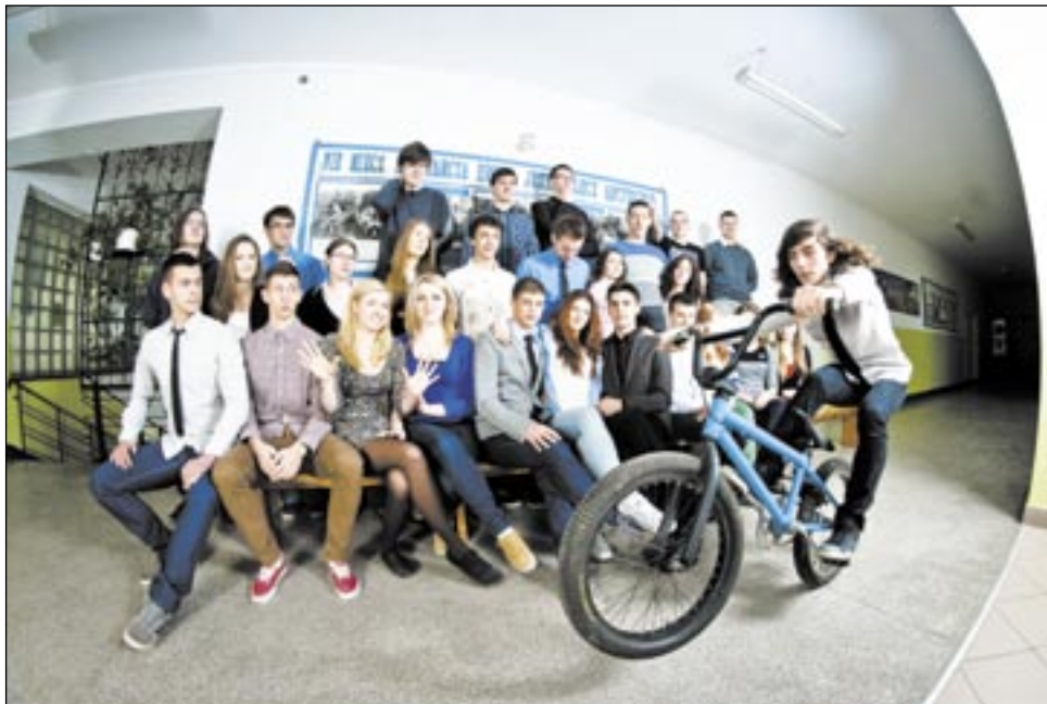
W tym roku uczniowie z II LO świetnie poradzi sobie z maturą.

matury zdają bardzo trudny egzamin zawodowy, gdzie muszą uzyskać minimum 75 proc. Oznacza to, że młodzież jest u nas bardzo dobrze nauczana, co jest zasługą świetnych nauczycieli, którym składam niskie ukłony – podsumowuje dyrektor Pospolita.