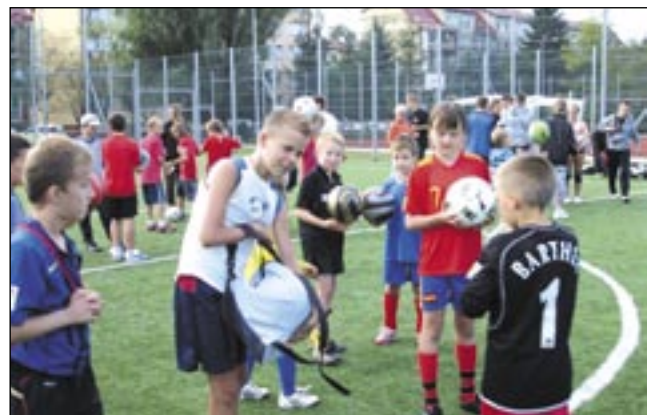
Sportowe wakacje zainaugurowane. Oby przez całe dwa miesiące wszystkie sanockie Orliki, tak jak ten na Błoniach, tętniły gwarem i radością.

Dobłą tradycją dzielnicy Błonie jest organizowana impreza pn. „Sportowe wakacje”, inaugurująca czas letniego wypoczynku. Z myślą o zapewnieniu dzieciom rozrywki, o potrzebie integrowania się i propagowaniu zdrowego stylu życia, co rok organizują ją: Rada Dzielnicy Błonie, Szkoła Podstawowa nr 1 i Stowarzyszenie jej Przyjaciół. Bawią się, walczą o tytuły i nagrody dzieci, kibicują im dorośli. Tak było przed rokiem, identycznie w minionej niedzielę.