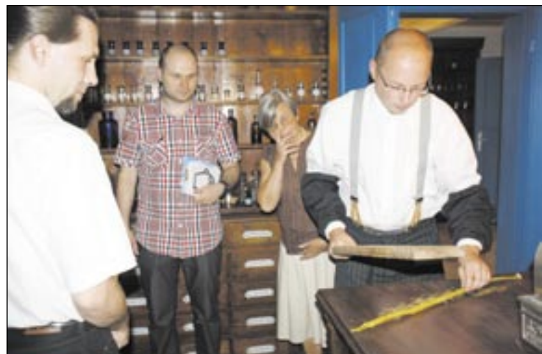
Ujrzenie na własne oczy procesu wytwarzania świec z czystego pszczelego wosku według wiekowej technologii było nie lada atrakcją.