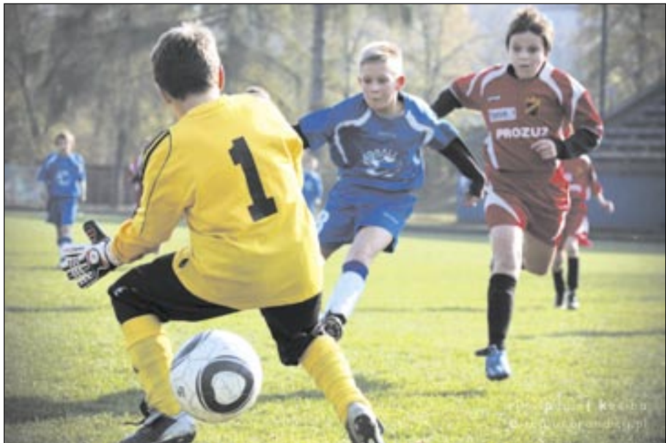
Młodzi piłkarze Ekoballu już zaczynają odnosić sukcesy. A co to będzie jak w ciągu jednego roku sanockie podstawówki i gimnazja wzbogacą się o pięć boisk piłkarskich?

Podchody trwały długo, nawet bardzo długo, ale się opłaciły. Projekt transgraniczny Polska – Słowacja pn. „Poprawa infrastruktury turystyczno-rekreacyjnej w Sanoku i Medzilaborcach” uzyskał kwalifikację i przyzwolenie na realizację w latach 2013-2014. Dla Sanoka oznacza to budowę 11 przyszłolnych boisk sportowych, Medzilaborce wzbogacą się o trybunę na jednym z obiektów, kręgielnię i dwa boiska. Wartość projektu wynosi 5,5 miliona złotych, z czego 85 procent stanowić będzie dofinansowanie ze środków unijnych.