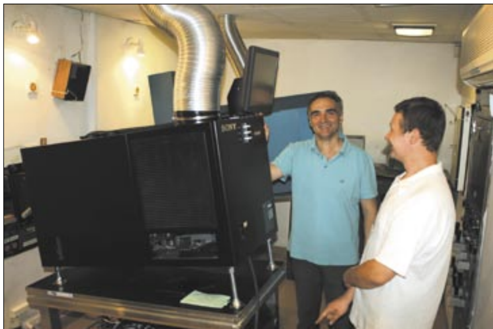
W SDK pojawił się sprzęt najnowszej generacji, więc nie dziwota, że humory dopisują.

Sanocki Dom Kultury wkroczył w XXI wiek. Aby obejrzeć film w technice 3D lub 4K nie trzeba już jeździć do Krosna czy Rzeszowa. Od tygodnia możliwe to jest na miejscu. Dzięki ministerialnej dotacji placówka wzbogaciła się o najnowocześniejszy sprzęt cyfrowy.