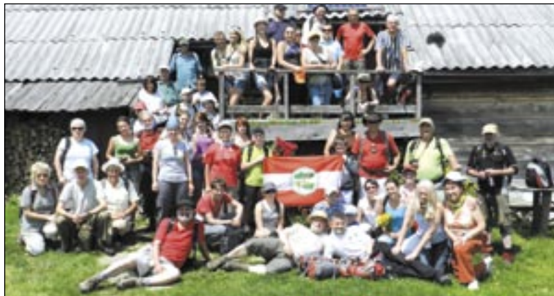
Uczestnicy wycieczki przed schroniskiem „Koniec Świata”.

Za nami pierwsza wycieczka w ramach cyklu wakacyjnych imprez „W niedzielę za miasto z przewodnikiem PTTK”.