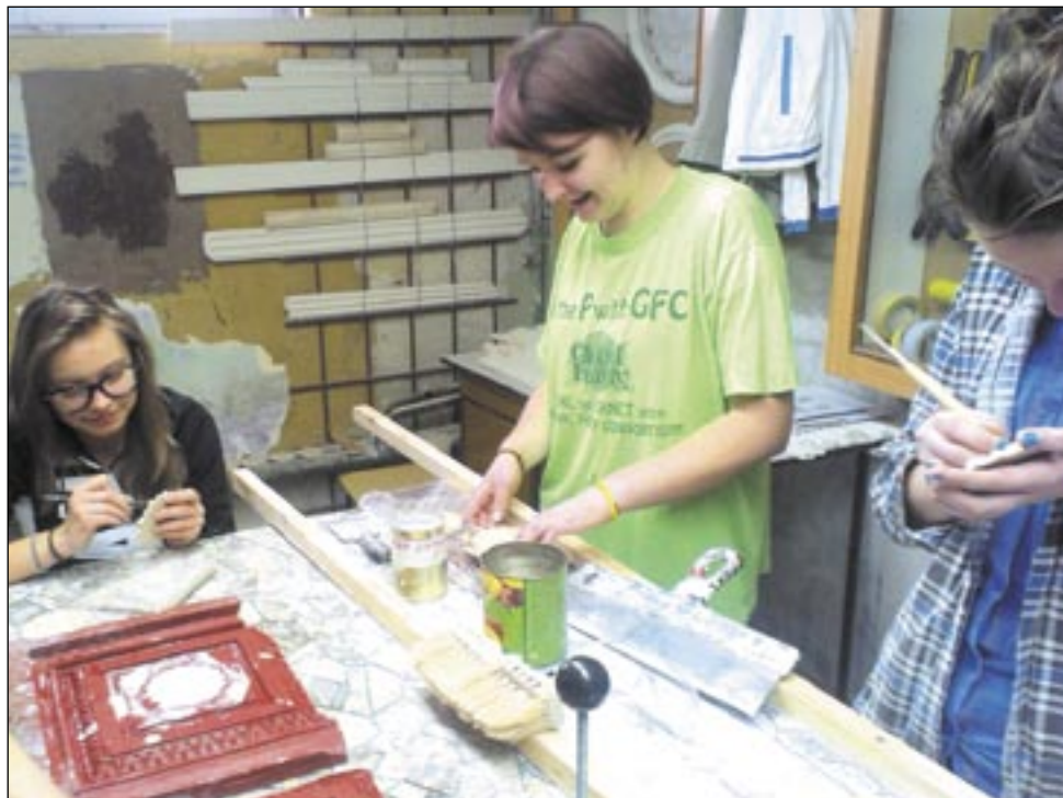
Renowator elementów architektonicznych to unikatowy kierunek w regionie. Wymaga nie tylko wiedzy budowlanej, ale i zdolności plastycznych.

Tegoroczny nabór do szkół ponadgimnazjalnych w Sanoku okazał się nieco lepszy od wstępnych szacunków. Od września w ich murach pojawi się ponad stu pierwszoklasistów więcej niż zakładano. To dobra wiadomość zwłaszcza dla „Budowlanki” oraz ZS 3, gdzie utworzone zostaną dwa dodatkowe oddziały.