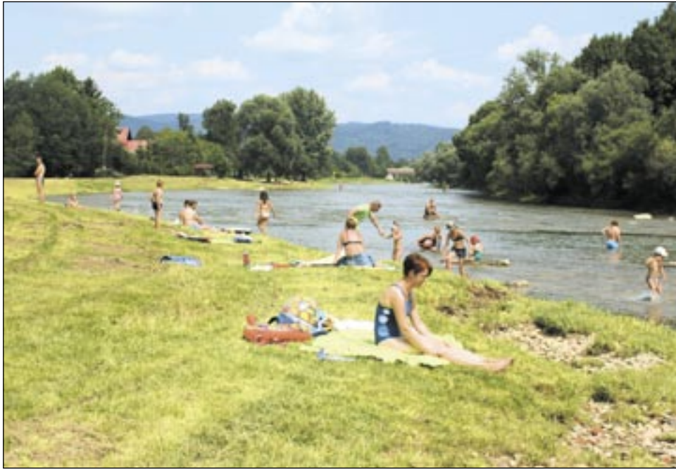
Nowe przepisy dotyczące kąpielisk wprowadzono w trosce o ludzi. Efekt jednak jest odwrotny do zamierzonego. Zamiast lepiej, mamy gorzej. Wszyscy udają, że kąpielisk nie ma, choć ludzie jak kąpali nad Oslawą czy Sanem tak kąpią się nadal. Niestety, woda nie jest badana i sanepid nie wydaje komunikatów informujących o jej jakości jak to kiedyś bywało.

Sanocznicy zawsze kąpali się w Sanie, również w czasach, kiedy nieistniejące już Zakłady Mięsne spuszczały do rzeki różne nieczystości. I chyba nigdy nikomu nic się nie stało. Dziś, kiedy każda gmina ma oczyszczalnię ścieków, nie ma wielkich zakładów produkcyjnych, a w Sanie żyją ryby z gatunku łososiowatych, zagrożenie nie jest chyba większe. Jak radzi pewien bloger z Warszawy, amator kąpiei w Wiśle, wystarczy uważnie przyjrzeć się wodzie i ją powąchać. Jeśli wygląda dobrze i nie wydziela podejrzanych zapachów, a my nie jesteśmy wrażliwi na alergeny, możemy skorzystać z kąpiei. Oczywiście, na własne ryzyko.