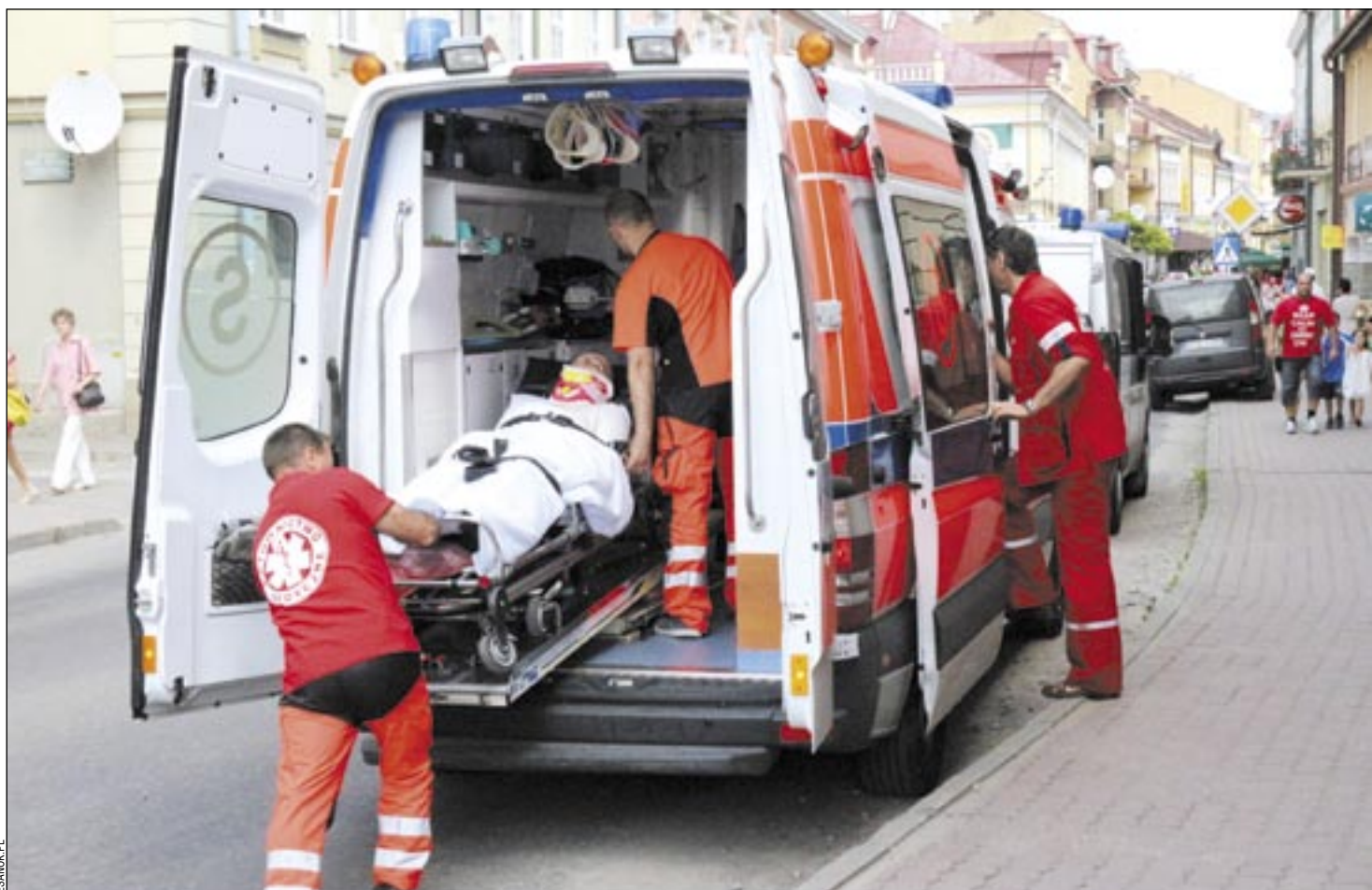
Wiele osób nie wytrzyma już wyścigu szczurów, stresu i tempa życia

trafił na stół operacyjny. – Cieszę się, że ten człowiek żyje. Sam sobie pomógł, wołając o pomoc i to, że tamten ma nóż. Dzięki temu wiedziałam, że muszę szybko reagować. To pierwsze takie zdarzenie u nas. Tu ra-