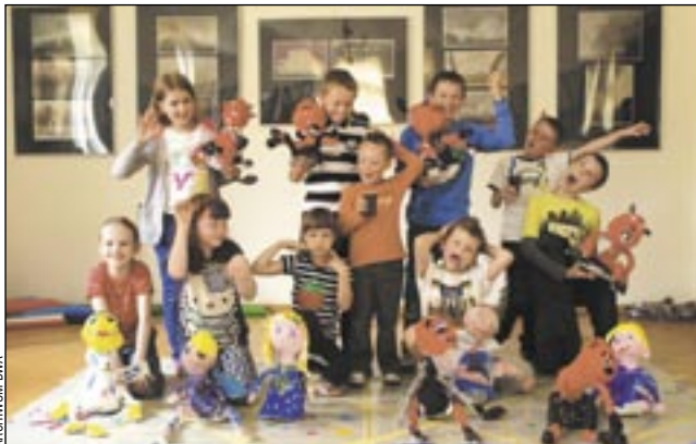
MINY DIABELSKIE, ALE W RZECZYWISTOŚCI TO PRZEMILE ANIOŁKI...

Z warsztatów i ich końcowego efektu dumni byli nie tylko uczestnicy i ich instruktorzy, ale także rodzice. – Jesteśmy bardzo zadowoleni. Podobała się nam forma, w jakiej prowadzono zajęcia z dziećmi. Mimo że trwały zaledwie tydzień,