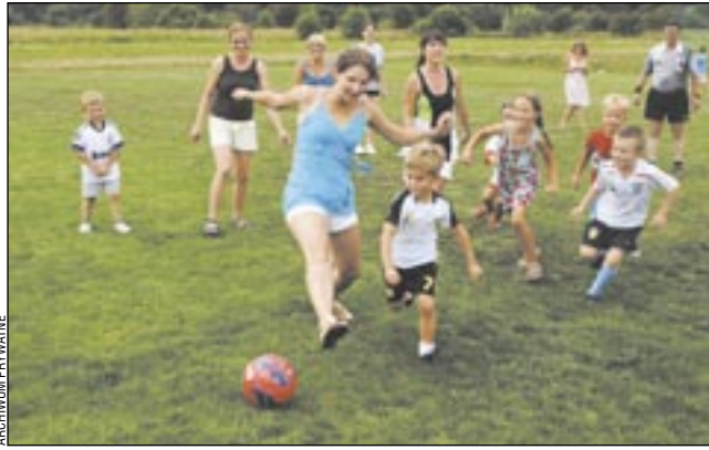
Mecz Mam z Przedszkolakami przyniósł masę emocji. Kibice obejrzel „futbol totalny”...

Punkt kulminacyjny imprezy stanowiło podsumowanie rozgrywek oraz uhonorowanie wyróżniających się zawodników Ekoballu. Musieli oni spełnić szereg dodat-