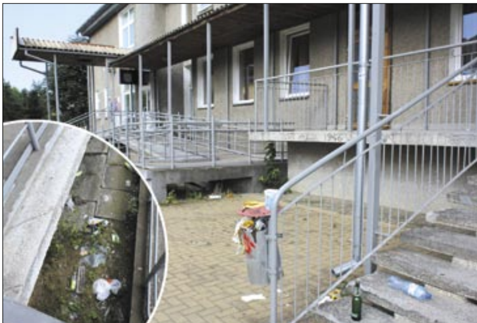
Naprawdę nie wypada, aby tak wyglądało otoczenie przychodni zdrowia.

Czy częste kontrolowanie młodych ludzi jest sposobem na pozbycie się ich z okolic przychodni, trudno powiedzieć. Na pewno jednak, gdyby personel placówki i okoliczni mieszkańcy bardziej energicznie interweniowali, a straż i policja wysyłały patroli, sytuacja uległaby poprawie. Otoczenie przychodni na pewno musi być częściej i staranniej sprzątane. Naprawdę nie wypada, aby tak wyglądała placówka zdrowia. Jest jak jest, i nie można obrażać się na rzeczywistość, odstawiając miotłę do kąta.