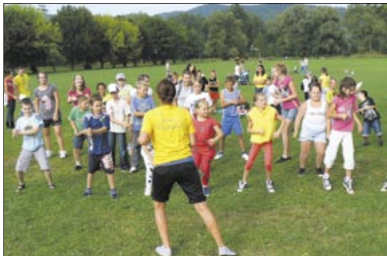
„Sanockie Lato podwórkowe” to znakomity pomysł na udane i bezpieczne wakacje.

Ciekawą inicjatywę projektową stanowi „partyworking”, czyli działania profilaktyczne prowadzone podczas imprez masowych. Specjalnie przeszkoleni partyworkerzy będą podczas takich imprez rozmawiać z ich uczestnikami, uświadamiając groźące im niebezpieczeństwa, m.in. poprzez akcje: „Pilnuj drinka”, „Nie piję, bo prowadzę”, „Nie daj się okraść”, „Nie daj się wykorzystać”, „Bądź widoczny”, „Uwaga na narkotyki”.