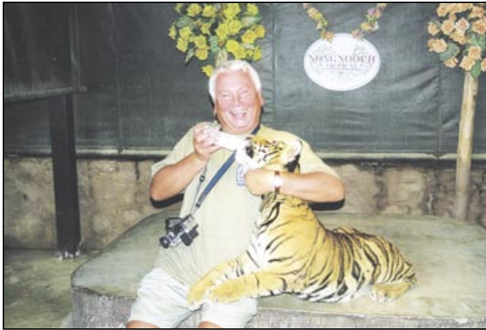
Przebywając w Tajlandii nie można się nudzić. Gdy nie bawią już lokale rozrywkowe i miejscowe piękności, zawsze można zaopiekować się takim miłym zwierzątkiem.

Przygotowując się do nich, wybierał najpiękniejsze miejsca na ziemi, w których mógł podziwiać niezwykle krajobrazy, bezkresne pustynie, wyniosłe szczyty górskie, pełne fantazji skalne formacje, bujne dżungle, zięjące grozą wulkany, cudowne plaże, wspaniałe