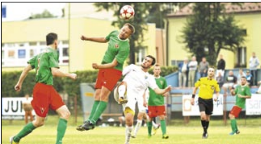
Piłkarze Lublinianki szybciej biegali, wyżej skalali, celniej strzelali. Ich zwycięstwo było jak najbardziej zasłużone.