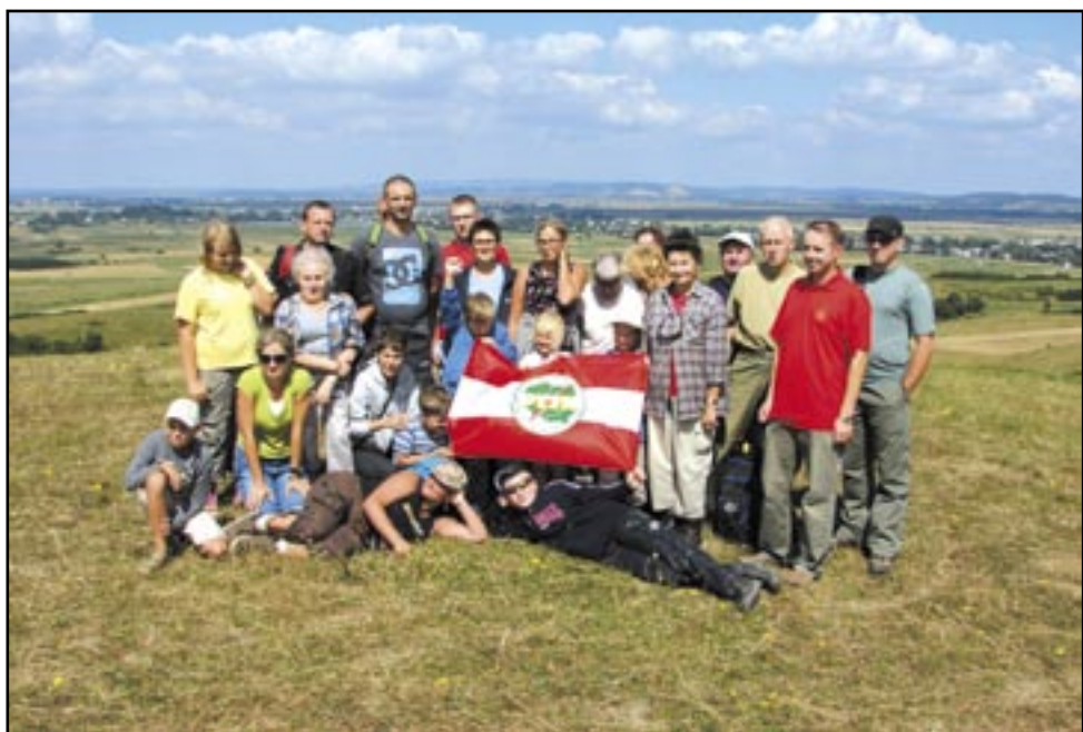
leż piękna wokół nas... Na zdjęciu – uczestnicy wycieczki na szczyt Wysokie.

Miłośnicy niedzielnych wypraw z PTTK mieli okazję zwiedzić okolice Nowosielec i Zarszyna, szczytując się bogatą historią i obecnością bocianów, które podobno chętnie osiedlają się wśród dobrych ludzi.