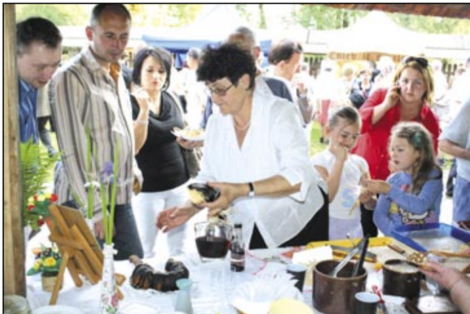
Smak tradycyjnych potraw jest niezapomniany – Sanok i okolice także z nich słyną, warto więc, by znalazły się na nowo powstającym szlaku.

Zmieniające się motywy podróżowania, potrzeba niezwykłych, niepowtarzalnych doznań, powodują poszukiwanie nowych form i ofert turystycznych. Odwiedzających interesuje już nie tylko za ile, ale także gdzie i co mogą zjeść. Nie jest sztuką napełnić żołądek byle czym. Ważne staje się, aby spróbować czegoś nowego, o czym po powrocie można opowiedzieć swoim znajomym. – Poznawanie nowych smaków może być również celem samym w sobie. Regionalna, tradycyjna kuchnia to ważny element turystycznych wojaży, część historii