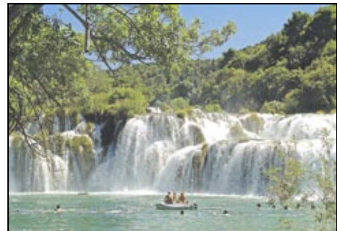
Aby zauroczyć się pięknem tego świata wcale nie trzeba jechać na antypody. Wystarczy do Chorwacji. W Parku Narodowym Krka rzeka o tej samej nazwie tworzy cudowne wodospady, kaskady i jeziora.