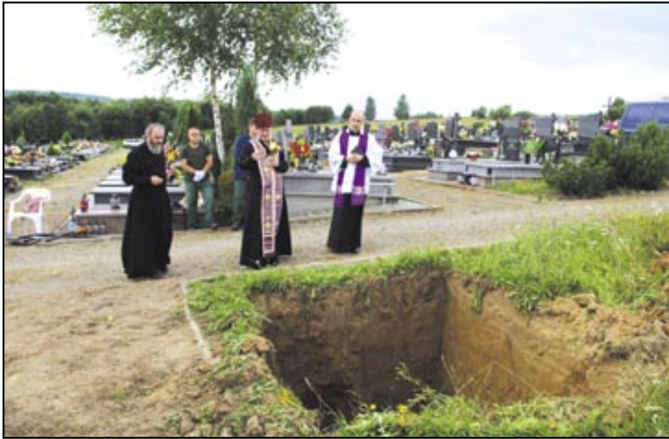
Na cmentarzu przy ulicy Konopnickiej złożono blisko tonę ludzkich kości, z różnych epok i nieistniejących już nekropoli sanockich.