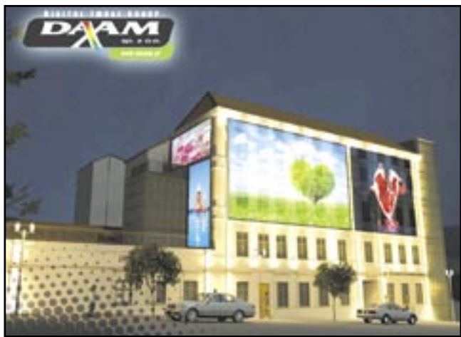
Tak będzie wyglądać hotel, gdy przykryje go płachta z wizualizacją.

Jeszcze niedawno mówiło się o możliwej sprzedaży budowanego przez Elcom hotelu przy ul. Zamkowej, jednak według zapewnień inwestycja będzie kontynuowana. Prace mają ruszyć po wakacjach.