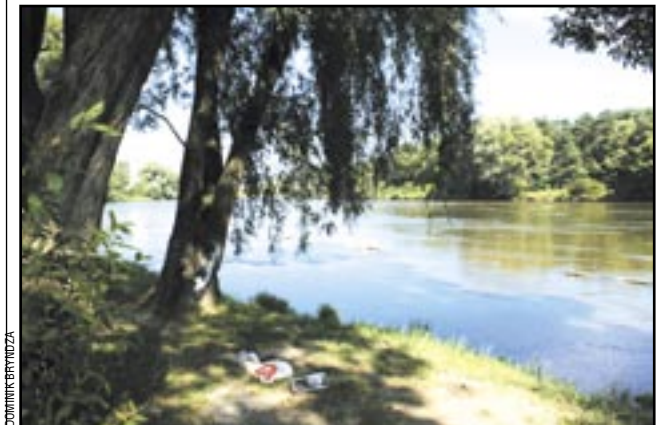
Ludzie, czy naprawdę musicie tak paskudzić otoczenie?

Postanowiliśmy osobiście przekonać się, jak wyglądają nabraża Sanu. We wtorek przy stołach i ławkach śmieci już nie było – zostały posprzątane. Znacznie gorzej wyglądała jednak nad-