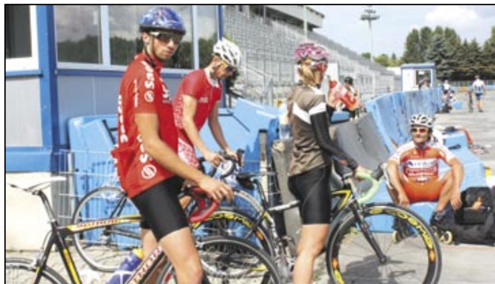
Jazda na rowerach i wrotkach, biegi w terenie górzystym, pływanie i ciężka praca na siłowni, to wszystko będzie już owocować podczas Zimowych Igrzysk Olimpijskich w Soczi. Oby jak najlepiej!

Na obiektach Miejskiego Ośrodka Sportu i Rekreacji trenuje kadra narodowa łyżwiarzy szybkich kobiet i mężczyzn, którzy przygotowują się do Zimowych Igrzysk Olimpijskich w Soczi 2014. Zawodnicy przebywają tutaj na zgrupowaniu od 11 do 25 sierpnia.