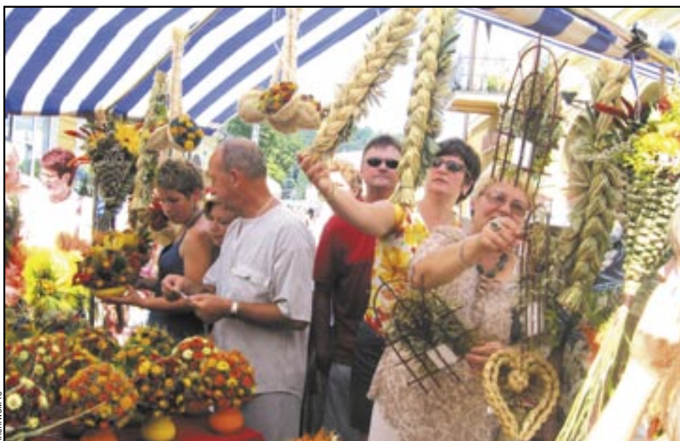
Prezentacja i sprzedaż rękodzieła to żelazny punkt każdej letniej imprezy w gminie i powiecie.