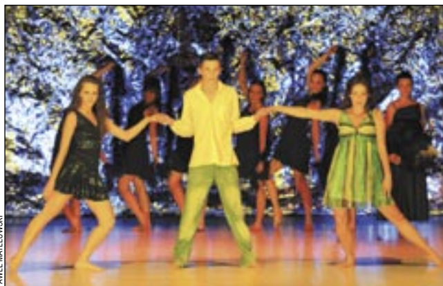
Taniec to nie tylko ruch, ale również emocje.

Spektakl miał swą premierę w czerwcu podczas „Wieczorów artystycznych SDK”, edycja