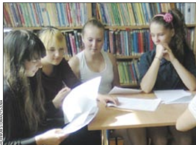
Jury przy pracy – okazało się, że ocenianie to nietatwe zadanie.

Jednym z wniosków, który nasunął się po analizie prac, z myślą o przyszłorocznej edycji konkursu, jest rezygnacja ze słowa „scenariusz” w tytule na rzecz mniej zobowiązującego, na przykład „pomysł”, bo scenariusz pociąga za sobą obawy przed formalnymi wymogami i przerost formy nad treścią, a wszelakie działania na rzecz czytelnictwa winny być jak najbardziej odformalizowane. Bazując na zakupionych książkach, zgromadzone