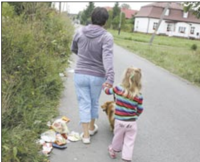
Na Śniegowej co krok leżą reklamówki ze śmieciami.

Apelujemy do służb miejskich o zainteresowanie się ulicą Śniegową, która jest wręcz upstrzona dzikimi wysypiskami śmieci.