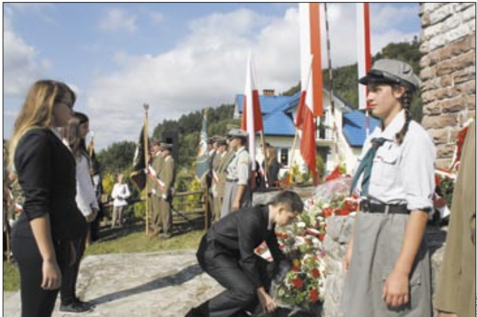
Młodzież składa kwiaty pod pomnikiem poległych w Bykowcach.