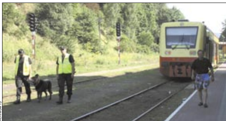
Obywatele woleliby, aby SOK zajął się ochroną majątku kolei, a nie wlepił mandaty. Zdjęcie z 2010 roku – kiedy stacja w Zagórz tuż przed zamknięciem.