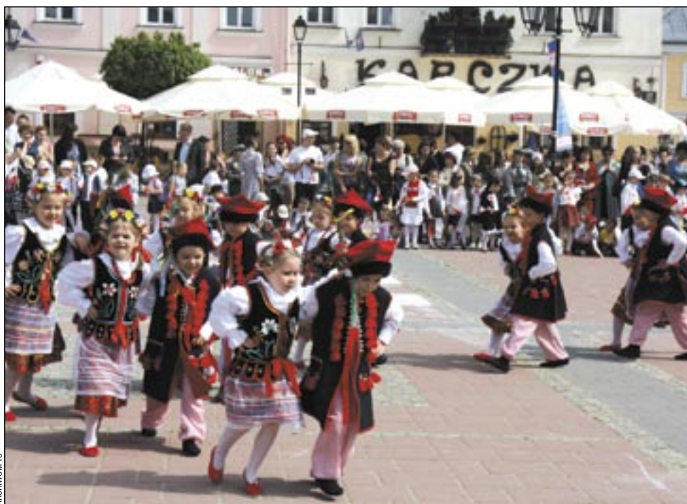
Rodzice zawsze cieszą się z postępów swoich pociech i robią wszystko, aby ułatwić im start. Na zdjęciu – sanockie przedszkolaki podczas Święta Flagi na Rynku.