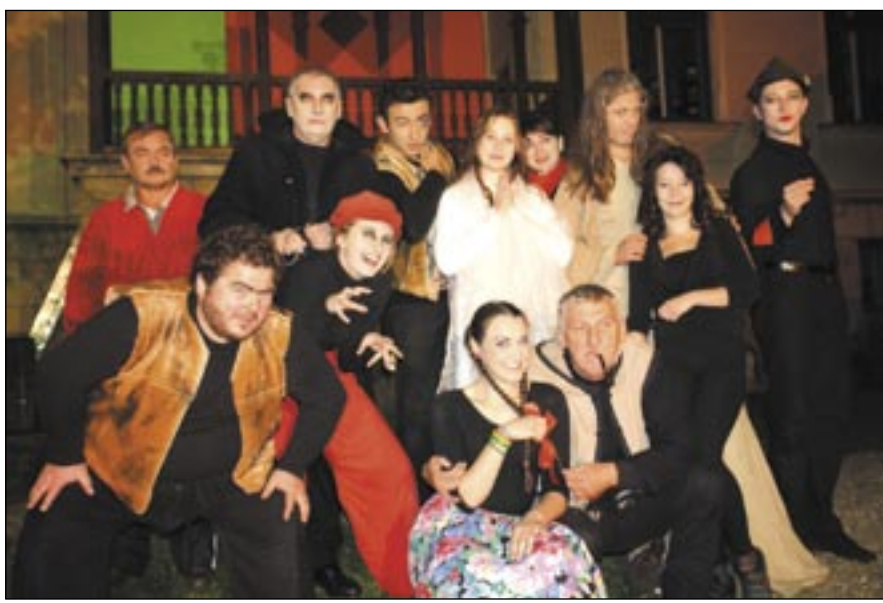
Plenerowy spektakl w „Zielonej Czytelni” był szczególnym wyzwaniem dla aktorów i realizatorów. Wszyscy spisali się znakomicie.