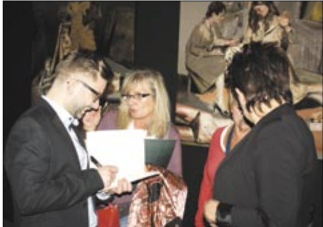
Gratulacje, wyrazy sympatii, dedykacje nie miały końca...