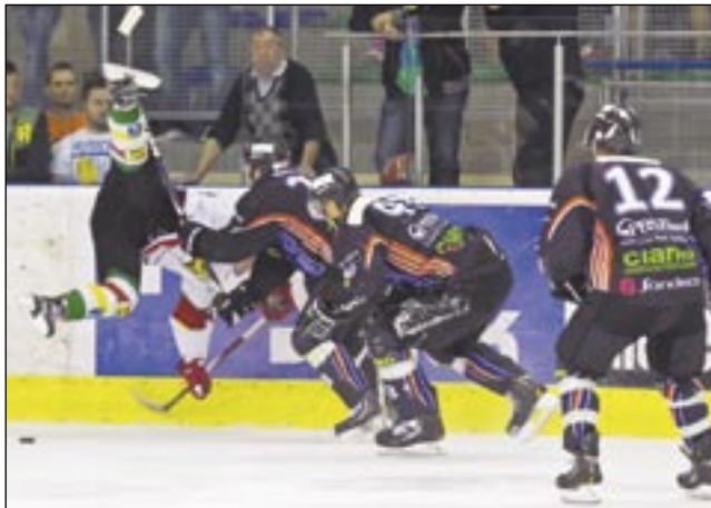
Trzeba się dobrze przyjrzeć, aby zobaczyć w ekwilibrystycznym lobie zawodnika „Dream teamu” (pierwszy z lewej) i całą trójkę hokeistów Ciarko PBS, która nie pozwala mu się przedrzeć w ich strefę obronną.

pięknymi, sportowymi spektaklami, z żywiołowym, kulturalnym dopinaniem, a nie rynsztokiem, pełnym przekleństw i wulgaryzmów.