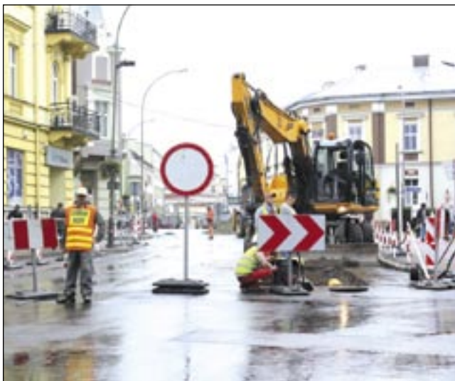
Choć były osoby kierujące ruchem, zamknięcie skrzyżowania w centrum wywołało sporo zamieszania.

Zamykane będą także fragmenty głównych ciągów. – Nie jesteśmy w stanie z góry określić precyzyjnie terminów, będziemy