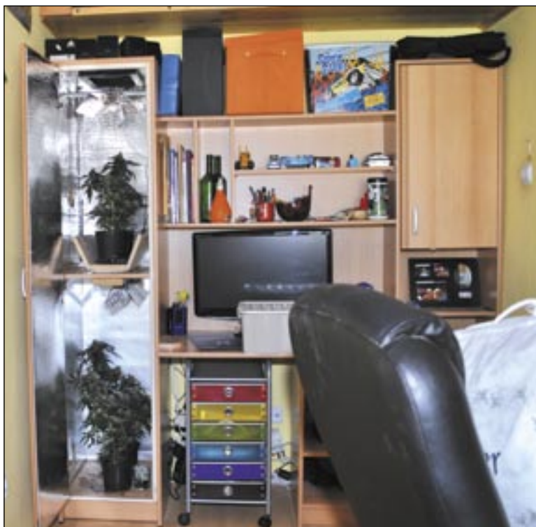
Rodzicu, czy wiesz, co twoje dziecko trzyma w szafce?

Prawie co 5 z przebadanych uczniów (18,5 proc.) potwierdził, że zdarzyło mu się palić trawkę, przy czym 14 proc. – w ostatnim roku, a 7,6 proc. – w ostatnim miesiącu. W gronie tym zdecydowanie dominowała młodzież ponadgimnazjalna, wśród której co czwarty uczeń potwierdził swoje kontak-