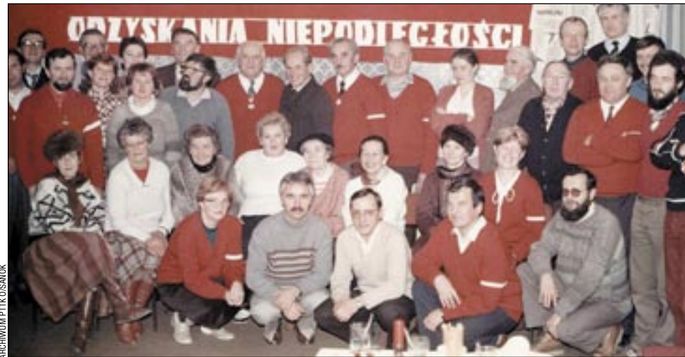
Wielu znakomitych sanockich przewodników wędruje już po niebieskich połoninach...

– W związku ze 140. rocznicą powstania TT zapraszamy wszystkich mieszkańców naszego miasta do obejrzenia wystawy plenerowej „140 lat turystyki – od Towarzystwa Tatrzańskiego do Polskiego Towarzystwa Turystyczno-Krajoznawczego”, opracowanej i udostępnionej przez Centralny Ośrodek Turystyki Górskiej w Krakowie. Jej