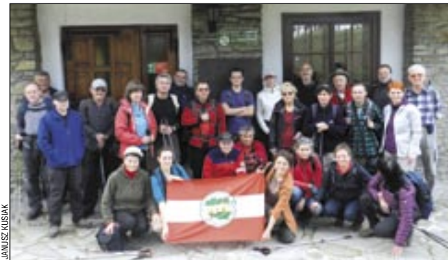
Uczestnicy pod schroniskiem PTTK na Przehybie.