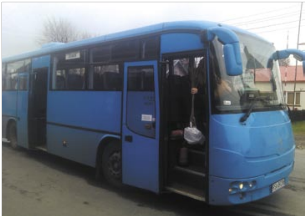
Autobus odjechał, zanim starsza pani zdążyła wysiąść. Dobrze, że nie doszło do tragedii.

Pisaliśmy ostatnio o nieszczęśliwym wypadku podczas wysiadania z autobusu – kierowca najechał na nogę wysiadającej 84-letniej pasażerki, miażdżąc jej podudzie. Do podobnego wydarzenia doszło w ubiegłą środę w Strachocinie. Kierowca zamknął drzwi, zanim starsza pani zdążyła opuścić pojazd. Na szczęście zakończyło się nabiciem guza i ogólnymi potłuczeniami. Rodzina jest zbulwersowana, bo młody kierowca nie pierwszy raz popełnił błąd, który mógł zakończyć się nieszczęściem. Wnuczka poszkodowanej twierdzi, że ludzie boją się z nim jeździć.