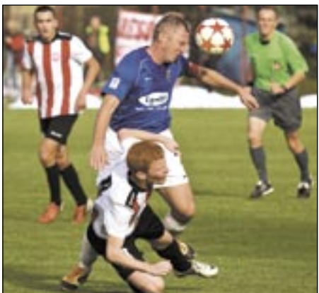
Tydzień po meczu z Resovią, w którym Stal do końca walczyła o korzystny wynik, przyszła sromotna porażka w Kraśniku.