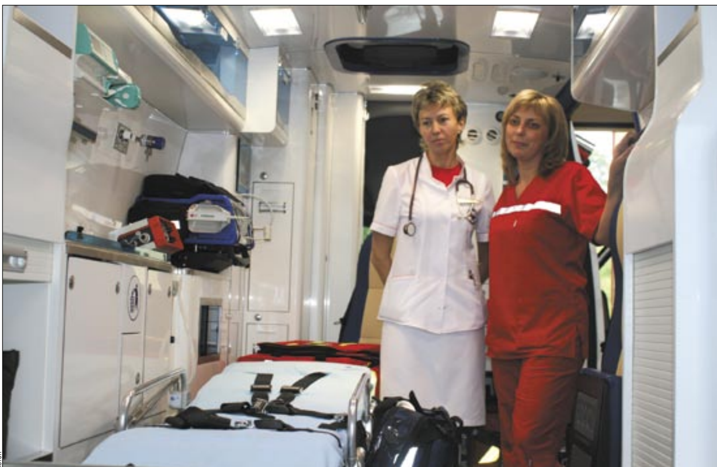
Karetki z projektu Fundacji TVN są niczym mini oddziały ratunkowe w szpitalach, gdzie ratuje się ludzkie życie. Jak ważną rolę odgrywa dziś szybki, sprawny i bezpieczny transport medyczny, pokazują doświadczenia dnia powszedniego.

Bez Orkiestry, za to na sygnale, pięknym mercedesem, jedzie do nas FUNDACJA TVN, która zafundowała Szpitalowi Specjalistycznemu w Sanoku ambulans medyczny z pełnym wyposażeniem. Jeden z projektów Fundacji „Karetki dla szpitali” przewidywał podarowanie dziesięciu szpitalom będącym w największej potrzebie karetek pogotowia ratunkowego. Wśród dziesięciu szczęśliwców jest Szpital Specjalistyczny w Sanoku!!! I to jest już pewna, potwierdzona wiadomość!