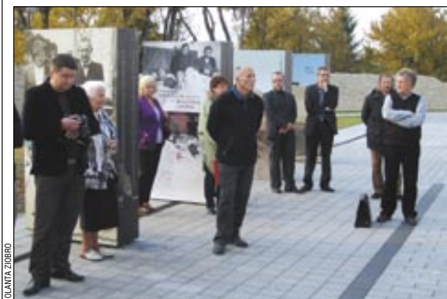
Podczas werniszu na zamkowym dziedzińcu.

Wystawę, która będzie czynna do końca miesiąca, przygotował Oddział IPN w Szczecinie, Stowarzyszenie „Wspólnota Polska” oraz Towarzystwo Miłośników Wołynia i Polesia. (JZ)