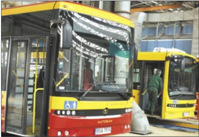
Już w poniedziałek do hal produkcyjnych Autosanu powróci życie.