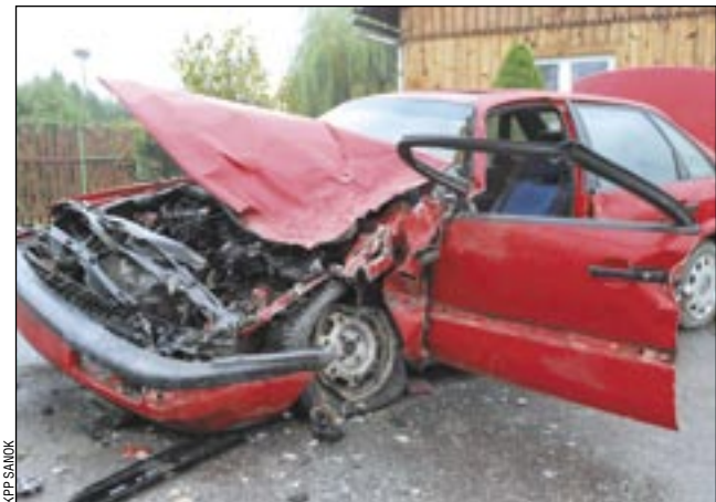
Osobowy volkswagen ucierpiał znacznie mocniej niż (niewidoczna na zdjęciu) ciężarówka, która po wypadnięciu z drogi zatrzymała się dostojnie o metr przed budynkiem mieszkalnym.