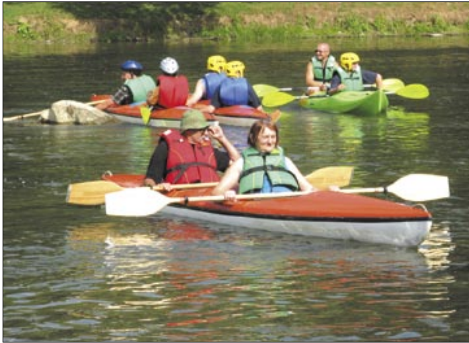
Spływy kajakowe Sanem mają szansę stać się jedną z markowych usług naszego regionu.

Więcej informacji o naborze na: www.alpykarpatom.pl