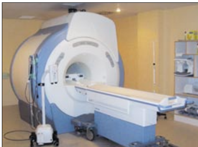
Dziś trudno sobie wyobrazić diagnostykę medyczną bez rezonansu. Ale dziesięć lat temu był marzeniem każdego szpitala, nie tylko powiatowego. Sanok był w tej szczęśliwej sytuacji, że go miał.