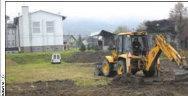
Ruszyły prace przy budowie 11 boisk przyszkolnych. Transgraniczny projekt polsko-słowacki wartości ponad 6 mln. złotych w zdecydowany sposób poprawi stan szkolnej bazy sportowej. Na zdj. pierwsze prace przy SP 6 w dzielnicy Olchowce.

Zakończenie projektu planowane jest na IV kwartał przyszłego roku. Koszt całego zadania to blisko 1,5 mln euro, przy dofinansowaniu prawie 1,3 mln euro. af, emes