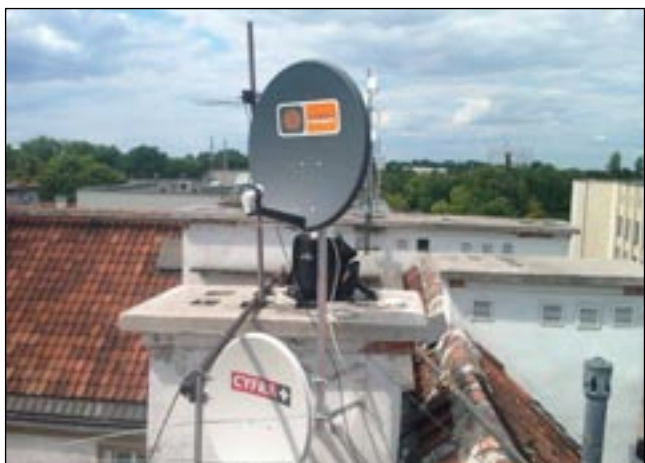
Chcesz mieć darmową telewizję cyfrową – kup indywidualną antenę i dekoder.