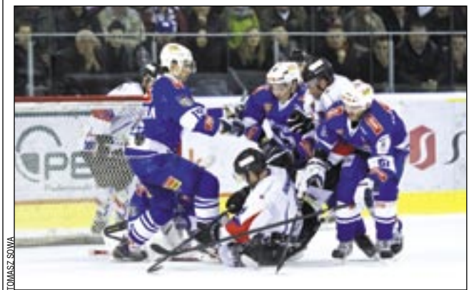
W meczu z Unią bywało i tak. Ale 2 punkty wywieźli z Sanoka goście!