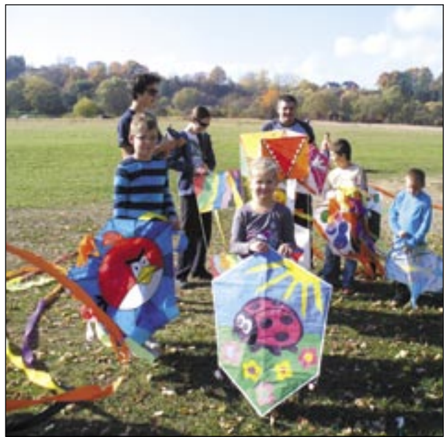
Na Białej Górze znów było kolorowo od latawców.

W pięknej scenerii i przy wyjątkowo licznej widowni na lotnisku sanitarnym odbyło się tradycyjne „Święto Latawca”. Imprezę zorganizował Osiedlowy Dom Kultury „Gagatek”, przyznając sześć nagród głównych.