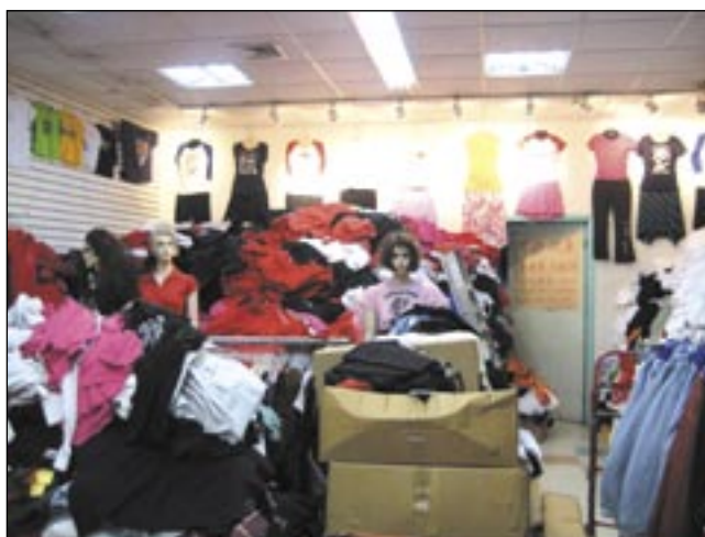
Jeśli ktoś chce zbijać kasę na handlu używaną odzieżą, jego sprawa. Pod warunkiem, że przy okazji nie obdziera ze skóry biedaków.

Dziennikarskie „śledztwo” doprowadziło nas do Kalisza. To tam ma swoją siedzibę Fundacja „Miłosierdzie”, która organizuje zbiórki odzieży i sprzętu w Sanoku. Dlaczego akurat u nas? – Działamy na terenie całej Polski od ponad 20 lat,