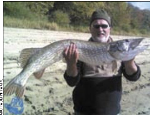
Złowienie takiego szczupaka to wyczyn sam w sobie, a co dopiero podczas zawodów wędkarskich.