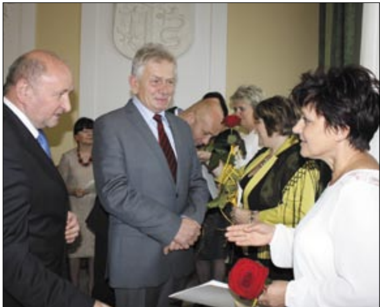
Nauczycielskie środowisko jest szczególnie bliskie władzom Sanoka – sami się z niego wywodzą...

Mizéria finansowa sprawiła, iż tegoroczny Dzień Edukacji Narodowej świętowano w Sanoku znacznie skromniej niż w poprzednich latach. Mimo to nie brakło gratulacji, kwiatów oraz nagród dla wyróżniających się pedagogów.