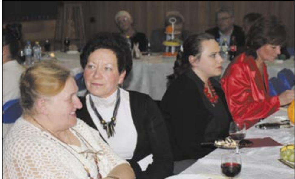
Dzielnica Posada ma ambicje, aby w dziedzinie kultury być liczącą się w mieście. Ma je nie dla szpanu, ale dostrzega w niej wielką rolę integracji mieszkańców.

– To będzie zależało od nowego naboru, jaki właśnie uruchamiamy. Chcielibyśmy wzmocnić nasze siły witalne, odmłodzić zespół, jako że zapowiada się nam bardzo pracowity rok. Zaczniemy go premierowym koncertem noworocznym, z którym chcielibyśmy zdążyć na połowę grudnia. W czerwcu musimy wystrzelić czymś wyjątkowym na Światowy Zjazd Sanoczan, potem zaś szykuje się nam wyjazd do partnerskiego Reinheim w Niemczech, który też zechcemy potraktować ambicjonalnie. Czeka