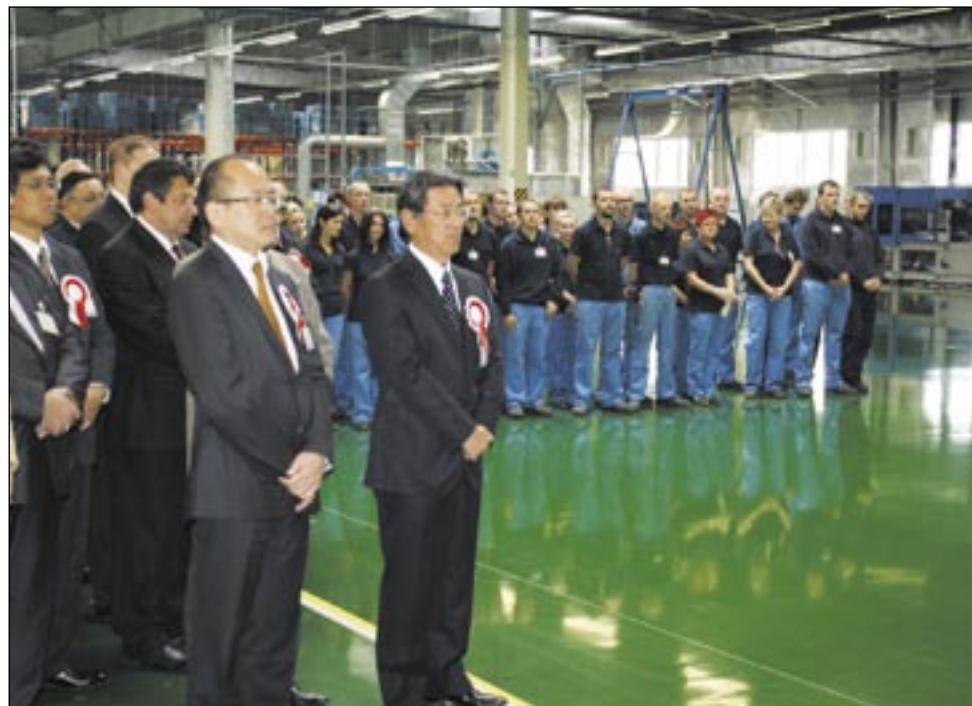
W Zagórzcu zakwitła przyjaźń polsko-japońska. Co nie powinno dziwić, biorąc pod uwagę, że inwestorzy przyjechali z Kraju Kwitnącej Wiśni.

Firma TRI to światowy lider w produkcji antywibracyjnych i dźwiękochłonnych części samochodowych. Istnieje od 1929 roku, a na nasz rynek weszła 70 lat później, budując fabrykę w Wolbromiu. Drugą Japończycy zdecydowali się postawić w Zastawiu, czyli tzw. podstrefie mieleckiej Specjalnej Strefy Ekonomicznej. Ponoć równie ważne, jak ulgi podatkowe, były zapał i zaangażowanie lokalnych władz. Pod koniec września ubiegłego roku inwestorzy podpisali umowę przedwstępną z przedstawicielami SSE, kilkanaście dni później sygnując tę właściwą. Wkrótce rozpoczęto budowę fabryki, która uruchomiona została w sierpniu bieżącego roku.