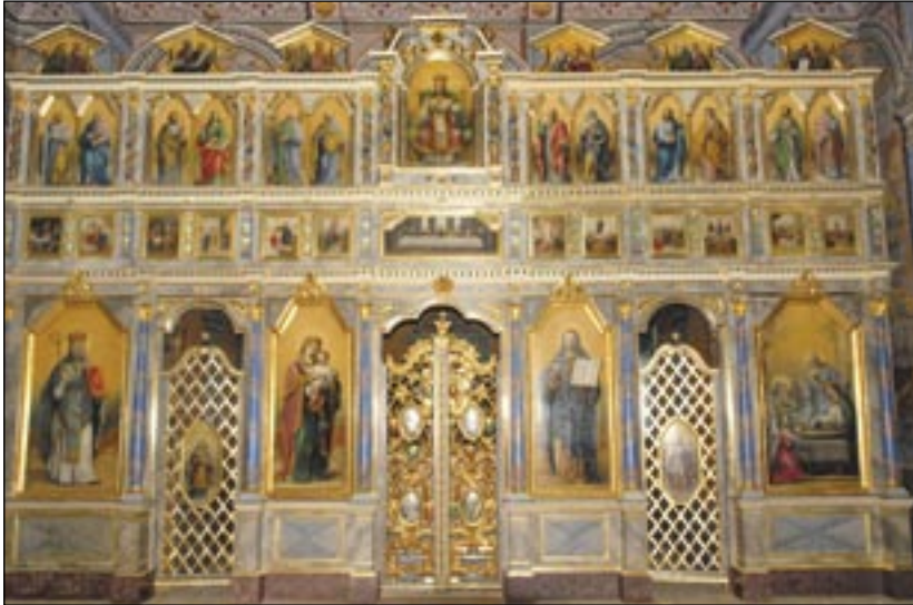
Zwiedzając cerkiew z Ropiek, podziwiamy przepiękny cały ikonostas. Nieopodal, na ekspozycji stałej, oglądamy poszczególne ikony „twarz w twarz”. I to jest też Wersal!

wszystko po to, aby zwiększyć wilgotność powietrza. Z kolei w lecie, gdy ta przekraczała 65 procent, włączaliśmy ogrzewanie (podłogo-