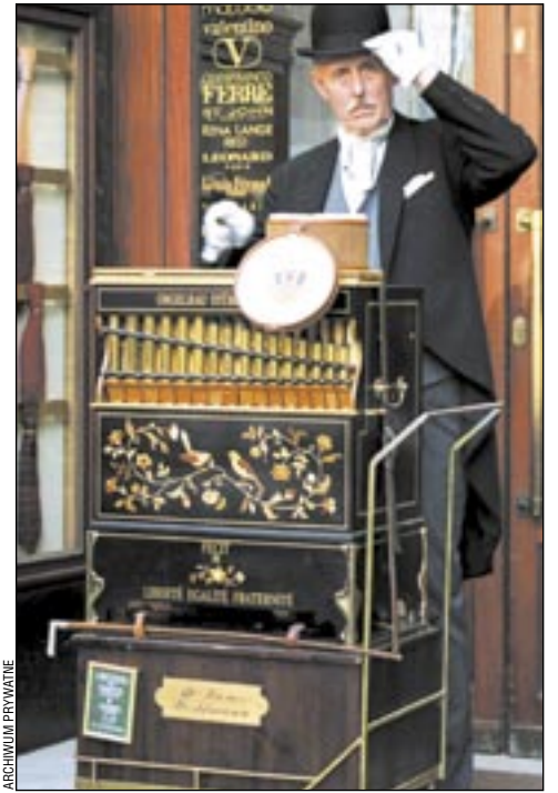
Jak będzie wyglądała sanocka katarzynka: czy będzie taka, jak ta na zdjęciu? Jak będzie ubrany kataryniarz? Czy też tak dostojnie? Poczekajmy jeszcze miesiąc i wszystko będzie jasne.

A może będziemy świadkami jeszcze innych niespodzianek? Trudno, jedną z nich zdradzimy. Otóż sejsmografy plotkarskie zbliżone do Urzędu Miasta doniosły, że tuż przed Bożym Narodzeniem na ulicach Sanoka pojawi się... kataryniarz. A w zasadzie powróci, gdyż jak mówią najstarsi sanoczanie, kilkadziesiąt lat temu takowy był w Sanoku, dobrze wpisując się w koloryt tego miasta. Czy we współczesnym Sanoku będzie mu dobrze? Czy nam z nim też będzie dobrze?