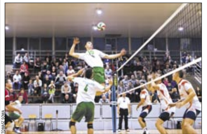
Siatkarze TSV doznali kolejnej porażki, ale po niezłej grze.

Po pierwszym zwycięstwie w II lidze liczyliśmy na powtórkę w Jaworznie, jednak rywal okazał się za mocny. Mimo tego siatkarze TSV Mansard zagraли niezły mecz, będąc bliscy zdobycia przynajmniej jednego punktu.