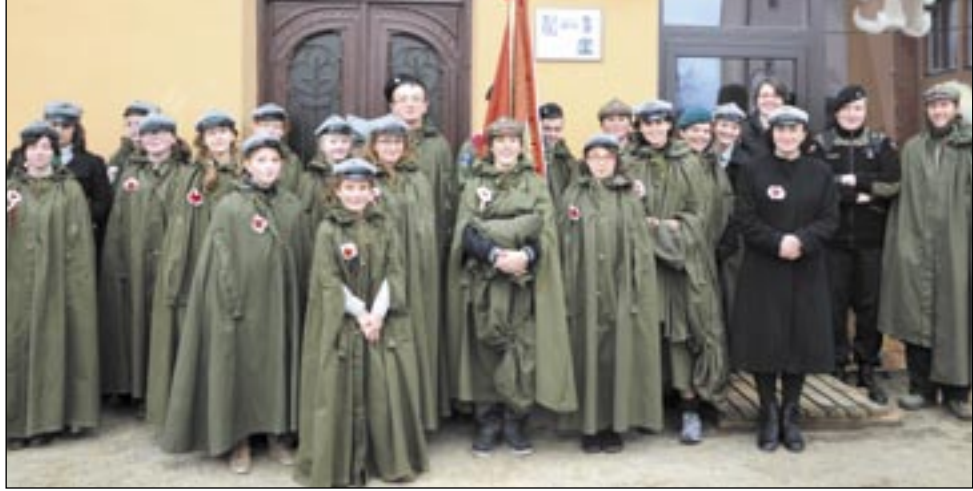
Teraz wszyscy będą wiedzieć, gdzie znajdowała się słynna cukiernia Peszkowskich. O umieszczenie tablicy informacyjnej zadbał harcerze.

Harcerze uczcili swojego patrona ks. Zdzisława Peszkowskiego, podejmując szereg ciekawych inicjatyw. Oprócz „tygodnia patrona” w Domu Harcerza, wykonali nowy krzyż na Cmentarzu Centralnym oraz umieścili tablicę informacyjną na budynku przy ulicy Jagiellońskiej, gdzie przed wojną funkcjonowała słynna cukiernia Peszkowskich.