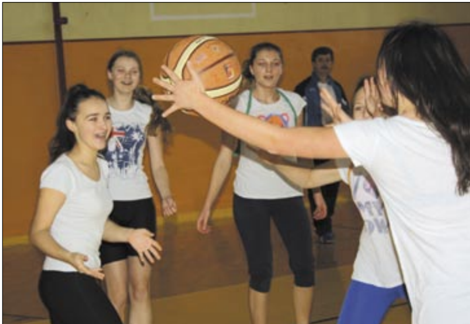
Lekcje WF mają być dobrą zabawą. Dlatego obok ćwiczeń ogólnorozwojowych są też gry drużynowe.

II Liceum Ogólnokształcące wygrało wojewódzką klasyfikację Licealiady, Szkoła Podstawowa nr 4 ranking Igrzysk Młodzieży Szkolnej, natomiast w pośredniej grupie wiekowej najlepiej z naszych placówek wypadło Gimnazjum nr 4, plasując się na 3. pozycji. W jego przypadku sukces oparty był nie tyle o masowość i medale, co solidne starty w większości dyscyplin, czego wyrazem udział aż w 10 finałach wojewódzkich.