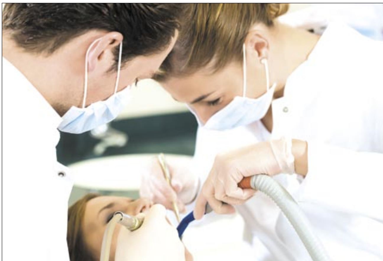
Każdy lekarz prowadzący prywatną praktykę powinien mieć cennik usług i wystawiać rachunki. Nawet jeśli nie ma kasy fiskalnej. Im częściej jako pacjenci będziemy się o to upominać, tym lepiej dla nas samych.

cją, ile leczenie kosztowało, kto jest lekarzem prowadzącym. ZIP dokumentuje historię naszego leczenia od 2008 r. Obecnie zarejestrowanych jest w nim 27.450 dorosłych mieszkańców Podkarpacia. Niewielu jednak powiada urzędników o zauważonych nieprawidłowościach. A bez for-