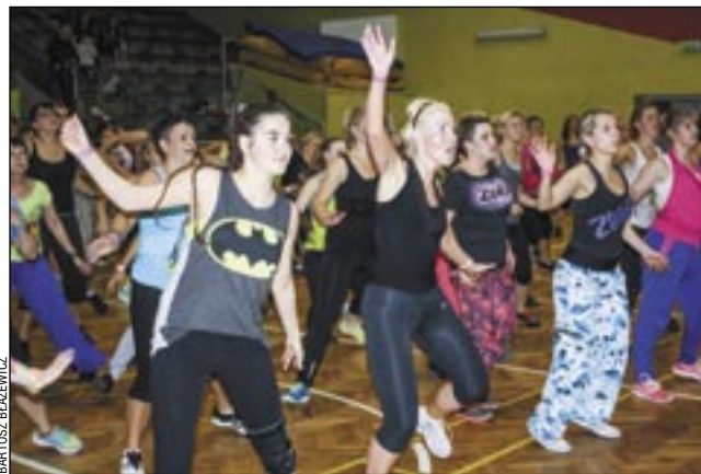
Na parkiecie ZS3 przez kilka godzin pulsował żywy tłum zumbowiczek.

Po blisko 4 godzinach tańca większość zumbowiczek była mocno zmęczona, jednak nie na tyle, by odpuścić after party w klubie „Cacao”. Około 40 osób bawiło się do późnej nocy, nie tylko rozpamiętując wrażenia z parkietu, ale i planując udział w kolejnych imprezach.