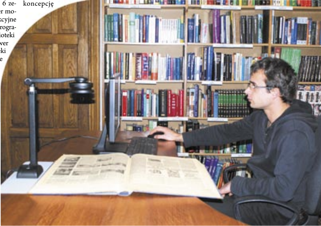
Jeden z najnowszych nabytków – przenośny skaner, z którego mogą korzystać czytelnicy sanockiej MBP.

uchwałą Rady Miasta). – Do tej pory program „Biblioteka Plus” dotyczył małych miejscowości, ale w ubiegłym roku rozszerzono go o miasta do 50 tys. mieszkańców. Dzięki temu, że mieliśmy wcześniej opracowaną koncepcję