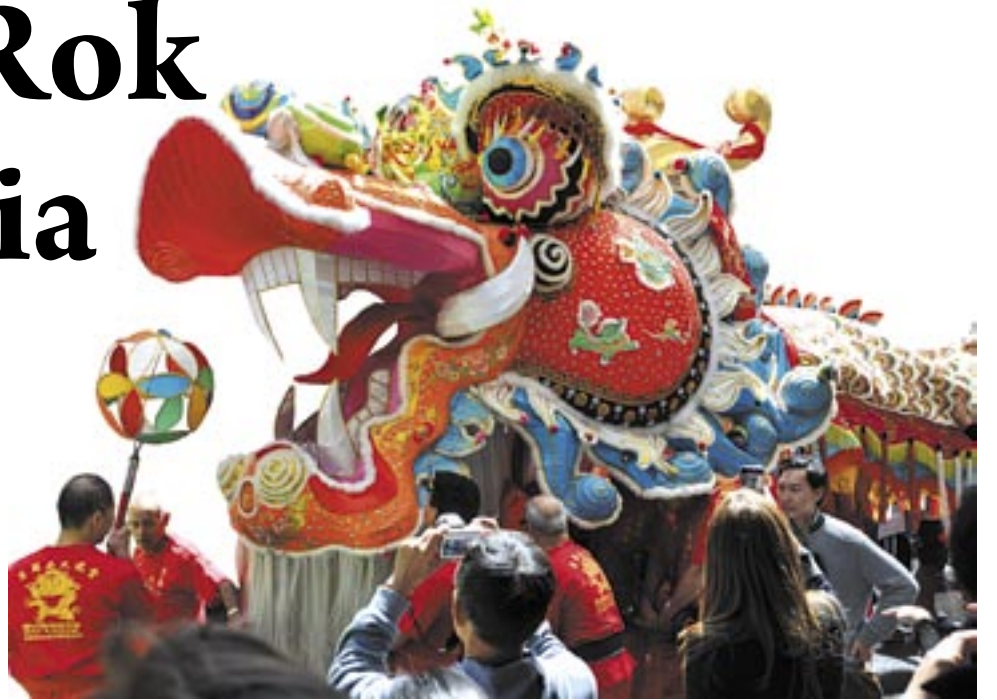
Noworoczny korowód smoka jest niezwykle widowiskowy. Zawsze towarzyszą mu tłumy widzów, wśród których nie brak turystów.

Kolejną rzeczą, którą jego żona bardzo polubiła w polskich świętach, jest kolacja wigilijna w gronie rodzinnym i towarzysząca temu serdeczna atmosfera. Ten właśnie wieczór przypomina jej celebrowanie Chińskiego Nowego Roku, ponieważ zarówno polska Wigilia, jak i chiński Nowy Rok mają w swojej oprawie kilka podobieństw. W obu