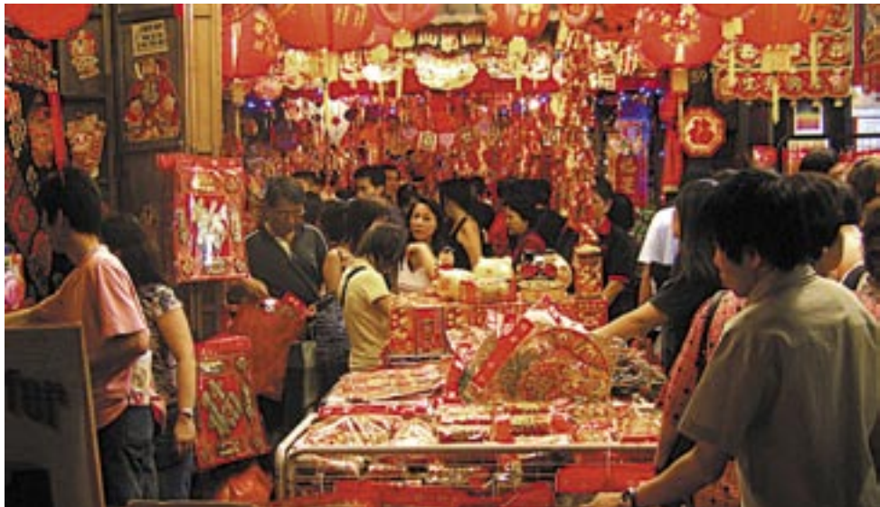
Czerwień dominuje też w marketach, gdzie oko przyciągają szczególnie chętnie kupowane w tym czasie słodycze.