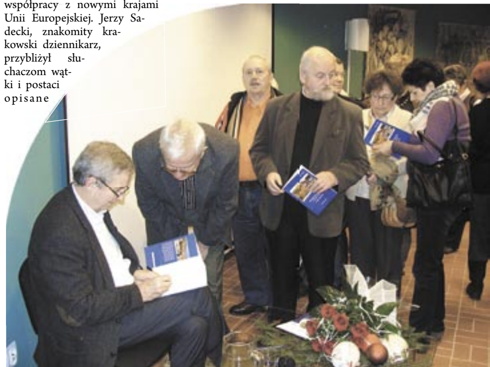
Po książkę z dedykacją i autografem Jerzego Sadeckiego ustawila się długa kolejka.

w książce, która w reporterskiej formie przedstawia przemiany, jakie dokonały się na Podkarpaciu po 1989 roku.