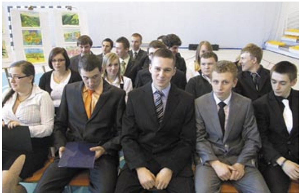
Uczniowie ZS CKR w Nowosielcach od wielu lat utrzymują kontakty ze szkołami rolniczymi w innych krajach. Śmiało więc przystąpili do uczestnictwa w projekcie europejskim, biorąc udział w praktykach zawodowych w Turynii (Niemcy).