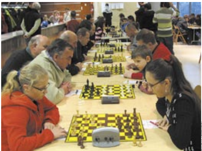
Szachiści Komunalnych (po lewej) awansowali do III ligi.