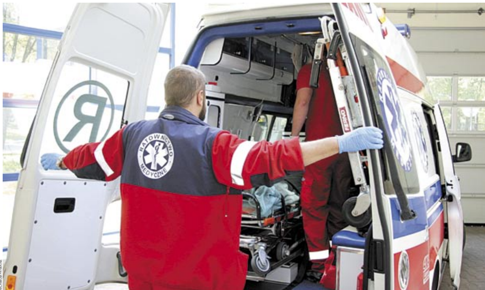
Ten kto przyjmuje pacjenta, ten daje też skierowania, recepty i zlecenie na transport – warto wiedzieć o tej zasadzie, aby nie tracić później czasu, nerwów i ... zdrowia.