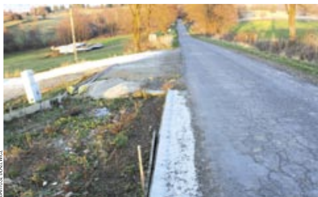
W kilku miejscach wyraźnie widać, że ziemia była podbierana.

Jeszcze dalej poszła inna osoba, po prostu dzwoniąc po Policję. Przybyli na miejsce funkcjonariusze spisali notatkę, ale ciągu dalszego nie było, bo właściciel działki stwierdził, że z pracami ziemnymi nie wyszedł poza własną posesję. I tu na razie jest pat, bo nikt dokładnie nie wie, w którym miejscu przebiega pas drogowy. – Należałoby przeprowadzić wznowienie granic, ale to kosztuje. Jeżeli zebranie wiejskie podejmie taką uchwałę, to na ten cel mogą zostać przeznaczone środki w przyszłorocznym budżecie. Gdyby okazało się, że