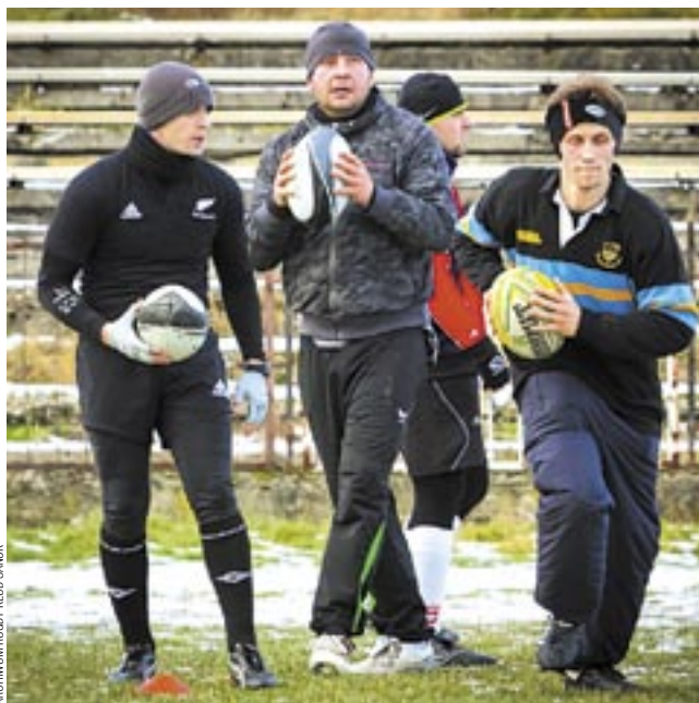
Teraz treningi, wiosną sparingi, a od jesieni rozgrywki ligowe. Oczywiście jeżeli wszystko pójdzie zgodnie z planem.

Sanockim rugbistom życzymy, by nie tracili zapala i motywacji do doskonalenia umiejętności. Wtedy z pewnością coraz lepiej będą sobie radzić z jajowatą piłką.