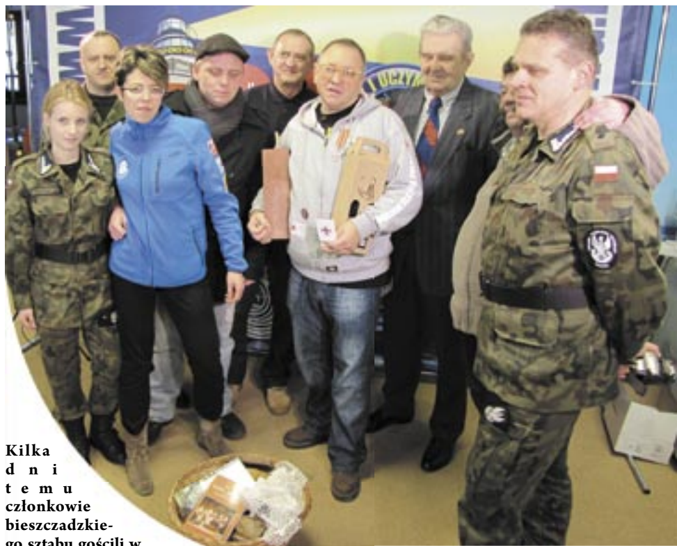
Kilka dni temu członkowie bieszczadzkiego sztabu gościli w warszawskiej centrali WOŚP, dogrywając szczegóły finału. Przy tej okazji nie mogło zabraknąć fotki z Jurkiem Owsakiem.

To, co najważniejsze, zaplanowano oczywiście na niedzielę. W samo południe z Rynku Galicyjskiego wystartuje „Bieg po zdrowie”, wiodący pętlą liczącą nieco ponad 2 kilometry. Jego najbardziej wytrwali uczestnicy o godz. 12.30 wyruszą w stronę centrum miasta, niczym olimpijski znicz niosąc ze sobą symboliczne światelko do nieba. Na Rynku mają zameldować się przed godz. 13, na którą zaplanowano oficjalne otwarcie WOŚP. I zaczną się wszelkie atrakcje. Przez cały czas czynne będą: stacja krótkofalarska, nawiązująca międzynarodowe łączności na falach radiowych oraz tyrolka i ścianka wspinaczkowa. W programie także Strefa Ruchu (godz. 14) z pokazami fitness, symulacją jazdy na rowerze ulicami Sanoka oraz konsultacjami z instruktorami i trenerami personalnymi, a także pokaz sprzętu służb mundurowych (godz. 16) z udziałem policji, straży pożarnej i straży granicznej. Nie zabraknie także tradycyjnych licytacji. Organizatorzy zgromadzili wiele atrakcyjnych „fanów” – dzieła sztuki lokalnych artystów, noclegi w bieszczadzkich hotelach i pensjonatach oraz... koszulkę piłkarskiej reprezentacji z autografem Roberta Lewandowskiego. A o godz. 20 nastąpi tradycyjne „Światelko do nieba” z pokazem sztucznych ogni.