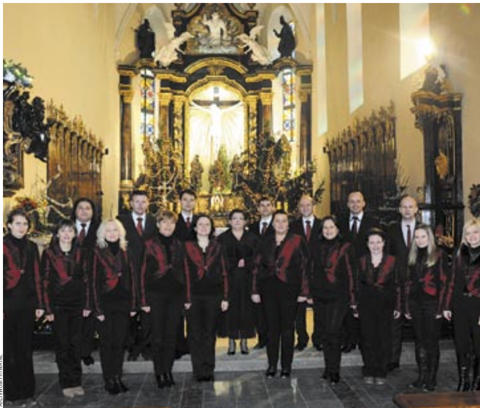
Kołędowe tournée po Kresach na długo zapadnie w serca członków Chóru Kameralnego. Na zdjęciu – występ w pięknej katedrze w Kamieńcu Podolskim.

Członkowie Sanockiego Chóru Kameralnego składają podziękowania za pomoc w organizacji wyjazdu Burmistrzowi Miasta Sanoka, Staroście Powiatu Sanockiego i Wójtowi Gminy Sanok.