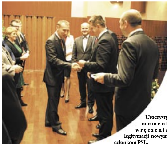
Uroczysty moment wręczenia legitymacji nowym członkom PSL.