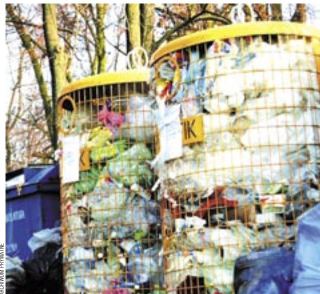
Mieszkańcy gminnych miejscowości będą mniej płacić za śmieci. Oczywiście te segregowane.

Zmiana stawki za odpady powoduje konieczność ponownego złożenia deklaracji, co należy zrobić do końca stycznia. Wzór dostępny jest w urzędzie gminy i na jej stronie internetowej (gmina.sanok.com.pl) w zakładce Moja sprawa/Odpady komunalne. Deklarację z wycieczoną nową opłatą należy złożyć w gminnym magistracie (pok. 503 – dyżur do godziny 17 pełnił będzie przez cały styczeń) lub wysłać pocztą. Na dokumencie powinna figurować ta sama osoba, która złożyła pierwszą deklarację. Wyjątek stanowi przypadek, w którym nastąpiła zmiana właściciela nieruchomości. (b)