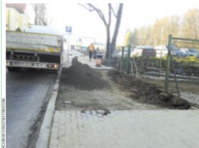
Ulica Mickiewicza. Dziś w tym miejscu leży już nowa kostka.

Nowy chodnik, na odcinku od PWSZ do wyburzonego budynku kortów tenisowych, cieszy oko także na ulicy Mickiewicza, gdzie poszczególne odcinki wymieniano etapami na przestrzeni ostatnich kilku lat. Obecnie kostka brukowa jest już na całej długości traktu. Prace, wykonane przez Powiatowy Zarząd Dróg, kosztowały 35 tys. zł. (jz)