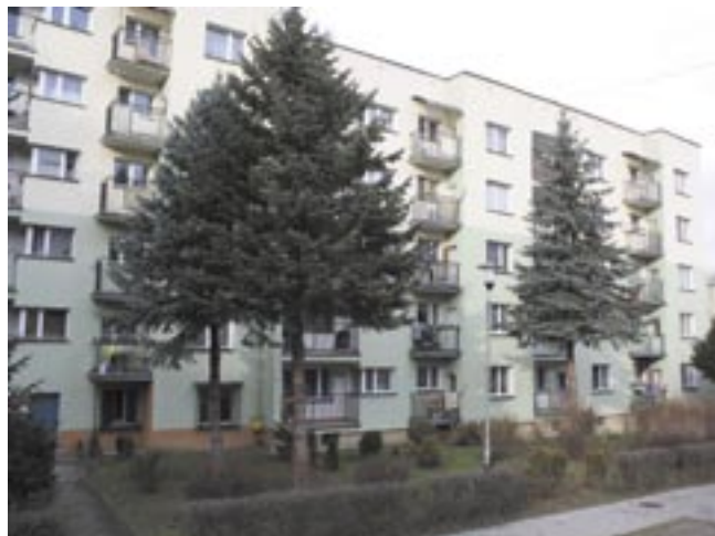
To w tym miejscu straciła życie 65-letnia kobieta, spadając z 4 piętra. Jak doszło do tej tragedii, bada Prokuratura.

Nie umilkły echa sylwestrowych wystrzałów, jak Sanok obiega wieść o tragedii, jaka wydarzyła się przy ulicy Sobieskiego. 2 stycznia ok. godz. 15 z czwartego piętra bloku mieszkalnego wypadła 65-letnia kobieta. Poniosła śmierć na miejscu. Tego samego dnia Powiatowa Komenda Policji w Sanoku poinformowana została o dwóch próbach samobójczych, do jakich doszło w gminie Zagórz i Bukowsko. Na szczęście, obydwie okazały się nieskuteczne.