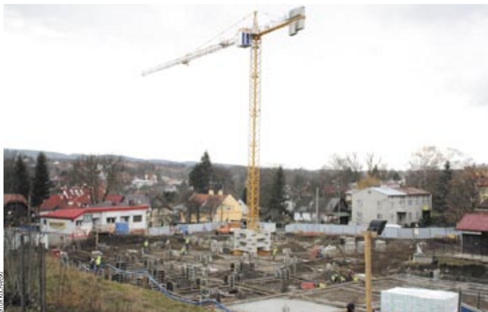
Podobno wszystko co piękne rodzi się w bólach. Czy jest to zapowiedź, że Galeria Sanok będzie ozdobą Sanoka?