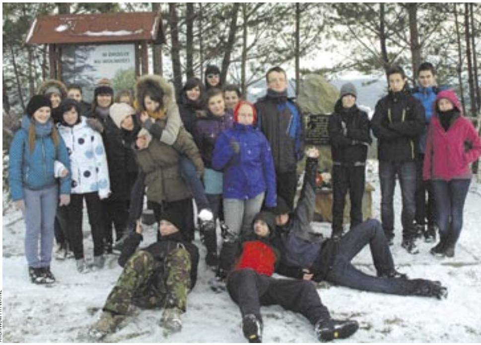
W ramach projektu „W Braterskim Kręgu” odbyło się wiele wartościowych spotkań, wyjazdów i imprez.

Dla najmłodszych wiele radości dostarczyły „Zuchowe Mikołajki” w SP 1 z udziałem 91 zuchów.