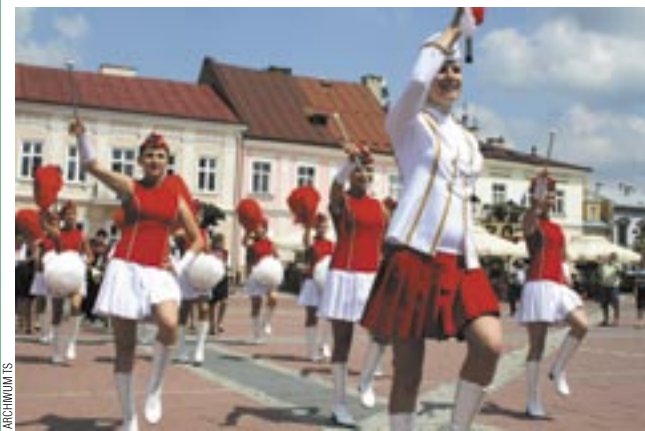
Orkiestra dęta z Jącmierza niewątpliwie będzie jedną z ozdób Światowego Zjazdu Sanoczanie. Czy można się oprzeć jej urokowi?

Szanowni Mieszkańcy, tylko działając wspólnie, jesteśmy w stanie zmieniać rzeczywistość.