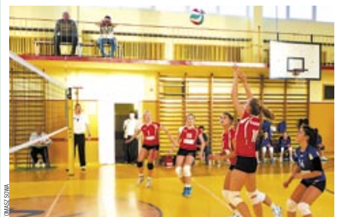
Siatkarki Sanoczanki grają coraz lepiej.

Miłą niespodzianką sprawiły siatkarki Sanoczanki PBS Bank, odnosząc pewnie zwycięstwo w Jaśle. Dzięki temu nasza drużyna uciekła z ostatniego miejsca w tabeli III ligi, przesuując się o 2 pozycje.