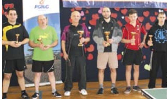
Najlepsi zawodnicy kategorii do 40 lat i weteranów.

Świetne frekwencje mają ostatnio turnieje tenisa stołowego. Po imprezie w Szkole Podstawowej nr 3 podobną zorganizowało Gimnazjum nr 3, znów z udziałem około 50 osób. Był to pierwszy krok ku reaktywacji sekcji ping-pongowej.