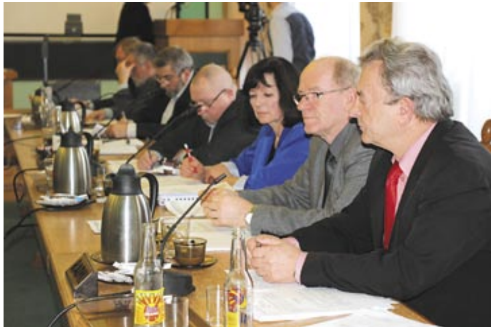
Którzy z radnych będą realizować przyszłe inwestycje, zdecydują wyborcy za kilka miesięcy.

Łączna wartość wszystkich projektów złożonych przez Sanok na lata 2014-2020 sięga prawie 203 mln zł. Realizacja sporej części z nich – z różnych względów – wydaje się raczej mało realna w najbliższych latach. O tym, które zyskają uznanie i finansowe wsparcie, dowiemy się niebawem.