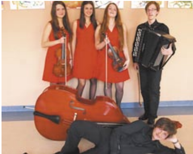
Zespół kameralny sanockiej PSM „Creative Quintet” może być ozdobą każdego koncertu, łącznie z tymi, które odbywają się na najbardziej profesjonalnych scenach.

Lutowy koncert Młodej Sanockiej Filharmonii był równocześnie uroczystym Popisem Półrocznym uczniów Państwowej Szkoły Muzycznej w Sanoku. Sala Koncertowa PSM wypełniona była do ostatniego miejsca, a popisy młodych artystów mogły się podobać.