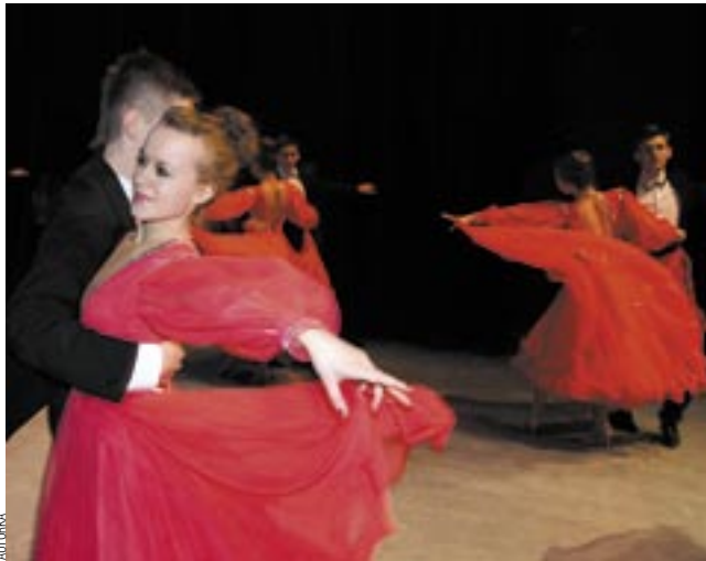
Uroda, wdzięk, elegancja, dobra technika... Publiczność entuzjastycznie przyjęła występy tancerzy z Flamenco.