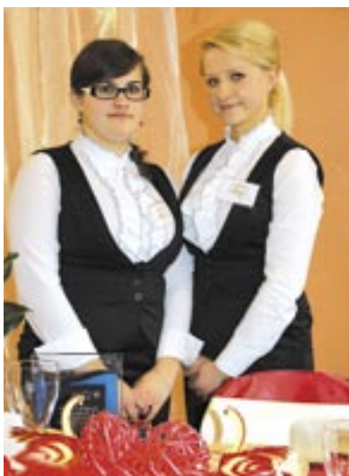
Tym razem wygrały...

Wyjątkowo piękną oprawę miała tegoroczna edycja Wojewódzkiego Konkursu Fryzjerskiego oraz Wojewódzkiego Konkursu Dekoracji Stołów zorganizowanych w Zespole Szkół nr 5. Motyw przewodni obu stanowiła miłość – od dekoracyjnych „Walentynek” na stole, po fryzjerskie „ślubne inspiracje”. Całość dopełniał odpowiedni wystrój sali oraz stroje, w których modelki wyglądały jak autentyczne panny młode.