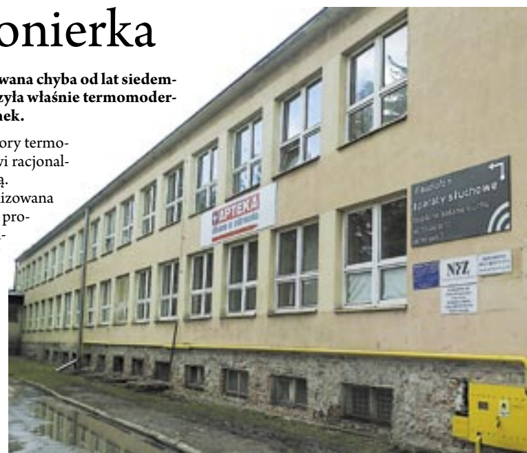
W czerwcu budynek przychodni zmieni się nie do poznania.

Inwestycja realizowana jest w ramach dużego projektu „Termomodernizacja budynków SP ZOZ w Sanoku”, finansowanego z funduszy unijnych, o wartości blisko 3 mln zł. Ocieplenie przychodni, według kosztorysu, miało kosztować 800 tys. zł, ale po przetargu kwota spadła do 600 tys. zł. Prace potrwać do końca czerwca. (jz)