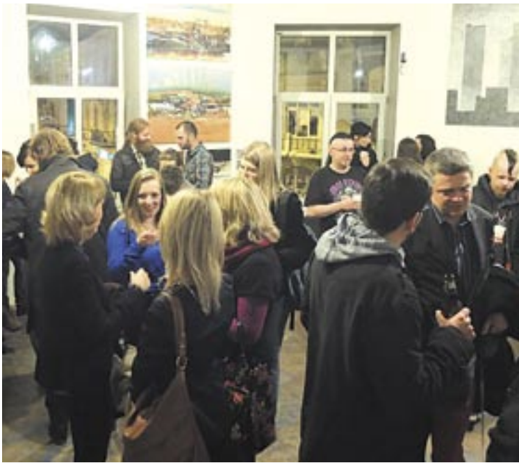
Artyści nawet bez sztalug i pędzla mają wzięcie...

Z zamiarem uruchomienia takiej pracowni nosiliśmy się od