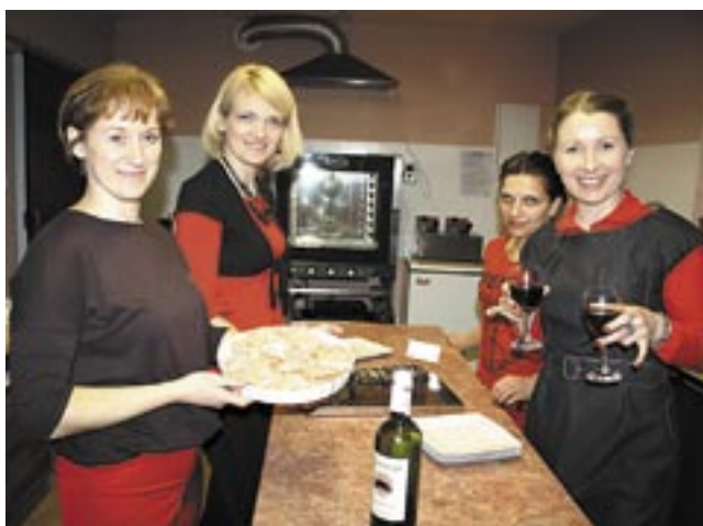
Założenie własnego biznesu to skok na głęboką wodę i ciężka praca. Na zdjęciu – panie z Kawiarni „Vita Caffè”.

Interes powoli się rozkręca, choć na razie nie ma mowy o zyskach, m.in. ze względu na bar-