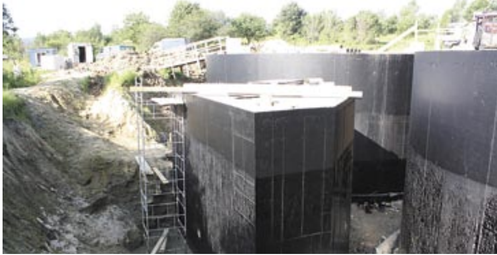
Największe inwestycje, związane z projektem „Poprawa gospodarki wodno-ściekowej w aglomeracji Sanok”, o wartości 124 mln zł brutto, realizowano w latach 2011-2013. Na zdjęciu – budowa zbiorników wyrównawczych przy ul. Kenara.

W Mielcu Rada Miasta w ogóle nie podnosiła stawek w 2014 roku, pozostawiając ubiegłoroczne. Woda i ścieki kosztują w tym mieście 8,76 zł za kubik, natomiast abonament 9,10 zł.