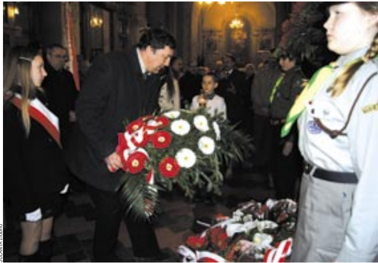
Złożenie kwiatów pod Krzyżem Katyńskim w kościele farnym.