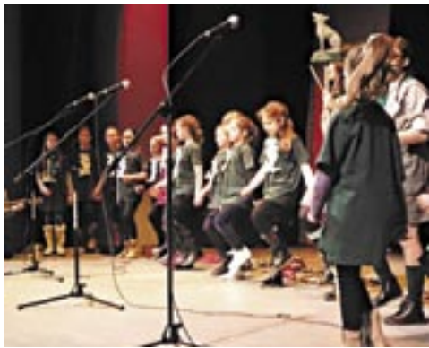
Gromada Zuchowa z SP4.

Blisko 20 wykonawców wystąpiło podczas Festiwalu Piosenki Zuchowej i Harcerskiej Hufca ZHP Ziemi Sanockiej, który zorganizowany został w Sanockim Domu Kultury.