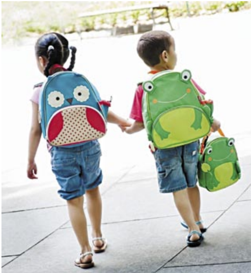
Batalia o sześciolatki toczy się od kilku lat. Nigdy wcześniej, w żadnej sprawie, opór społeczny nie był aż tak silny. Ludzie, nawet prości, wiedzą, że na dzieciach nie wolno eksperymentować.