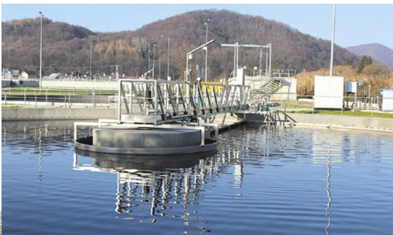
Nowa oczyszczalnia ścieków na tle nadszańskich wzgórz prezentuje się wspaniale. Będzie się można o tym przekonać podczas zapowiadanych w najbliższym czasie Otwartych Drzwi.

Wiele już mówiliśmy, że wpływ na wzrost cen miała przede wszystkim realizacja inwestycji wartej ponad 101 mln złotych net-