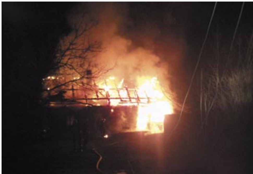
Strażacy nie mieli już czego ratować. Zdjęcie pożaru w Lisznej zrobione przez jednego z internautów.

Tragiczny finał miał pożar, do którego doszło w nocy z czwartku na piątek w Lisznej. Ogień niemal całkowicie strawił drewniany budynek mieszkalny, w którym spał 55-letni mężczyzna. Jego starszy brat zdołał się uratować. Strażacy przypuszczają, że przyczyną pożaru było zaproszenie ognia z palącego się papierosa.