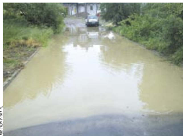
Tak wygląda ul. Kasztelańska po każdym deszczu.

O wyjaśnienie sprawy zwróciliśmy się do przedstawiciela UM. – Ulica Kasztelańska jest ulicą osiedlową, budowaną sukcesywnie w miarę powstawania nowych domów. W miejscu, gdzie zebrała się woda, istnieje spadek terenu tworzący zagłębienie, to najniższy punkt terenu. Wybudowana została tam tzw. studnia chłonna, której zadaniem jest pochłanianie wód opadowych, jednak przy ulewach, studnia ta nie jest w stanie pomieścić tak dużej ilości wód. Rozwiązaniem byłoby tutaj wybudowanie kanalizacji deszczowej, która odprowadzałaby wody opadowe do którejś z istniejących instalacji,