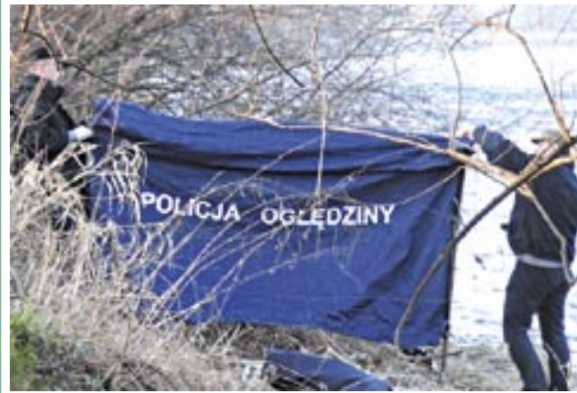
Policyjne parawany zasłoniły zwłoki przed wzrokiem gapiów.

W piątek około godziny 16 w Sanie niedaleko Kauflandu dokonano makabrycznego odkrycia. W wodzie, kilka metrów od brzegu, znaleziono niezidentyfikowane zwłoki. Zauważył je przypadkowy przechodzień, który powiadomił Policję.