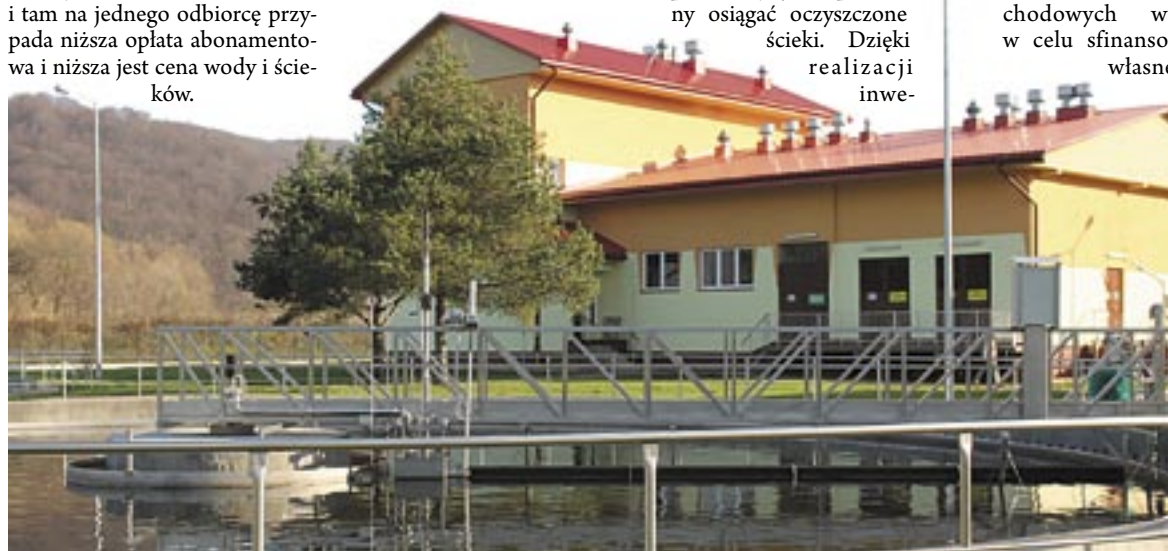
Ujęcie wody i oczyszczalnia ścieków po modernizacji to nie te same obiekty, co dotychczas. Inna jest też woda, inne ścieki. Ale inna też cena, jakie sanocznicy muszą za nie płacić.

Zarząd Sanockiego Przedsiębiorstwa Gospodarki Komunalnej