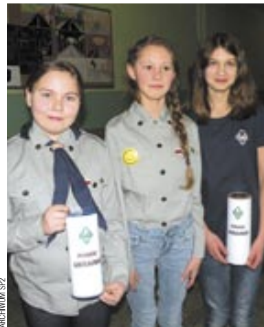
Harcerki z SP2 zebrały ponad tysiąc złotych. Taki wynik idzie w świat!