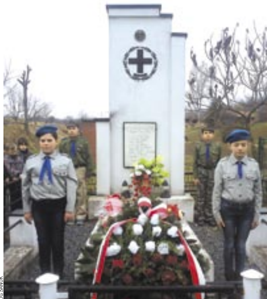
O pomnik w Falejówce dba miejscowa młodzież i harcerze.