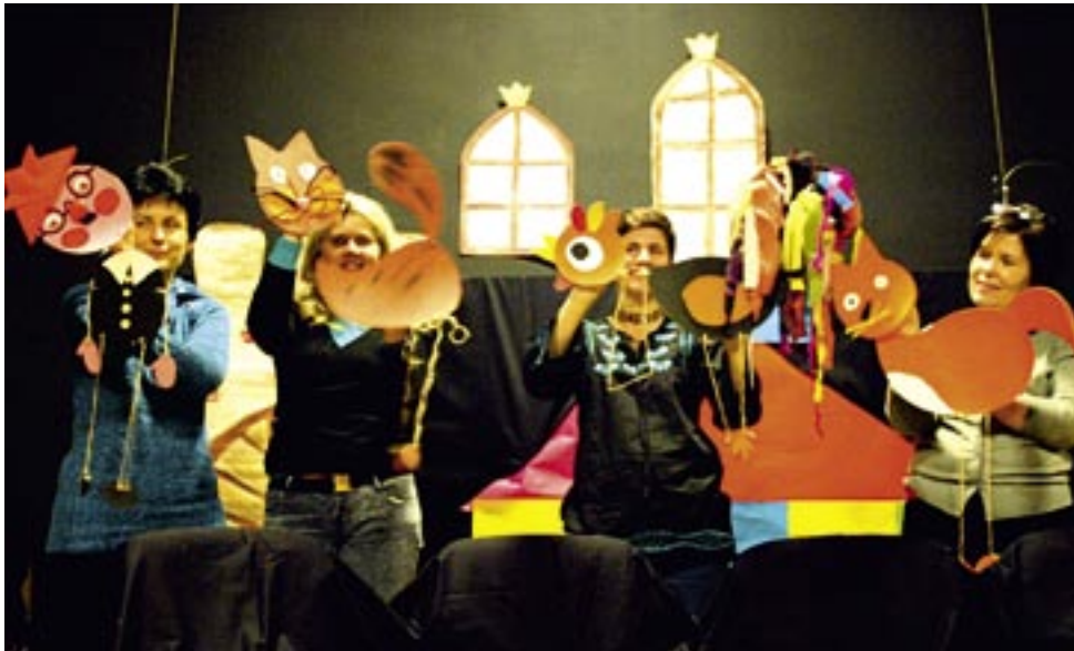
Etiuda o zwierzętach chcących zatrudnić się w cyrku okazała się jedną z najlepszych.

– Te warsztaty to rewelacja! Bardzo dużo się nauczyłam i na pewno wykorzystam tę wiedzę w mojej pracy z dziećmi. Zajęcia okazały się ciekawe i rozwijające również dla mnie samej. Nie sądziłam, że teatr lalek może być tak inspirujący – mówią zgodnym chórem uczestniczki warsztatów teatru lalek dla nauczycieli, zorganizowanych przez BWA.