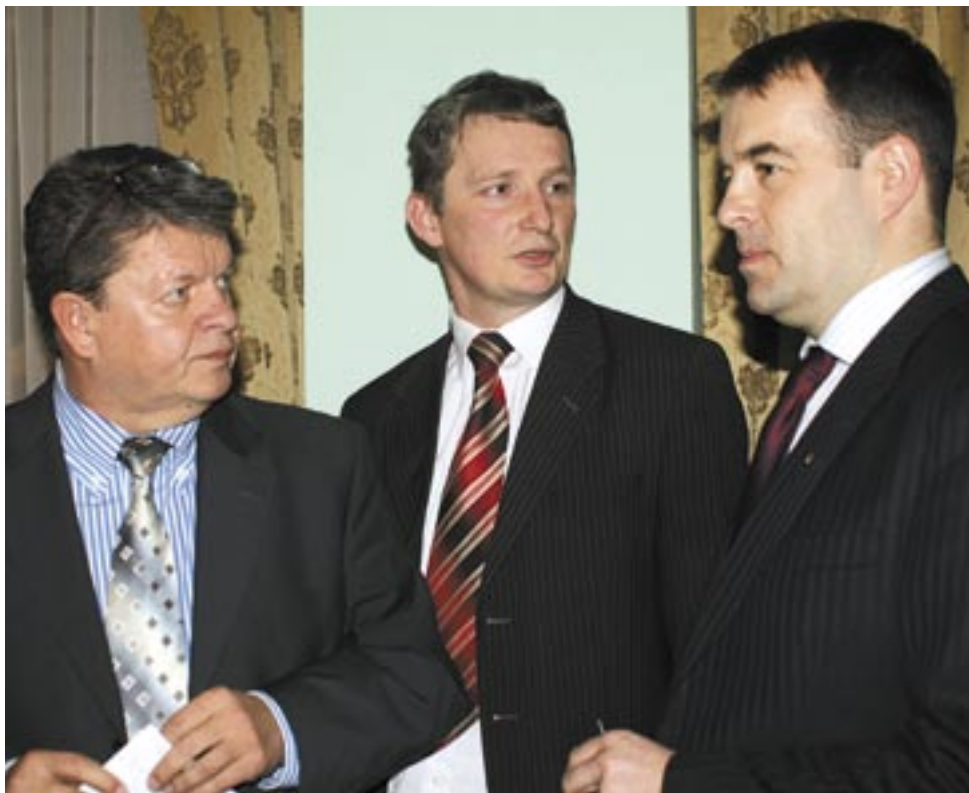
Nie zjemy im tego, ale wkrótce przedstawiciele władz powiatu mogą mieć kolejny „finansowy” orzech do zgryzienia. Oby pogłoski o zwrocie pieniędzy za rok 2010 nie okazały się prawdziwe.

Wbrew pozorom sytuacja w najmniejszym stopniu dotyczy Specjalnego Ośrodka -Szkołno-