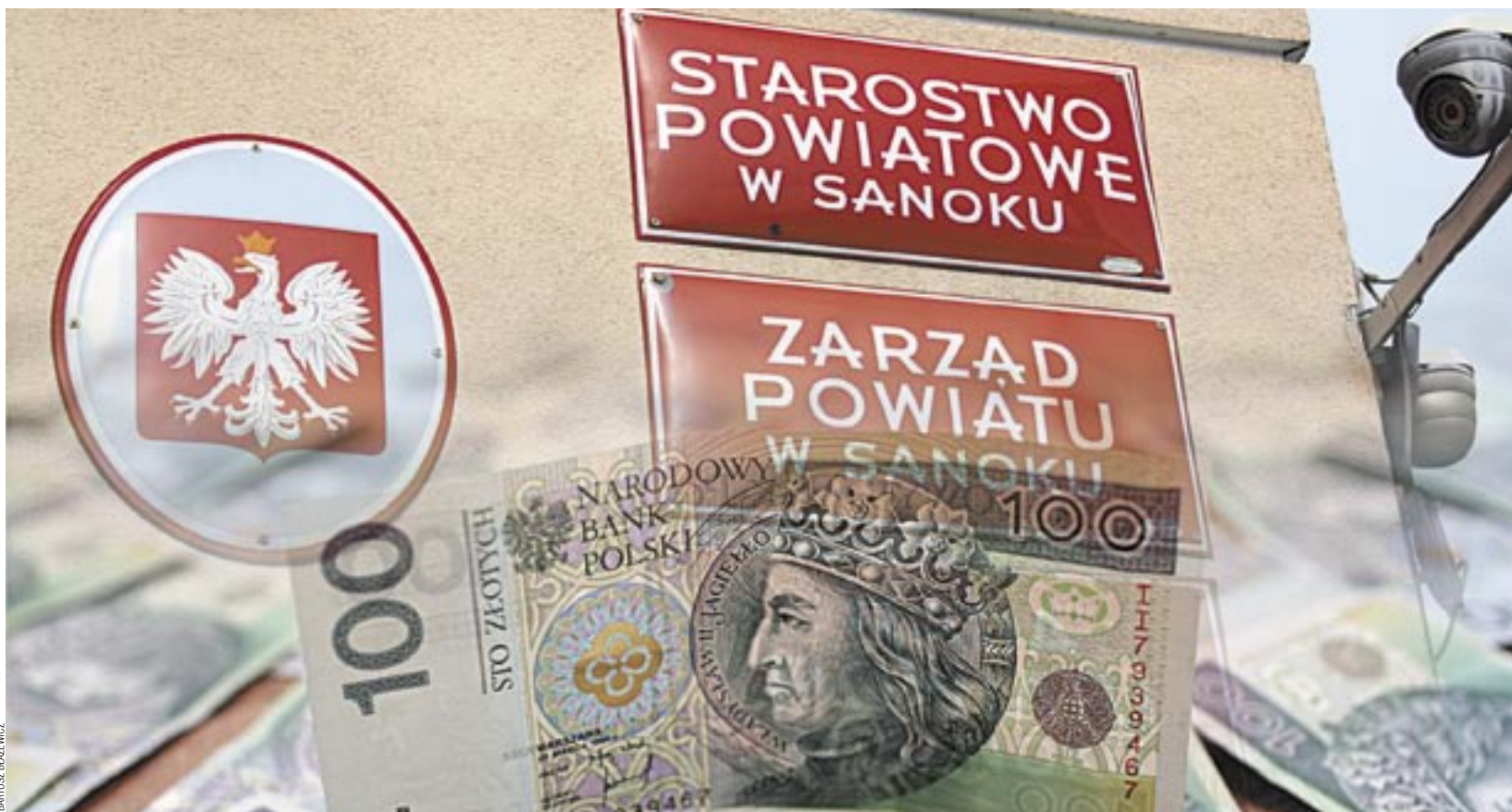
Nie od dziś wiadomo, że starostwo jest w trudnej sytuacji finansowej. Konieczność zwrotu kolejnego miliona złotych byłaby poważnym ciosem w powiatowy budżet.

Jeżeli w każdej plotce jest ziarno prawdy, to w tym przypadku kielkuje ono szybko, bo kontrola UKS-u trwa, a coraz więcej osób twierdzi, że jej efekty mogą poważnie uszczuplić kasę powiatu. Coś jest na rzeczy – obydwaj starostowie nie chcą, póki co, komentować sprawy, udzielając jedynie zdawkowych odpowiedzi. W pewnym sensie trudno im się dziwić, biorąc pod uwagę, że w wielu samorządach kontrole wykazały znaczne nieprawidłowości, sięgające nawet kwot kilkakrotnie wyższych.