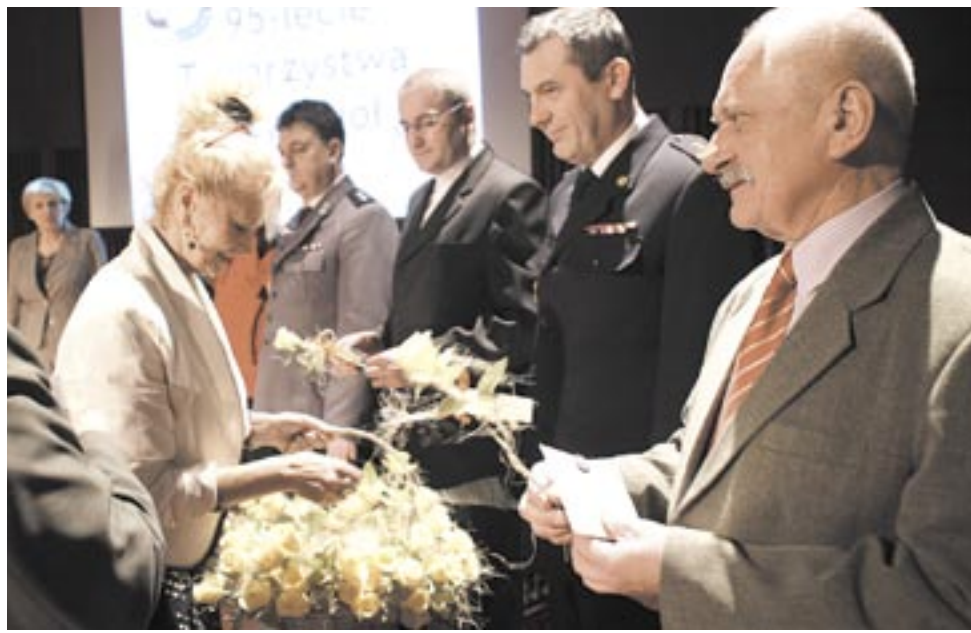
Uroczysty moment wręczenia jednego z najcenniejszych odznaczeń – odznaki „PRZYJACIEL DZIECKA”. I z jakże pięknym dodatkiem w postaci bibulkowych róż wykonanych przez same dzieci.