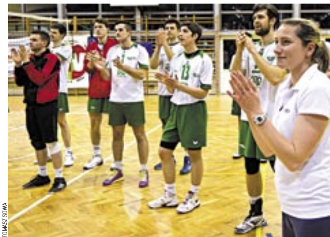
Mimo porażki w ostatnim meczu siatkarki TSV Mansard zostali pożegnani owocą na stojąco. Było to podziękowanie od kibiców za utrzymanie II ligi dla Sanoka.