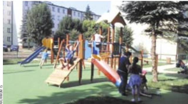
Place, i bawiące się dzieci, będą bardziej bezpieczne pod okiem kamer.

Niedawno pisaliśmy o zainstalowaniu przez Spółdzielnię Mieszkaniową „Śródmieście” 28 kamer, które obejmą swoim zasięgiem 95 procent zasobów spółdzielczych. System monitoringu rozwija także Sanocka Spółdzielnia Mieszkaniowa, która docelowo planuje 25 kamer. Na dziś ma ich 8.