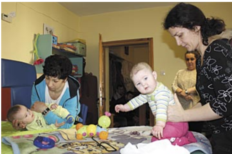
W takich rękach człowiek od razu zdrowieje...