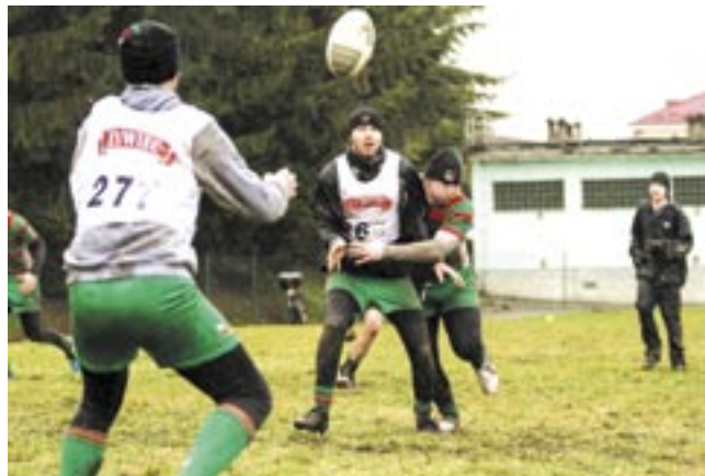
Sparing z Rzeszowem był dobrą szkołą rugby.

Zawodnicy Rugby Klubu Sanok mają za sobą pierwszy sparing. Na boisku przy Straży Granicznej podejmowali drużynę z Rzeszowa, która jednak okazała się wyraźnie lepsza.