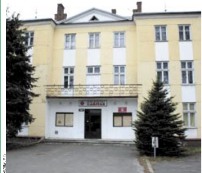
Miejmy nadzieję, że przez setnymi urodzinami budynek wróci do dawnej świetności...