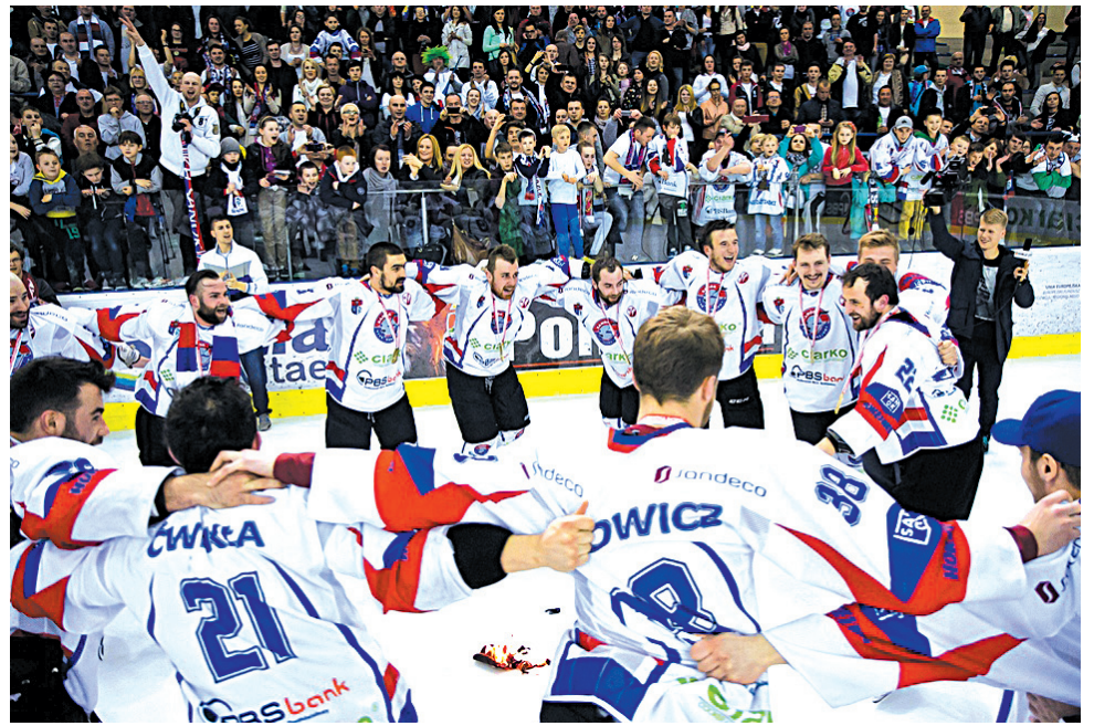
Szalony taniec zwycięzców wokół płonącego kapelusza trenera.