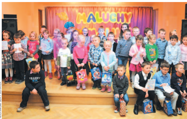
(z) Laureaci konkursu „Maluchy Malują” z trudem mieścili się w kadrze.

Finał konkursu odbył się pod koniec marca w „Puchatku”. Imprezę rozpoczęła zabawa muzyczna, która wprowadziła uczestników w klimat „Podwodnego świata”. Wszyscy wyróżnieni otrzymali nagrody i pamiątkowe dyplomy, a ich prace można podziwiać na wystawie konkursowej.