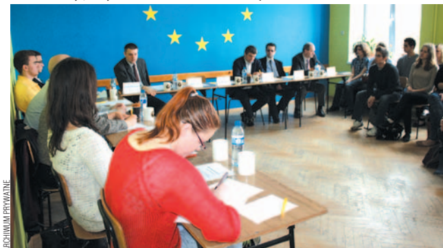
W trakcie debaty młodzież wykazała się dużymi wiadomościami o Unii Europejskiej.

Dnia 2 kwietnia 2014 roku w II Liceum Ogólnokształcącym w Sanoku odbyła się debata, przygotowana w ramach zadania rekrutacyjnego w związku z ubieganiem się o mandat poselski na XX Sesję Sejmiku Dzieci i Młodzieży.