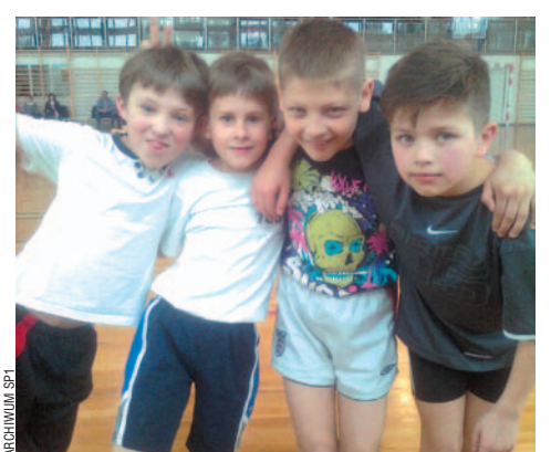
Srebrni chłopcy z „Jedynki”.

W zawodach gimnazjalnych czołową dziesiątkę klasyfikacji drużynowej dziewcząt zamknęły gimnastyczki z G4.