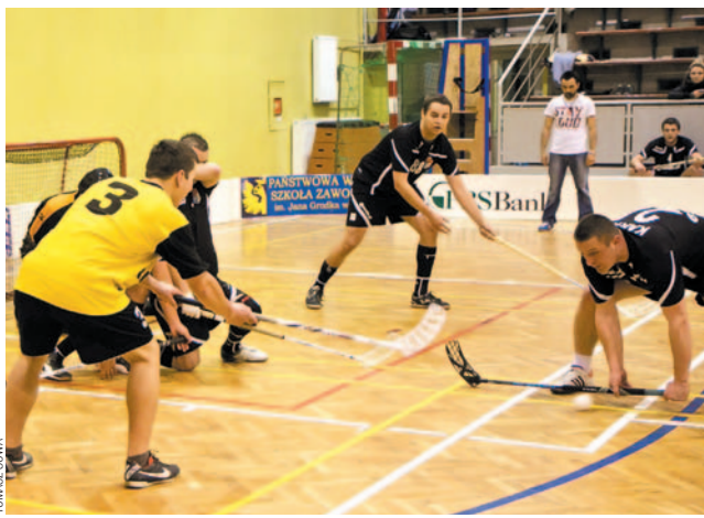
Broniąca tytułu drużyna esanok.pl (czarne stroje) okazała się najlepsza w fazie zasadniczej.

W poniedziałek początek fazy play off: esanok.pl zagra z G3, Trans-Drew z Automanią, InterQ z El-Budem, a Forest z Politechniką. Trzy ostatnie drużyny – AKSU Polska, isanok.pl i PWSZ – zagrają trójmecze o 9. miejsce.