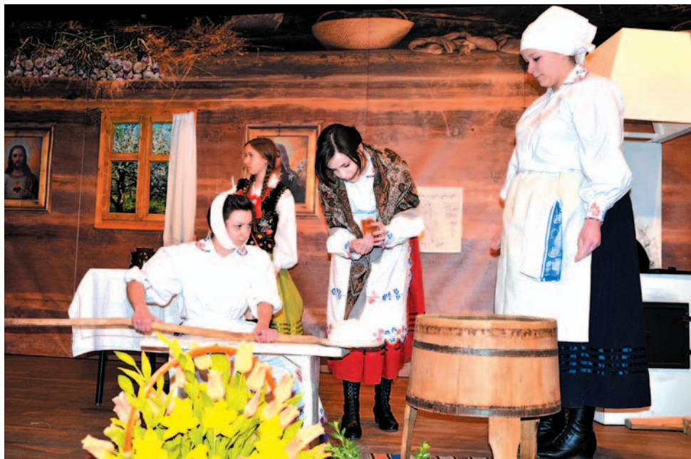
Inscenizacje przypominające dawne obrzędy są barwnym elementem każdej wystawy w „Górniku”.

Wystawy świąteczne, organizowane przez gminę Sanok i Gminny Ośrodek Kultury, to swoisty fenomen. Po pierwsze, przyczyniły się do wręcz erupcji rękodzielnicstwa na naszym terenie, a po drugie, spowodowały zainteresowanie tradycją i dawnymi zwyczajami. Dowodem jest choćby działalność grupy obrzędowej ze Strachociny, która zaprezentowała podczas otwarcia wystawy obrzęd pieczenia chleba w Wielki Piątek. Występujący w przedstawieniu młodzi ludzie nie tylko przekazują tradycję, ale też przypominają, jak brzmiała gwara, którą kiedyś na co dzień posługiwali się ich dziadkowie.