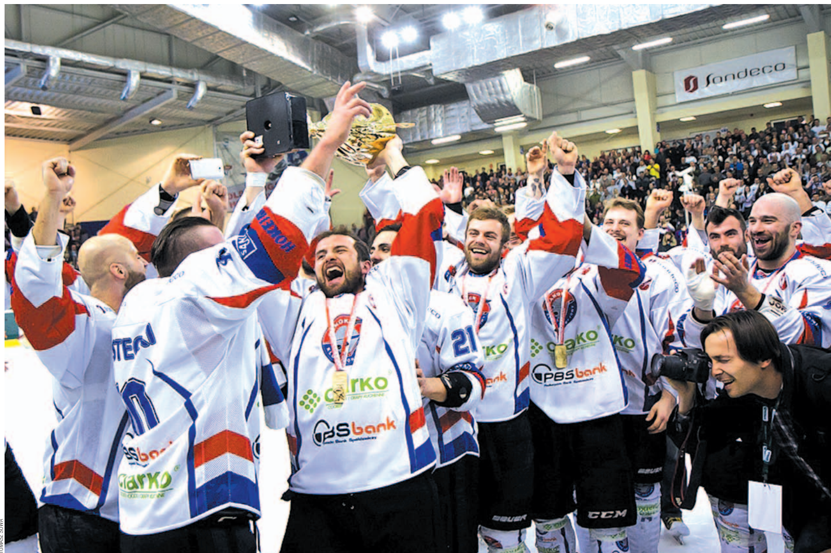
Umieli walczyć, żartować, podostrzyć jak trzeba, a także się cieszyć. Wszystko umieli. I właśnie dlatego wywalczyli tytuł mistrza Polski w hokeju na lodzie dla Sanoka. Brawo! Brawo! Brawo!

Przed rokiem przystępowali do budowy drużyny niemal od podstaw. Nieudany poprzedni sezon sprawił, że sponsorzy postanowili przykręcić nieco kurek z pieniędzmi, na co reakcją było odejście z Sanoka kilku