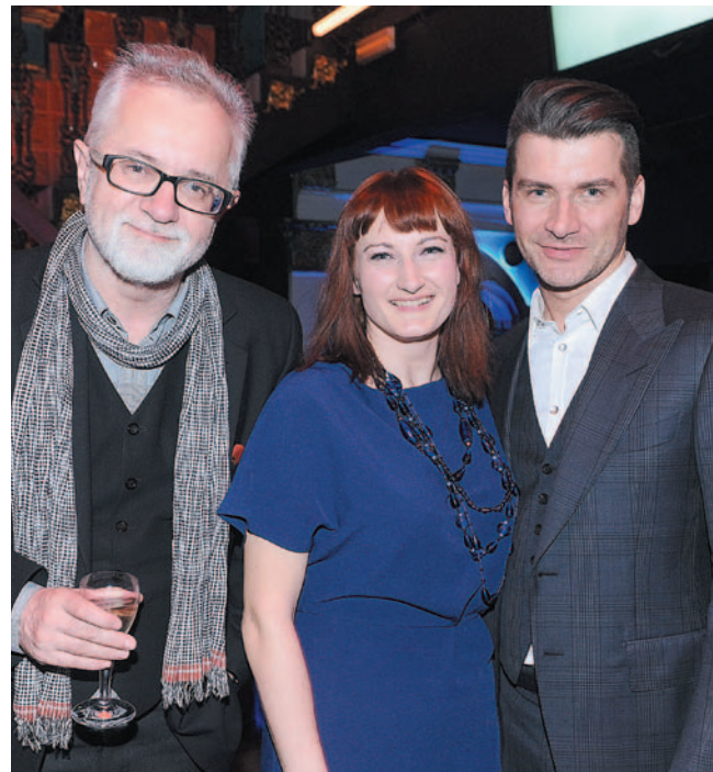
Tomasz Kamel podobno w realu jest jeszcze bardziej przystojny. Po lewej – znany rysownik Henryk Sawka, który tworzy rysunki na rzecz kampanii „Rak. To się leczy”.