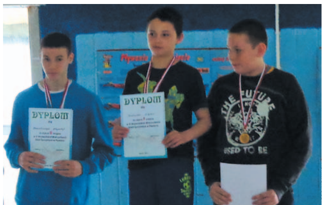
A po zawodach – dekoracja medalistów.

Pływacy Specjalnego Ośrodka Szkolno-Wychowawczego wciąż najlepsi – w szóstej edycji Mistrzostw Województwa Szkół Specjalnych odnieśli szóste zwycięstwo! Zawody tradycyjnie rozegrano na basenie sanockiego MOSiR-u.