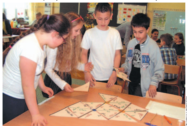
„Kajtek” okazał się konkursem zmuszającym do poruszania głową, ale także świetną zabawą.

3 kwietnia w Szkole Podstawowej nr 1 odbyła się XII edycja Międzszkolnego Interdyscyplinarnego Konkursu „Kajtek”. W rywalizacji wzięli udział uczniowie klas III z czterech sanockich szkół: SP 1, SP 2, SP 3 i SP 4.