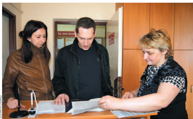
Podatnicy odwiedzający w sobotę Urząd Skarbowy twierdzą, że Dni Otwarte to bardzo dobry pomysł.

nadpłaconego podatku. – Zgodnie z ustawą mamy na to trzy miesiące, ale w przypadku rozliczeń elektronicznych robimy to wiele szybciej – uszczelniliśmy od naczelnika. Na początku roku, kiedy rozliczeń jest mało i można weryfikować je na bieżąco, zwrot następuje w ciągu kilku