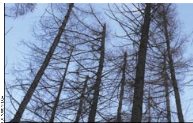
Z niepokojem patrzymy na zamierające w wielu miejscach w Bieszczadach drzewa. Wszak to nasz największy majątek!

Do tego dochodzi zamieranie jesionu, spowodowane czynnika-