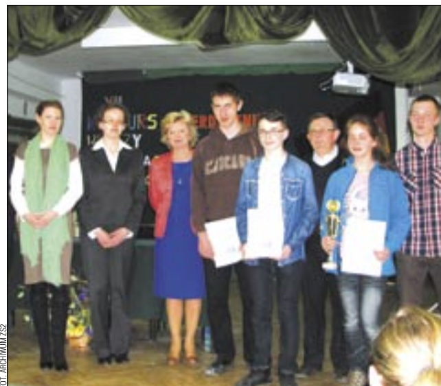
Laureaci wraz z organizatorami.

Świąteczną frekwencję miał XII Konkurs Wiedzy o Krajach Niemieckojęzycznych, tradycyjnie organizowany w Zespole Szkół nr 2. Tym razem do zmagani przystąpiła blisko 60-osobowa grupa uczniów z wszystkich sanockich gimnazjów i kilku okolicznych.