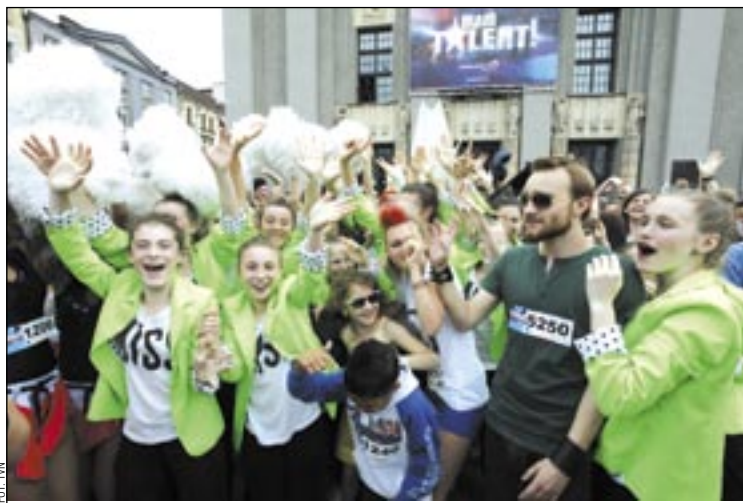
Pragnęlibyśmy, aby na majowym castingu do programu „Mam talent” w Rzeszowie pojawili się sanocznicy. Wszak talentów ci u nas dostatek!

Możesz przesłać płytę z prezentacją swojego talentu na adres: FREMANTLEMEDIA POLSKA, 02 – 724 WARSZAWA, UL. WOŁODYJOWSKIE-