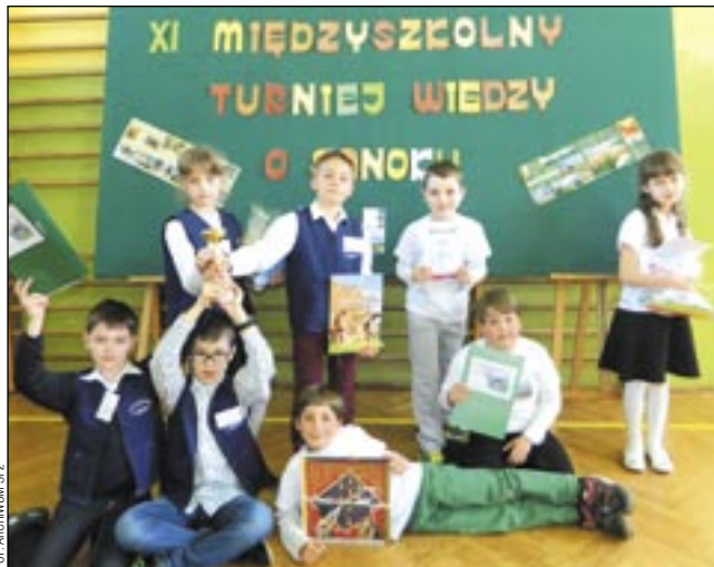
Uczestnicy turnieju wykazali się bardzo dużą wiedzą o rodzinnym mieście.