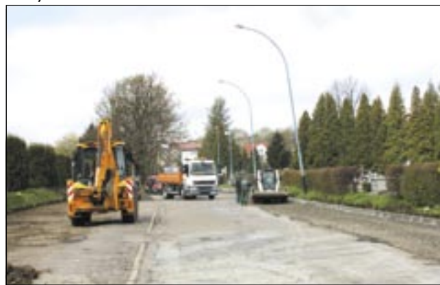
Był zarośnięty, trudny do pokonywania rów, będą (oznakowane) miejsca parkingowe. To naprawdę dobry pomysł!

Miasto Sanok prowadzi prace zmierzające do powiększenia liczby miejsc parkingowych na Cmentarzu Centralnym. Już podczas świąt wielkanocnych odwiedzający cmentarz mogli z części z nich korzystać.