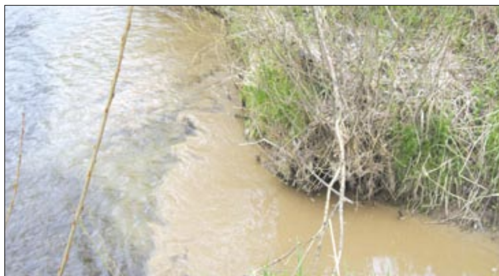
Tak wyglądało miejsce, w którym brudna woda wlewała się do czystego Sanoczka.