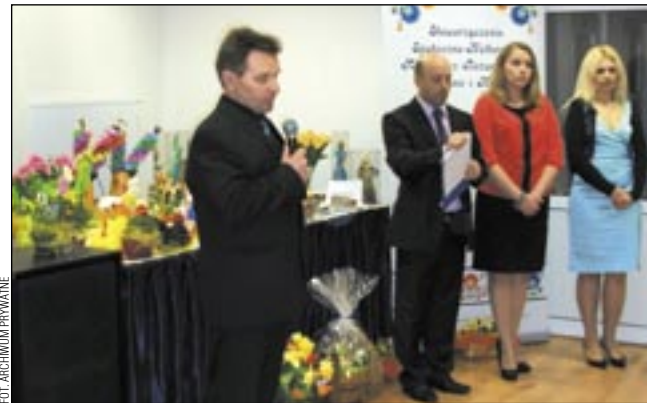
„Barwy” były piękne, „smaki” doskonałe. Dla Stowarzyszenia na Rzecz Rozwoju Wsi: Szczawne i Kulaszne wielkanocna impreza była mocnym impulsem do działania.

Celem powstałego stowarzyszenia jest właśnie integrowanie społeczności lokalnej, inicjowanie imprez kulturalnych i edukacyj-