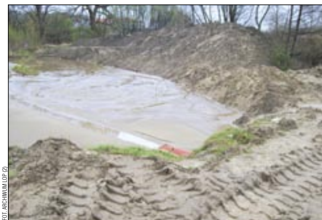
Osadnik z pożwirową „pluczką”, która najprawdopodobniej trafiła do pobliskiego cieku.

Bardziej konkretnie do sprawy odnoszą się przedstawiciele okręgu PZW: – Świnka nie weszła na tarło, mogły uciec też inne gatunki, a to dla nas wymierna strata. Jaka? Tak na gorąco trudno powiedzieć, szacowaniem zajmie