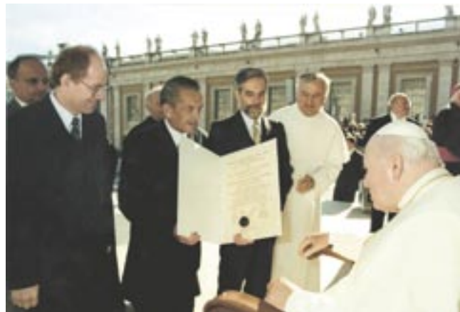
Historyczny moment wręczenia honorowego obywatelstwa.