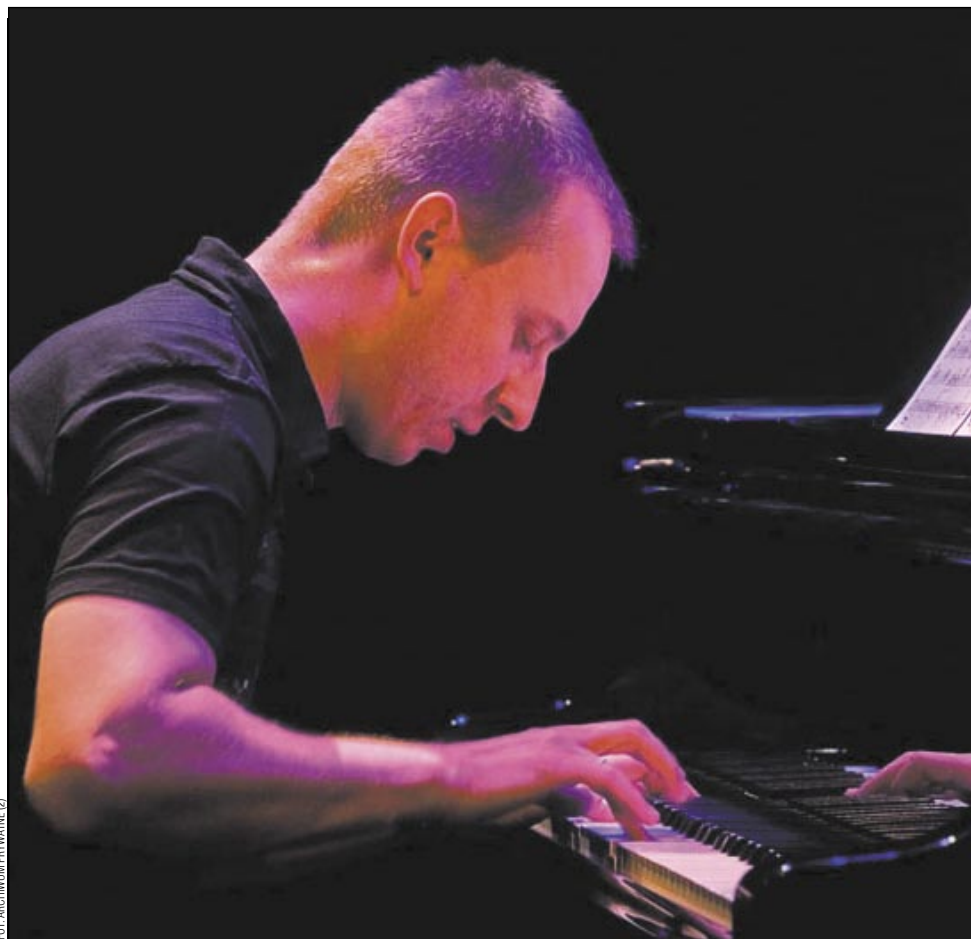
Zaczynał od klasyki, dziś jest uznawany za jednego z najzdolniejszych jazzmanów młodego pokolenia.

Laureat Gwarancji Kultury 2014 w kategorii jazzo-rockowej odebrał nagrodę podczas uroczystej Gali w Warszawie, nie kryjąc