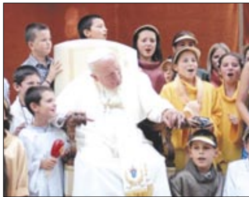
Zdjęcia z papieżem to dziś cenne pamiątki.

Dziewięć lat, które minęły od jego śmierci, to dla nastolatków cała epoka. – Trzeba ich uczyć, tłumaczyć, pokazywać, kim był – zauważa nasz rozmówca.