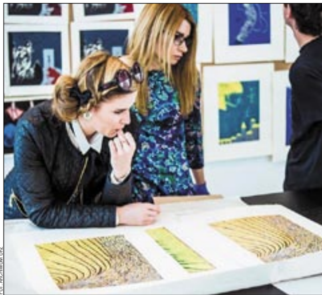
Absolwenci wydziału sztuki URz są nie tylko zdolni, ale i dobrze wykształceni.

„Artyści wszystkich sztuk próbują zamknąć w formę to, co się jej wymyka: niejasne emocje, myśli, wrażenia i przeczucia. Łowią tajemnice i je tworzą. Stale też, zwłaszcza współcześnie, przekraczają umowne granice, które oddzielają od siebie dziedziny duchowej aktywności.” – podkreśla Magdalena Rabizo-Birek w katalogu wystawy pn. „19”, której wernisaż odbędzie się dziś, 9 bm., o godz. 16 w Galerii Miejskiej Biblioteki Publicznej.