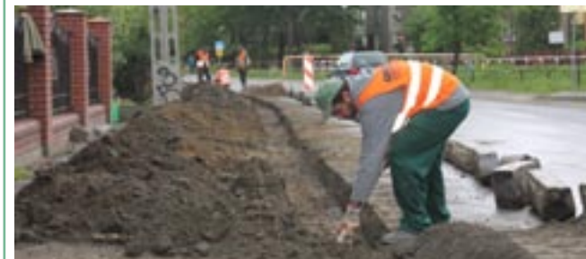
Drogowcy już działają na Podgórzu. Oby tylko dopisała pogoda.

Ruszyła budowa nowego chodnika przy ulicy Podgórze. Powstanie w sumie 800 metrów pieszego traktu z kostki brukowej. Zadanie realizowane jest przez Powiat Sanocki.