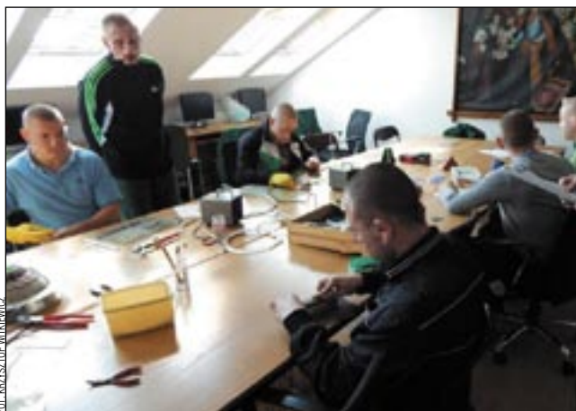
Ci, którzy wzięli udział w warsztatach, nie żalowali.

*/jot/ Opatentowana i opracowana przez Louisa Tiffany'ego w 1895 r. metoda umożliwiła wytwarzanie i komponowanie stosunkowo lekkich, wielobarwnych, niezwykle fantazyjnych kloszy do lamp. Metoda Tiffany'ego bardzo szybko się rozprzestrzeniła po całym świecie i sprawiła, że witraż przestał być drogim, niedostępnym dla większości ludzi produktem. Dziś przy pomocy tej metody wykonuje się nie tylko lampy, ale i inne przedmioty sztuki użytkowej.