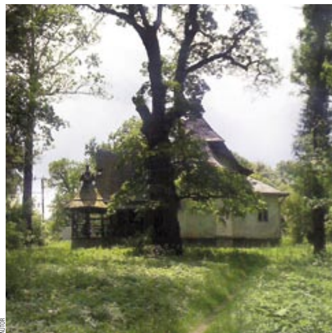
To jedno z piękniejszych miejsc na ziemi, kryjące w sobie bardzo ciekawą historię.