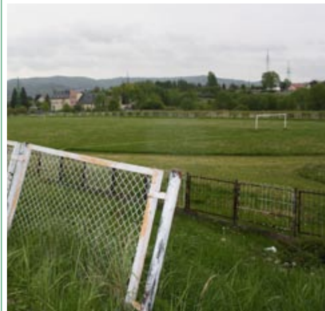
Ciekawe za ile lat stadion miejski przy Stróżowskiej stanie się jedną ze sportowych wizytówek Sanoka. Dziś wygląda tak właśnie.

Wizja ciekawa i dobrze byłoby, żeby zaczęto ją realizować. Miejsce na piłkarski stadion wy-