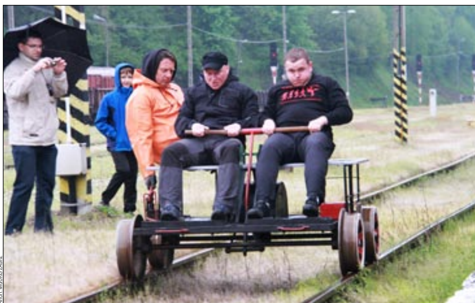
Drezyny podbiły Zagórz. Jego władze liczą na to, że staną się one lokalną atrakcją turystyczną.

Zorganizowany przed rokiem jubileuszowy, X Ogólnopolski Zlot Drezyniarzy, okazał się tak udany, że Zagórz otrzymał prawo organizacji jego kolejnej edycji. Mimo fatalnej aury impreza cieszyła się dużym powodzeniem, a w zawodach drezyniarskich rywalizowało ponad dwadzieścia osób.