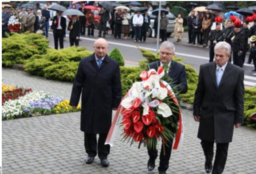
Delegacja miasta składa wieńce od mieszkańców Sanoka pod pomnikiem Wodza Insurekcji.

Minęły już czasy, gdy patriotyczne uroczystości, takie jak 3 Maja, gromadziły po kilka tysięcy uczestników. Od wielu lat grono to tworzą głównie reprezentanci służb mundurowych, poczty sztandarowe oraz członkowie delegacji składający pod pomnikami wieńce i kwiaty. Dodajmy jeszcze orkiestrę. Gdyby odliczyć tych wszystkich, pozostałoby garstka kilkudziesięciu osób. To wszystko.