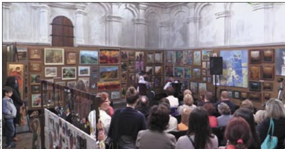
Bieszczadzcy artyści chętnie wystawiają swoje prace w leskiej „Synagodze”.

„Bieszczadzkie zadumania” to cykliczna wystawa, która co roku prezentowana jest w Galerii Sztuki „Synagoga” w Lesku. Jej tradycja sięga 1978 roku, kiedy to po raz pierwszy zorganizowano imprezę pod tą nazwą. Coraz bardziej różnorodna z roku na rok ekspozycja różni się od każdej poprzedniej. Ze względu na temat przewodni prezentowane na niej obrazy, rzeźby, rysunki i ceramika mają swój specyficzny charakter i klimat. Dominują pejzaże biesz-