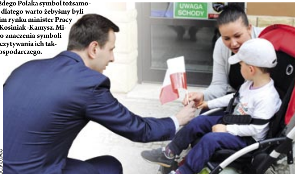
Dostać flagietkę od samego ministra to fajna sprawa. Ale wcale nie trzeba od razu skakać z radości.

Pobyt ministra w Sanoku rozpoczął się w godzinach porannych od spotkania z kadrą oraz osobami zatrudnionymi w Centrum Integracji Społecznej. Sanockie CIS, będące pierwszą tego typu placówką w Polsce założoną przez powiat, cieszyło się dużym zainteresowaniem ministra. – „Ta placówka jest modelowym przykładem, dzięki któremu możemy pokazać innym powiatom w całej Polsce, jak założyć i prowadzić tego typu działalność. To bardzo ważne zadanie CIS-ów podejmować działania reintegracji społecznej, które mają na celu odbudowanie aktywności zawodowej, zmian postaw życiowych, funkcjonowania w rodzinie i w lokalnej społeczności osób wykluczonych społecznie” – mówił Władysław Kosiniak-Kamysz.