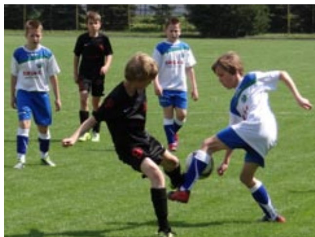
Młodzi Ekoballu sprawili dużą niespodziankę, wygrywając ze Stalą Mielec.