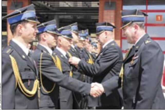
Uścisk dłoni komendanta też jest cenny...

W sanockiej komendzie PSP pełni służbę 71 strażaków, którzy w ubiegłym roku podjęli 733 interwencje, w bieżącym zaś – 292. W jej strukturach funkcjonuje Jednostka Ratowniczo-Gaśnicza oraz Powiatowe Stanowisko Kierownia, gdzie trafiają wszystkie zgłoszenia alarmowe. Przy KP PSP działa też Klub Honorowych Dawców Krwi „Strażacki Dar”, skupiający 113 członków, którzy w ubie-