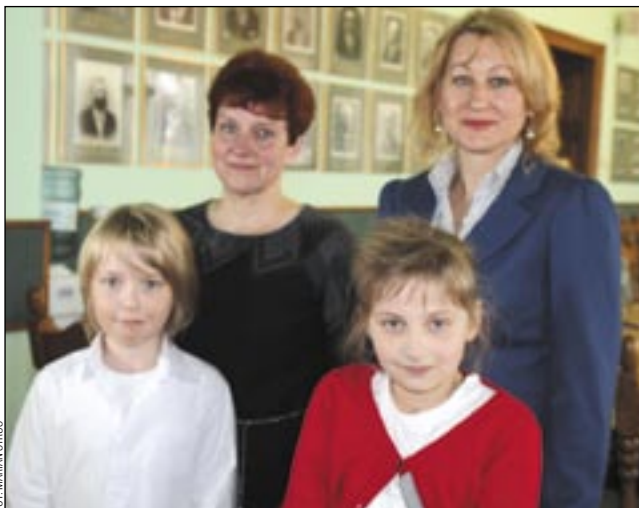
Radość na twarzach zwycięzców konkursu i ich opiekunek.