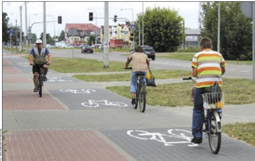
Po „koncepcji” źle się jeździ rowerem, ale daje ona nadzieję, że w niedługim czasie Sanok, wzorem innych miast, doczeka się ścieżek rowerowych.

Jeśli chodzi o przebieg, to ścieżka „Wójtostwo” ma liczyć 4.344 m. Będzie otaczała dzielnicę Wójtostwo, przebiegając w okolicach i wzdłuż odcinków ulic: Sta-