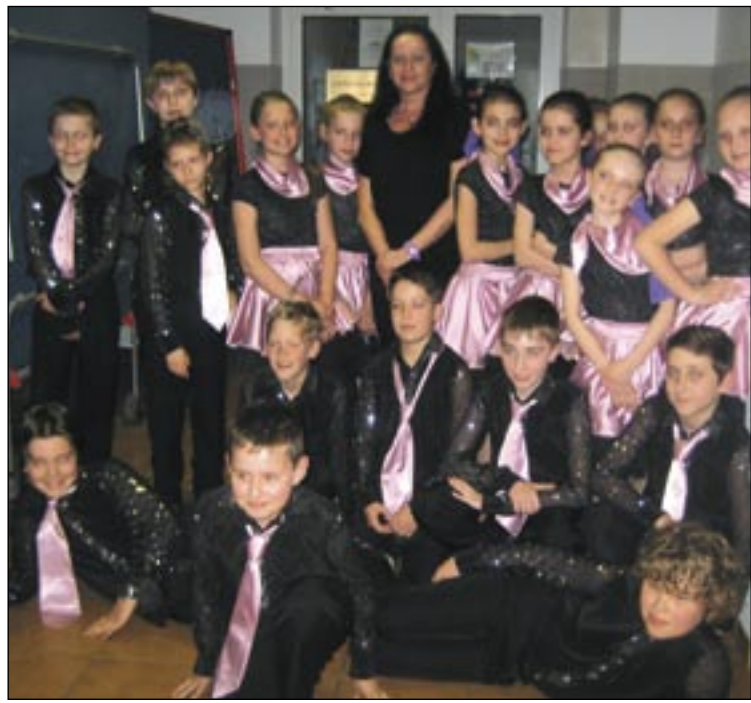
Tańczą równie pięknie jak wyglądają...

Ostatni weekend okazał się wyjątkowo pracowity dla najmłodszych tancerzy FTT „Flamenco” z Sanockiego Domu Kultury. Pracowity, ale i nader udany. W sobotę świetnie zaprezentowali się podczas XXVI Przeglądu Zespołów Tanecznych KACZUCHA 2014 w Krośnie, dzień później podbili serca widzów i jurorów na Wojewódzkim Przeglądzie Form Tanecznych „Pierwsze kroki” w Głogowie Małopolskim. Z obydwu konkursów przywieźli nagrody, zajmując miejsca na najniższym stopniu podium.