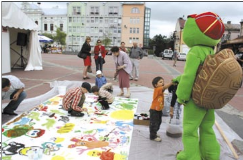
Tak zaczyna się wszczepianie dzieciom zamiłowania do książki. „Bieszczadzkie Lato z Książką” ma w tym swoje duże zasługi. Wkrótce ósma jego edycja!

W Sanoku „Bieszczadzkie Lato z Książką” gościć będzie w niedzielę, 15 czerwca. Spotkaniom z autorami towarzyszyć będzie całodniowy kiermasz książek popularnych polskich wydawnictw. W namiocie rozstawionym w Rynku swoje nowości prezentować będą: Media Rodzina, Wydawnictwo Literackie, Sonia Dra-