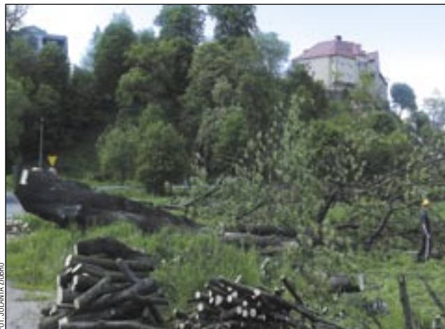
Pień drzewa był zdrowy, ale potężne odnogi miejscami już spróchniały. Drzewo żyłoby jeszcze wiele lat, stwarzałoby jednak zagrożenie.

nieniem są zmiany cywilizacyjne i urbanizacyjne. W wielu miejscach, gdzie niegdyś były pola, ugory, łąki, są dziś ruchliwe drogi i duże osiedla. Rozrośnięte, częściowo uschnięte drzewa stanowią zagrożenie dla ludzi, pojazdów i mienia. – Dawniej nie było żadnej metodyki nasadzeń. Lidzie robili to gdzie