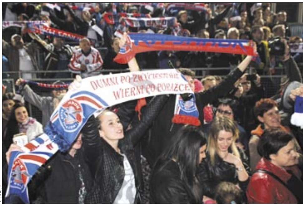
Radość kibiców po zdobyciu przez sanoczan tytułu mistrza Polski. Oby trwała ona jak najdłużej.

Być może strategiczni sponsorzy, czując ciężar obciążeń związanych z lożeniem na hokej, a nie widząc większego wspomagania ze strony innych podmiotów, zaczęli myśleć o wyhamowaniu. To da się zrozumieć, ale to nie jest dobry pomysł. Radziłbym się wstrzymać. Polski hokej, po awansie do bezpośredniego zaplecza światowej elity, powinien zacząć piąć się w górę. Jest więc nadzieja, że w niedługim czasie sponsorzy czołowych polskich drużyn zaczną odcinać kupony od swego zaangażowania w tę dyscyplinę. Pozostaje jeszcze satysfakcja, że dzięki temu zaangażowaniu Sanok staje się stolicą polskiego hokeja, że jest jedynym miastem na Podkarpaciu, które ma mistrza Polski w dyscyplinie zespołowej, że hokej jest wizytówką Sanoka, a dla wielu Polaków jego znakiem rozpoznawalnym. To też się liczy. Nie da się też ukryć, że dzięki