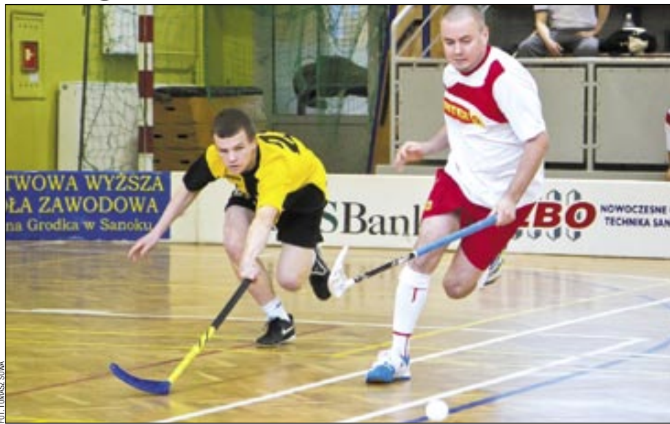
Unihokeiści InterQ pewnie pokonali drużynę Trans-Drew Posada i mogą ze spokojem oczekiwać meczu rewanżowego.