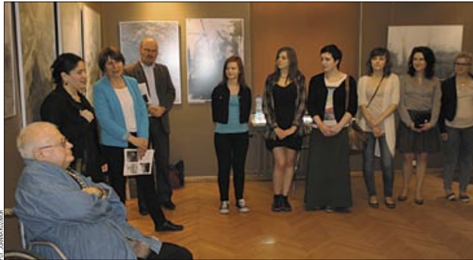
Umiejętność widzenia duszą dana jest ludziom o wyjątkowej wrażliwości.

– Czy dostrzegam w tych pracach moje wiersze? To są raczej zwielokrotnione i zmienione ich odbicia. I bardzo dobrze, bo o to chodziło, by poezja stała się inspiracją. Rzeczy ostateczne są zazwyczaj trudne do zrozumienia dla młodych ludzi, ale okazuje się, że dzięki swojej wyobraźni i zdolnościom mogą oni również i takich rzeczy dotykać. Dobrze się również stało, że przypomniano nagrania ze spotkania na zamku sprzed iluś lat, gdzie obecna pani