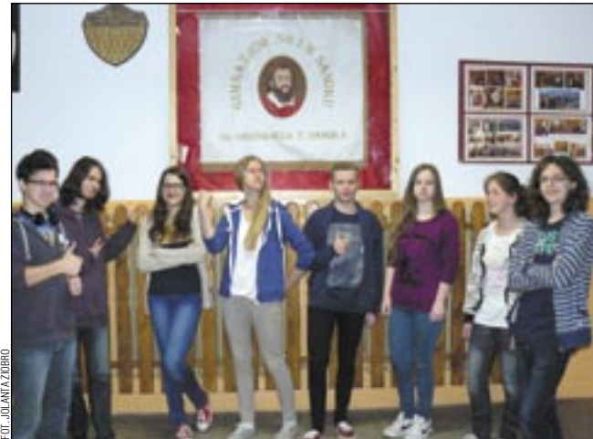
Młodzi, sympatyczni, a przy tym mądrzy i pracowici. Aż miło popatrzeć! Gratulacje dla rodziców i nauczycieli.