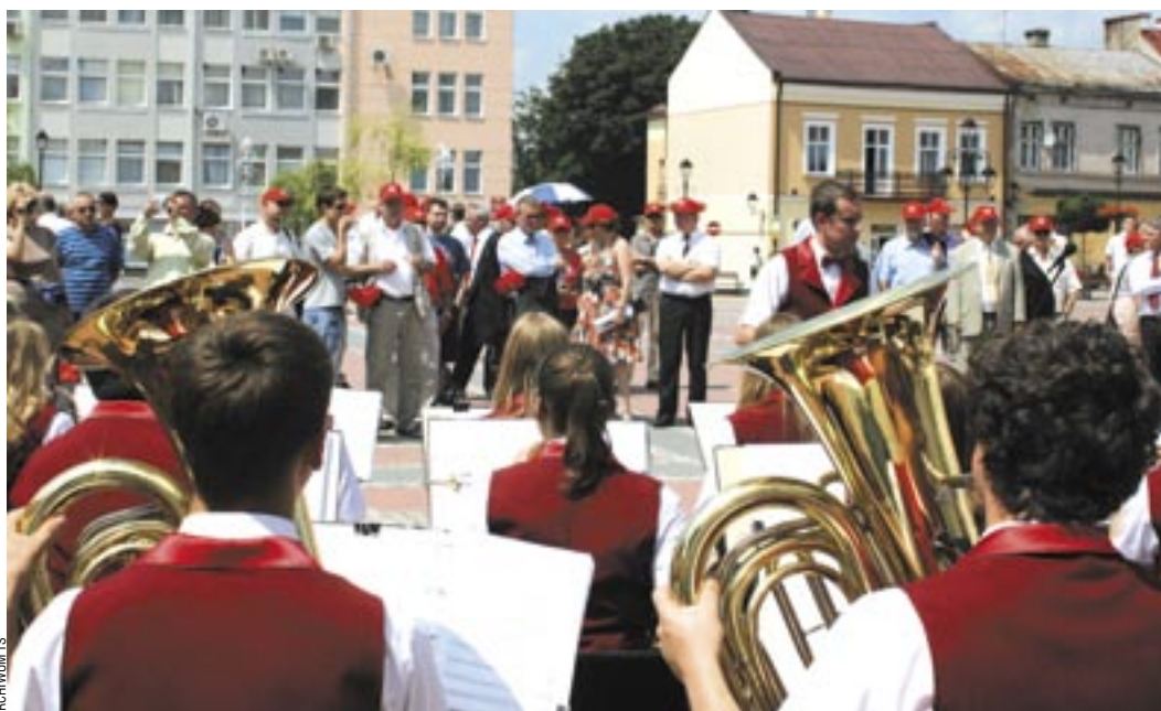
Radośnie, z uśmiechem i muzyką – tak ma przebiegać Światowy Zjazd Sanoczan. I będzie!

Chcąc przeżyć radośnie i szczęśliwie te niewątpliwie historyczne chwile, ludzie powinni ze sobą się bratać, miłować, integrować. Zjazd Sanoczan jest jedną z cenniejszych inicjatyw, aby to czynić. Wykorzystajmy ją!