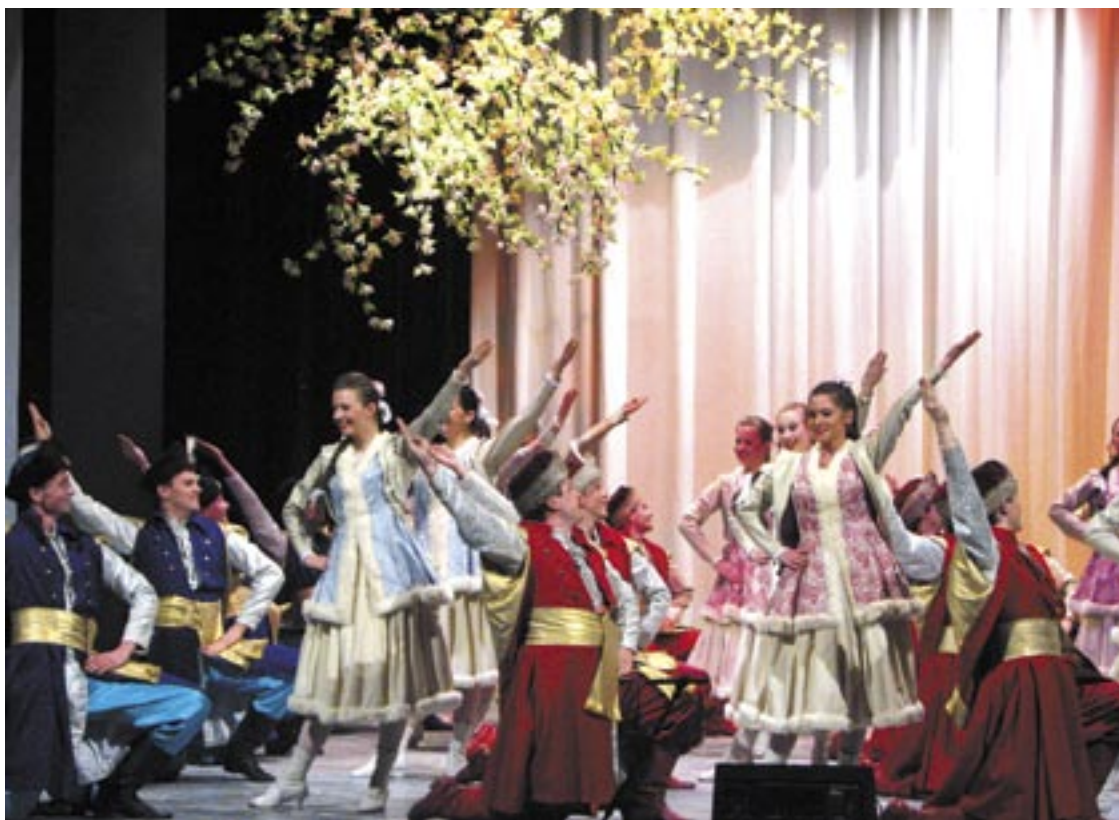
Zespół Tańca Ludowego SANOK jest jednym z głównych ambasadorów sanockiej kultury. Zapewne zechce to udowodnić podczas koncertu, jaki odbędzie się w skansenie z okazji Światowego Zjazdu Sanoczan.

Oczywiście, na rozlicznych stoiskach nie zabraknie pamiątek ze Zjazdu. Już jest gotowa przepiękna moneta zjazdowa, wybita przez sanockiego mincerza, będąc różnego rodzaju wydawnictwa