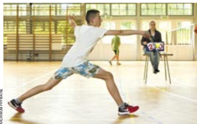
Najbardziej wytrwali wciąż walczą o jak najwyższe lokaty klasyfikacji łącznej.