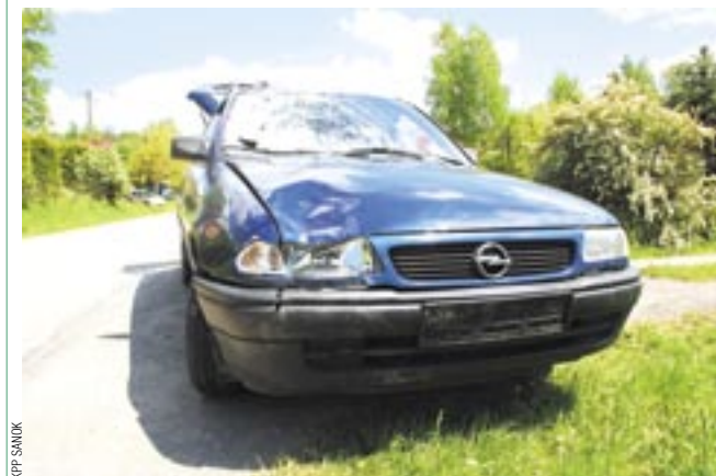
Sądząc po uszkodzeniach opla, impet uderzenia musiał być duży.

Policjanci ustalili świadków oraz zabezpieczyli materiał dowodowy, który posłuży do odtworzenia przebiegu tragicznego zdarzenia. /jot/