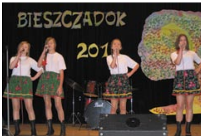
Dziewczęta z SP1 wyśpiewały „Złotego Bieszczadoka”.

– Poziom przeglądu był bardzo wyrównany, a jury z pewnością miało twarde orzech do zgryzienia, zwłaszcza w przypadku pierwszej nagrody. O zwycięstwie grupy dziewcząt z „Jedynki” zdecydował nieco wyższy poziom wokalny, choć „Werchowicy” z pewnością zaprezentowali coś świeżego i oryginalnego. Zrobili na nas bardzo duże wrażenie, z pewnością warto byłoby ich za-