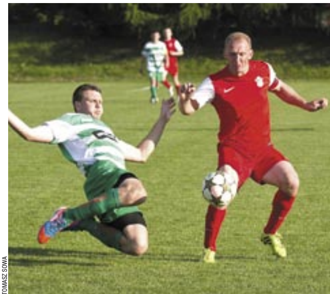
To była walka na całego, a zwycięsko wyszli z niej piłkarze Cosmosu (jasne stroje).

Niedawno Stal odpadła z Pucharu Polski po porażce z Cosmosem Nowotaniec, który w środę wywalczył to trofeum na szczelbłu okręgu krośnieńskiego. W meczu finałowym jego piłkarze wygrali u siebie 3-1 z LKS Pisarowce.