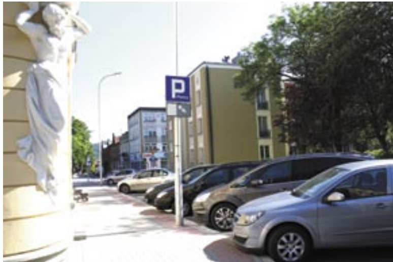
Na ul. Sobieskiego za postój trzeba płacić.

Wyciągnięcie końcowych wniosków pozostawiam Czytelnikom.