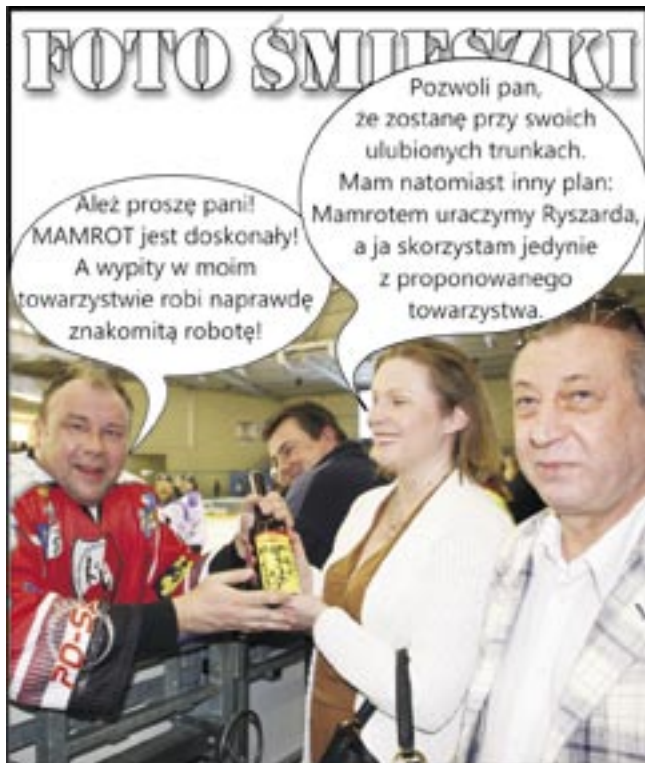
FOTO ŚMIECZKI Pozwoli pan, że zostanę przy swoich ulubionych trunkach. Mam natomiast inny plan: Mamrotem uruczmy Ryszarda, a ja skorzystam jedynie z proponowanego towarzystwa. Ależ proszę pani! MAMROT jest doskonały! A wypity w moim towarzystwie robi naprawdę znakomitą robotę!