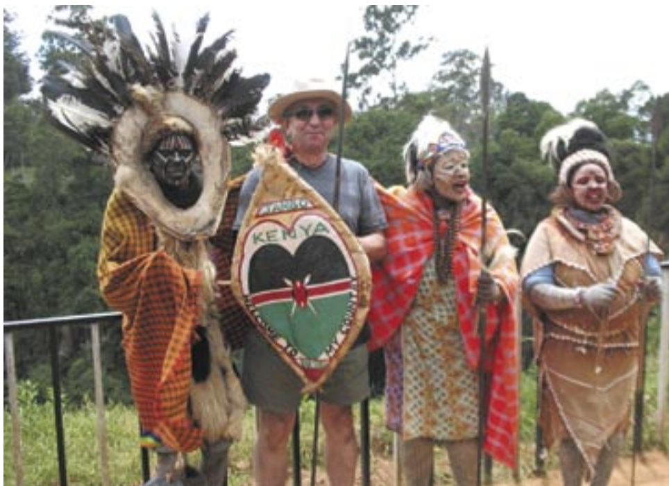
Uczestnictwo w tańcu plemiennym i wspólne zdjęcia z Masajami pozostaną niezwykle cenną pamiątką z pobytu na Czarnym Łądzie.

reny w poszukiwaniu afrykańskich zwierząt. Aby safari było udane, należy obowiązkowo „zaliczyć” tzw. „Wielką Piątkę”, w skład której wchodzi: słoń, nosorożec, lew, leopard i gepard. Już po trzech dniach możemy się pochwalić, że plan ten wykonaliśmy w stu procentach, namierzając wszystkie pięć z bliskiej odległości, dokumentując to pięknymi zdjęciami. Na szerszy opis zasługuje spotkanie z nosorożcami. Otóż w pewnym momencie zatrzymaliśmy naszego jeepa, obserwując dwa potężne nosorożce, które przepychały się nawzajem, posuwając się powoli w naszym kierunku. Po kilku minutach z wielkim impetem wpadły na drogę, wzniciając tumany kurzu, z których nic nie było widać. Nagle z niemałym przerażeniem stwierdziliśmy, że nosorożce są zaledwie dwa, trzy metry od nas. Proszę sobie wyobrazić dwa ogromne cielska, sapiące i pełne furii, każde o wadze ponad dwie tony, walczące ze sobą na śmierć i życie. To niesamowite i mroźące krew w żyłach widowisko sprawiło, że patrzyliśmy na nie jak zahipnotyzowani, czeka-