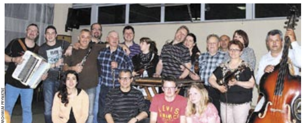
Delegacja nauczycieli z Saint Ide, propagująca polską kulturę ludową we Francji.

Trzymamy kciuki za powodzenie przedsięwzięcia! Bonne chance! g