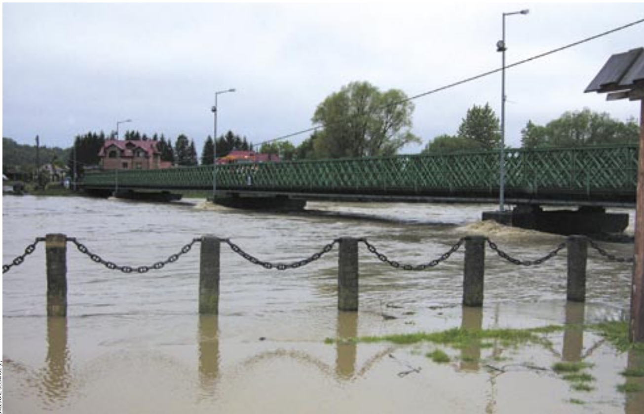
Tak wyglądał San i droga do skansenu w piątek rano.

Podtopiony został budynek szkoły w Dobrej, przez co dzieci nie poszły w piątek do szkoły, woda zalała piwnice Domu Ludowego w Płowcach, ucierpeli też mieszkańcy Mrzygłodu, gdzie największą szkodę poczynił płynący przez środek wsi potok, który w wyniku opadów zmienił się w rwącą rzekę. – Inna plynie przez rynek i dalej do Hłomczy. Nieczyszczona od dawna, wylała w górę, podtapiając budynki, szopy i podwórka czterech gospodarzy. Gdyby nie wał, jaki usypaliśmy dwa lata temu wzdłuż Sanu, i worki z piaskiem układane przez strażaków do 4. rano, byłoby znacznie gorzej. Wał obronił nas, mimo że od mostu