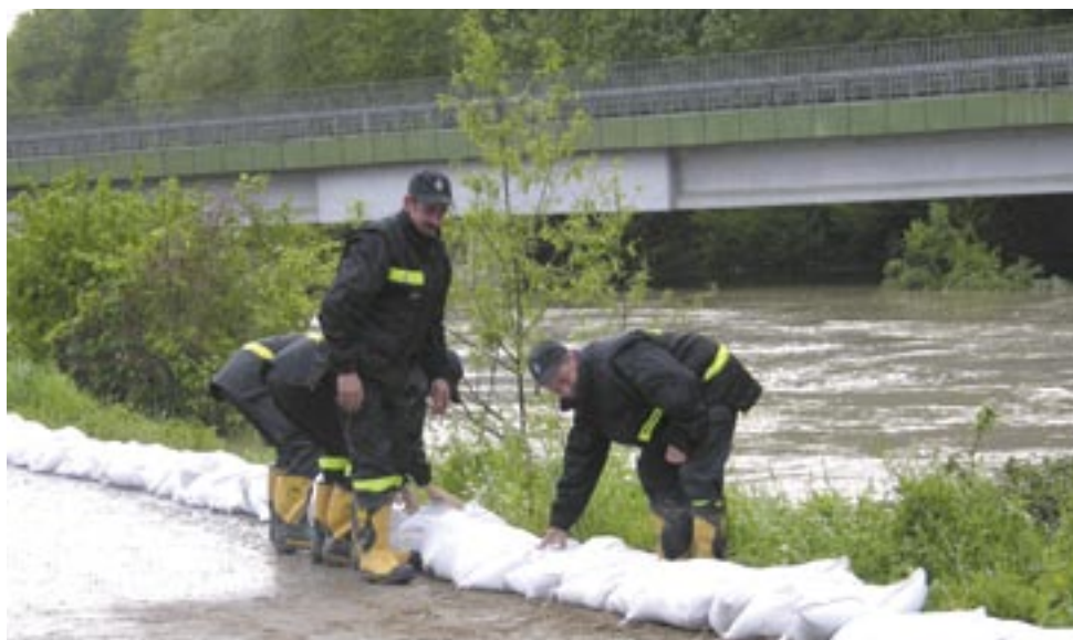
Strażacy nie mieli chwili wytchnienia – od wieczora do rana zabezpieczali nawałniczne miejsca workami z piaskiem, m.in. w Trepczy, gdzie Sanoczek zagrażał Stacji Uzdatniania Wody.

Ludzie spod znaku św. Floriana, którzy zaledwie przed tygodniem obchodzili swoje święto, po raz kolejny znakomicie zdali egzamin, potwierdzając, że w sytuacji zagrożenia zawsze można na nich liczyć. Bez ich zaangażowania i poświęcenia skala ludzkich dramatów i zniszczeń byłaby znacznie większa.