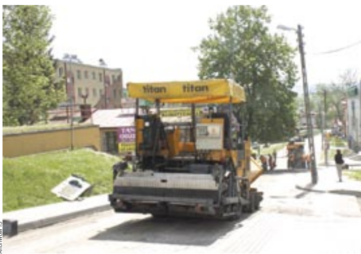
Ulica Feliksa Gieli w nowym jej wydaniu wygląda już nieźle, choć do brzo byloby dokończyć dzieła, aby móc powiedzieć: wszystko jest ok!