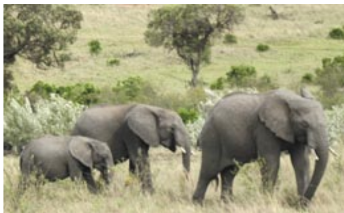
Taki widok na bezkresnych równinach Tanzanii i Kenii to codzienność. Zmieniają się tylko zwierzęta, których jest tam miliony.