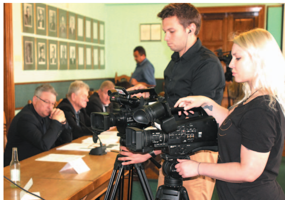
Konferencja prasowa poświęcona „Wierchom” i „Galerii Sanok” wzbudziła duże zainteresowanie mediów lokalnych i regionalnych. Towarzyszyły jej kamery portali internetowych: esanok oraz isanok. Na zdjęciu: obok siebie.