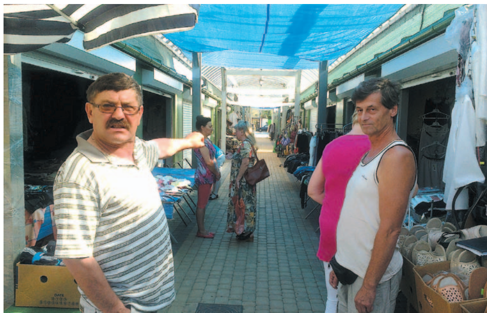
– Rynek przy Lipińskiego jeszcze żyje! – zapewniają kupcy, którzy wciąż mają nadzieję, że powróci tam handel i życie

Co właściwie władze miasta miałyby zrobić? Nie można przecież nikogo zmusić, aby handlował w tym czy innym miejscu. Oczywiście, kością niezgody jest konkurencyjny bazar przy ulicy Traugutta – kupcy nie mogą darować władzom, że budując własne targowisko, zezwolili na powstanie konkurencji na gruncie SPGK, a więc spółki miejskiej. Samorząd zaś twierdzi, że nie mógł zabronić utworzenia prywatnego targowiska. Rola miasta ogranicza się do ustalenia i pobierania opłat targowych.