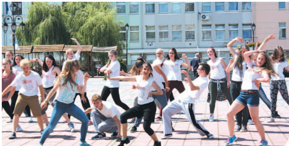
Taniec to radość i mnóstwo pozytywnej energii!

W piątkowe południe Rynkiem zawładnął hip-hop i jazz. Wszystko za sprawą uczestników warsztatów tanecznych w SDK, którzy chcieli zaprezentować szerszej publiczności efekty tygodniowych zajęć.