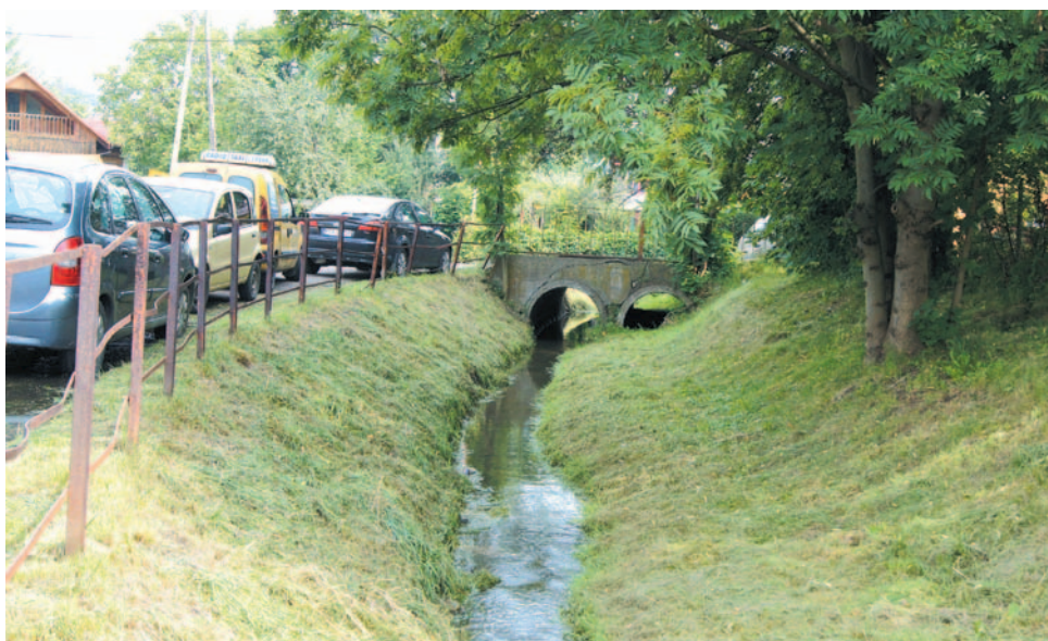
Potok Dworzysko – największa zhora mieszkańców ulicy Kollątaja. A mógłby to być – i powinien – miły i sympatyczny teren rekreacyjno-wypoczynkowy.

Z dalszej treści można było się też dowiedzieć, że skierowane zostało do Burmistrza m. Sanoka pismo o dokonanie kontroli posesji, w sąsiedztwie których zlokalizowane są nielegalne wyloty. Bo to wła-