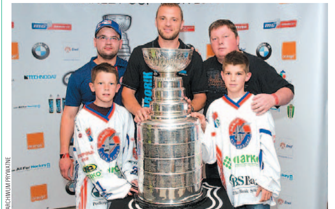
Zdjęcie z gwiazdą NHL (w środku) i prawdziwym Pucharem Stanleya to pamiątka na całe życie.