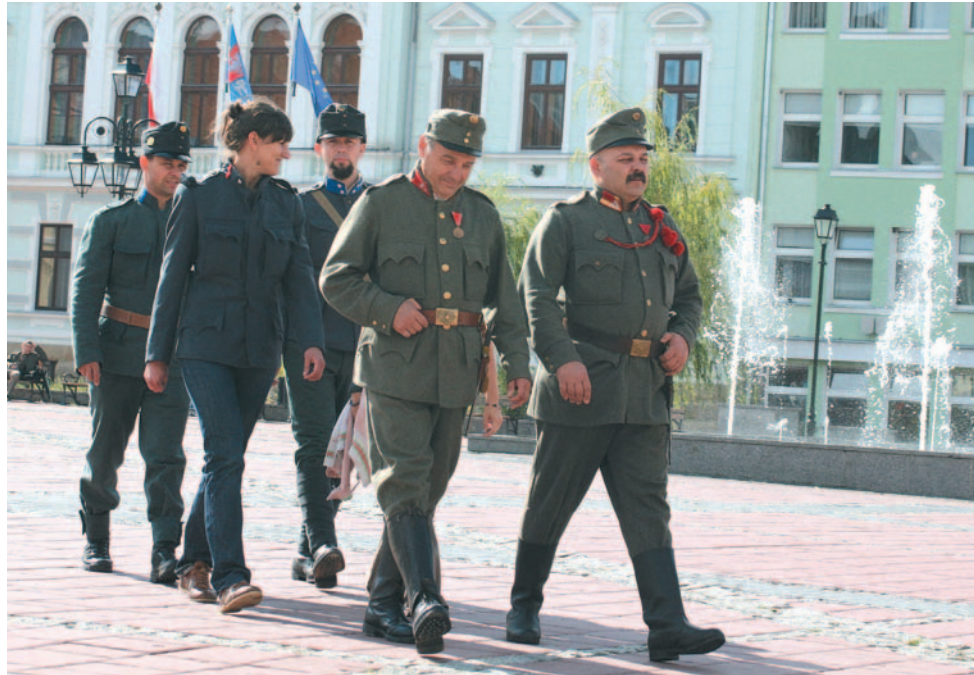
Do tradycji sprzed stu lat nawiązują miłośnicy Monarchii Austro-Węgierskiej, którzy co rok spotykają się w Sanoku. Na zdj. dumnie paradują po sanockim Rynku.