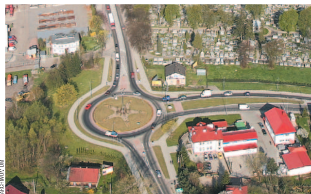
Rondo Beksieńskiego z przysłą obwodnicą połączy łącznik, którego budowa będzie już zadaniem Miasta.

Czy wszystko przebiega zgodnie z opracowanym harmonogramem? Czy decyzja środowiskowa, która miała ujrzeć światło dzienne w kwietniu br., a ukazała się w lipcu, nie spowodowała jakichś opóźnień? Zapytany o to rzecznik prasowy GDDKiA