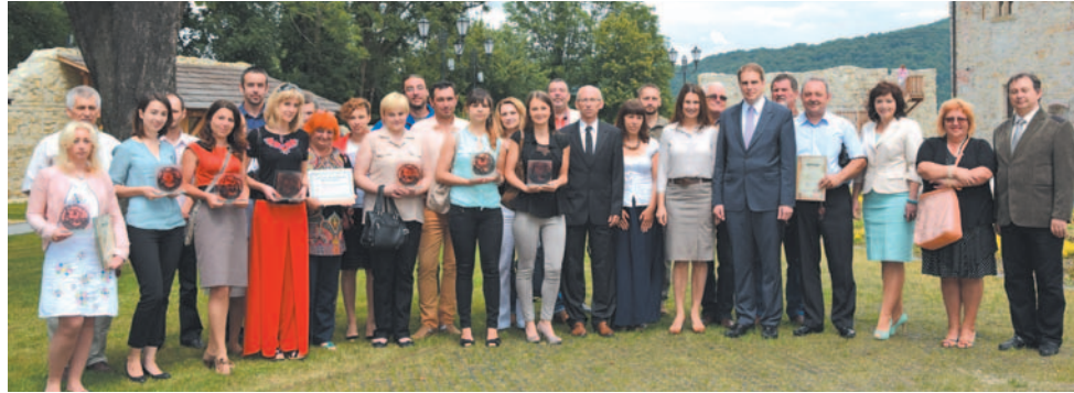
Pamiątkowe zdjęcie na dziedzińcu zamkowym uwieczniło laureatów 2. edycji.