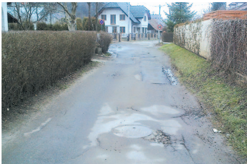
Takich ulic, jak ulica Kollątaja, jest w mieście bez liku. Ich coroczne latanie nic nie daje, a ludzie nie mogą doprosić się o solidny remont czy przebudowę. W tej sytuacji wyodrębnianie „budżetu obywatelskiego” budzi, mówiąc delikatnie, mieszane uczucia.