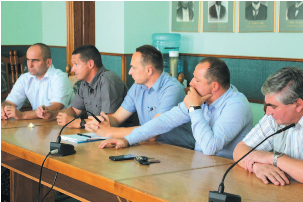
Na zdjęciu są razem: działacze Stowarzyszenia Ekoball i MKS Stal. W działaniu chyba się nie spotkają, gdyż to są dwa różne światy.