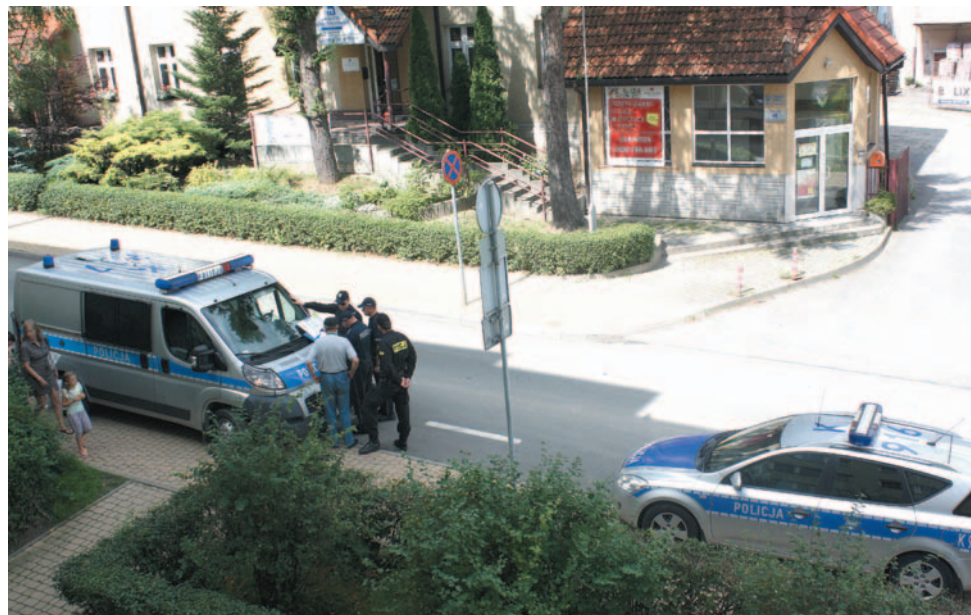
W rodzinnych sprawach trudno rozstrzygnąć, kto ma rację. Jedno jednak jest pewne: nie można tolerować agresji.

Żona, która ze strachu nie wpuszcza go tam od ośmiu lat – mimo prawomocnego wyroku – płaci dotkliwie kary za niepodporządkowanie się decyzji sądu. – To niebezpieczny, nieobliczalny i mściwy człowiek. On do końca życia nie da nam spokoju – płacze.