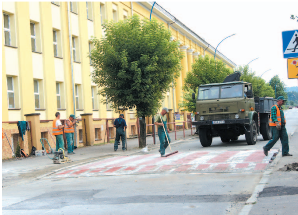
Wyspowe przejścia zmuszają kierowców do zdjęcia nogi z pedału gazu, dzięki czemu w okolicy „Mechanika” i boiska „Orlik” jest bezpieczniej.

Wybudowanie „Orlika” przy „Mechaniku” okazało się świetnym pomysłem – dzieci z osiedla masowo zaczęły korzystać z boiska. Równocześnie pojawił się problem bezpieczeństwa – kierowcy, szczególnie młodzi, jeżdżą ulicą Stróżowską bardzo szybko i brawurowo, a dzieciaki z bloków najczęściej przebiegają przez drogę „na skróty”, omijając przejście dla pieszych. Doszło na nim już do dwóch potrąceń. Na szczęście powiat szybko zareagował – przy „Mechaniku” pojawiły się dodatkowe barierki, a na początku tego tygodnia wybudowano dwa wyspowe przejścia dla pieszych.