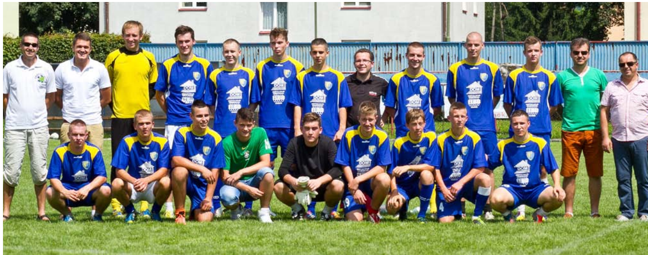
Pierwsze rodzinne zdjęcie drużyny GEO-EKO EKOBALL STAL SANOK zrobione po meczu sparingowym z Przelomem Besko. Jej skład na pierwszy ligowy mecz z Przełęczą Dukla niewiele się zmieni. To oni rozpoczną rozgrywki w klasie „O” z zadaniem awansu do IV ligi.

– Niektórzy zaczęli już trenować w różnych klubach, zastrzegając sobie jednak, że jeśli Ekoball Stal dostanie szansę na występy w klasie „O”, natychmiast wracają do Sanoka. I to zrobili. Jednym z nich był