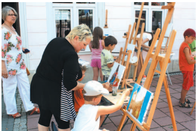
Najbardziej zaangażowanym artystom nie przeszkadza nawet upał...

Cieszy ją nie tylko spora liczba zwiedzających, ale i coraz bardziej oblegana Pracownia malarstwa. Galeria oferuje bowiem możliwość odkrycia i rozwijania własnego talentu, udostępniając sztalgę, podobrazia i farby oraz wsparcie instruktora. Zajęcia w Pracowni są bezpłatne, ich