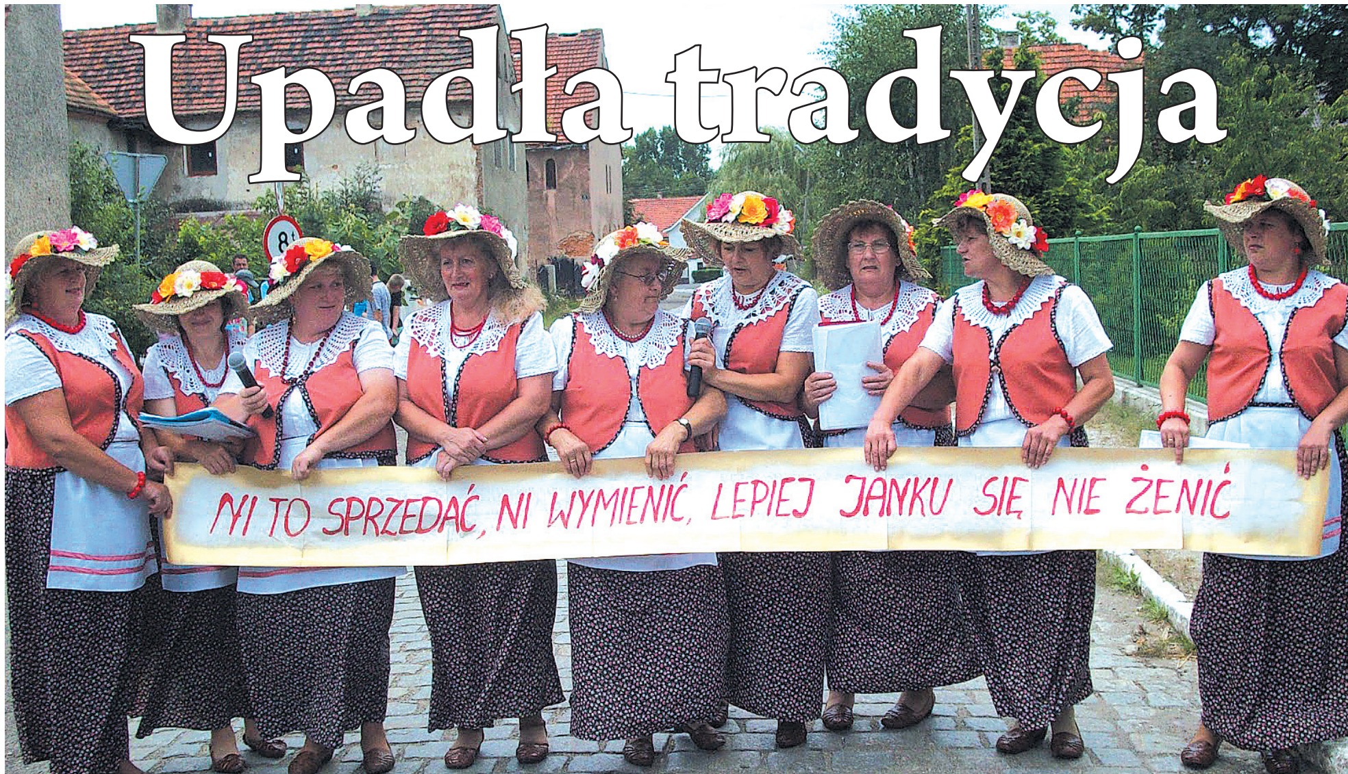
Zabawnie, z pomysłem i kulturą – w akcji zespół folklorystyczny „Perła” z Przybyłowic. W takim wydaniu weselna brama jest dodatkową atrakcją ślubnych uroczystości.