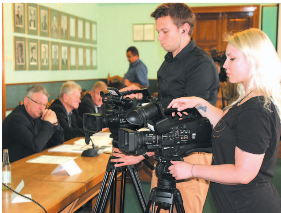
Miejscowi portalowcy byli zadowoleni. Wreszcie udało się im zrobić materiał, w którym biorą udział obie strony.