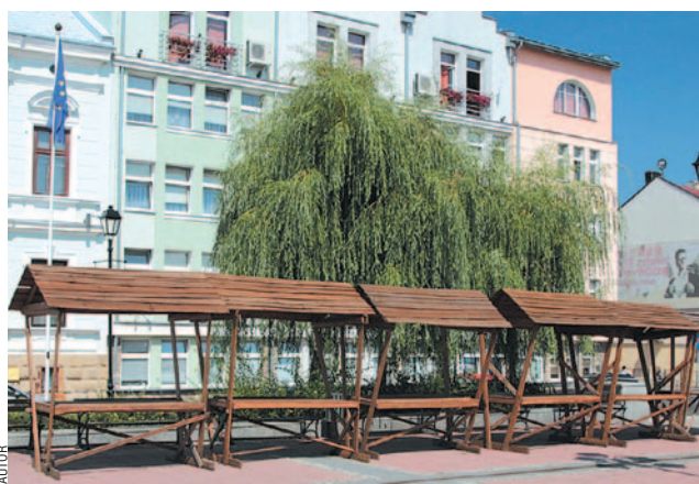
„Reprezentacyjny” skład rzeczy dziwnych pod Urzędem Miejskim.

w tym miejscu przez tak długi czas. Co napisano (jeśli w ogóle ktoś sobie zadał ten trud) do zarządzających przestrzenią miejską w sprawie o możliwość ustawienia „TEGO”? Czy miała to być wiata dla turystów chroniąca przed słońcem lub deszczem? Miejsce handlowe? Pietruszkę itp. sprzedaje się od zawsze nieopodal, na zielonym rynku a „sanockie” pamiątki – typu drewniany topór – w szopie niedawno! Więc komu i do czego u licha „TO” właściwie służy, bo na pewno nie budowaniu dobrego estetycznego obrazu miasta. A może jestem w błędzie? Może u nas można stawiać w centrum miasta cokolwiek i gdziekolwiek, za jedyne uzasadnienie mając zdanie: „Bo tak i już! I proszę mi nie zawracać... jakąś tam estetyką!” Jeśli jest tak – jak mi to niestety podpowiada życie – to bardzo proszę służby odpowiedzialne za realizację dobrze brzmiących haseł „Sanok miastem kultury” i „San OK” o pilną interwencję, bo być może z okien urzędu nie widać „TEGO” poprzez korony wierzby, ale nie jest