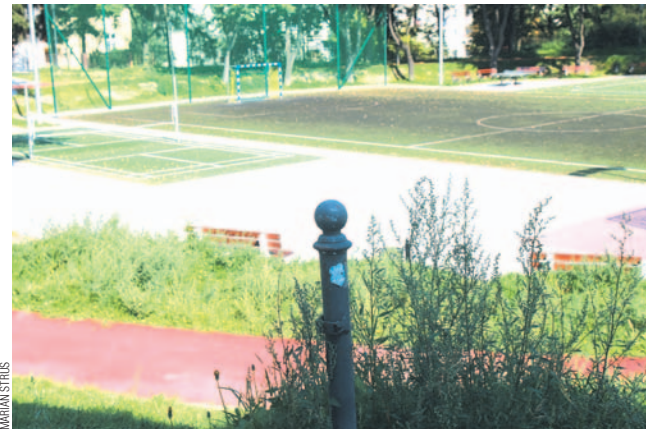
Miało być kolorowo, radośnie, po europejsku. Jest szaro-buro i smutno. Ciągle nam jeszcze daleko do tej Europy.

Skoro o ogródku jordanowskim mowa, warto jeszcze raz powrócić do życzeń sanoczan, aby ten piękny skądinąd obiekt stał się prawdziwą perelką w swojej