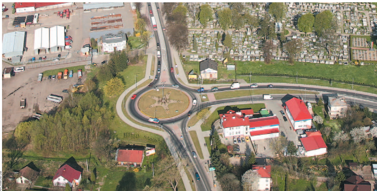
Obwodnica południowa w znacznym stopniu przyczyni się do poprawy organizacji ruchu w mieście, wyprowadzając tranzytowy na zewnątrz.

O ile jednak uwzględnienie tej sztandarowej inwestycji w projekcie kontraktu terytorialnego można uważać za potwierdzenie wcześniejszych ustaleń dotyczących budowy obwodnicy południowej Sanoka, o tyle dużą radość sprawiło znalezienie się na tej liście budowy Podkarpackiego Centrum Sportów Zimowych. Zadanie to znalazło się jako wiodące w dziedzinie „Walory naturalne, dziedzictwo kulturowe i sport”. Jego umocowaniem jest chęć eliminowania barier przyczyniających się do wykluczenia społecznego powiatów: sanockiego, bieszczadzkiego i leskiego właśnie poprzez rozwój