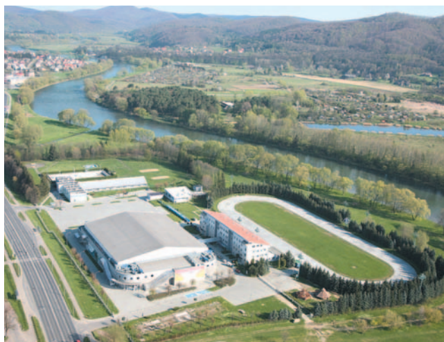
Może to będzie jedno z ostatnich zdjęć, na którym tor lodowy Błonie jest jeszcze bez dachu.