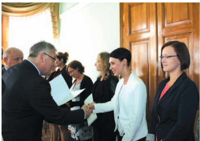
Gratuluję pani awansu zawodowego!

W przededniu nowego roku szkolnego przedstawiciele władz miasta spotkali się z dyrektorami sanockich szkół podstawowych i gimnazjów oraz miejskich pałoczek oświatowo-wychowawczych. Spotkanie było okazją do uroczystego wręczenia nauczycielom awansów zawodowych i jubileuszowych nagród. Drugą część wypełniła robocza narada dotycząca organizacji, zadań i wyzwań, jakie stoją przed sanocką oświatą w bieżącym roku.