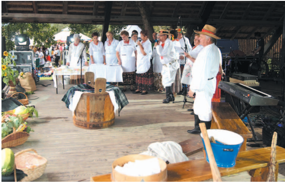
KGW z Nowosielec zachwyciło obrzędem kisenia kapusty.

„Bartnik” jak i Sanok zachwycili też gości z ukraińskiego Żydaczewa, którzy przyjechali z rewizytą w ramach wspólnie realizowanego z powiatem projektu promującego turystykę. Ale o tym – za tydzień.