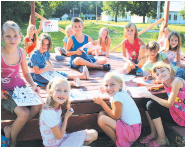
Dzieci z Ługańska i Doniecka przebywające poza domem rodzinnym oczekują na naszą pomoc.

Co potrzebują, żeby przetrwać jakże trudny dla nich okres rozłąki z rodzinnym domem, okres deszczów i chłódów? Przede wszystkim ciepłych kurtek, sweterków, bluz oraz cieplejszych butów dla chłopców i dziewczynek. Mogą to być trzewiki, bądź obuwie sportowe. W związku z rozpoczęciem roku szkolnym, uczniowie pilnie