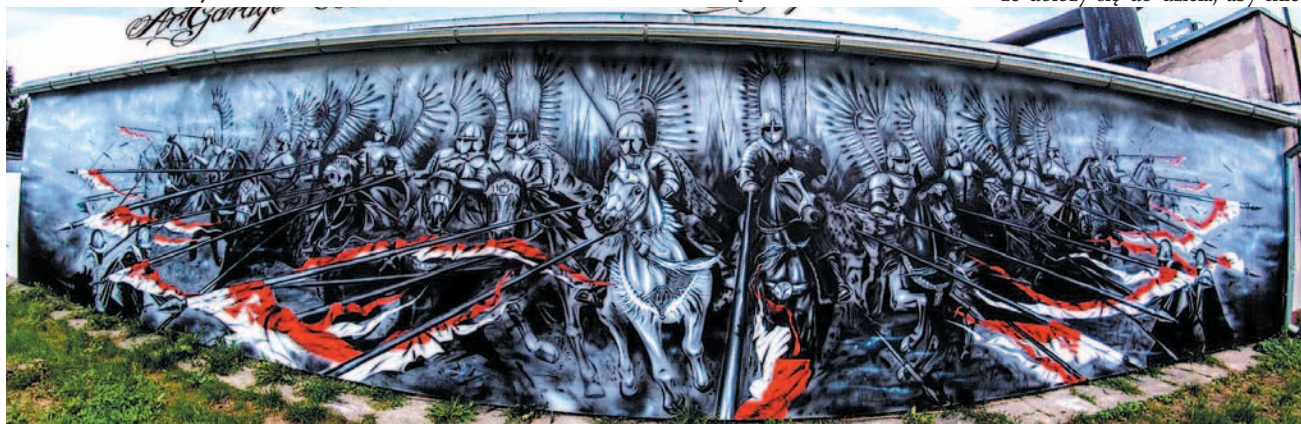
Niewzyciężeni polscy husarze na muralu przy ulicy Jana Pawła II.

ludnia i później od wieczora do północy. – Ludzie bardzo pozytywnie reagowali na naszą pracę i jej temat. Stawali, zagadywali, gratulowali. Raz nawet zatrzymała się pani „wypasionym” BMW, aby nam podziękować, a jakiś pan zaproponował, że dołoży się do dzieła, aby mieć