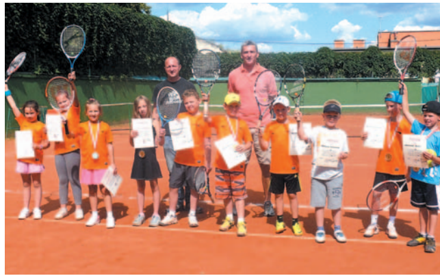
Dziewczęta i chłopcy z najmłodszej grupy wiekowej.

Na kortach SKT dużym zainteresowaniem cieszył się Turniej Tenisowy Dzieci i Młodzieży na Zakończenie Wakacji. Startowało blisko 40 dziewcząt i chłopców, także przyjezdnych, a rywalizacja toczyła się w sześciu kategoriach wiekowych.