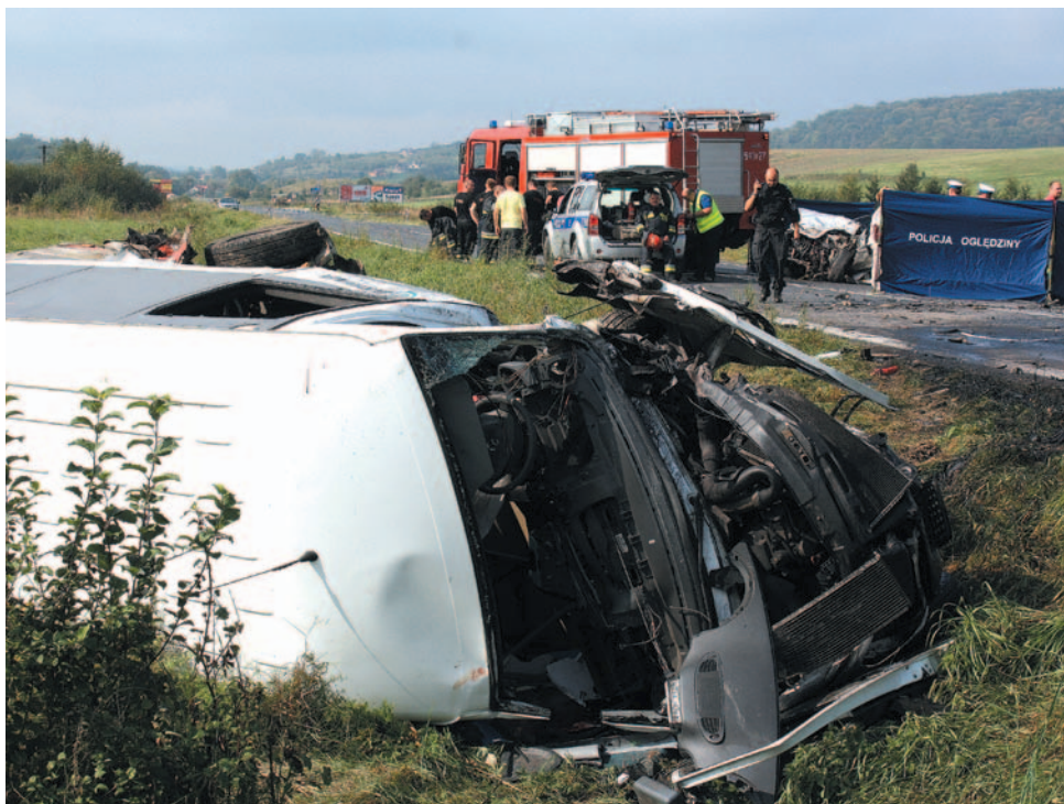
Patrząc na stan busa po wypadku, trudno się dziwić, że wszystkie jadące nim osoby odniosły obrażenia.

– Spałem, kiedy doszło do wypadku. Mama usłyszała ogromny huk i zobaczyła w rowie samochód. Obudziła mnie i brata. Pobiegliśmy na miejsce. Znam zasady udzielania I pomocy, brałem kilka razy udział w szkolnych zawodach. Orientowałem się, co trzeba robić. Było już kilka osób – sąsiedzi i kierowcy, którzy akurat nadjechali. Kilku rannych leżało koło busa, inni znajdowali się jeszcze w środku. Wszyscy