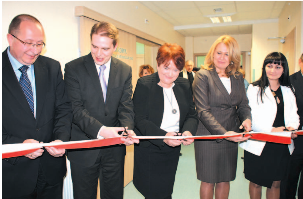
Lubimy otwarcia, przecinanie wstęg, to chyba normalne. I takich właśnie miłych chwil życzymy szpitalowi jak najczęściej. Jego organowi prowadzącemu i wszystkim mieszkańcom Sanoka i Ziemi Sanockiej również.

poprzez modernizację oddziału ginekologiczno-położniczego oraz oddziału neonatologicznego. Wartość zadania 4 mln 514 tys. zł.