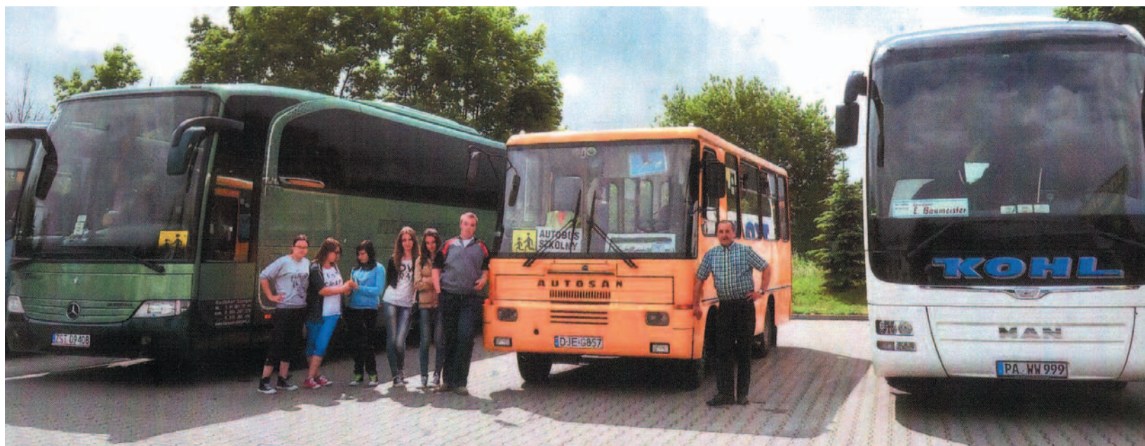
Starszek „Autosan” w towarzystwie motoryzacyjnych gigantów na jednym z parkingów w Niemczech. Ale to przy nim gromadzili się ludzie, z nim chcieli mieć zdjęcie.