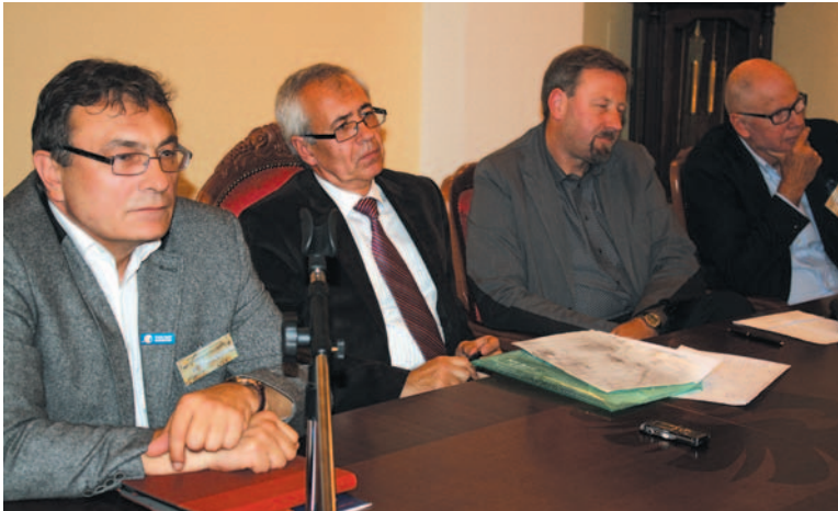
O mediach na pograniczach dyskutowano w gronie naukowców, medioznawców i dziennikarzy.

– Czy kultury pogranicza, przy globalizacji prowadzącej do ujednoczenia wzorów zachowań, mają szansę przetrwania? Tak. Badania socjologiczne