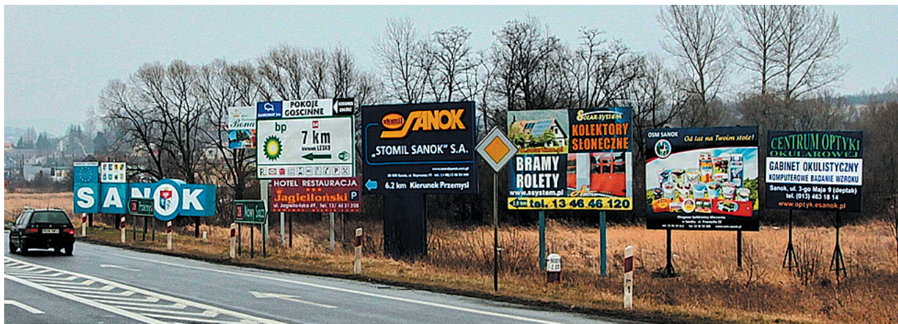
Wolność Tomku na swym zagonku, czyli brama Bieszczad!