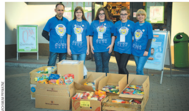
Dary zebrane przez wolontariuszy z I LO trafią do dzieci.

Pięć dużych kartonów trwałych produktów żywnościowych to owoc zbiórki przeprowadzonej w delikatesach „Centrum” przez młodzież z I Liceum Ogólnokształcącego oraz Fundację „Czas nadziei”.