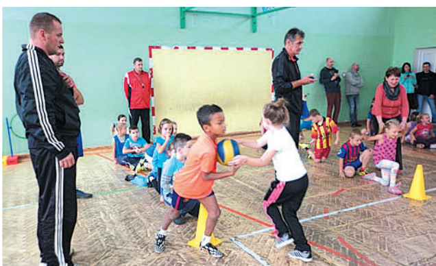
Organizatorzy zawodów wymyślili wiele ciekawych konkurencji.

Była to już czwarta edycja imprezy, mającej na celu integrację społeczności lokalnej oraz zachęcenie dzieci i rodziców do wspólnej zabawy i aktywnego spędzania czasu. Organizatorzy przygotowali szereg ciekawych konkurencji z wykorzystaniem różnych przyborów. W sportowych zmaganiach rywalizowały 10-osobowe reprezentacje klas, których składy tworzyło pięć dziewcząt i pięciu chłopców. Licznie przybyli rodzice nie tylko dopingowali swe pociechy, ale też mogli uczestniczyć w dwóch