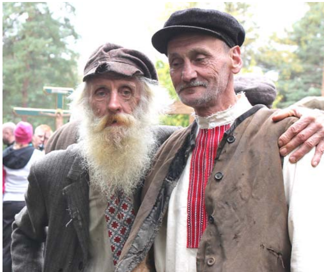
Świetni aktorzy, ale także znakomici statyści. Castingi, na których ich wybrano, przyniosły w Sanoku obfity plon.