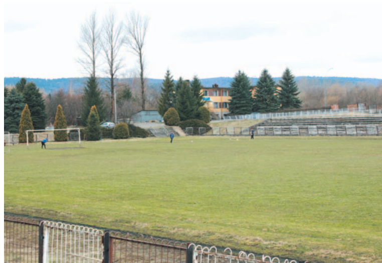
Czy licytacja „Stróżowskiej” ogłoszona przez komornika może oznaczać koniec przepychanek w tym temacie? Oby serial ten jak najszybciej zakończył się informacją, że Miasto przystępuje do budowy stadionu piłkarskiego na miarę XXI wieku.

Ruch w interesie coraz większy. 5-hektarowy areal przy ulicy Stróżowskiej najpierw był własnością Skarbu Państwa, potem dostał się w posiadanie klubu sportowego Stal, który go sprzedał prywatnemu inwestorowi. Ten z kolei zamierzał przeznaczyć go pod hipermarket, ale kiedy zorientował się, że ulica Stróżowska nie będzie miała zjazdu i wjazdu na planowaną obwodnicę Sanoka, zrezygnował z tych planów i zdecydował się sprzedać nieruchomość. Liczył, że plan ten zrealizuje, wkomponowując się w pomysł zamiany stadionu na stadion, z jakim wystąpiło Miasto. Uzgodnił nawet szczegóły transakcji z inwestorem zainteresowanym „Wierchami”, które Rada Miasta zdecydowała się zamienić za „Stróżowską”. Widać jednak jakieś fatum wisiało nad „Stróżowską”, gdyż w pewnym momencie inwestorów zrezygnował z inwestowania w Sanok. Ocenili, że klimat społeczny, jaki wytworzono wokół tego przedsięwzięcia, jest niesprzyjający i nie zachęca do jego realizacji. Nieruchomość przy Stróżowskiej nadal więc pozostawała w rękach warszawskich właścicieli, coraz mocniej naciskanych przez wierzycieli, wskutek zadłużenia hipotecznego, zaciągniętego jeszcze przez MKS Stal. Przyszedł moment, że postanowili nie czekać dłużej na swoje pieniądze. W efekcie sprawą zajął się komornik, który wystawił nieruchomość na licytację.