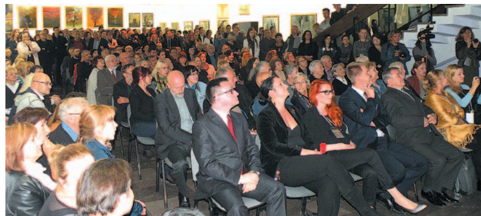
Choć na wernisażu i wykład Wiesława Banacha przybyły tłumy, nikt ze środowiska artystycznego nie podjął merytorycznej dyskusji o Beksińskim.

O bezdyskusyjnej wartości dzieł przekonana jest także szefo-