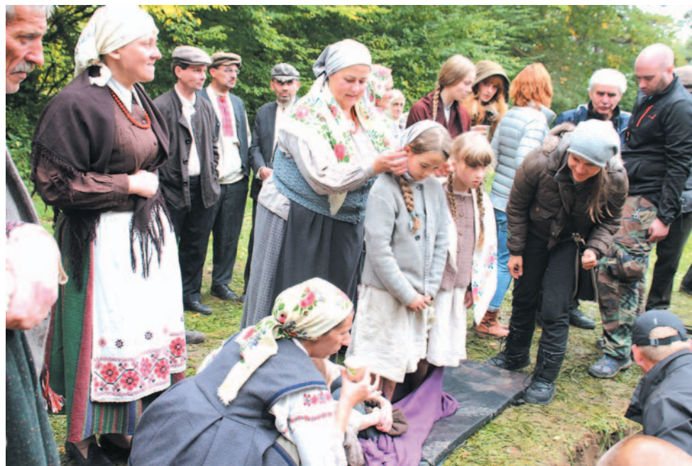
Wśród statystów były także dzieci, nad którymi ich filmowi rodzice, a także cała ekipa, sprawowała troskliwą opiekę.

– Przede mną duże wyzwanie jak pokazać, żeby nie pokazać, bo to są okropne rzeczy, które się tam wydarzyły. (...) Nie jestem w stanie wyobrazić sobie tak wielkiego