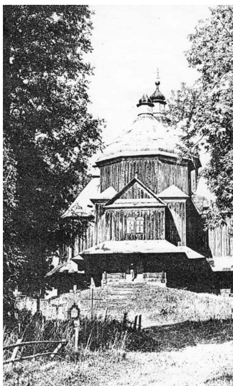
Nie istniejąca już cerkiew greckokatolicka w Lutowiskach.

Opisując prace projektowe związane z zagospodarowaniem