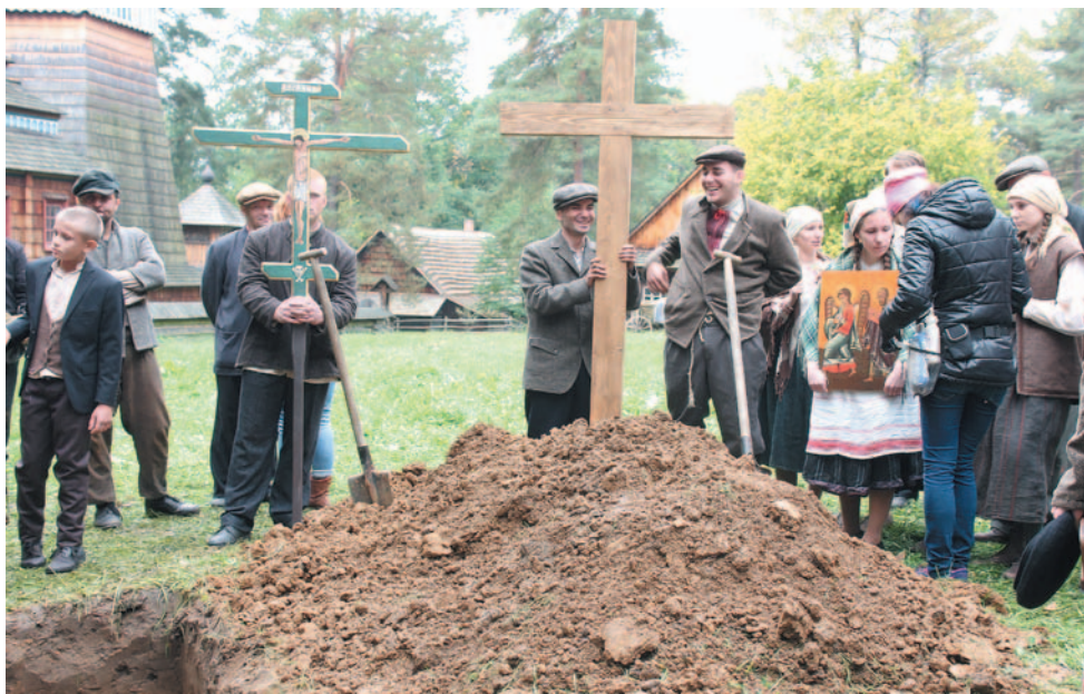
Rok 1943, Wołyń. Scena zakopywania Polski do grobu. Dla jej uczestników – banderowców i ukraińskich chłopów – jest to radosny, historyczny dzień.