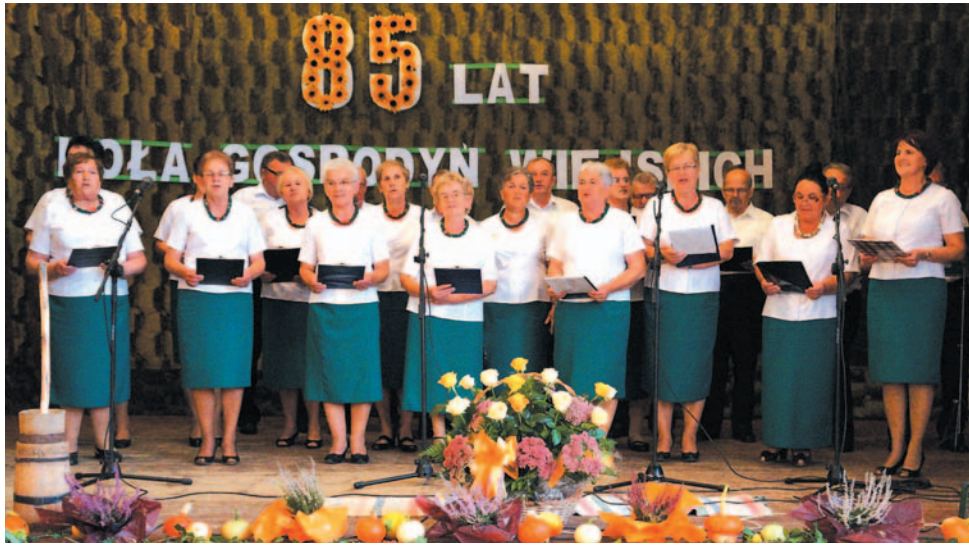
Pięką, gotując, tańcząc i śpiewając, zarażając aktywnością społeczną całe środowisko. O ile uboższe byłyby Nowosielce, gdyby zabrakło w nich Koła Gospodyń Wiejskich. Dwieście lat drogie Jubilatki!