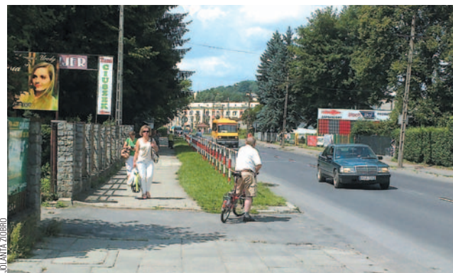
Niestety, nie będzie ścieżki rowerowej wzdłuż ulicy Lipińskiego – chodnik jest zbyt wąski.

Co z rozbudową cmentarza przy ulicy Lipińskiego? – pytają mieszkańcy Posady. W lipcu burmistrzowie obiecywali, że do końca września projekt rozbudowy cmentarza powinien być gotowy, co oznacza, że jeszcze w tym roku możliwe byłoby uzyskanie pozwolenia na budowę i zapewnienie pieniędzy w budżecie na 2015 rok.