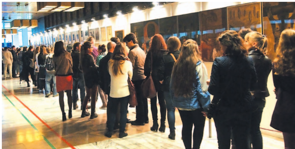
Ludzie cierpliwie stali w ogromnych kolejkach, aby wejść do galerii i obejrzyć prezentowane prace.