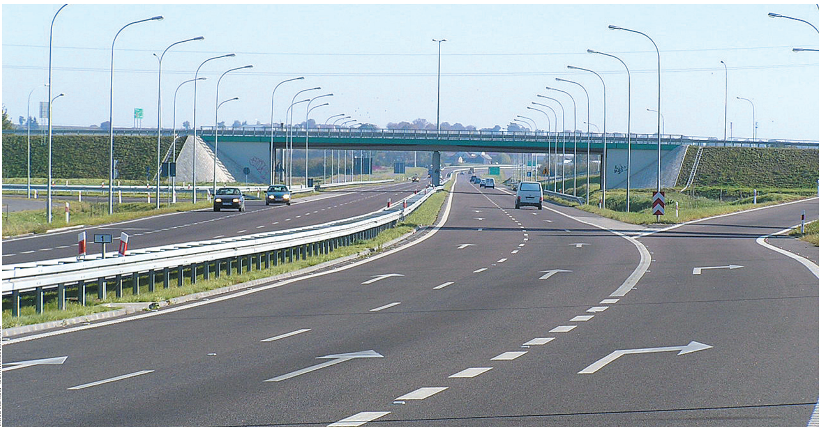
Obwodnica południowa, którą w połowie 2018 roku już będziemy jeździć, nie tylko otworzy Sanok przed inwestorami i odkryje nowe tereny inwestycyjne, ale także odciąży komunikacyjny centrum miasta.