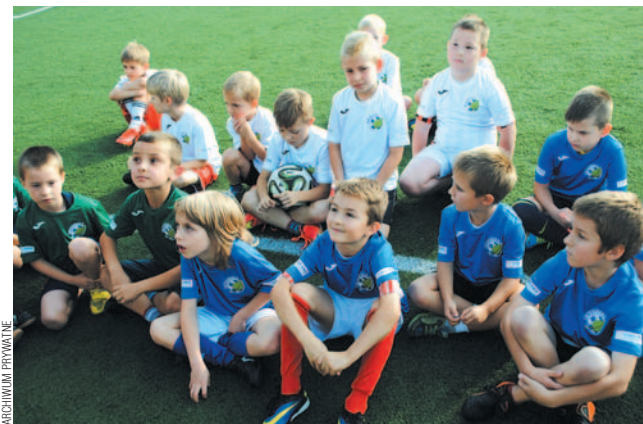
Ekobalowe przedszkolaki pięknie prezentowały się w nowych strojach.

Na „Orliku” przy Szkole Podstawowej nr 1 chłopcy z ekobalowskiej Akademii Pił- karskiej Przedszkolaka pode- mowali rówieśnikami z Brzozo- wa. Wyniki były sprawą drugo- rzędną, ale odnotujemy, że pierwsza drużyna, która trenuje od roku, pewnie wygrała, zaś druga, utworzona zaledwie mie- siąc temu, w debiutanckim spot- kaniu doznała porażki. Nasi chłopcy zagrali bardzo ambic- nie, wspaniale prezentując się w pięknych, nowych strojach.