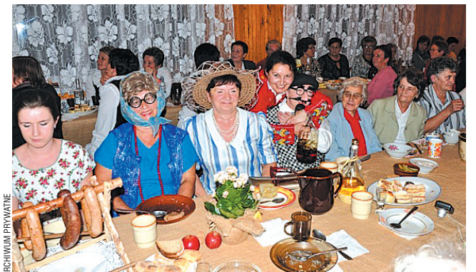
Rzut oka na zdjęcie i wniosek prosty – zabawa była na sto dwa!

Rekordową frekwencję miała XIII edycja imprezy „Z Kufra Babuni”, którą tym razem zorganizowano w Pisarowcach. Tamejszy Wiejski Dom Kultury wręcz pękał w szwach – zjechały 23 Koła Gospodyń Wiejskich z terenu gminy Sanok.