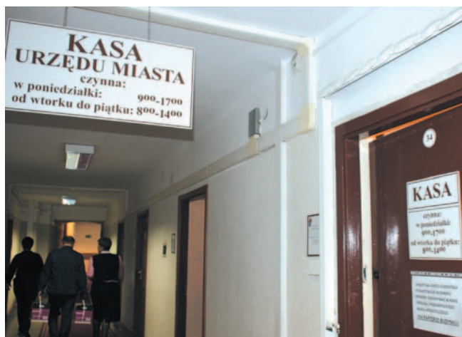
Maryla Rodowicz śpiewała kiedyś: „Bo to co nas podnieca, to się nazywa kasa...”

W marcu tego roku „Super Nowości” pokusiły się o zbilansowanie czasu pracy radnych