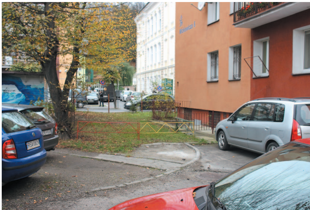
Mieszkańcy bloku przy Mickiewicza 6 chcą mieć ten skrawek przyległego terenu wyłącznie dla siebie. Czy naprawdę tak dużo chcą?

Mieszkańcy Mickiewicza 6 okopali się w swoich okopach. Nie chcemy żadnych nowych współlokatorów, nie damy sobie odebrać podwórka, nie pozwolimy, aby ktokolwiek poza nami parkował na naszym parkingu. Oazę zieleni i parking chcemy dla siebie. A Spółdzielnia, której jesteśmy członkami, ma być dla nas. Jak tabakiera dla nosa. Koniec kropka. Zarząd Spółdzielni zupełnie nie poczuwa się do winy. Twierdzi, że chce służyć mieszkańcom, ale na zasadzie współpracy, nie dyktatu. Uważa, że w tej kwestii robi nawet więcej niż powinien. – Bo jeśli opracowujemy dwie koncepcje zagospodarowania skweru i żadna nie zostaje wybrana, a na naszą propozycję: opracujcie swoją! słyszymy: to jest wasz obowiązek, nie nasz! – to co można jeszcze wymyślić? – zastanawia się prezes. No tak, jednak nos dla tabakierzy!