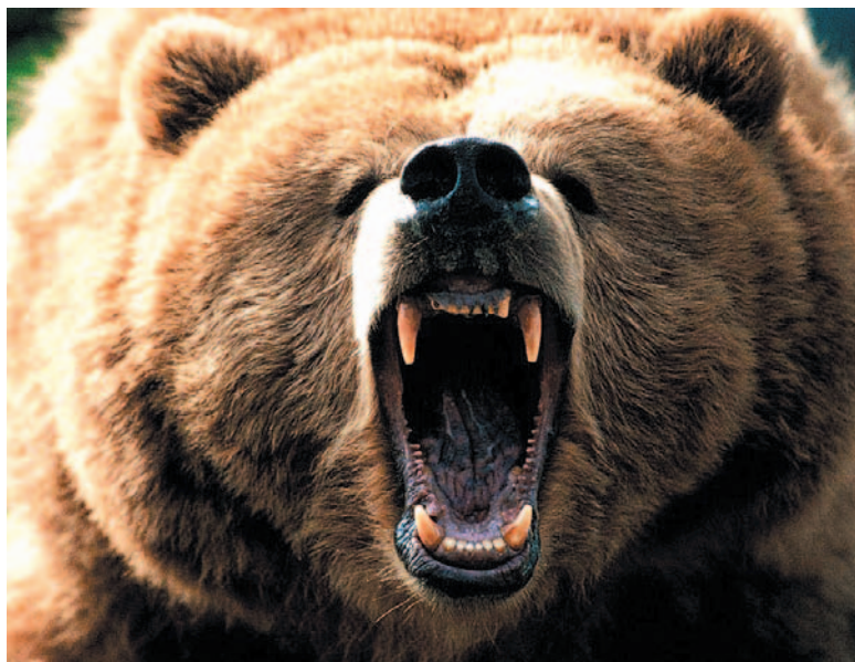
Niedźwiedzie to największe polskie drapieżniki. Czasami atakują ludzi, ale bardzo rzadko ze skutkiem śmiertelnym. W takim przypadku zwierzę należy odstrzelić.