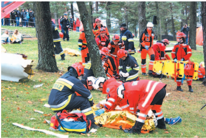
Po katastrofie samolotu ratownicy musieli uwijać się jak w ukropie.

– Na wyższy poziom przenosimy możliwości wzajemnej pomocy, w sytuacji gdy lokalne