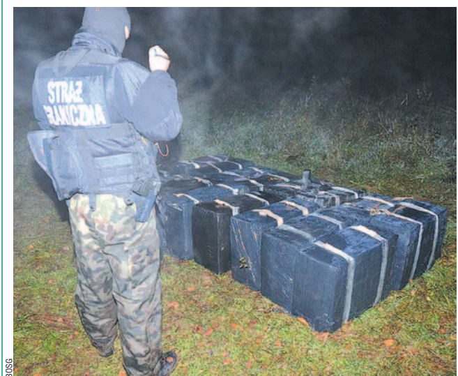
Każdy z 17 kartonów, w które przemytnicy zapakowali kontrabandę, ważył około 15 kilogramów. Przeniesienie ich przez granicę zajęło trzem mężczyznom zaledwie kilka minut.

Zatrzymanym postawiono zarzuty popełnienia przestępstw karno-skarbowych. Trzech z nich było również sprawcami przekroczenia granicy wbrew przepisom prawa, natomiast jeden z zatrzymanych odpowie za wręczenie korzyści majątkowej oraz zorganizowanie całego procederu. Sprawa jest rozwojowa, nie są wykluczone kolejne zatrzymania.