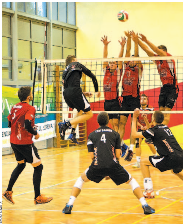
W spotkaniu z Contimaxem Bochnia siatkarze TSV CellFast (na pierwszym planie) odnieśli czwarte zwycięstwo w obecnym sezonie II ligi. Oby zwycięska passa trwała jak najdłużej.