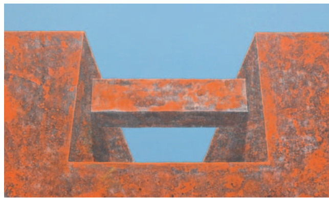
Tomek Mistak, Bez tytułu, 50x100 cm, akryl na płótnie, 2014.

A u k c j i, w której udział wezmą przedstawiciele biznesu, konesery i kolekcjonerzy sztuki nie tylko z Pol-