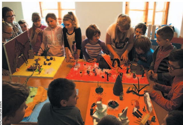
Najpierw było lepienie z plasteliny i nauka animacji, a potem filmowy seans.

W sanockiej odsłonie imprezy uczestniczyli uczniowie SP1 i SP2, którzy wzięli udział w zajęciach warsztatowych z filmu animowanego zorganizowanych w MDK (podziękowania za udostępnienie sali i znakomite przygotowanie zajęć!), obejrzeni też najnowsze polskie animacje w BWA. Ich starsi koledzy z G2 obejrzeni natomiast irański film fabularny pt. „Robot”, opowiadający o chłopcu uzależnionym od gier komputerowych. – Im więcej tego typu zajęć, tym lepiej, gdyż z jednej strony świetnie roz-