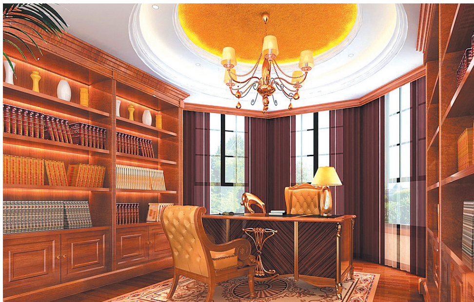
Złote fotele, klamki, żyrandole... - pomarzyć dobra rzecz. Gabinetowa rzeczywistość lokalnych włodarzy jest znacznie bardziej zgrzebna.