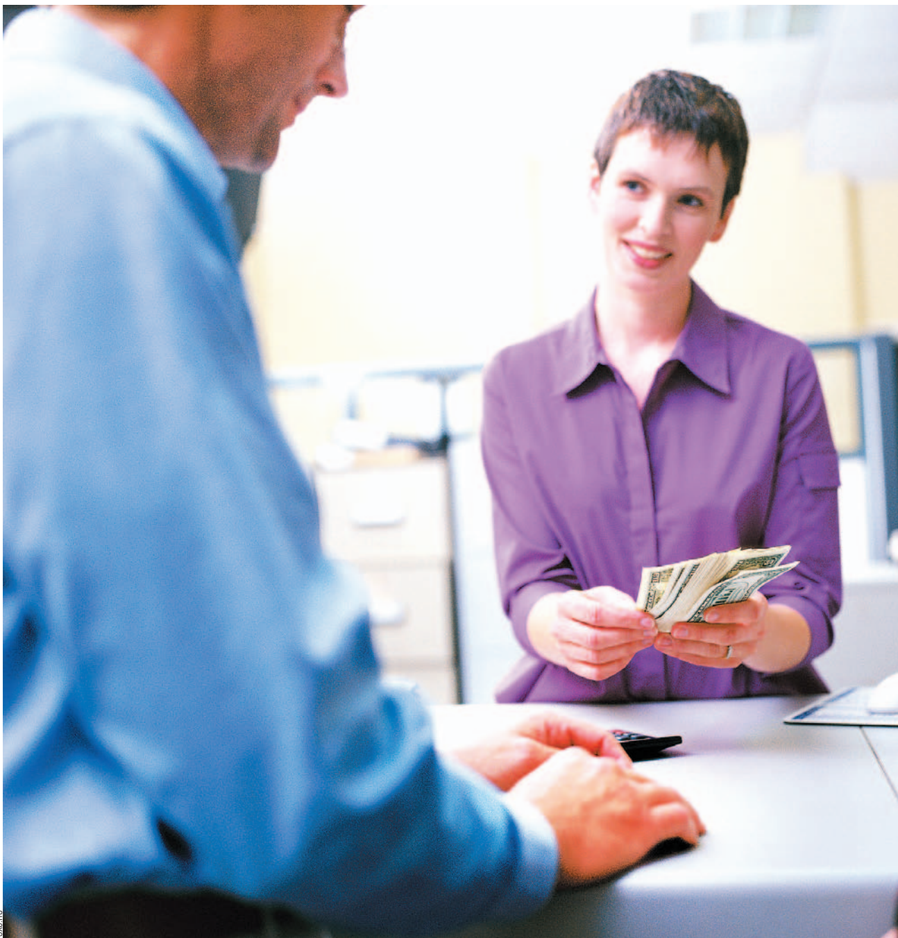
Nikt chyba nie zaprzeczy, że jednym z magnesów przyciągających ludzi do samorządu są pieniądze.

Pieniądze, które otrzymują rajcy, to nie wynagrodzenia, tylko dieta, zwykle płacona ryczałtem, choć są też i gminy, gdzie płaci się za każde posiedzenie sesji i komisji. Radni sami ustalają jej wysokość, ale w oparciu o ustawę o samorządzie i rozporządzenie Rady Ministrów.