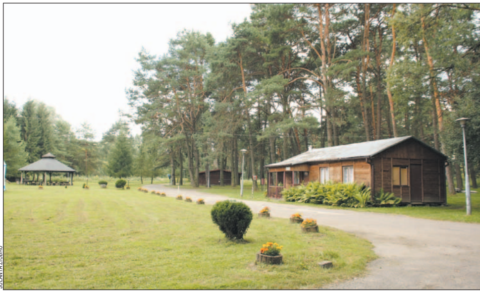
Sosenki są piękne i mają swój klimat. Jeśli zostaną uporządkowane, z pewnością znów staną się ulubionym miejscem spacerów sanoczanie.

Wystartowali z kopyta. Niemal z tygodnia na tydzień „Sosenki” zmieniały swój wygląd. Uporządkowano drzewostan, wykarczowano 4-hektarowy areal, dzięki czemu zniknęły chaszczki. Udrożniono kanalizację sanitarną, wymieniono instalację elektryczną. Przystąpiono do przygotowania miejsca dla kamperów i pod plech namiotowe, remontując zewnętrzne prysznice i ubikacje. Wyremontowano obiekt gastronomiczny. Zrobiono to w pocie czoła w ciągu zaledwie kilku miesięcy. Nie trzeba niko-