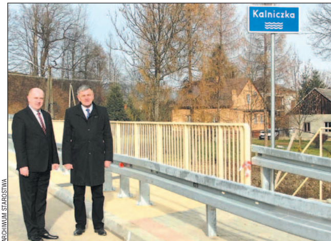
Pamiątkowe zdjęcie na moście i można jechać.

Od czwartku, 13 bm., można już jeździć nowym mostem w Tarnawie Górnej. Powiat Sanocki zakończył właśnie trwającą pół roku inwestycję, wartą blisko 2,5 mln zł.