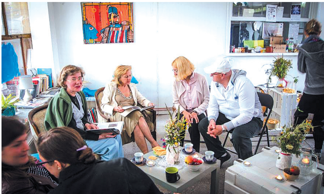
Autorskie pomysły, ciekawe aranżacje, niebanalne realizacje – działo się! Szkoda, że już w czasie przeszłym...