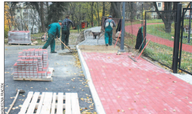
Nierówne, błotniste przejście obok ogródka jordanowskiego zamienia się w brukowany trakt spacerowy.

Miasto Sanok wykonało kolejne w tym roku remonty i przebudowy dróg i chodników. Pracom tym sprzyjała ładna pogoda.