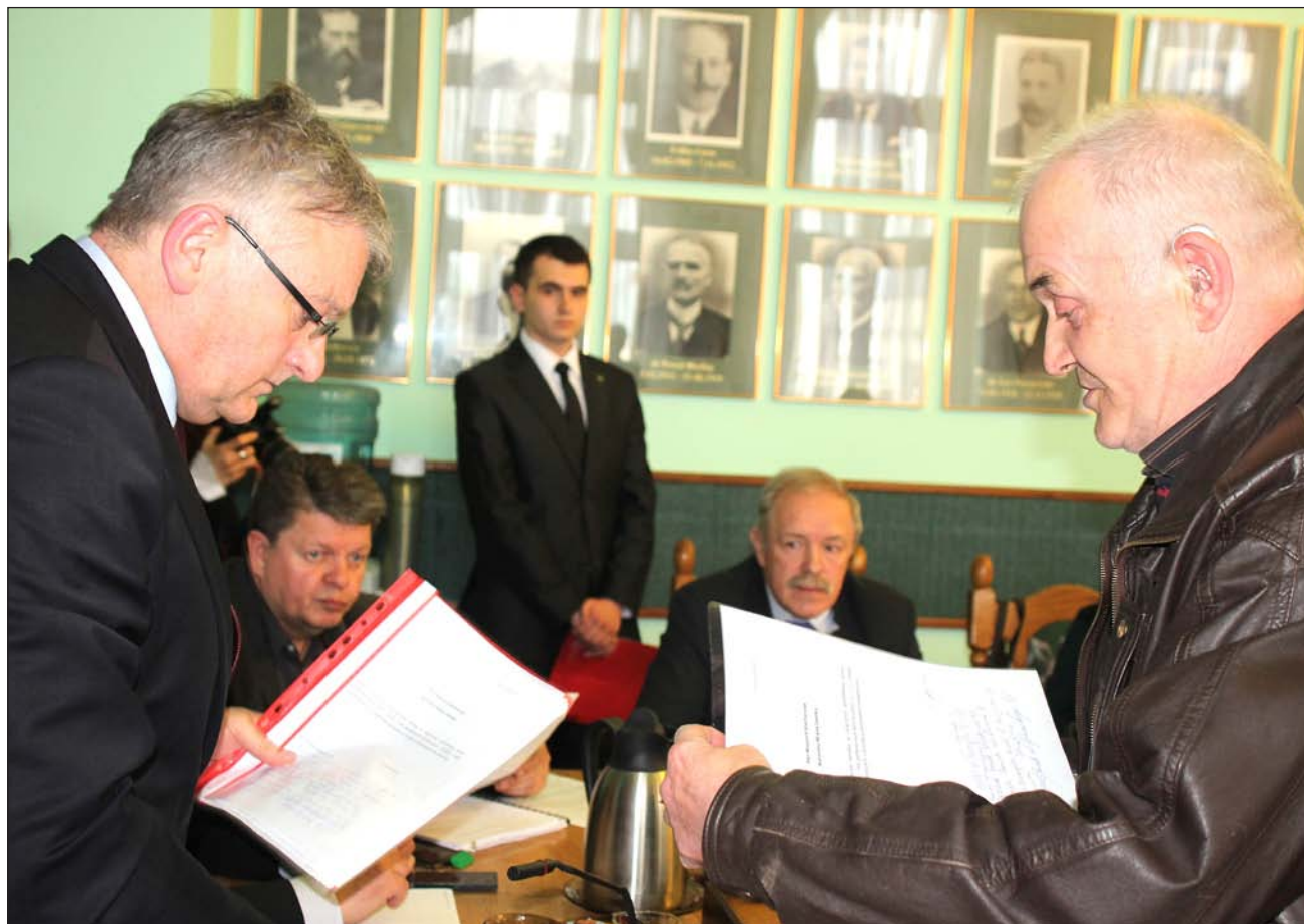
Złożenie petycji w sprawie abonamentu na sesji w dniu 15 kwietnia. Mimo upływu kilku miesięcy i na dwa tygodnie przed wyborami członkowie komitetu protestacyjnego i mieszkańcy nadal nie wiedzieli jak sprawa została załatwiona. Konkretnie nie uzyskali też media.

Od autorki: Obowiązkiem decydentów było wyjaśnienie tej kwestii właśnie przed wyborami. Żeby ludzie wiedzieli na czym stoją. Petycja od mieszkańców została złożona 15 kwietnia, a więc siedem miesięcy temu. Był czas na dogłębną analizę, rozmowy, konsultacje i poszukanie dróg wyjścia. Wszyscy mieli świadomość, że to rok wyborczy i zamknięcie kolejnej „czterolatki”. Stwierdzenie, że „konkretna informacja i wyliczenia zostaną przedstawione mieszkańcom w ciągu najbliższych 2 tygodni” jest – delikatnie mówiąc – wymijające. Bo był to problem i zadanie tej władzy i tej kadencji.