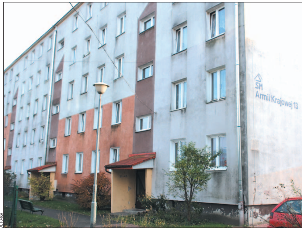
Na zewnątrz nic nie wskazuje, że mieszkający tu ludzie od kilku lat przeżywają koszmar.