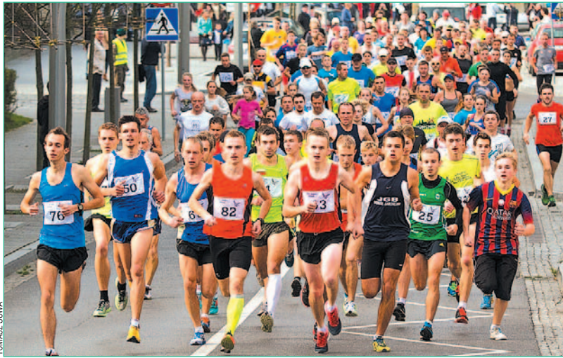
Po starcie przez chwilę wszyscy biegli razem, potem peleton zaczął się rozrywać.