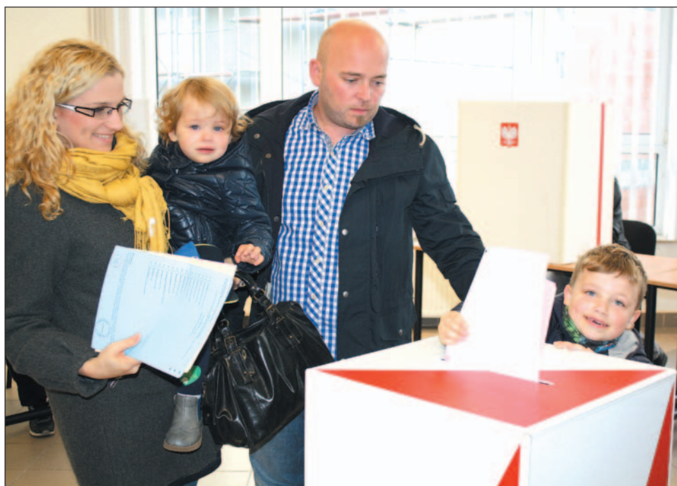
Rodzinne głosowanie to nie tylko frajda dla dzieci, ale także ich edukacja. (W komisji wyborczej nr 4 na szczęście nikt nie utrudniał pracy dziennikarzom.)