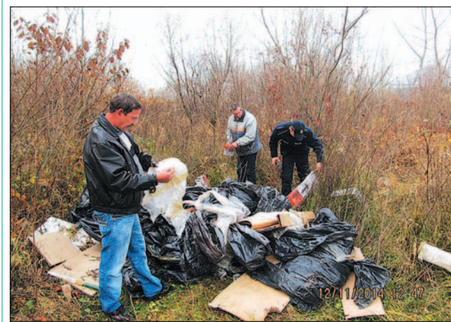
Podczas przeszukiwania śmieci strażnicy znaleźli dane osobowe, wskazujące sprawcę zanieczyszczenia.