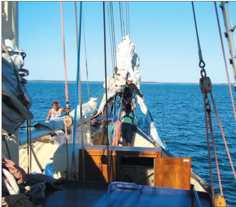
To nie tylko piękna przygoda, ale i szkoła charakteru.

Jest emerytowanym kpt. Marynarki Wojennej. Mundur zdjął w 2007 r., po 22 latach służby. Niedługo jednak wytrzymał na lądzie. – Zawsze ciągnęło mnie do wody. Pamiętam, że nie mogłem się doczekać po zimie, żeby wskoczyć do Sanu. Kiedyś zrukołem to w kwietniu, to mój rekord – wspo-