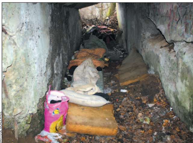
Legowisko w szczelinie pod dawną skocznią przedstawia oplakany widok – smród, bród i ubóstwo. Dobrze, że wkrótce miasto zrobi z tym porządek.