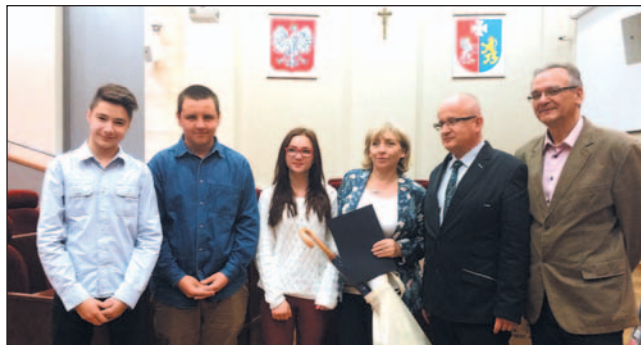
Trzecie miejsce spośród 372 szkół z całego województwa to piękny sukces ekologów z Gimnazjum nr 2.

Kolejny znaczący sukces odniosło Gimnazjum nr 2 im. Królowej Zofii w Sanoku, promując działalność ekologiczną w województwie. Tym razem szkoła zajęła wysokie trzecie miejsce wśród gimnazjów w Kampanii Edukacyjnej „Naładowani Ekologią”. W szranki o tytuł najlepszej placówki podejmującej działania na rzecz ochrony środowiska stanęło 372 szkoły z 44 miast i gmin Podkarpacia.