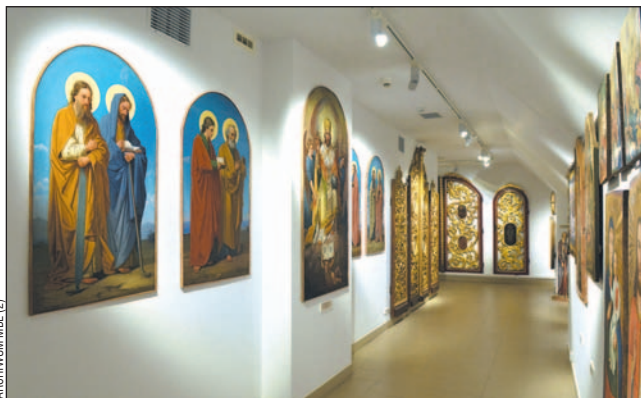
Stała wystawa MBL „Ikona karpacka” po liftingu osiągnęła pełny blask.

Kultury i Dziedzictwa Narodowego, więc błyskawicznie przystąpiono do realizacji zadania. Po czterdziestu latach zniknęły sufitowe jarzeniówki, wtedy uchodzące za szczyt jakości i elegancji, zastąpiło je profesjonalne oświetlenie, odtwarzające światło dzienne i podkreślające piękno oświetlanych ikon czy całych układów ikono-