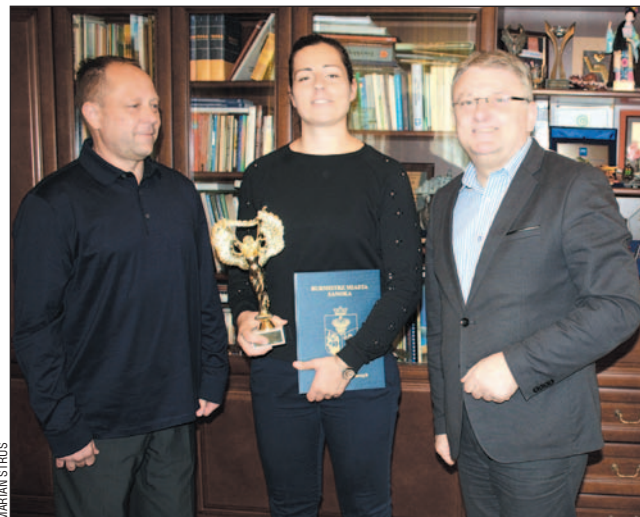
Brązowa medalistka Mistrzostw Świata w Tokio w towarzystwie burmistrza i swego trenera.