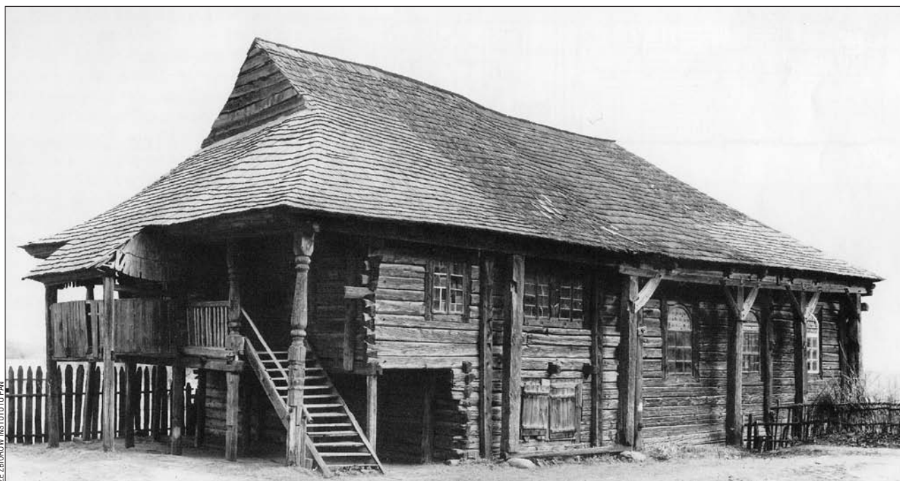
Dzięki dokumentacji jaka zachowała się w warszawskich archiwach, synagoga, która stanie w Galicyjskim Miasteczku w skansenie, będzie wiernym odzwierciedleniem swego pierwowzoru z Połańca.

A my, sanoczanie, cieszymy się, że temat został podjęty i już na starcie nadano mu odpowiednią rangę. Wystartuje początkiem 2015 roku. Zimą, kiedy biały puch pokryje dachy