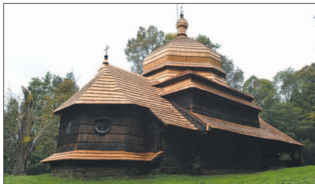
Cerkiewka w Uluczu uważana jest za jeden z najpiękniejszych obiektów architektury sakralnej. To są naprawdę uzasadnione opinie.

A zatem zapraszamy Państwa na wycieczkę „Szlakiem nowych inwestycji MBL”. emes