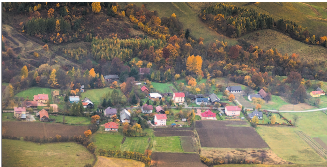
Specyficzne położenie Lisznej powoduje problemy z telefonami i internetem. Żeby się o tym osobiście przekonać, trzeba najpierw dojechać do wioski po dziurawej drodze.

się w zawile szczegóły i parametry techniczne, powiem tylko, że koszty okazały się zbyt wysokie. Ale wszystko wskazuje na to, że miejscowości te znajdują się w kolejnym rozdaniu pieniędzy,