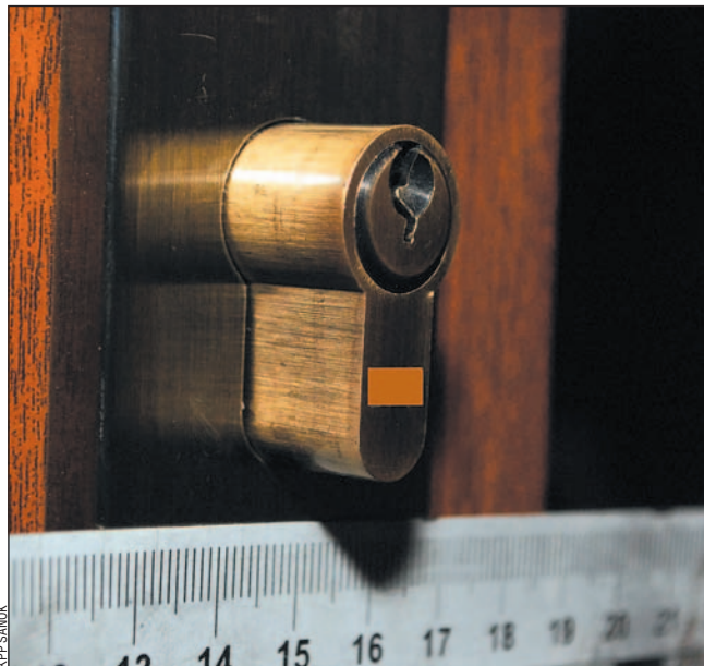
Wylamanie wkładki w zamku zabiera przestępcom kilka sekund.

– Przestępcy nakładają specjalne urządzenie do wylamania wkładek. Sporym utrudnieniem byłby taki sposób ich za-