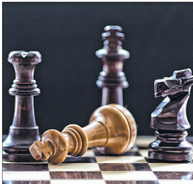
Kto ostatecznie wygra tę rozgrywkę?...

(po 3 mandaty) sprawiają, że możliwe są przeróżne konfiguracje. Problem w tym, że każdy z potencjalnych koalicjantów ma własne ambicje i chce „ugrać”