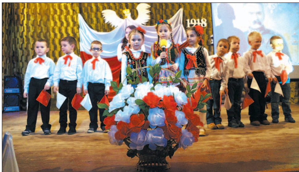
W atmosferze miłości do swojej Ojczyzny wychowywani są mali obywatele Nowosielec. Zdjęcie z ich występu z okazji Święta 11 Listopada, autorstwa Marka Michalskiego, wybrałszy najpiękniejszym zdjęciem 48 numeru „TS”.

Koncert rozpoczął się polonezem „Piękna nasza Polska cała” w wykonaniu Regionalnego Zespołu Ludowego „Ziemia Sanocka” działającym pod patronatem OSP. Następnie bardzo liczna widownia, którą ledwie mieściła sala widowiskowa Domu Kultury, wysłuchiwała prezentacji mówiącej o trudnej