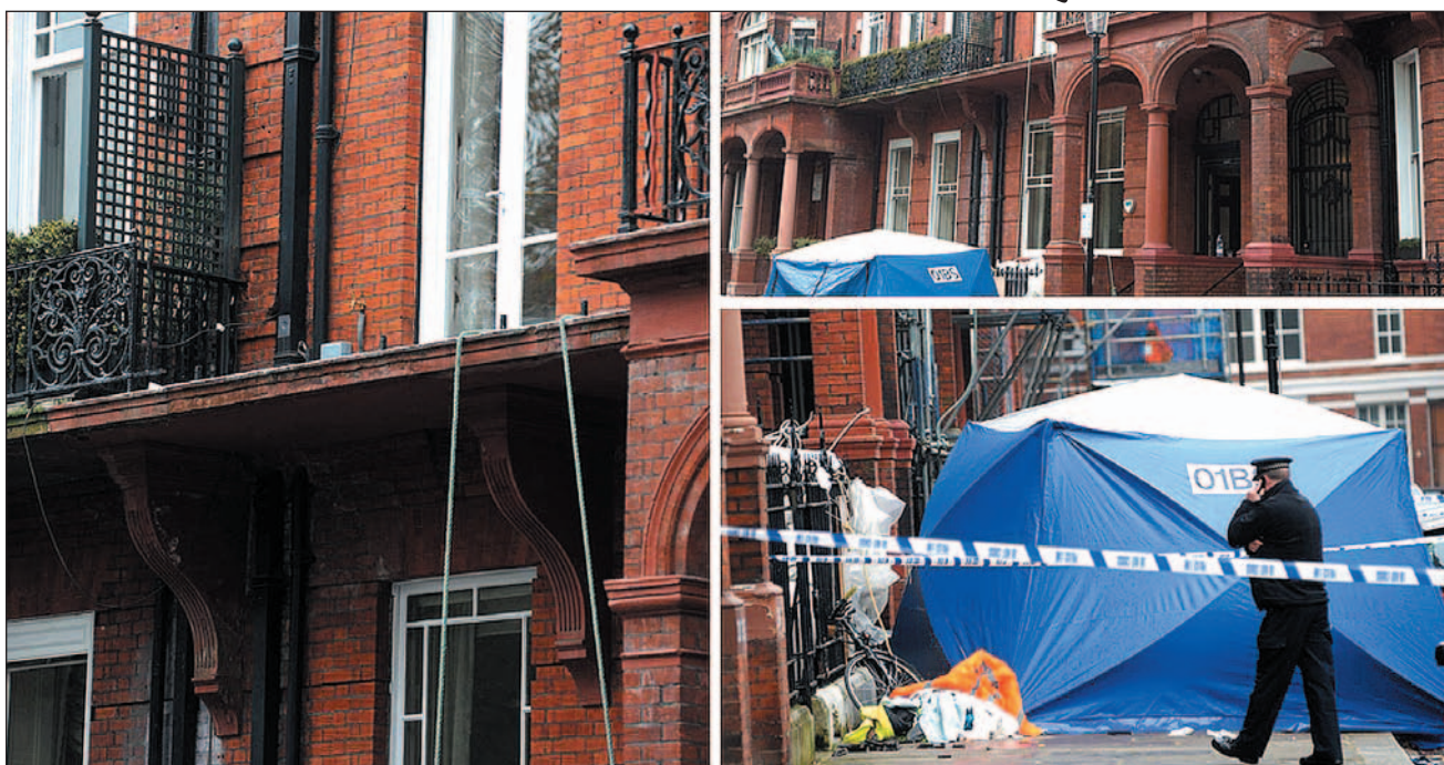
Miejsce tragedii tuż po wypadku. Balkon mieszkania, przez który Polacy – pracownicy firmy dokonującej przeprowadzek – chcieli dostarczyć sofę. Niestety, barierki nie wytrzymały, a wraz z nimi wypadli z balkonu dwaj młodzi ludzie. To był upadek, który pozbawił ich życia.

Przybyli na miejsce tragedii policjanci mówili, że wcześniej wiele takich sof i innych mebli było wciąganych do mieszkań w ten sposób. Z kolei inżynier pracujący w sąsiedniej rezydencji tłumaczył, że barierki rdzewieją, przez co kamień, w którym są umocowane, staje się