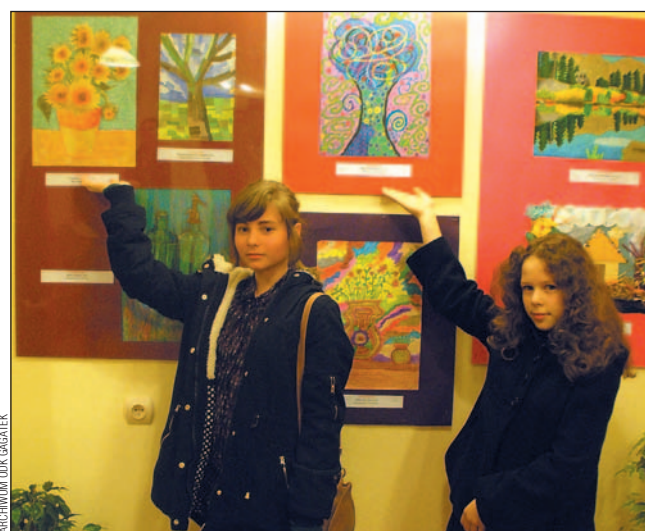
Uczestniczki konkursu z dumą prezentowały wykonane prace.