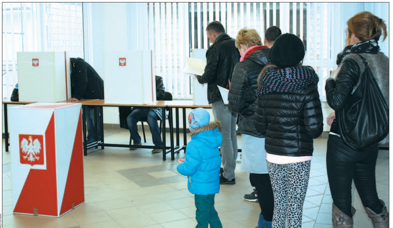
W ościennych gminach jest już po wyborach, w Sanoku ponownie pójdziemy do urn w niedzielę.