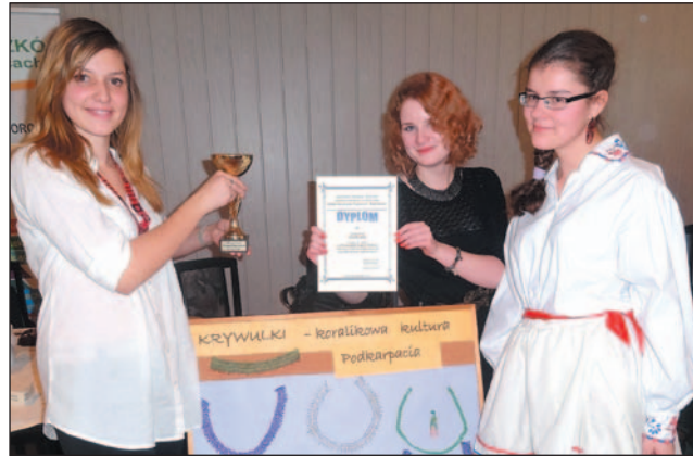
Uczennice ZS1 zdobyły główną nagrodę konkursu w Przeworsku.

Sukcesy Zespołu Szkół nr 1. Najpierw jego uczennice wygrały IX Wojewódzki Konkurs „Na Najlepszy Produkt Turystyczny Małej Ojczyzny – Jakiej Nie znacie” w Przeworsku, a dzień później zdobyły wyróżnienie Międzynarodowego Turnieju „Kulinaryny Zawrót Głowy” w Rzeszowie.