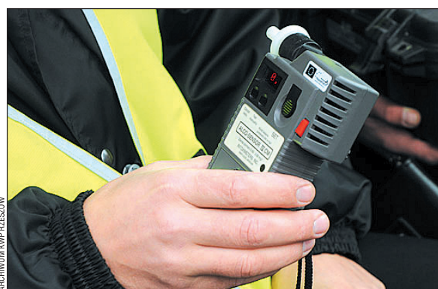
Mimo częstych kontroli, na drogach wciąż pełno pijanych kierowców.

Po godz. 3 w nocy dyżurny Policji otrzymał zgłoszenie o „wywrotce” na ul. Kolejowej. Przybyli na miejsce funkcjonariusze ustalili, że jadący fiatem ul. Dworcową w kierunku ul. Kolejowej na łuku drogi stracił panowanie nad pojazdem, zjechał z jezdni i uderzył w znak drogowy, a następnie dachował. Kierującym okazał się 22-letni