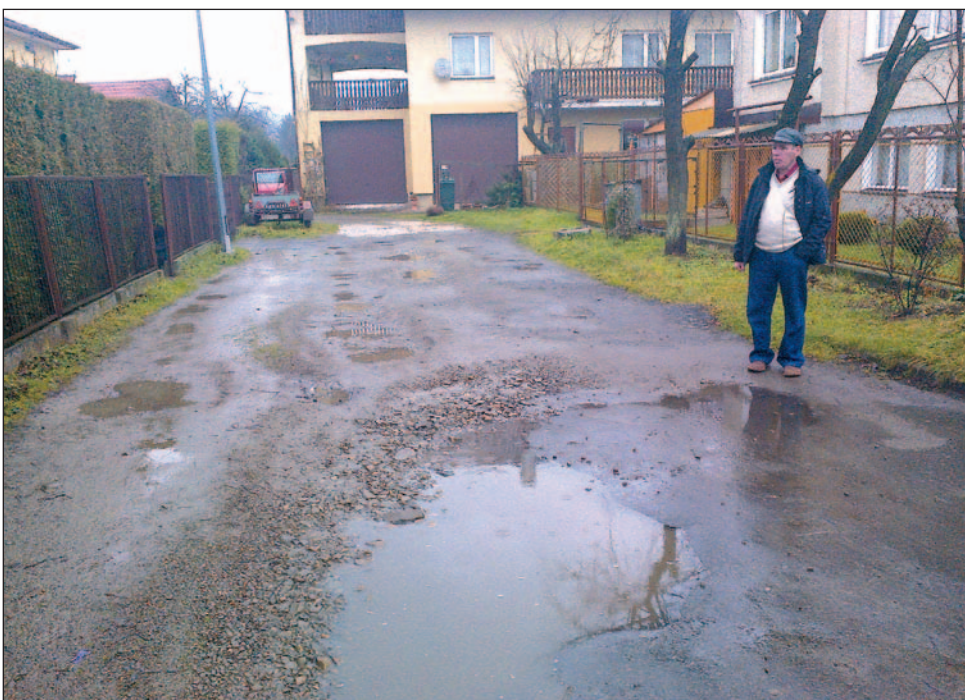
Po każdym deszczu na feralnej uliczce tworzą się wielkie kałuże. Nowi radni muszą w końcu doprowadzić do jej remontu.

Sprawcy już wkrótce za swój czyn staną przed sądem. Zgodnie z art. 279 kodeksu karnego młodym mężczyznom grozi kara do 10 lat pozbawienia wolności. /j/