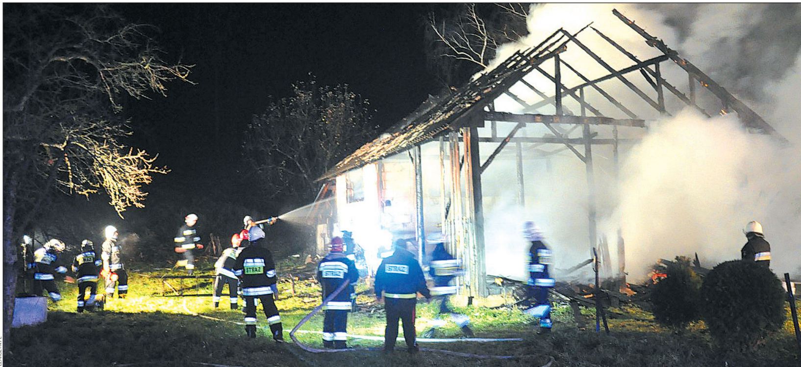
Gasząc w nocy pożar stodoły strażacy nie przypuszczali, że rano odsłoni prawdziwą tragedię...

— To wielka tragedia i szok dla wszystkich. Znałem go od lat, kiedy jeszcze pracował w Mleczarni. Był bardzo dobrym pracownikiem, wręcz pedantem. W życiu codziennym nieraz bywał trudny. Miał swoje dziwactwa i natręctwa. Ostatnio mieszkał sam. Jakoś sobie radził. Najbardziej cieszył się wnukiem, kupował mu zabawki. Ledwie tydzień temu wrócił z Kanady. A za dwa dni już nie żył... Kiedy się dowiedziałem, jak zginął, doznałem szoku. Do dziś nie mogę się otrząsnąć... Ta posesja należała kiedyś do rodziców jego żony. Myślałem, że pojechał tam celowo, bo chciał coś zamaniestrować. Nigdy nie wiadomo, co w człowieku siedzi. Komputery się prze-