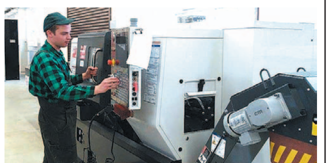
Stowarzyszenie przekazuje bezpłatnie materiały i narzędzia wykorzystywane podczas zajęć oraz umożliwia praktyki zawodowe dla uczniów ZS nr 2 i 3 w Stacji Kontroli Pojazdów.

pełni rolę szkolnej pracowni. Dodajmy nowoczesnej i dobrze wyposażonej, gdyż stowarzyszenie utrzymuje ją na odpowiednim poziomie, a w bieżącym roku na własny koszt wyasfaltowało dojazd do stacji.