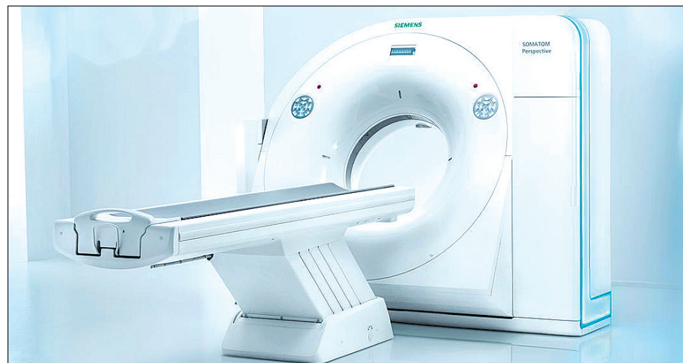
Lekarze mówią: nowoczesny, wypasiony, funkcjonalny i niezastąpiony. Kobiety dodadzą: estetyczny i piękny! Same ochy i achy!

Z rozmowy dowiadujemy się, że sanocki tomograf będzie wyposażony w bogate oprogramowanie m.in. onkologiczne. Dzięki niemu będzie mógł wykrywać nowotwory w ujęciu dy-