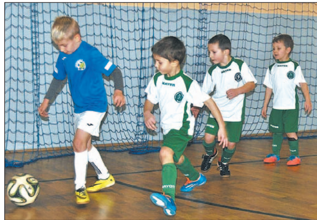
Młodzi piłkarze stosowali różne tricki, grając nawet... „gęsiego”.

Ekoball rozpoczął cykl Piłkarskich Turniejów „Mikołajkowo-Niepodległościowych” dla dzieci. Rozegrano już cztery imprezy, w najbliższych dniach dwie kolejne.