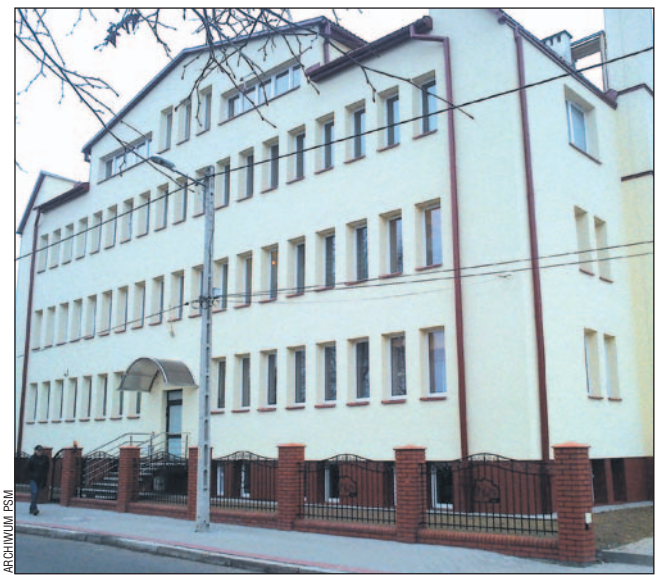
PSM w nowej szacie.