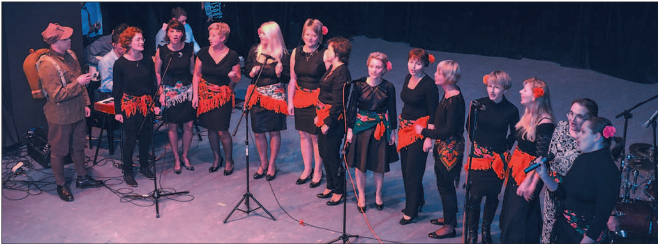
Sceniczny debiut belfrów podbił widownię, która owacyjnie dziękowała wykonawcom.

– Już drugi raz będę Świętym Mikołajem. Na początku bardzo się bałem, bo nie wiedziałem, czego się spodziewać, ale gdy weszliśmy do pierwszego domu, zobaczyłem dwoje dzieci, które tak bardzo się ucieszyły na nasz widok, że zrozumi-