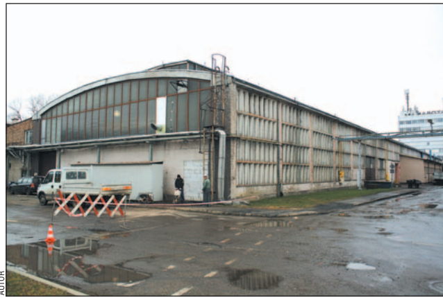
Już trwają pierwsze prace przy hali A8, którą Pass-Pol kupił od Autosanu.