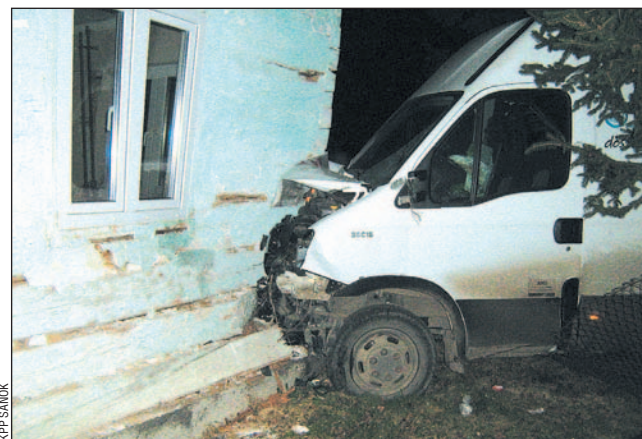
Konstrukcja budynku została mocno naruszona.

Dramatyzm sytuacji powiększa to, iż do zdarzenia, które pozabawiło rodzinę dachu nad głową, doszło tuż przed świętami, które z pewnością nie będą dla niej łatwe. Poszkodowani mogą liczyć na zasiłek z opieki społecznej, ale to kropla w morzu po-