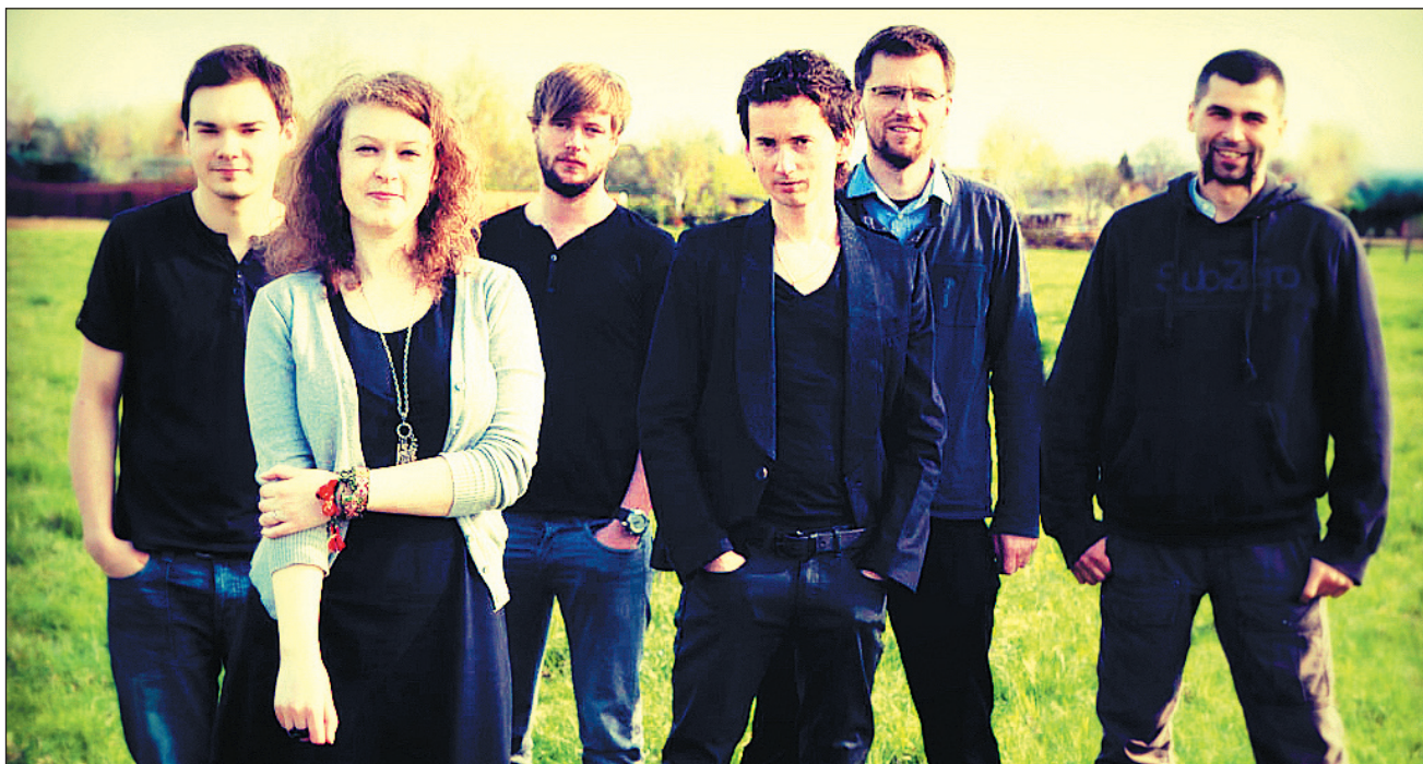
Tołhaje w niczym nie przypominają bieszczadzkich zbójników, ale ich muzyka garściami czerpie z folkloru Karpat.

Miejmy nadzieję, że współpraca z filmowcami, nowe utwory i świetne recenzje dadzą Tołhajom energetycznego i artystycznego „kopa”, motywując ich do szybszej pracy nad w pełni premierowym materiałem. Bo grupa ma potencjał, który aż prosi się o częstsze wykorzystanie.