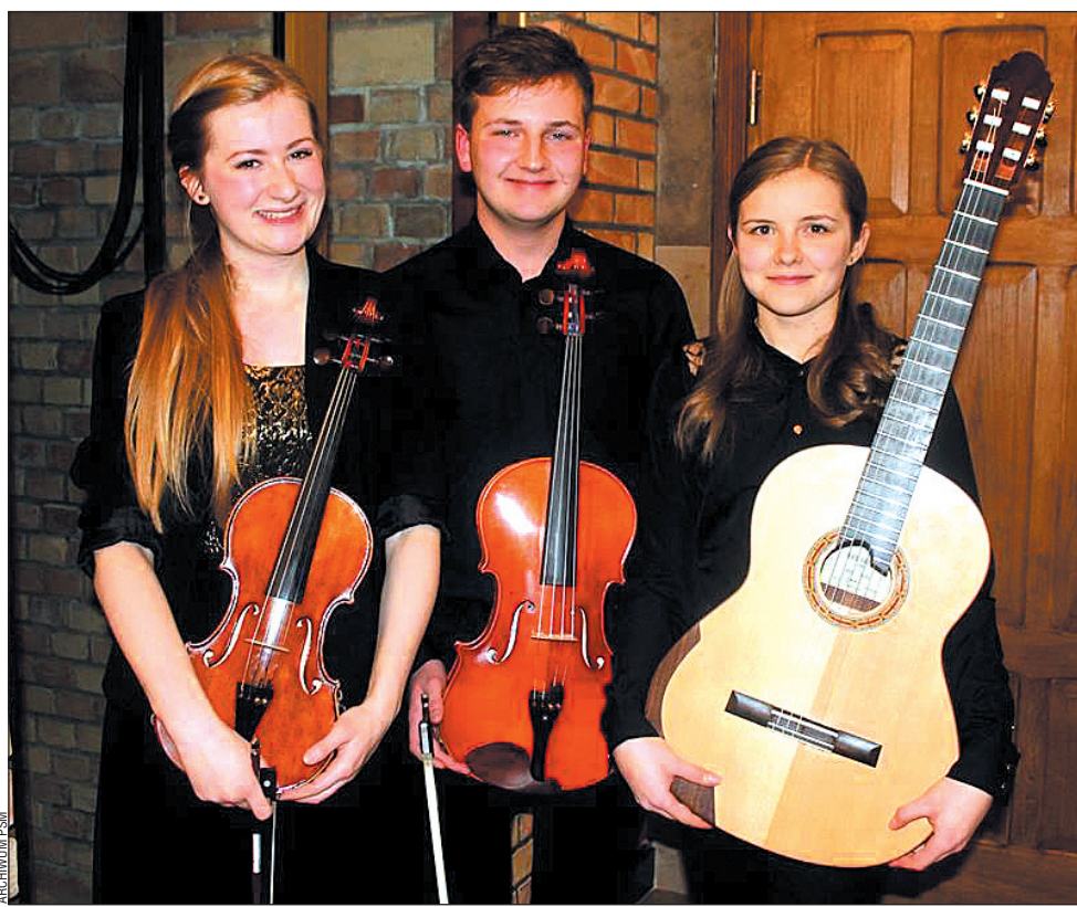
Zespół kameralny „String Trio” można uznać za muzyczne objawienie 2014 roku. Szybko zdobył uznanie słuchaczy, a eksperci obdarzyli go przepustką do udziału w finale centralnym, w którym wystąpią najlepsze zespoły w kraju.

W dniach 8-9 grudnia br. Centrum Edukacji Artystycznej Ministerstwa Kultury i Dziedzictwa Narodowego zorganizowało w Jarosławiu Makroregionalne Przesłuchania Zespołów Kameralnych Szkół Muzycznych II stopnia. Wzięło w nich udział 21 zespołów z regionów: podkarpackiego, małopolskiego i lubelskiego. Sanocką Szkołę Muzyczną reprezentowały trzy zespoły. Wszystkie zaprezentowały bardzo wysoki poziom, zdobywając pochlebne opinie jury, w którym zasiadali znakomici kameraliści, profesorowie Uniwersytetu Muzycznego w Warszawie oraz Akademii Muzycznej we Wrocławiu. Palmę pierwszeństwa wywalczył STRING TRIO, kwalifikując się do finału konkursu, który odbędzie się w styczniu 2015 r. w Warszawie.