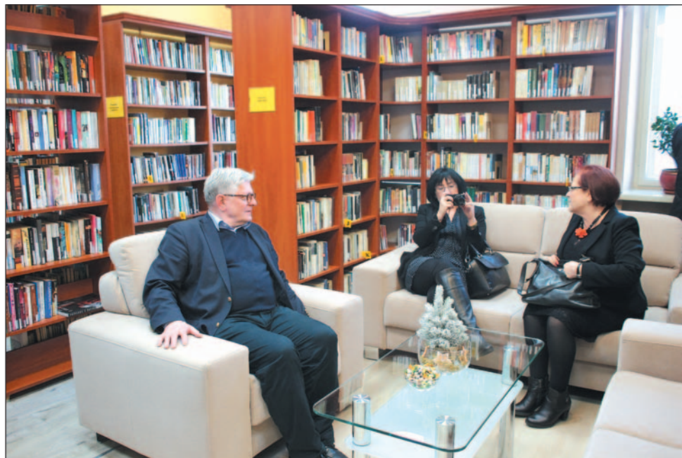
MBP w nowej odsłonie: nowoczesnie zaaranżowane wnętrza (według pomysłu architekta wnętrz Oksany Kulczyckiej), elegancja, wygoda, dobre oświetlenie.