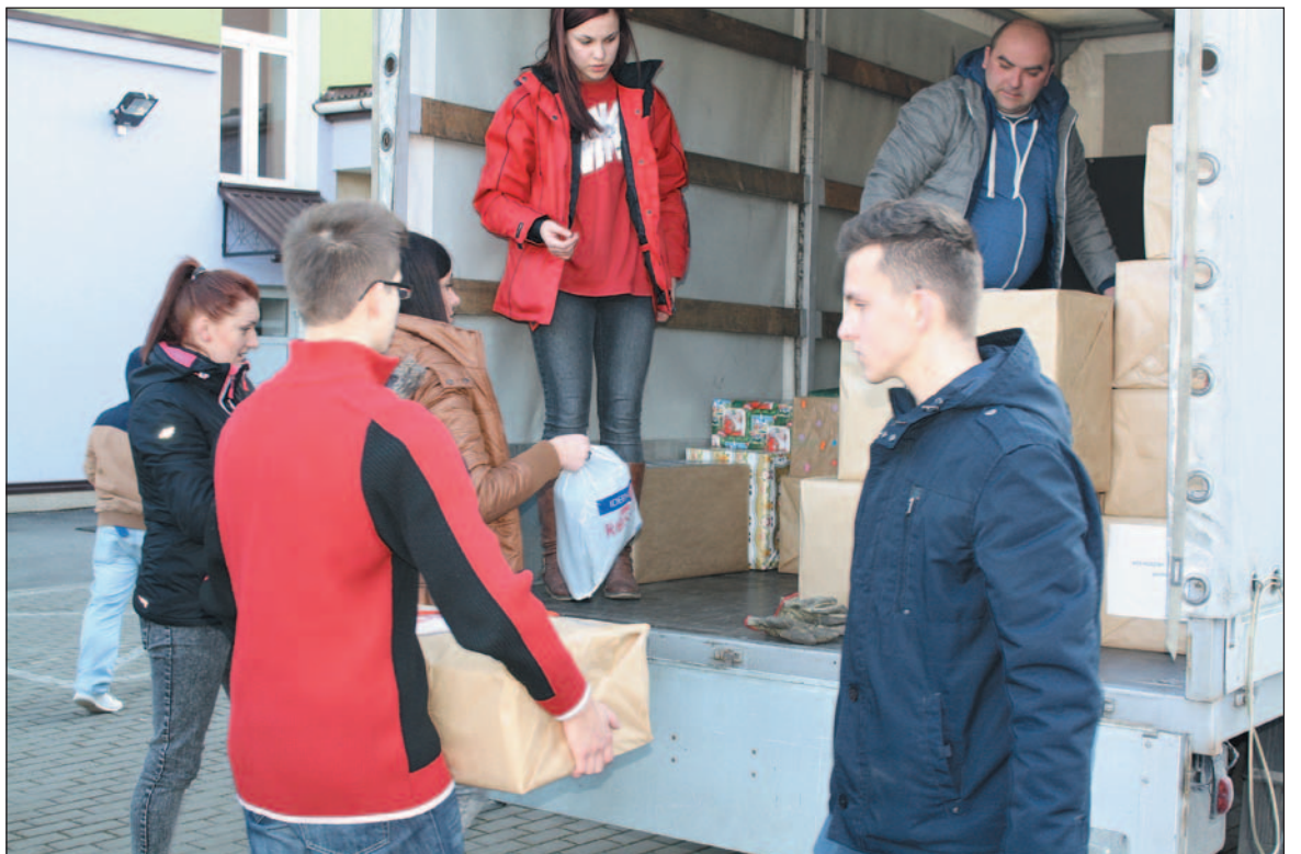
Wolontariuszki dźwigały ciężkie paczki na równi z chłopakami.