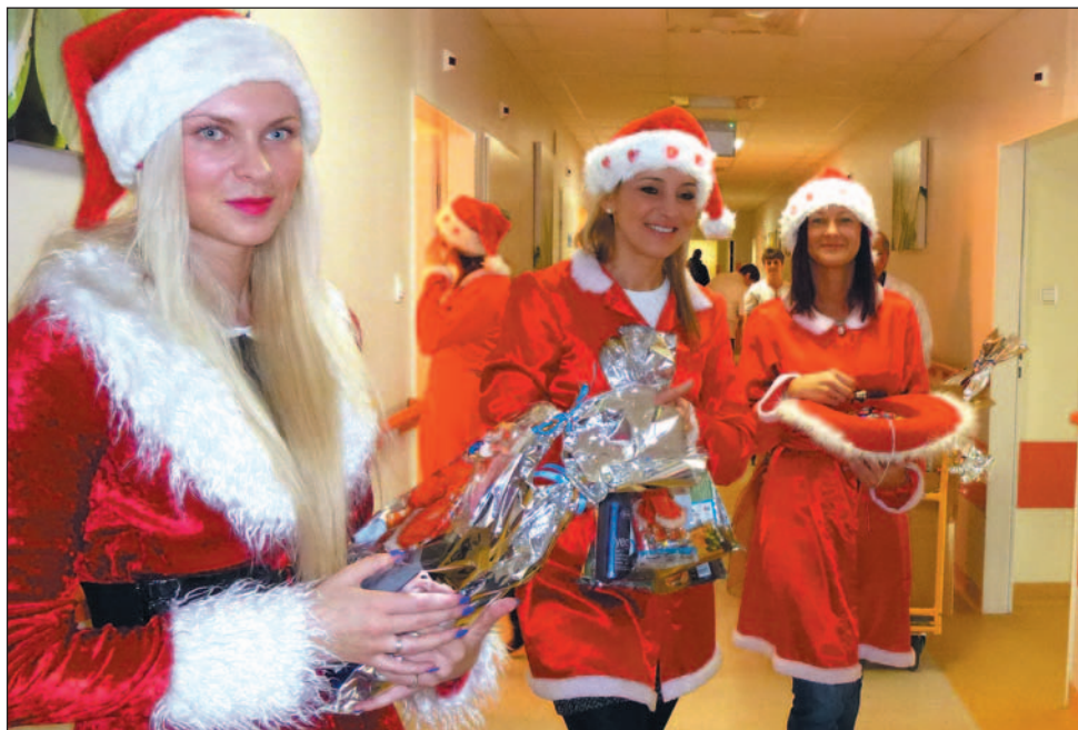
Pomocnice świętego Mikołaja wnoszą radość i uśmiech w szpitalne mury.

Piękne dziewczęta, wolontariuszki sanockiego stowarzyszenia Sanitas, po raz kolejny odwiedziły pacjentów w Podkarpackim Ośrodku Onkologicznym w Brzozowie. Przyniosły drobne prezenty, a przede wszystkim uśmiech i pozytywną energię.