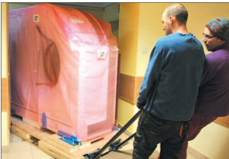
Przedstawiciele krakowskiej firmy Emi-Med, która zajmie się montażem tomografu, żartowali, że Siemens chyba robił go na sanocką miarę. Idealnie mieścił się we wszystkich otworach drzwiowych, choć w większości dosłownie na centymetr.