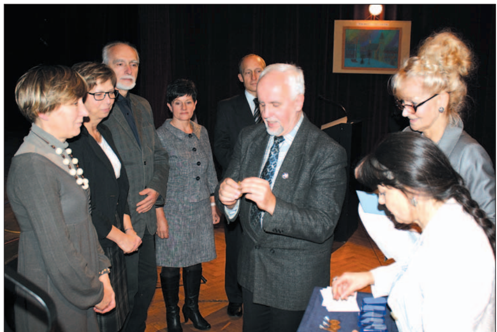
Ważnym punktem uroczystości było wręczenie Medalii im. Henryka Jordana. To najwyższe odznaczenie TPD.

Imprezę w „Górniku” zakończyła prezentacja multimedialna pt. „Bezpieczeństwo dzieci i młodzieży w sieci”.