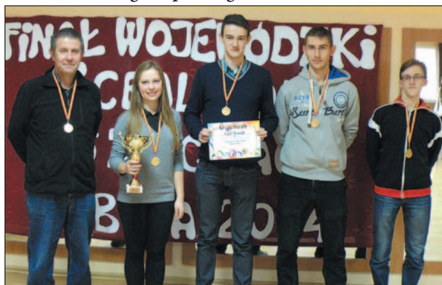
Zwycięska drużyna I LO.

Drużyna I Liceum Ogólnokształcącego wygrała szkolne zawody wojewódzkie w szachach! Nagrodą za zwycięstwo jest awans do finału ogólnopolskiego.