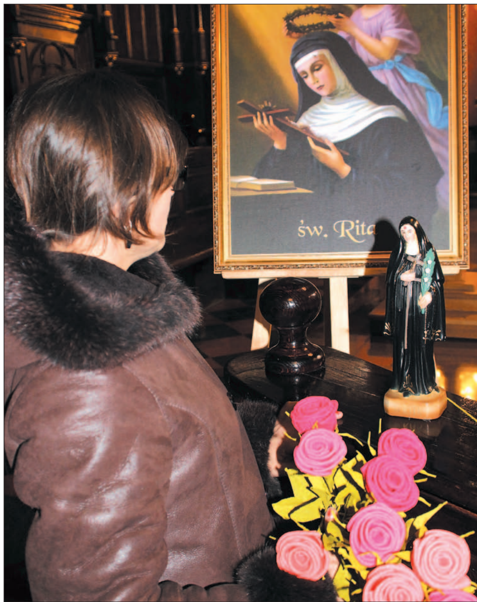
Rita kochała róże. Zakwitwały dla niej w klasztorным ogrodzie nawet zimą.