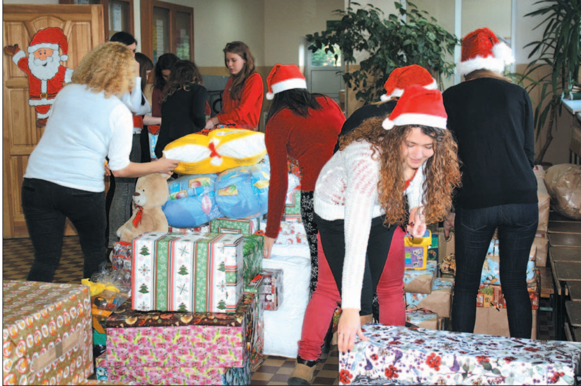
W zamienionej na magazyn sali gimnastycznej „Ekonomika” przez cały dzień panował gwar i ruch. Nikt się nie oszczędzał.