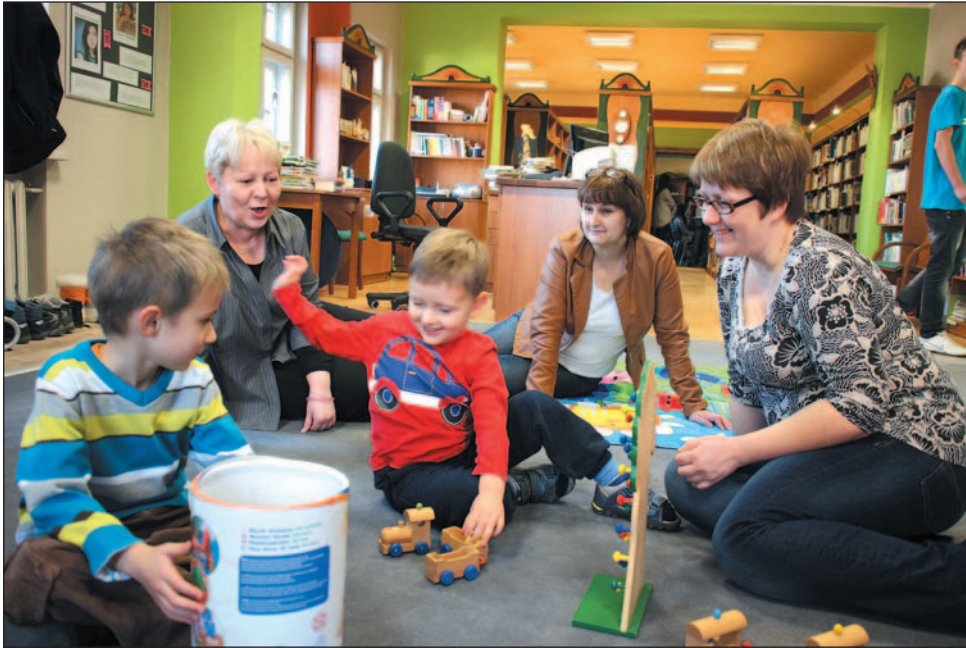
Dzieci w bibliotece, dużo dzieci. I o to właśnie chodzi!