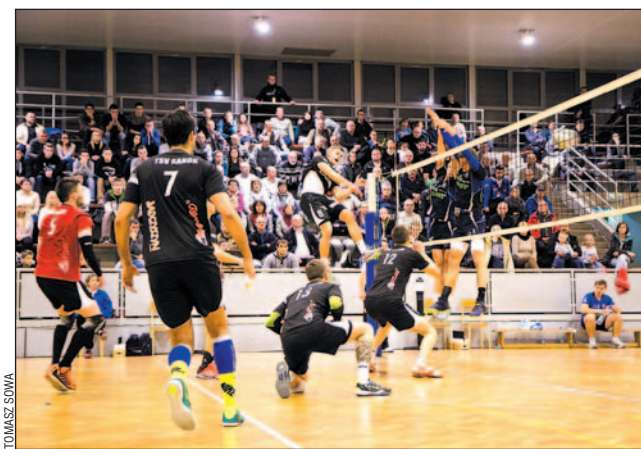
Siatkarze TSV Cellfast wygrali dziesiąty mecz w sezonie.