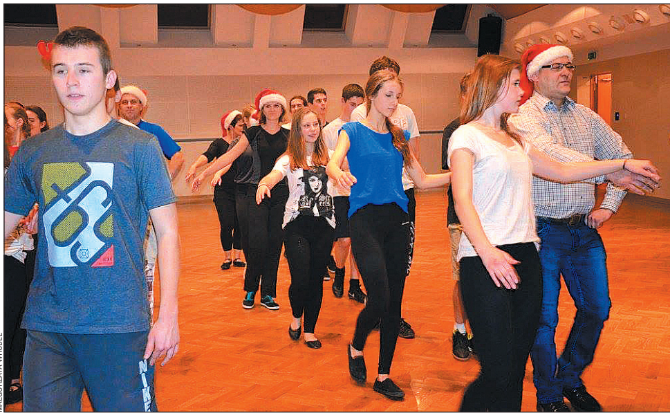
Doświadczenie i młodość sprawdzają się także w tańcu.

Podczas warsztatów, które odbyły się w Sanockim Domu Kultury, tancerze ćwiczący w trzech grupach wiekowych przygotowywali między innymi nowe układy taneczne na wiosenno-letni sezon koncertowy. Obecnie w repertuarze zespołu są: polonez, mazur,