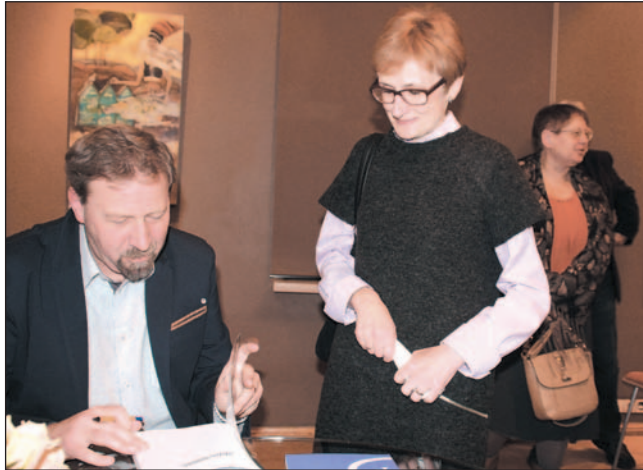
Podczas prezentacji książek w MBP do autora ustawiła się kolejka po autografy.

dzonej przez niego analizy wynika, że kluczowym pojęciem wiążącym wszystkie wątki w twórczości sanocko-brukselskiego pisarza jest rytuał.