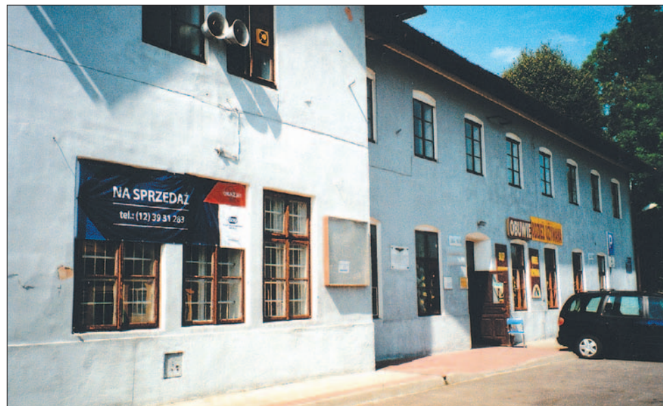
Tak wygląda dziś dworzec „kolejarskiego Zagórze”. W części wypełniają go sklepy i kramy, pozostała część PKP chcą sprzedać. Chętnych brak. Zwłaszcza teraz, kiedy zamarł ruch kolejowy na tej trasie.

W urzędzie gminy nikt nie wiedział, po co zrobiono to półkole, nikogo to specjalnie nie obchodziło. Nikt też nie wiedział, kto był w komisji granicznej, która to ustalała. Pomyślałem sobie, że kto by nie był, nikt nie sprzeciwiałby się radzieckim żądaniom. Tak jak nikt nie sprzeciwiał się przejściu rafinerii nafty, ogołoconej z urządzeń przez Rosjan przy wymianie terenów w 1951 roku.