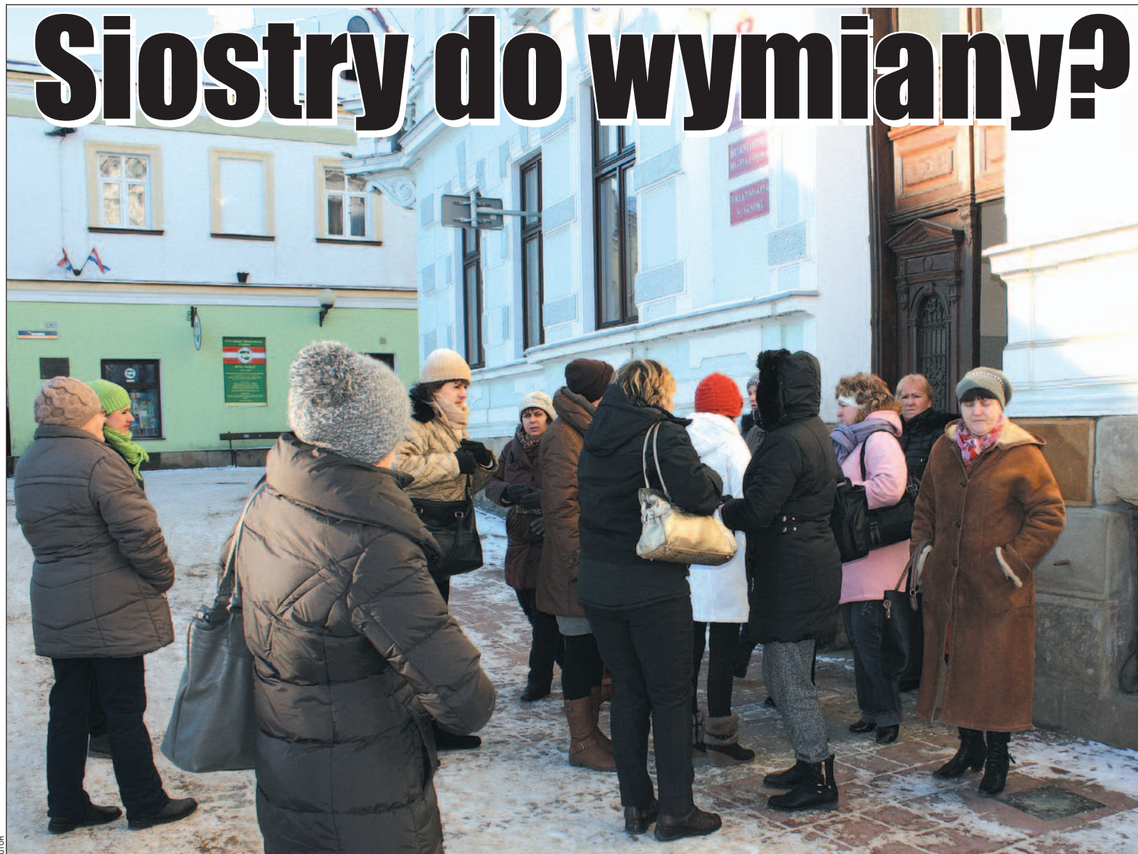
W środę rano siostry gościły w Urzędzie Miasta, następnie poszły do MOPS-u. Zapowiadają, że nie odpuszczą do momentu wyjaśnienia sprawy.

– Jakież było moje zdziwienie, gdy kwadrans później otrzymałam telefon od jednej z pracownic ośrodka. Powiedziała, że właścicielka „Elpidy” chce jak najszybciej „przejść” nasze pracownice. Kategorie odmówiłam. Chwilę później taki sam telefon odebrały koleżanki w PKPS-ie. Byłam tym bardziej zszokowana, że przecież w ofercie trzeba było wpisać swój wy-