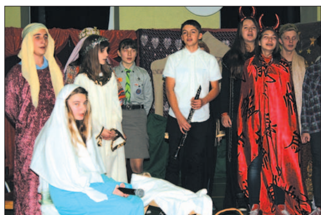
Jasełka zakończyło wspólne kolędowanie.