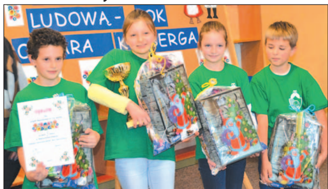
Zwycięska drużyna SP2.

Szkoła Podstawowa nr 2 wygrała Konkurs „Fantazje z Twórczością Ludową – rok Oskara Kolberga”, który zorganizowano w Szkole Podstawowej nr 3.