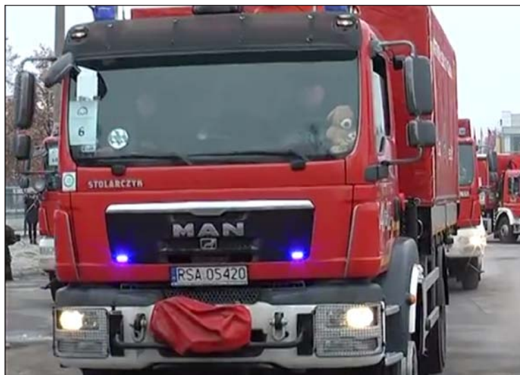
Na placu manewrowym w Charkowie – sanocki wóz łatwo rozpoznać po rejestracji i pluszowym misiu za szybą.

W pięć dni przejechali 3,5 tysiąca kilometrów. Z Sanoka, przez Warszawę, Dorohusk, Kijów, do Charkowa – i z powrotem. Jechali swoim wozem strażackim – jednym z 30, które wchodziły w skład polskiego konwoju specjalnego z pomocą humanitarną dla mieszkańców wschodniej Ukrainy. Dla dziesiątków tysięcy uchodźców z Donbasu, gdzie od wielu miesięcy toczą się walki z prorosyjskimi separatystami, to jedyna nadzieja na przetrwanie zimy.