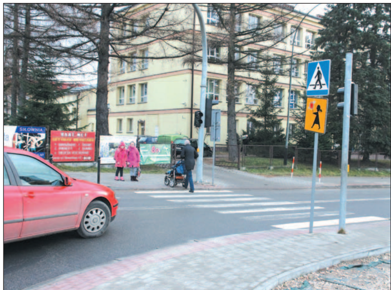
Przy ulicy Słowackiego jest wiele niebezpiecznych miejsc, począwszy od przejścia dla pieszych przy SP2.

Co jakiś czas trafiają do redakcji sygnały dotyczące ulicy Słowackiego, szczególnie zakrętu powyżej McDonald's, gdzie jadące w przeciwnych kierunkach samochody niemal „ocierają się lusterkami”. Niektórzy pytają, czy droga spełnia parametry drogi dwukierunkowej, bo przez wiele lat Słowackiego była przecież traktem jednokierunkowym.