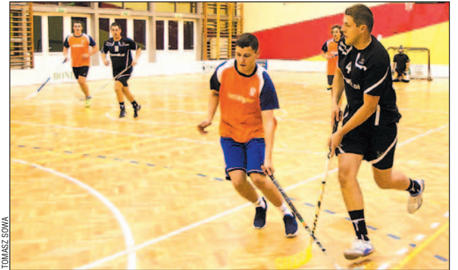
Unihokeiści esanok.pl (ciemne stroje) chcą powalczyć o odzyskanie tytułu mistrzowskiego.