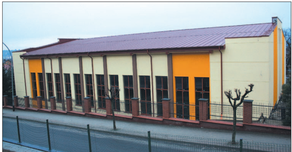
Obecnie centrum najlepiej prezentuje się, widziane z ul. Chopina. Po drugiej stronie to jeszcze plac budowy.

Wielkimi krokami zbliża się finał budowy Centrum Sportowo-Dydaktycznego przy Państwowej Wyższej Szkole Zawodowej. Przed rozpoczęciem kolejnego roku akademickiego nowoczesny obiekt ma zostać oddany do użytku, a korzystać z niego będą nie tylko studenci.