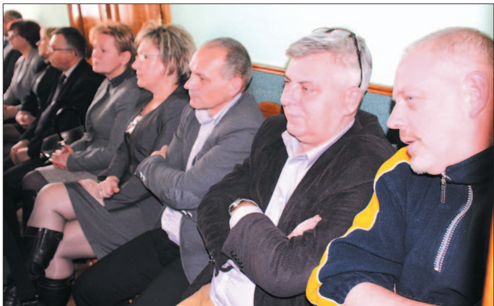
Poczynianom radnych przyglądali się dyrektorzy powiatowych szkół i placówek oświatowych oraz szefowie związków zawodowych.