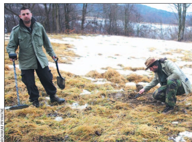
Nasi Indiana Jones w Bieszczadach podczas wykopywania skarbu.

Czymś niezwykle jest nie tylko wiek przedmiotów i sposób ich ukrycia, ale też samo miejsce. Do niedawna naukowcy byli przekonani, że w tym okresie Bieszczady były puste, a czas ich