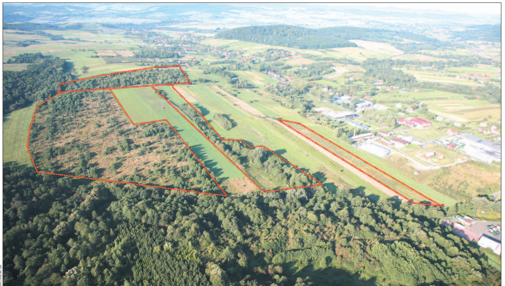
Pomysłów dla Sanoka nie brak, gorzej gdy zderzy się je z realiami, zwłaszcza finansowymi. Na zdjęciu: teren pod strefę przemysłową na Dąbrówce. Z góry wydaje się płaski, jednak w rzeczywistości jest mocno pagórkowaty i trudno dostępny.

Jednym z nielicznych „pewniaków” jest chodnik przy ulicy Zamenhoffa – Norwida. Ponieważ w grę wchodzi wybudowanie 435 metrów