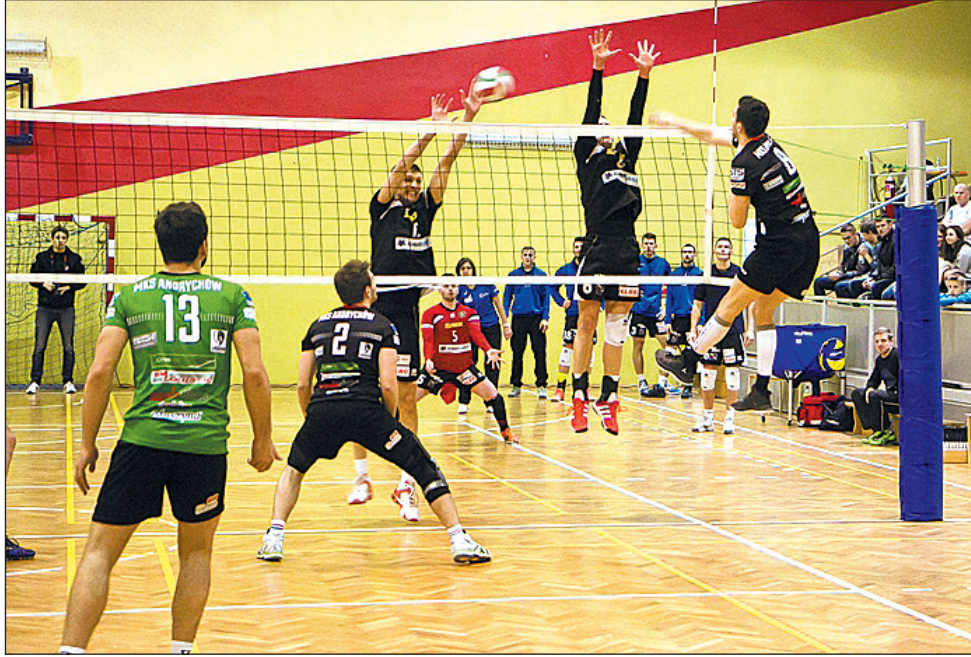
Siatkarze TSV nie mieli litości, biorąc rewanż w stosunku 3:0. Choć rywal łatwo skóry nie oddał.