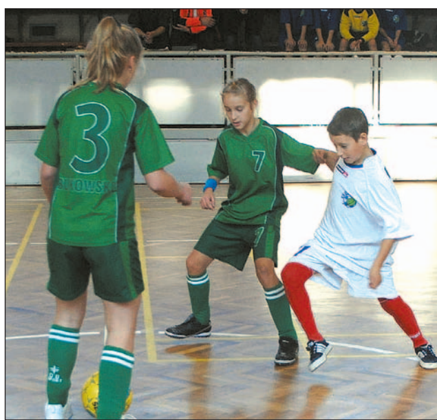
Darmowe sale dla trenujących dzieci będą dużym wsparciem dla klubów.