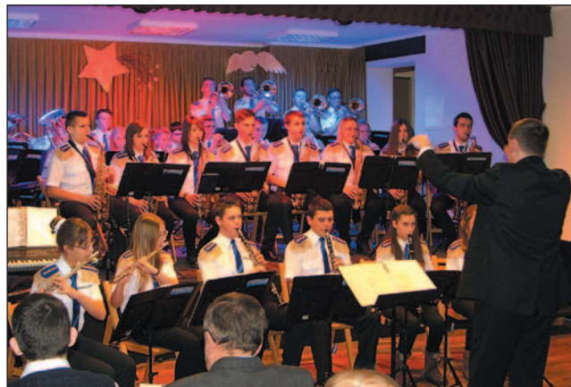
Orkiestra „Avanti” wystąpiła dwukrotnie, z kolędami i repertuarem rozrywkowym.

W międzyczasie wystąpił Chór „Gloria Sanociensis”, z racji skromnego miejsca w nieco okrojonym składzie. Zdaniem wielu słuchaczy był to jeden z je-