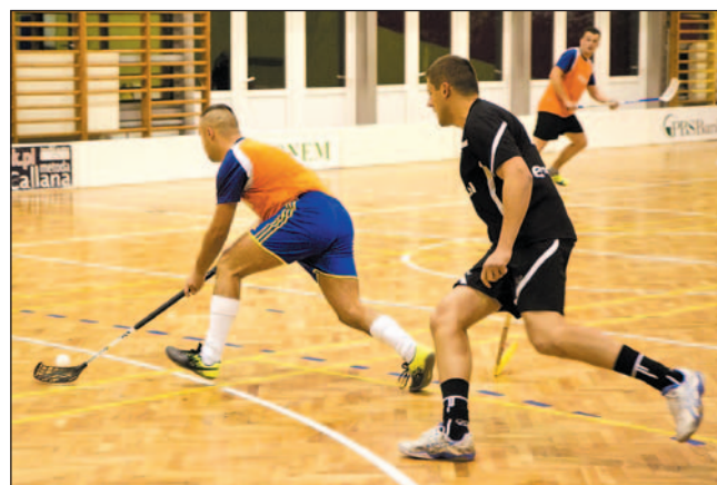
Na razie dominują faworyci, ale może się to zmienić w play-offach.

Sanocka Liga Unihokeja, XI kolejka. Niespodzianek brak – czołowe drużyny wciąż na zwycięskiej ścieżce. Tym razem bez dwucyfrowek, choć w większości spotkań niewiele zabrakło.