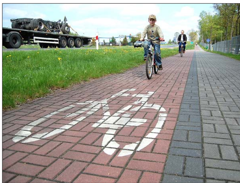
Kilkunastotysięczny Człuchów na Pomorzu ma dziesiątki kilometrów tras rowerowych. Sanok na razie raczkuje w tej dziedzinie.

Koszt budowy pięciu ścieżek szacowany jest na 5 mln zł. W po-