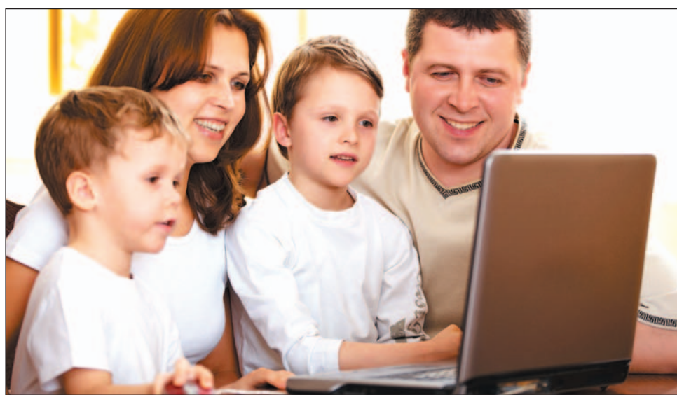
Pierwsze samorządy, którym firma Euro Grant „sprzedała” projekt, mają olbrzymie kłopoty. Oprócz Sanoka z „wykluczeniem cyfrowym” boryka się Poznań. Maków mądrze się wycofał.

Problemy zaczęły się pod koniec ubiegłej kadencji. Władza Wdrażająca Programy Europej-