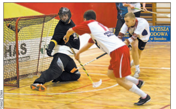
Mecz Foresta z Drozdem zakończył się zwycięstwem tych pierwszych.

Sanocka Liga Unihokeja, XIV kolejka. Drużyna esanok.pl wciąż z kompletem punktów, choć znów wygrała po mękach, w meczu z AKSU zwycięską bramkę strzelając tuż przed końcem. Pozostałe zespoły z czołówki walczą o jak najlepsze miejsca przed fazą play-off.