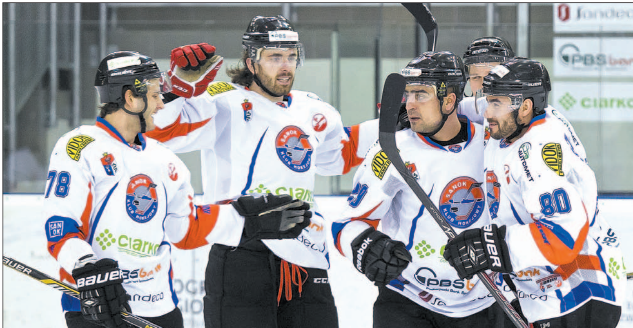
To jeden z dowodów świadczących o tym, że jest drużyna! Jeden za wszystkich, wszyscy za jednego!

zdrowi, nikogo nie trapią kontuzje – dodaje.