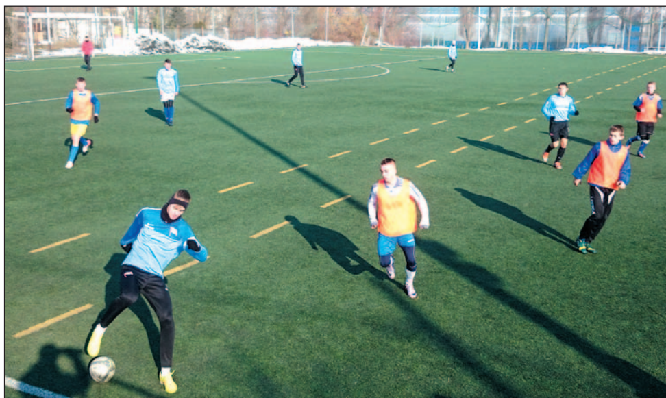
Pod Wawelem piłkarze Ekoballu zagrali świetny mecz, nie dając szans Cracovii.

Młodzi piłkarze Ekoballu mają ferie na sportowo. Jego drużyny zaliczyły aż dziewięć turniejów, odnosząc trzy zwycięstwa – młodsi w Dukli, młodsi w Jaśliskach, a trampkarze w Niebylcu. Wisienką na torcie był wyjazdowy sparing juniorów z Cracovią, wygrany aż 3-0!