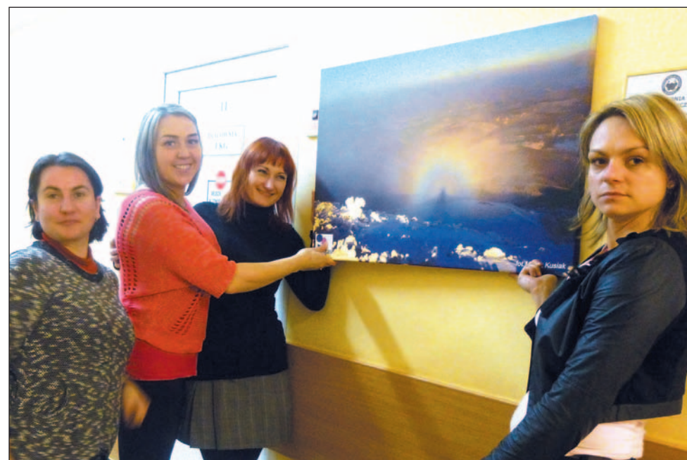
„Sanitaski” podczas wieczornej akcji dekorowania szpitalnego korytarza.

Autorkami pomysłu są wolontariuszki ze Stowarzyszenia na Rzecz Walki z Chorobami Nowotworowymi Sanitas, które – parafrazując pana prezydenta – mają pozytywne ADHD. – Jak większość naszych inicjatyw, była to spontaniczna potrzeba serca. Idąc szpitalnym korytarzem, zaraz po tym, jak udekorowałyśmy nową poradnię gineko-