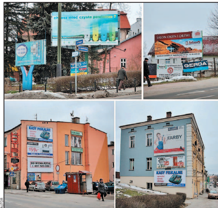
Te reklamy od 4 lat nie powinny istnieć!!!