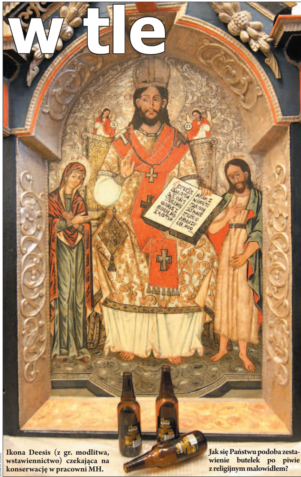
Ikona Deesis (z gr. modlitwa, wstawienie) czekająca na konserwację w pracowni MH.