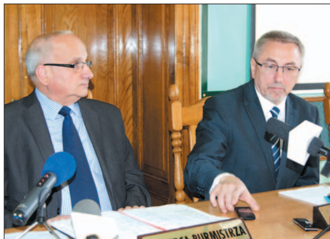
Zamiast koncentrować się na bieżących sprawach, wóldarze muszą wyjaśniać przeszłe sprawy, włokące się po poprzednikach.

wbiła go w fotel. Władza wdrażająca ma wątpliwości dotyczące działań firmy Euro Grant przygotowującej projekt,