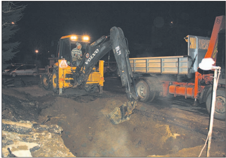
Na rurach – nie dość, że bardzo głęboko wkopanych – położono asfalt, robiąc w tym miejscu parking. Aby się do nich dostać, trzeba było zrobić ponad 2-metrowy wykop

Lodowate kaloryfery i także woda w kranach (zwłaszcza przy kilkustopniowym mrozie na zewnątrz) z pewnością nie należą do przyjemności. Tak niemiła niespodzianka zaskoczyła w środę rano większość sanoczan. Jej przyczyną była awaria instalacji ciepłowniczej na Wójtostwie, a konkretnie stara rura w rejonie parkingu przy Jana Pawła II, w której po 30 latach zwyczajnie wypadła dziura. Zanim udało się ją zlokalizować, minęło kilkanaście godzin. W tym czasie prawie całe miasto pozbawione było energii cieplnej. Po południu przywrócono dostawy dla osiedla Słowackiego, Błonie i Śródmieścia. Znacznie dłużej musieli czekać mieszkańcy Wójtostwa, których życie wróciło do normalności dopiero po dwóch dobach.