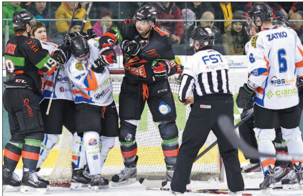
Tyszenie woleli się bić, niż grać. I dlatego przegrali.

Początek II tercji przyniósł bramkę gościom. Można o niej tylko tyle powiedzieć, że był to gol z niczego. Zrobiło