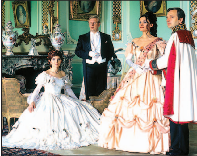
Operetka to nie tylko ucztą dla uszu, ale i oczu