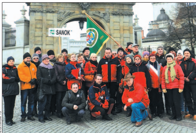
Przewodnicy na Jasnej Górze podczas pielgrzymki w 2014 roku.