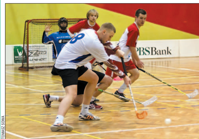
Nikt się nie oszczędza, bo play-offy coraz bliżej.

Sanocka Liga Unihokeja, XV kolejka. Walka o rozstawienie przed play-offami wkracza w decydującą fazę. Zespół InterQ zapewnił sobie przynajmniej 2. miejsce, a szanse na dwie kolejne pozycje wciąż mają: Forest, PWSZ, Sokół i Drozd Wodnik.